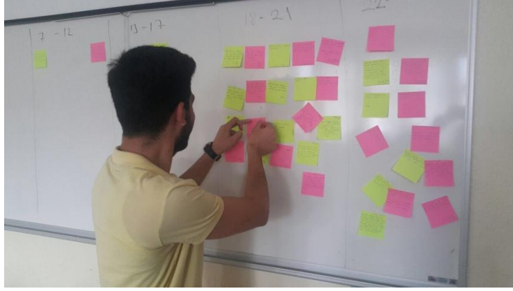
Şekil 2.1. Yazı tahtasına post-itlerin yapıştırılması

Atölye çalışmalarında elde edilen nicel verilerin normal dağılıp dağılmadığı Shapiro Wilk Testi ile kontrol edilmiş ve bütün ölçek puanlarının normal dağılmadığı görülmüştür ( p < 0.05 ). Grubun atölye çalışmaları öncesi ve sonrası ölçek puanları Wilcoxon işaret testi ile karşılaştırılmıştır.