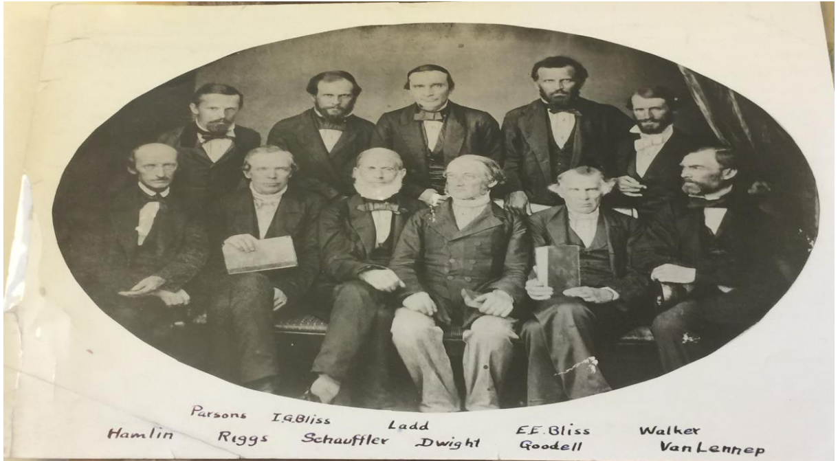
Ek 2 Osmanlı İmparatorluğundaki ABCFM Üyelerinin Bazıları