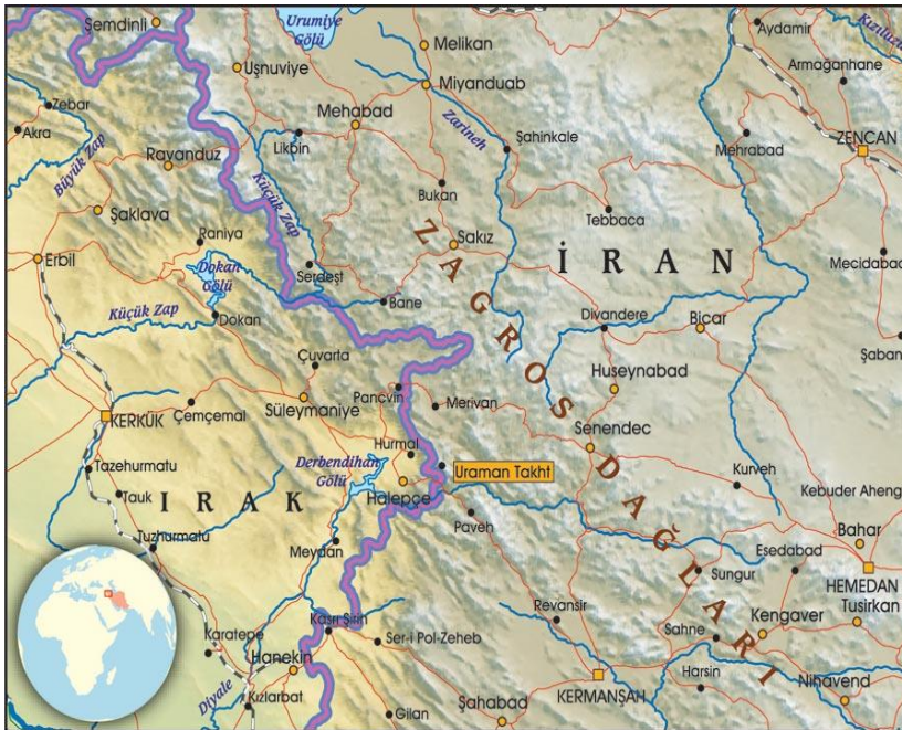
Harita 6. Zagros Dağları

Kaynak: https://www.atlasdergisi.com/kesfet/kultur/pirlerin-dugunu.html Erişim Tarihi: 23.03.2019