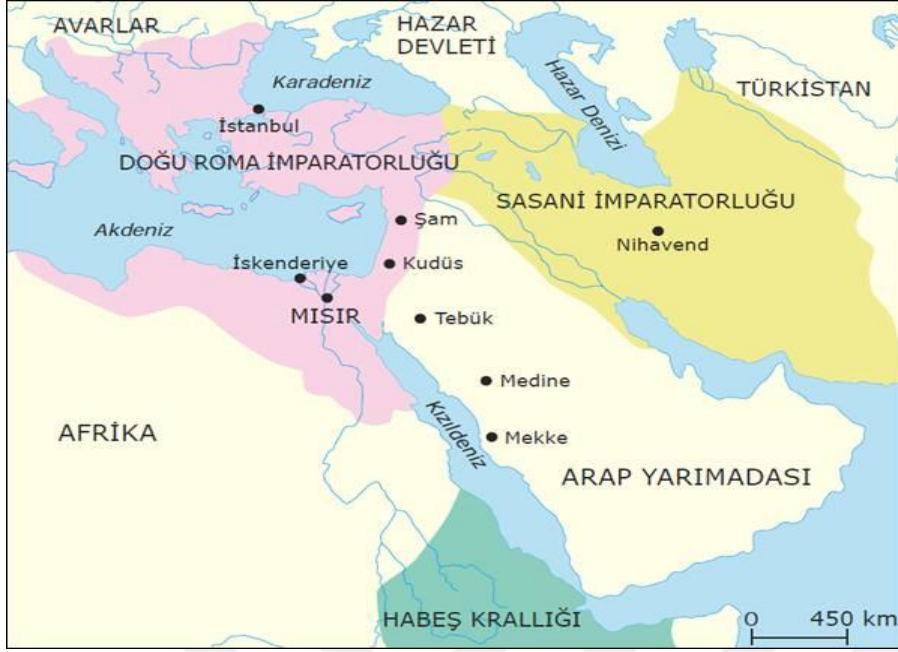
Harita 3. Sasani İmparatorluğu