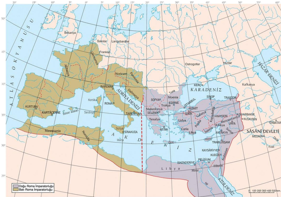
Harita 2. Roma İmparatorluğu M.S. 395