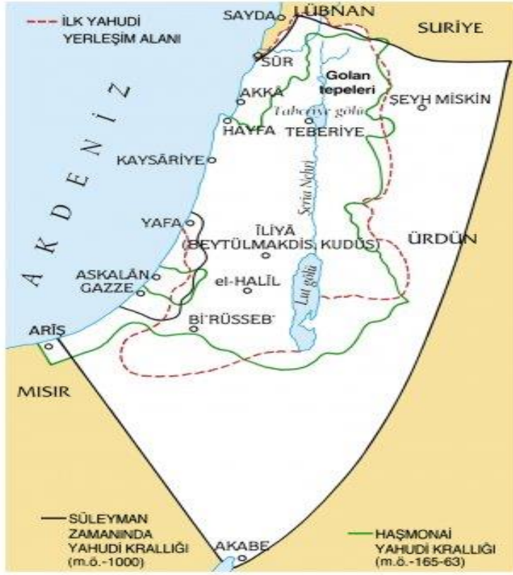
Harita 7. İlk Yahudi Yerleşim Alanı ve Yahudi Krallıkları

Kaynak: https://islamansiklopedisi.org.tr/filistin Erişim Tarihi: 23.03.2019