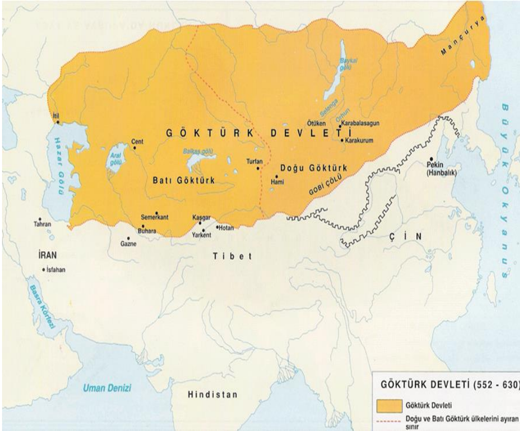
Harita 5. Göktürk Devleti