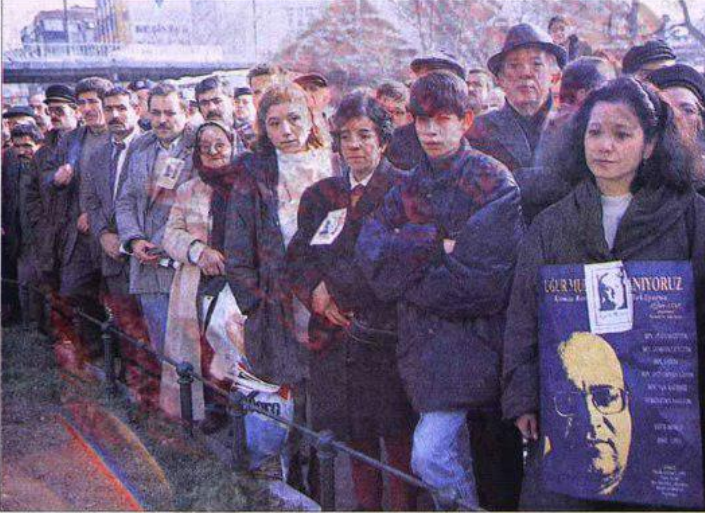
Beşiktaş Meydanı'ndaki Mumcu anıtındaki törenlere çok sayıda vatandaş katıldı. Törende Mumcu'nun cumhuriyeti savunduğu için karantik güçlerin odağı haline geldiğini kaydedildi