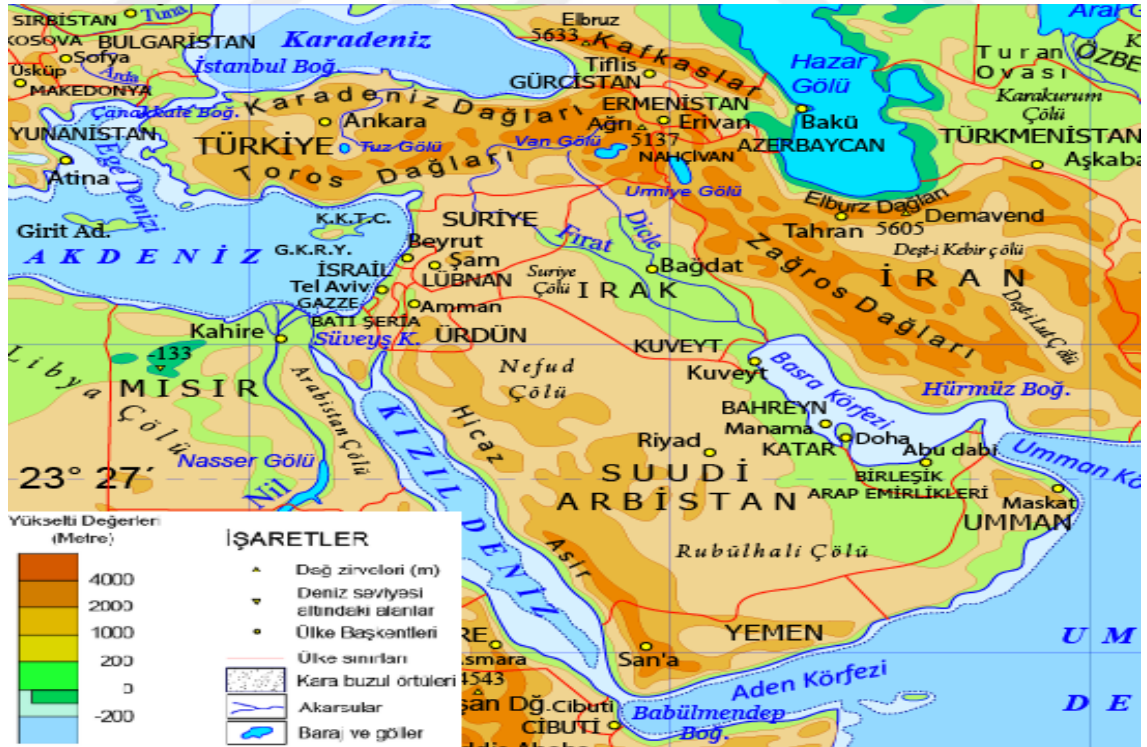
Harita 3: Ortadoğu Fiziki Haritası

Mufassal Memalik-i Osmaniye Coğrafyası kitabında yeryüzü şekilleri konusunda geniş bilgiler verilmiştir. Ancak kitaptaki bilgiler, yeryüzü şekillerini inceleyen jeomorfoloji biliminin tanımında belirttiğimiz gibi yeryüzünün doğal olarak oluşumu, değişimi ve yer şekillerinin dağılımını, nedenleri ile irdelemek tanımını kısmen karşılamaktadır. Kitapta aktarılan bilgilerin büyük çoğunluğu yeryüzü şekillerinin isimleri ve bulunduğu yerleri açıklama şeklindedir. Buradan hareketle kitaptaki Ortadoğu'nun yeryüzü şekilleri, tasviri jeomorfoloji bağlamında anlatılmıştır diyebiliriz.