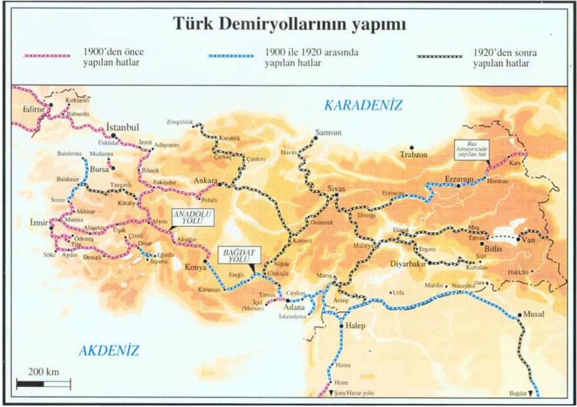
Harita 8: Osmanlı Demiryolu Ağı