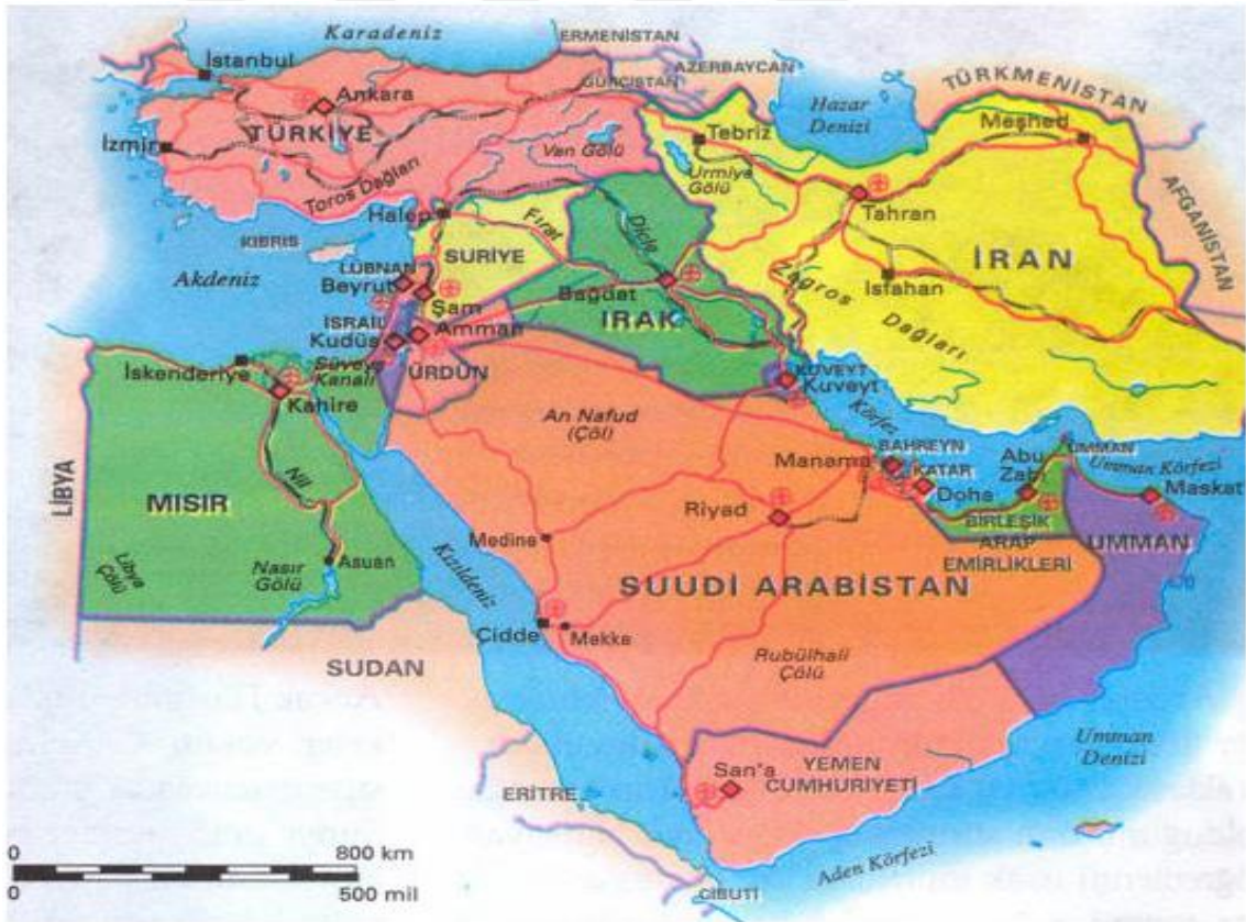
Harita 1: Ortadoğu Ülkeleri

kullanmış ve Hindistan'a ulaşan yolların güvenliği bağlamında Mahan'dan daha geniş bir coğrafyayı (İran, Irak, Basra Körfezi, Doğu Arabistan Kıyıları, Afganistan ve Tibet) işaret etmiştir (Sakin & Deveci, 2011). Dolayısıyla Ortadoğu kavramı, 20. yy. başlarında İngilizlerin, kurdukları sömürge imparatorluğunun çıkarlarına uygun olarak kavramsallaştırdığı suni bir isimlendirmedir (Özey, 2017, s. 1-15). Ortadoğu'da önemli oranda petrol yataklarının bulunması, öteden beri büyük güçlerin iştahını kabarmaktadır. Bununla beraber Süveyş kanalının açılması, önemini kaybetmiş Akdeniz'e, eski canlılığını kazandırmıştır. Süveyş Kanalı, Avrupa ile Çin ve Hindistan arasındaki suyunun kesintisiz hale gelmesini sağlayarak doğu-batı koridorunda stratejik konuma sahip Ortadoğu'yu daha da önemli hale getirmiştir. Bu sebeple bölgesel ve küresel güçler, Ortadoğu'da her neye mal olursa olsun söz sahibi olmayı stratejik ve jeopolitik hedef haline getirmişlerdir (Özey, 2017, s. 8).