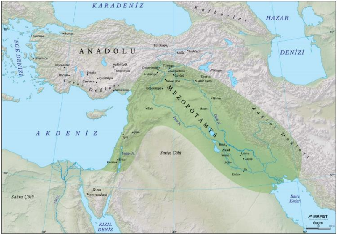
Harita 6: Bereketli Hilal

Ortadoğu bölgesini oluşturan ülkelerde ekilebilir alanlar, aslında yüzey şekilleri ve iklim yapısından dolayı kısıtlıdır. Ancak aşağıdaki haritada da görüleceği üzere Ortadoğu'nun "bereketli hilal" olarak nitelendirilen bölgeleri çok verimlidir. Bunun yanında bölge ülkeleri içerisinde orta iklime sahip Türkiye'nin tarımsal potansiyeli diğer Ortadoğu ülkeleri göre çok öndedir (Doğan Ö. S., 2008, s. 91-101).