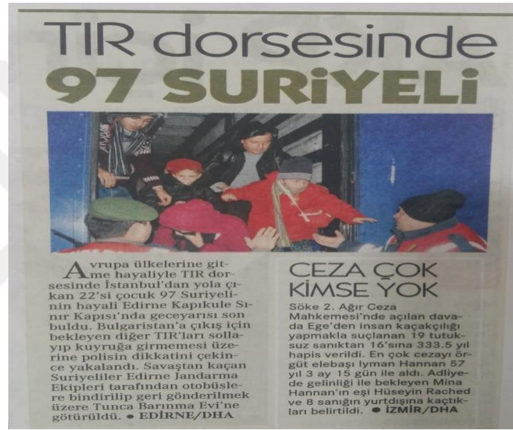
Görsel 21: 15 Şubat 2016 Cumhuriyet Gazetesi

Gazete, “Tır Dorsesinde 97 Suriyeli” başlığıyla sığınmacıların hangi araçla göç ettiklerini belirtmek için “Tır Dorsesinde” ifadesini özellikle kullanmıştır. Bilindiği üzere genellikle Suriyeli sığınmacılar deniz yoluyla botlarla başka ülkelere geçmektedirler.