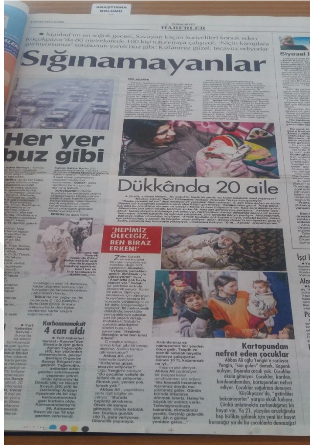
Görsel 18: 9 Ocak 2015 Cumhuriyet Gazetesi

Bu haber metninde gazete muhabirinin Eminönü'nün bir semtine giderek oradaki Suriyelilerle yaptığı röportajlara yer verilmiştir. Haberin tam sayfa verilmesi konuya verilen önemi daha net bir şekilde göstermektedir.