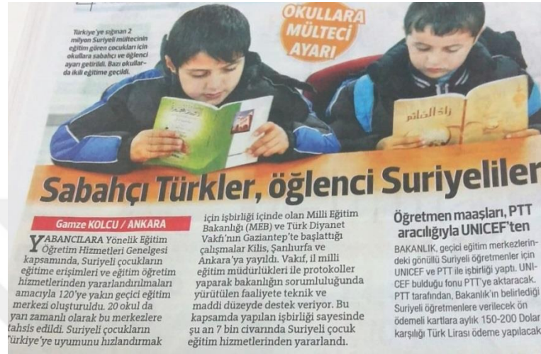
Görsel 1: 4 Ocak 2015 Hürriyet Gazetesi

Hürriyet Gazetesi bu haberi “Okullara mülteci ayarı” başlığıyla vermiştir. “Sabahçı Türkler, öğlenci Suriyeliler” ifadesiyle çocukları milliyetlerine göre ayırmış, “Türkler ve Suriyeliler” şeklinde kısaltarak adlaştırma yapılmıştır. Çocuk öznesi bu adlaştırma altında gizlenmiştir.