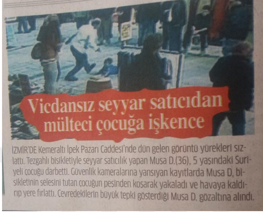
Görsel 15: 11 Mart 2016 Star Gazetesi

Haberin başlığında yer alan; “ Vicdansız seyyar satıcıdan mülteci çocuğa işkence ” cümlesiyle Suriyeli sığınmacı çocuğun yaşadığı mağduriyet dramatik bir şekilde verilmiştir.