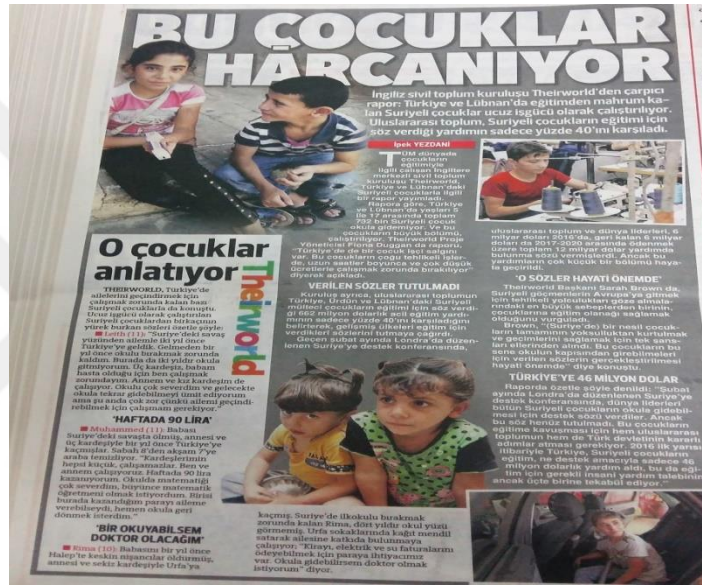
Görsel 9: 28 Eylül 2016 Hürriyet Gazetesi

Gazetenin başlığında yayımlanan “ Bu çocuklar harcanyor ” cümlesinde kapalı anlatım yapılarak çalışan Suriyeli sığınmacı çocuklar kastedilmiştir.