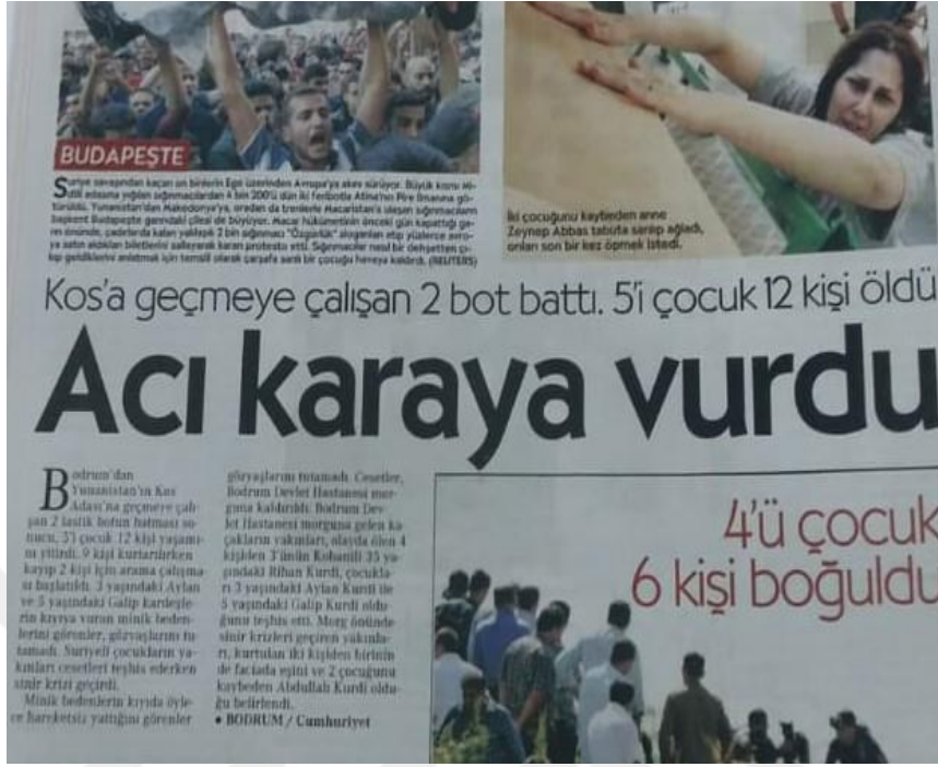
Görsel 19: 3 Eylül 2015 Cumhuriyet Gazetesi

Cumhuriyet Gazetesi Bodrum'da yaşanan bot kazasını “ Kos'a geçmeye çalışan 2 bot battı. 5'i çocuk 12 kişi öldü. Acı karaya vurdu ” başlığıyla vermiştir. Acı karaya vurdu ” başlığı bold (kalın) şeklinde yazılarak yaşanan kazanın ne kadar üzücü olduğu vurgulanmıştır. Haberde bot kazasında 12 kişinin hayatını kaybettiği, ölenler arasında beşinin çocuk olduğu ön plana çıkarılmıştır. Ölen çocukların yakınlarının sinir krizi geçirdiği belirtilerek olayın trajik yönü vurgulanmıştır.