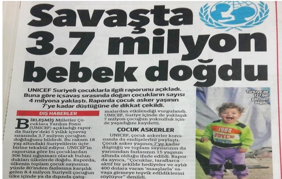
Görsel 7: 15 Mart 2016 Hürriyet Gazetesi