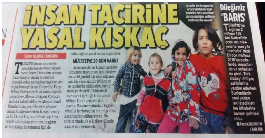
Görsel 5: 2 Ocak 2016 Hürriyet Gazetesi

Hürriyet Gazetesi, bu haber metninde sığınmacıların mağdur olduğu konulardan biri olan insan tacirliğiyle ilgili Türkiye’de yapılan yasaya değinmiştir.