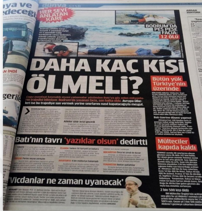
Görsel 12: Star Gazetesi 3 Eylül 2015

Star Gazetesi bu haberi “Daha Kaç Kişi Ölmeli” başlığıyla vermiştir. Atılan bu başlıkla tek bir cümleyle yaşanan faciyanın vahameti anlatılmaya çalışılmıştır.