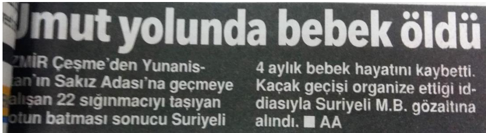
Görsel 8: 20 Mart 2016 Hürriyet Gazetesi

“ Umut yolunda bebek öldü ” cümlesinde “ umut yolu ” tabiriyle sığınmacıların savaş dolayısıyla başka ülkelere daha iyi şartlarda yaşam sürdürmeleri için deniz yoluyla göç etmeleri anlatılmak istenmiştir. Bu göç sürecinin mağdurunun da bir bebek olduğu belirtilmiştir.