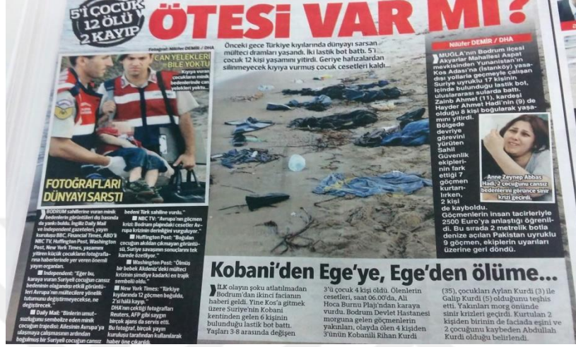
Görsel 2: 3 Eylül 2015 Hürriyet Gazetesi

Hürriyet Gazetesi bu haberi “Ötesi var mı?” başlığıyla yayınlamak sığınmacıların yaşadıkları acıya dikkat çekmeye çalışmıştır. Haberin spotunda ise yaşanan olayla ilgili “mülteci dramı” diye bahsederek yaşanan acının dramatik yönüne vurgu yapmıştır.