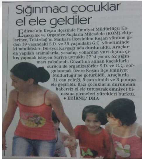
Görsel 16: 5 Eylül 2015 Cumhuriyet Gazetesi

Gazete bu haberi “ Sığınmacı Çocuklar Elele geldi ” başlığıyla vermiştir. Elele kelimesiyle çocuklar arasındaki desteğe vurgu yapılmak istenmiştir. Haber metninin içeriğinde ise Edirne’den yurtdışına gitmek isteyen 62 sığınmacıdan bahsedilmiş. 62 sığınmacının 27’sinin çocuk olduğu belirtilmiş. Gazete sığınmacıların yurtdışına çıkışını ifade ederken, “ yasadışı yollar ” diye belirterek sığınmacıların gayri resmi yollarla geldiklerini vurgulamıştır.