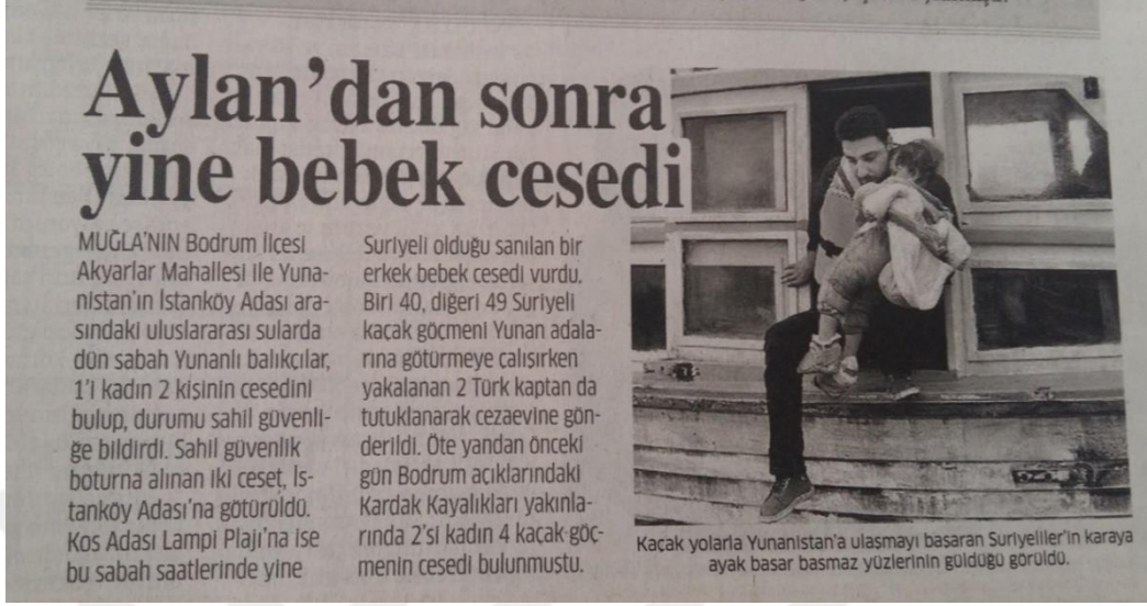
Görsel 14: 5 Ekim 2015 Star Gazetesi

Haber metninin başlığı yine Eylül ayında yaşanan bot kazasına atıf yapılarak, “ Aylan'dan sonra yine bebek cesedi ” şeklinde verilmiştir. Bilindiği üzere Aylan bebeğin kıyıya vuran cesedi tüm Türkiye’yi sarsmış ve dünya gündemine oturmuştu. Bu haberde de yine uluslararası sularda bir Suriyeli erkek bebek cesedinin bulunduğu belirtilerek Aylan bebeğe atıf yapılmıştır.