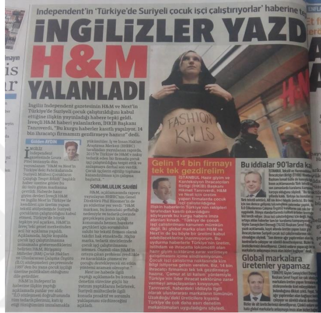
Görsel 6: 2 Şubat 2016 Hürriyet Gazetesi

“Independent’in Türkiye’de Suriyeli çocuk işçi çalıştırıyorlar haberine tepki İngilizler Yazdı H&M Yalanladı” başlığıyla atılan haberde Türkiye’de çocuk işçi çalıştırılmadığı bu ifadelerle vurgulanmak istenmiştir. “İngilizler” kelimesiyle İngiliz halkı algısı oluşturan bir anlamın çıktığını söyleyebiliriz. Sanki bu iddianın sahibi İngiltere yayın kuruluşu değil de İngilizlerin geneline yönelik bir suçlayıcı algı oluşturulmak istenmiştir.