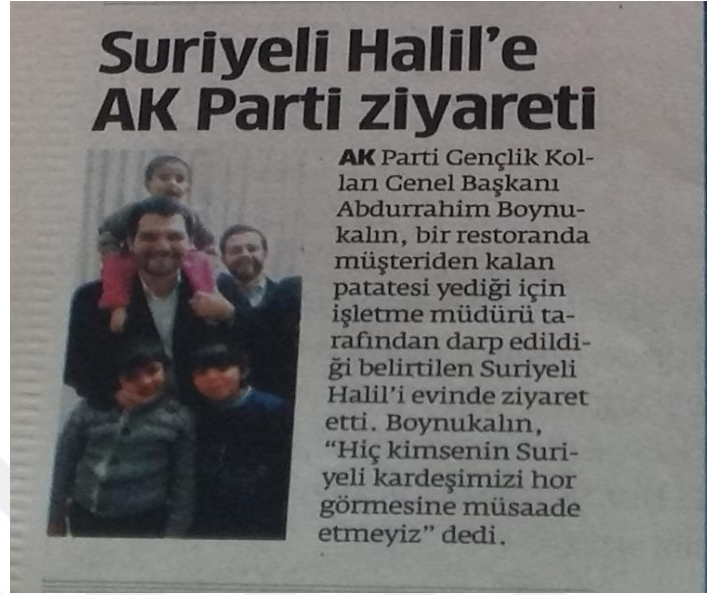
Görsel 11: 25 Ocak 2015 Star Gazetesi