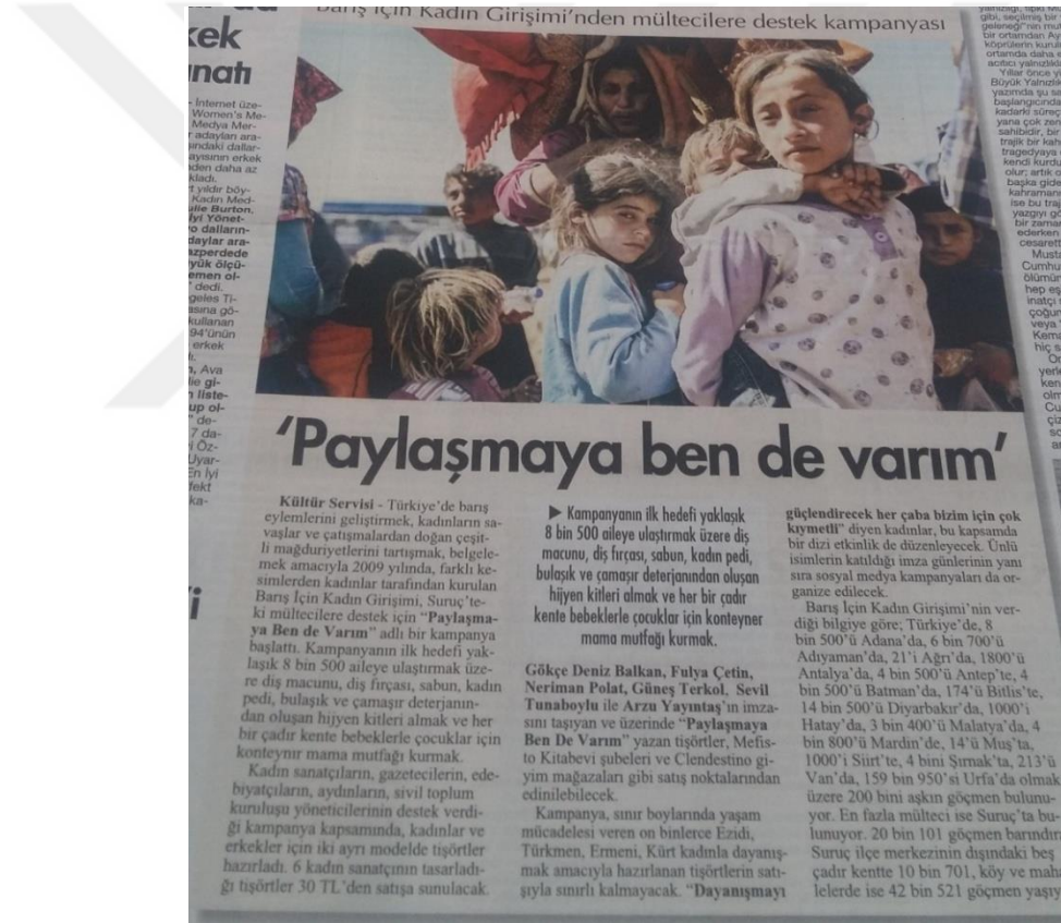
Görsel 17: 19 Ocak 2015 Cumhuriyet Gazetesi

Haber metni Barış İçin Kadın Derneği'nin Suruç'taki Suriyeli sığınmacılarla ilgili başlattıkları yardım kampanyası hakkında bilgiyi kapsamaktadır. “Paylaşmaya ben de varım” başlığıyla kişileri bu kampanyaya ortak etme amacı güdülmüştür.