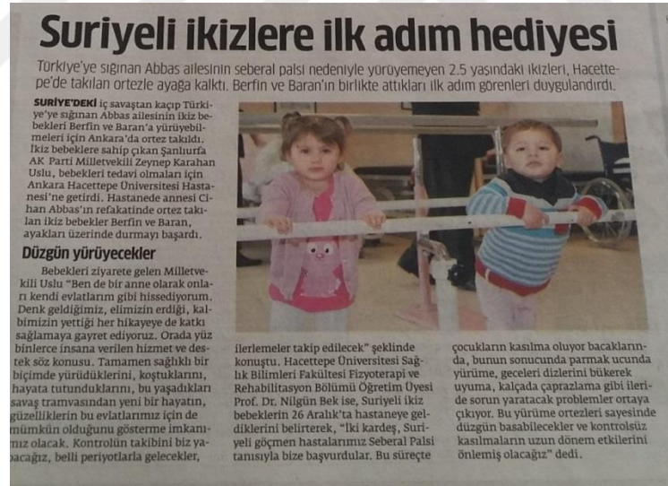
Görsel 10: 23 Ocak 2015 Star Gazetesi

“Suriyeli ikizlere ilk yardım hediyesi” başlığıyla yardımlaşma ve dayanışma örneğinin yaşandığı bir haber aktarılmıştır.