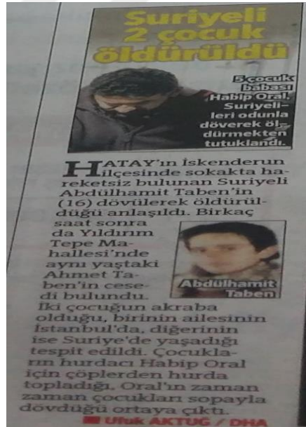
Görsel 4: 21 Kasım 2015 Hürriyet Gazetesi

Haberdeki başlıkta Suriyeli iki sığınmacı çocuğun öldürüldüğü ifadesi kullanılarak yaşanan olayın dramatik yönüne vurgu yapılmıştır. Gazete çocukların ölüm