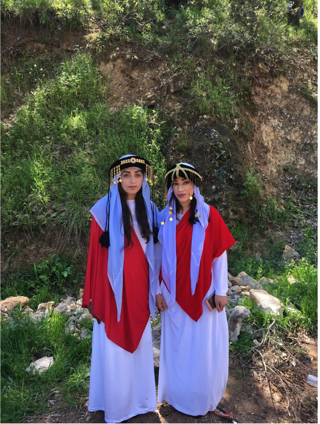
Şekil 14 Ezidi kadınları ve giyimleri. Laleş