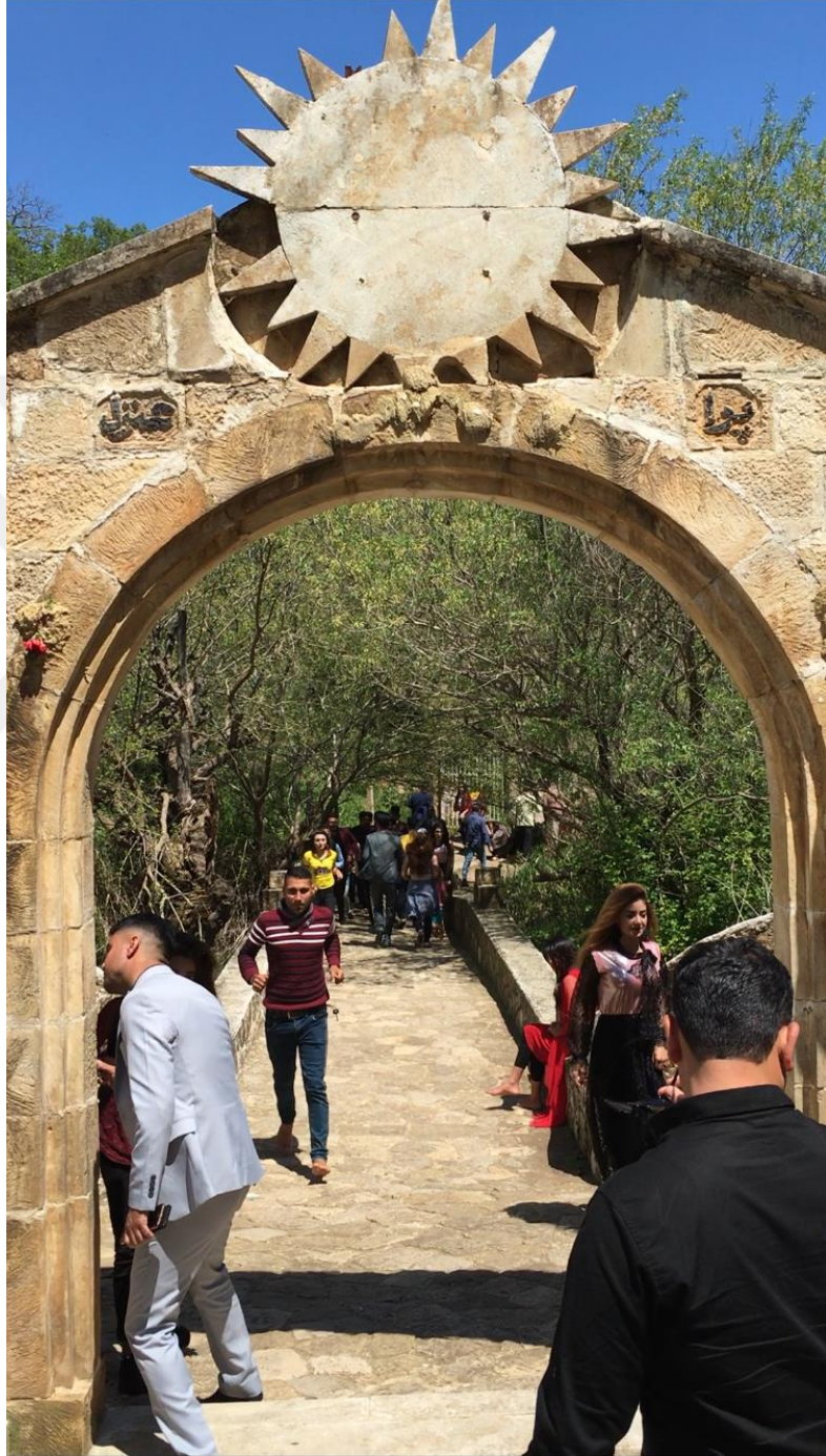
Şekil 10 Güneş figürü. Laleş