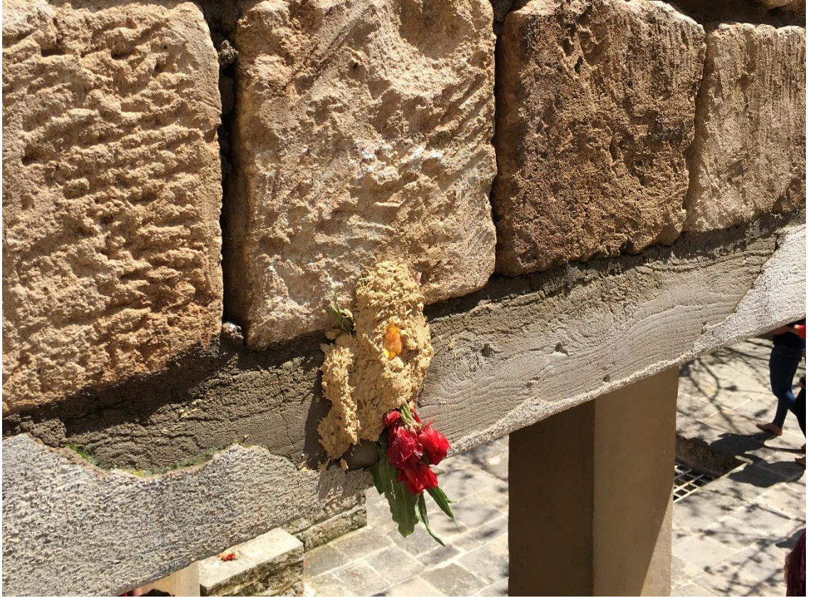
Şekil 2 Yeniden doğuşu temsil eden çiçek. Laleş