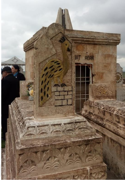
Şekil 16 Ezidi Mezarları. Yeni Güven Köyü/Midyat/Mardin