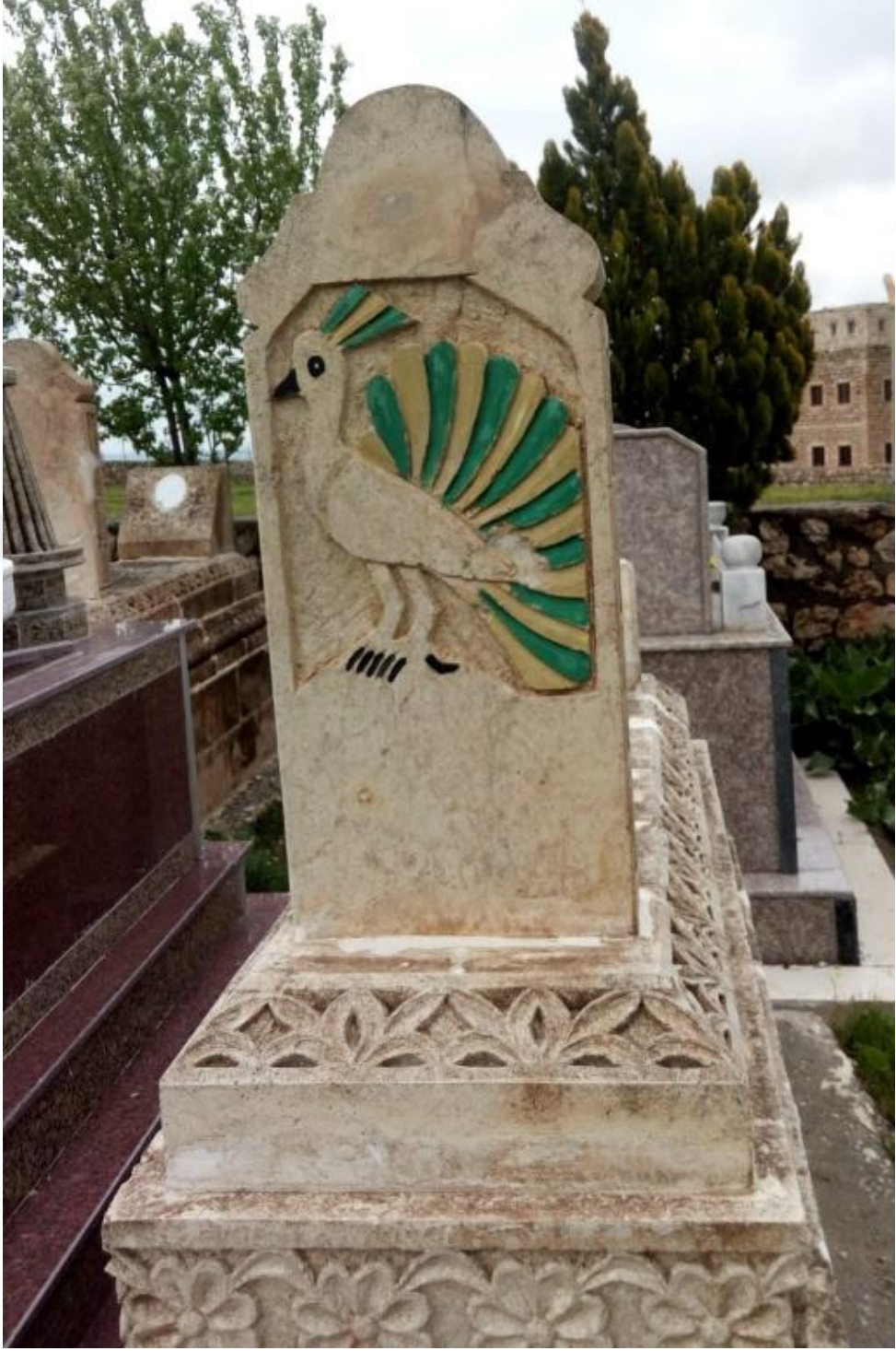
Şekil 15 Ezidi Mezarları ve Melek Tavus figürü. Yeni Güven Köyü/Midyat/Mardin