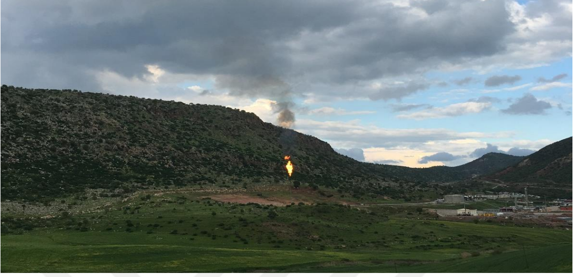
Şekil 1 Laleş vadisinde sürekli yanan ateş.