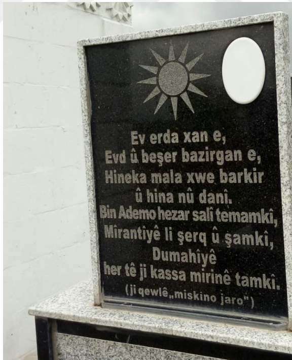
Şekil 17 Ezidi Mezar taşı ve Güneş figürü. Yeni Güven Köyü/Midyat/Mardin