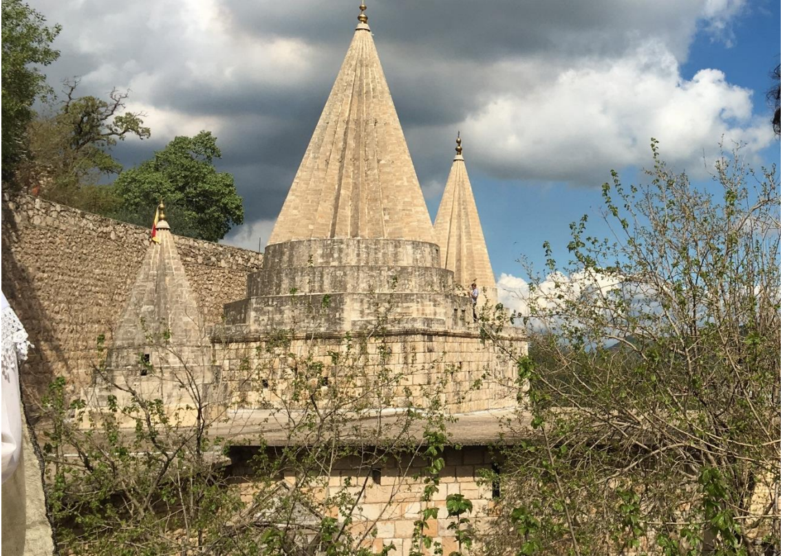
Şekil 4 Laleş