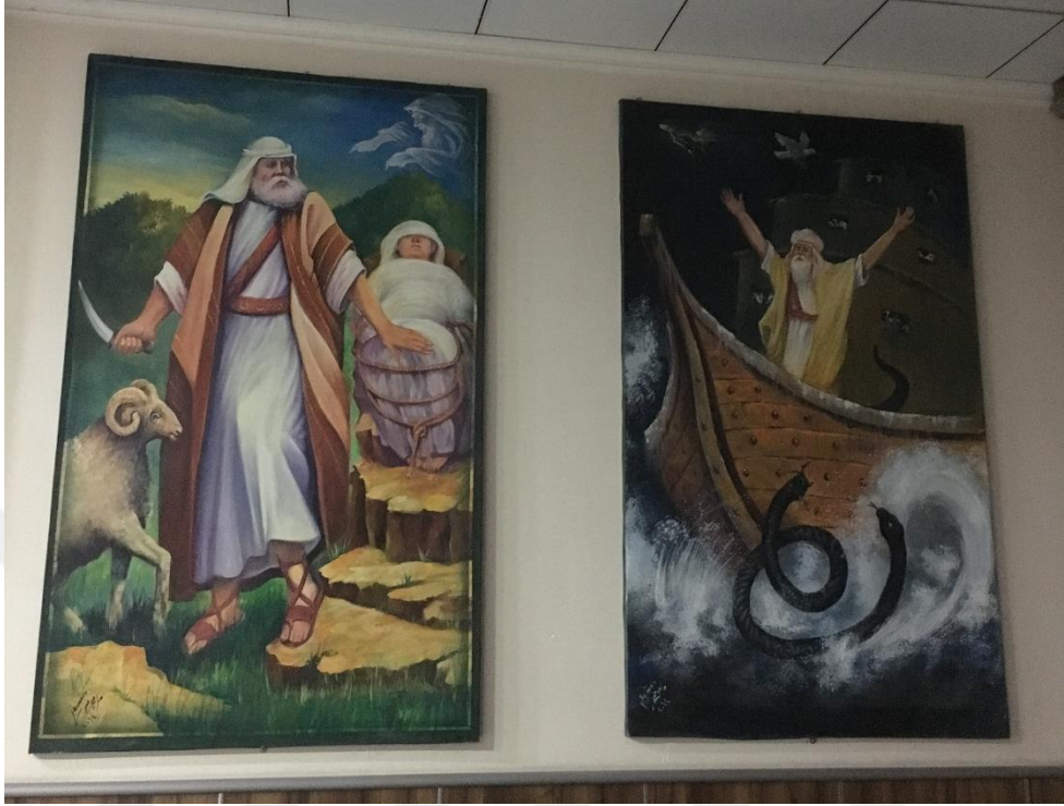
Şekil 8 Yılan figürü. Duhok Ezidi Kültür Merkezi