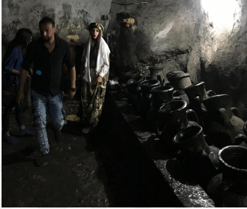
Şekil 5 Şeyh Adi'nin mezarına giden zift ile kaplı koridor. Laleş