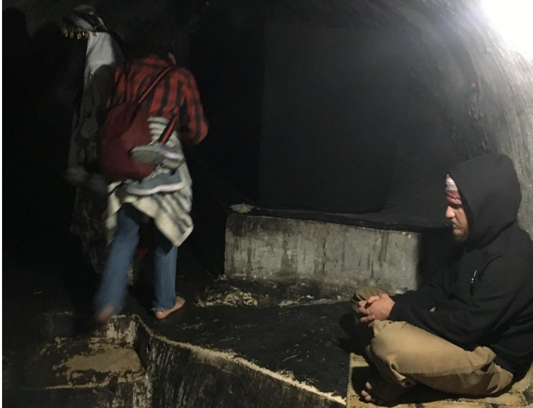
Şekil 6 Şeyh Adi'nin Mezarı. Laleş