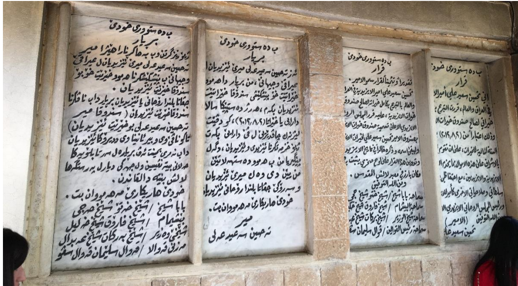
Şekil 21 Dini liderlerin hayatı hakkında bilgiler veren yazılar. Lales