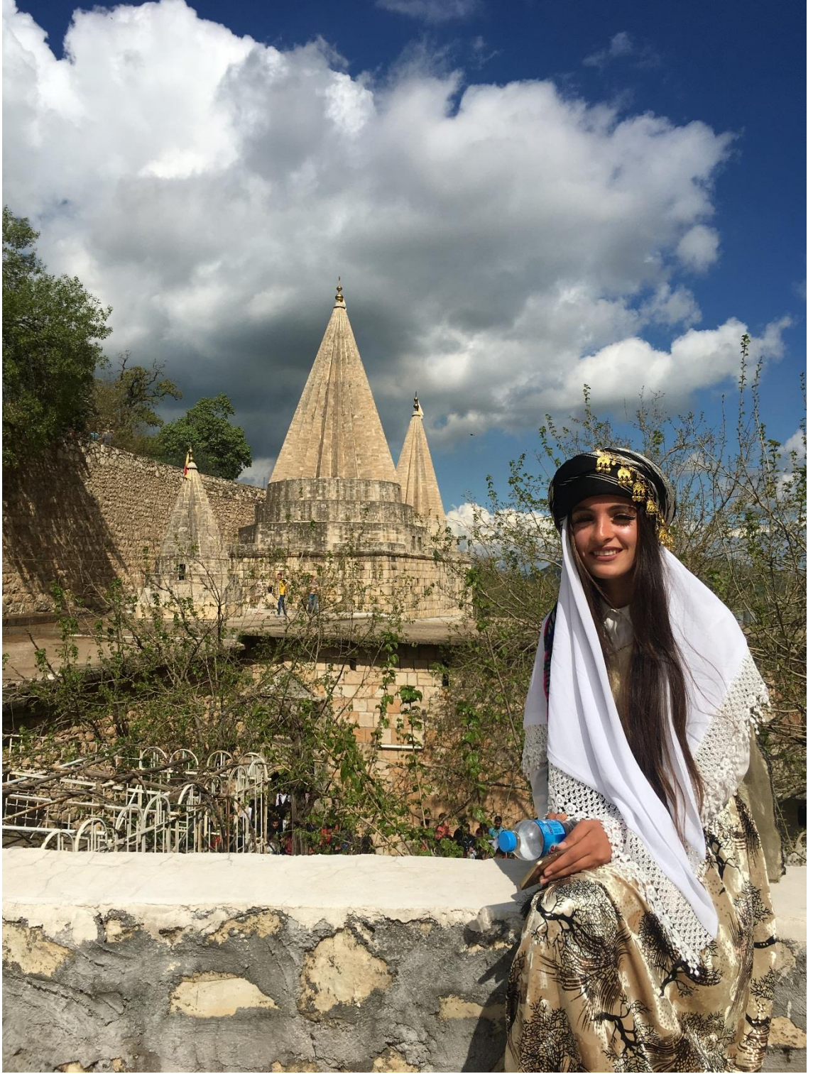
Şekil 13 Ezidi kadını. Laleş