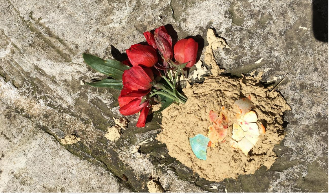
Şekil 3 Yeniden doğuşu temsil eden çiçek. Laleş