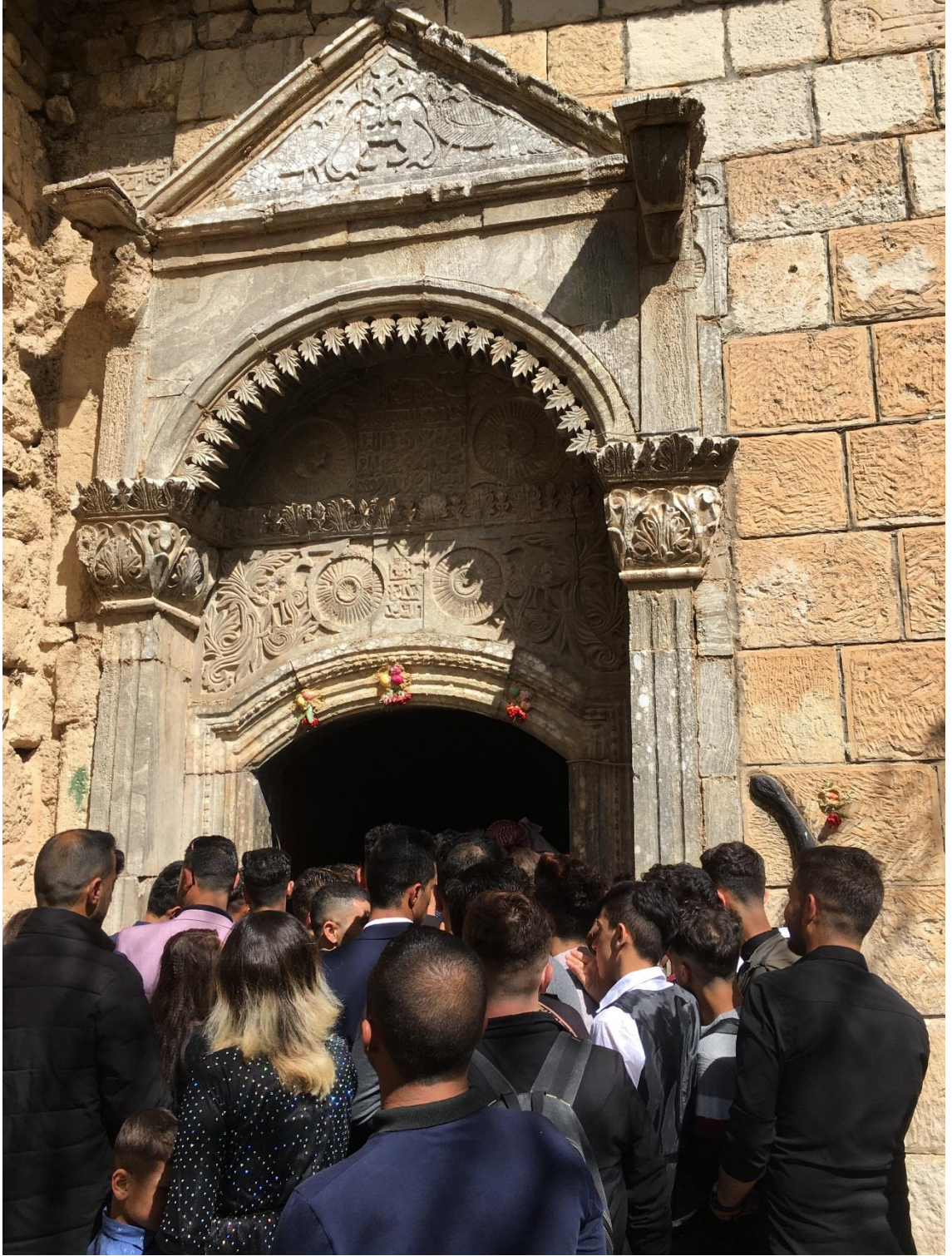
Şekil 7 Şeyh Adı'nın mezarının bulunduğu yapının girişi ve kapının sağındaki siyah yılan motifi. Laleş