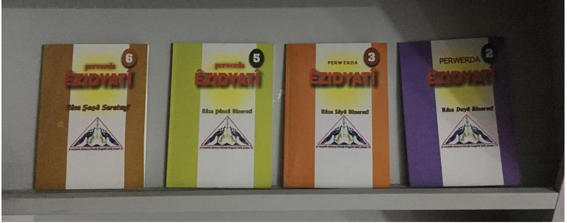
Şekil 18 Çocuklar için hazırlanmış dini kitaplar. Duhok Ezidi Kültür Merkezi