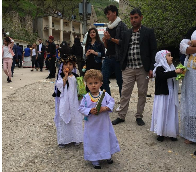
Şekil 12 Ezidi çocukları ve giyimleri. Laleş