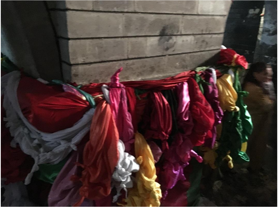
Şekil 19 Dilek tutulup düğüm atılan bezler. Laleş