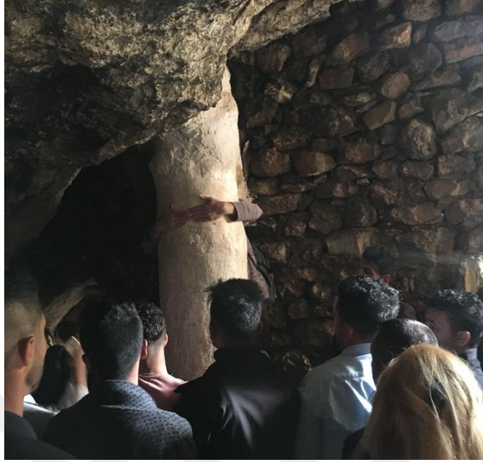
Şekil 20 Dilek tutulup iki elin birleştirilmeye çalışıldığı sütun. Lales