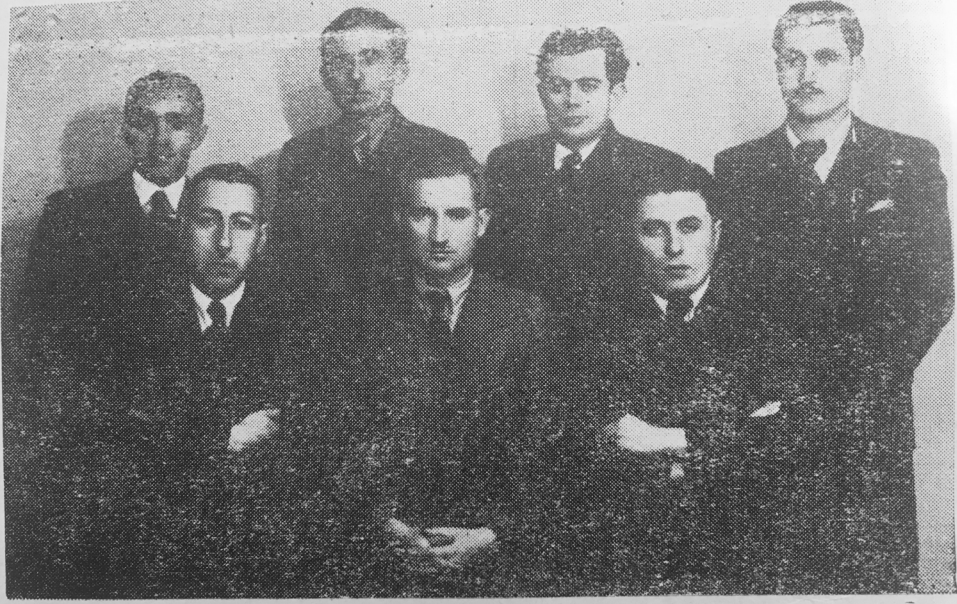
Dergimizin tahrir heyeti