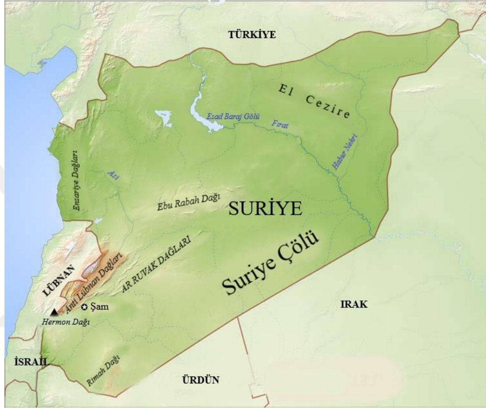
Harita 1: Suriye Fiziki Haritası

Birinci ve İkinci Dünya Savaşlarında Avrupa’da kültürel miras alanlarında tahribat yaşanmıştır. Avrupa’daki şehirler savaş sonrasında yeniden yapılanmıştır. Ancak Suriye’de yapılan tahribat iç savaş olmasıyla nedeniyle farklı bir özelliğe sahiptir. Bu bakımından Birinci ve İkinci Dünya Savaşlarından farklıdır.