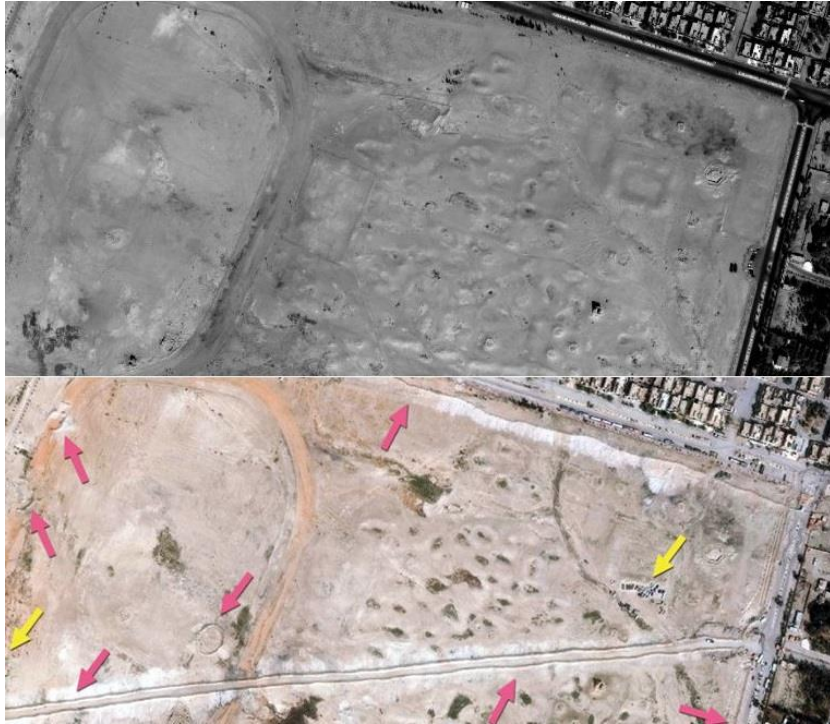
Fotoğraf 13: Ekim 2009 Ekim 2014 tarihleri arasında Palmira Arkeolojik Parkın Tahribatı