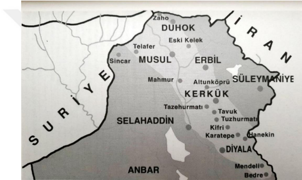
Harita 1: Irak Türkmenleri

Osmanlı dönemine kadar sürekli Türk göçleri ile beslenen Irak Türkleri, Araplardan ve Kürtlerden sonra üçüncü büyük gurubu oluşturmaktadırlar. Türkmenler Zaho’dan Bedre’ye kadar uzanan çizgide değişik yerlerde yaşamakla birlikte, bir zamanlar Kerkük şehri tamamen Türklerden oluşmaktaydı. 32