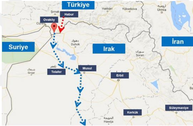
Harita 62: Ovaköy Sınır Kapısı

Gelecekte açılması planlanan Ovaköy sınır kapısı planlanan sınır kapıları içerisinde en işlevsel ve önemlisi olacaktır. Açılması planlan bu sınır kapısını Habur sınır kapısının önüne geçirebilecek en önemli avantajı Ovaköy üzerinden kısa bir süre içerisinde Telafer ve Musul'a ulaşılabilmesidir. Buda IKYB yönetimini devre dışı bırakarak doğrudan Bağdat ile ilişki kurmaktır.