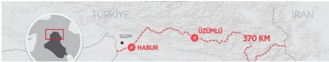
Harita 4: Türkiye-İrak Sınır

Türkiye ise Irak'a deyim yerinde ise tek sınır kapısından açılmaktadır. Şırnak ilinin Silopi ilçesinde bulunan Habur sınır kapısı yılda ortalama 4.000.000 yolcu ve 1.400.000'i TIR olmak üzere toplam 2.000.000 araca, hizmet vermektedir. "Habur Sınır Kapısı'nda 12 adet giriş – 12 adet çıkış olmak üzere toplam 24 adet peron, 2 adet X-Ray tarama cihazı, 3.500 m 2 'lik ticari bina ve 6.000 m 2 'lik idari bina bulunmaktadır. Ayrıca PTT (Posta ve Telgraf Teşkilatı), yiyecek – içecek alanları, gümrüksüz satış mağazası (duty free) bulunmaktadır ve Kapalı devre görüntüleme sistemleri, kartlı geçiş ve otomasyon sistemleri ile 320.000 m 2 alanda hizmet vermektedir." 227 Irak ile ticaretin ana damarını oluşturan Habur – İbrahim Halil (Irak topraklarındaki Türkiye'ye açılan kapının ismidir.) sınır kapıları en çok yoğunluğun yaşandığı sınır kapıları olarak bilinmektedir. Habur sınır kapısının önemi ise bu çalışma kapsamında yer verilemeyecek kadar çoktur.