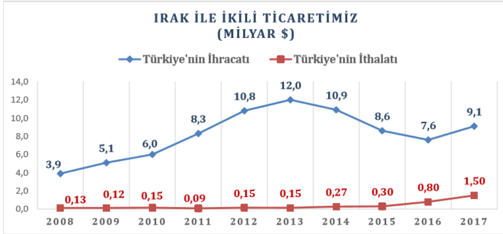
Şekil 2: Türkiye-Irak İkili Ticareti