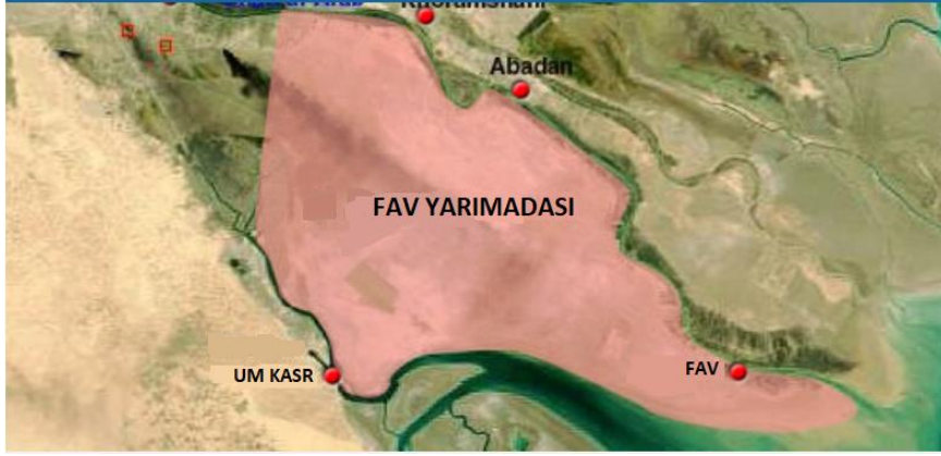
Şekil 3: Fav Yarımadası