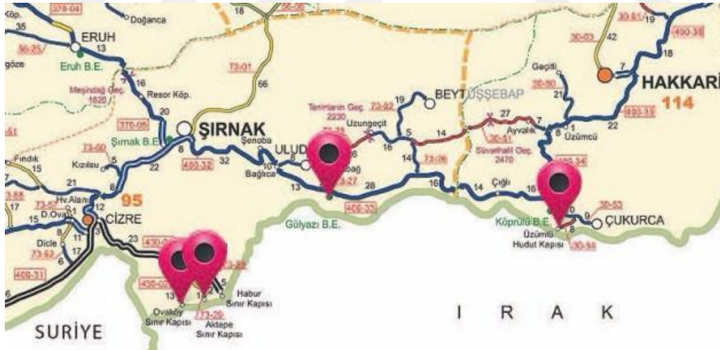
Harita 5: Açılması Planlanan Yeni Sınır Kapıları

Türkiye, Irak'a büyük çapta geçişlerin yapılabildiği tek sınır kapısı olmasından kaynaklanan olumsuzlukların farkındadır ve bu sorunları çözmek için hamlelerde bulunmaktadır. Bu olumsuzların çözmenin ilk amacı sınır kapılarının sayılarının artırılması gelmektedir. Bu çerçevede 25.01.2013 tarihinde Derecik, Üzümlü gümrük müdürlükleri, Doğu Anadolu Gümrük ve Ticaret Bölge Müdürlüğü'ne; Aktepe ve Gülyazı gümrük müdürlükleri, İpekyolu Gümrük ve Ticaret Bölge Müdürlüğü'ne bağlı olarak kurulmuştur. 230 Ancak güvenlik başta olmak üzere çeşitli sebepler yüzünden Derecik, Aktepe ve Gülyazı gümrük müdürlükleri ile sınır kapıları faaliyete geçememiştir.