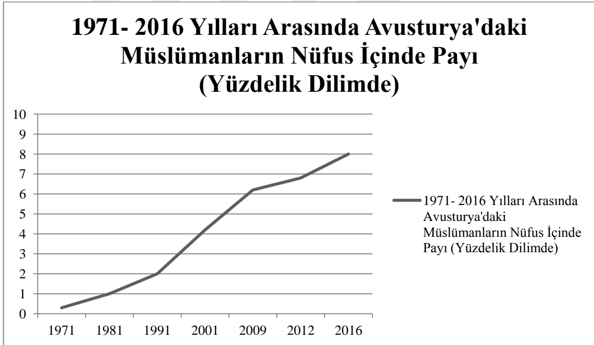
Tablo 2: 1971- 2016 Yılları Arasında Avusturya'daki Müslümanların Nüfus İçinde Payı

Avusturya'nın nüfusu 2019 yılının başında 8.9 milyondur. Nüfus bir önceki yıla göre 0,4 oranında artmıştır. 231 İlk üç sırada Alman, Sırp ve Türklerin oluşturduğu yabancı nüfus (Avusturya'da ikamet eden ancak Avusturya vatandaşlığına sahip olmayan) %16,2 oranı ile Ocak 2019 itibarıyla 1.4 milyonu aşmıştır. 2018 yılında 146.859 kişi Avusturya'ya göç etmiştir. 2018'de Avusturya'ya 3300'ü Suriye'den olmak üzere toplam 13750 iltica başvurusu yapılmıştır. 232 Avusturyalıların yaklaşık %66'sı Katolik, %6'sı Müslüman, %4'e yakını Protestan ve %10'a yakını hiçbir dine mensup değildir. 233