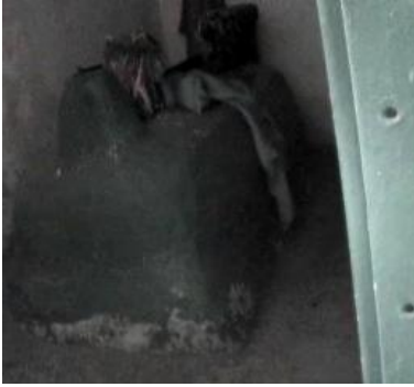
Şih İbrahim Ettir Bey