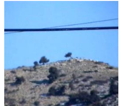
Kömürcü Dede Tepesi