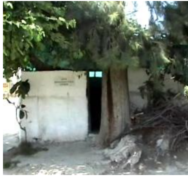
Şeyh Muhammed-il Kasıd