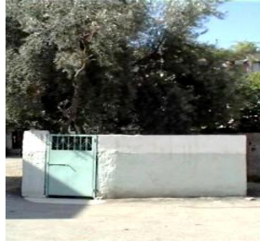
Şeyh Nasiril Hakiym