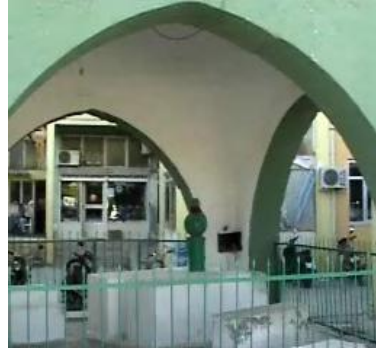
Tevekkül Sultan Türbesi