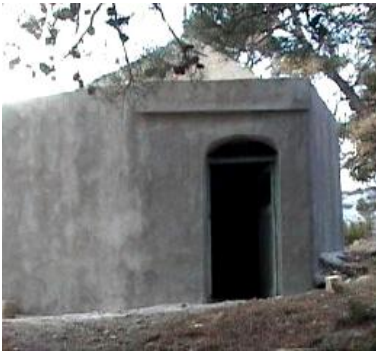
Şih Mehmet Türbesi