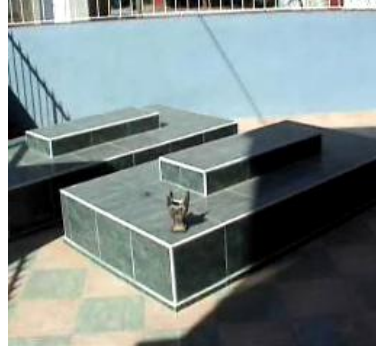
Şih Dahir ve Şih Behlül