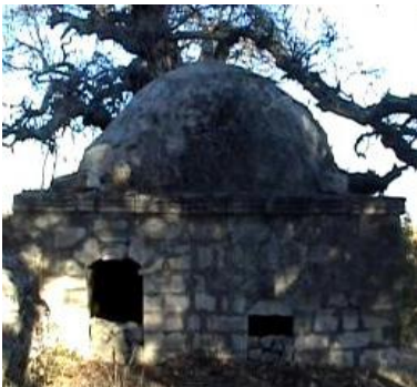
Bozca Şih Türbesi