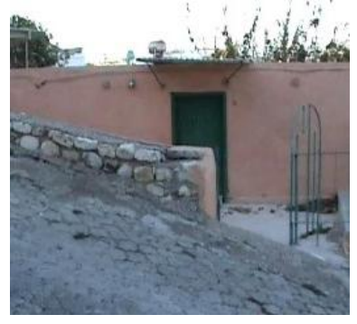
Mukaddem Dede Türbesi