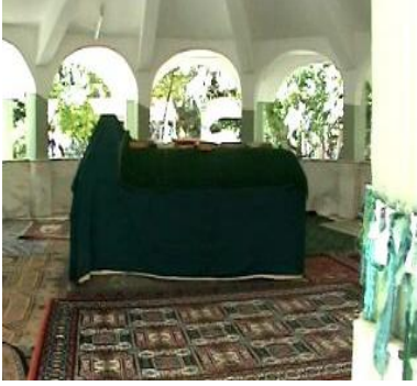
Şeyh Muğdat Türbesi