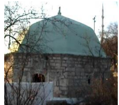
Şeyh Ömer Türbesi