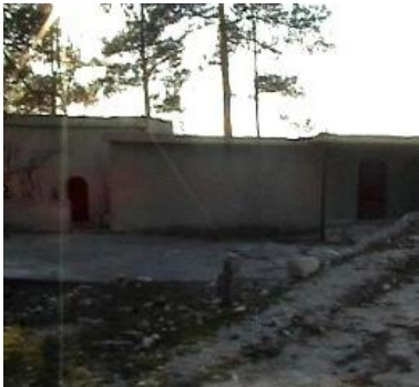
Ali Baba Türbesi