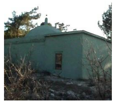
Şeyh Ese Türbesi