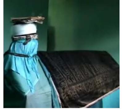
Yalman Dede Türbesi