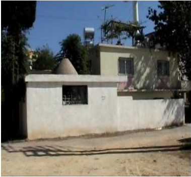
Seydine Hıdır'ın Teşrifesi