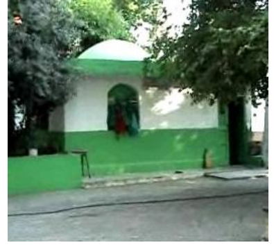
Hıdır Aleyhisselam Türbesi (II) Danyal Aleyhisselam'ın mezarı Şeyh Vasıl Türbesi