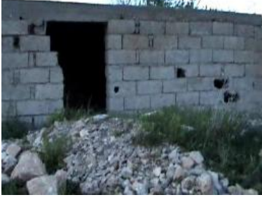
Cuma Dede Türbesi