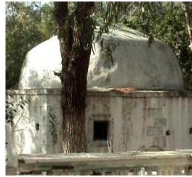
Şeyh Hacı Bahaddil Türbesi