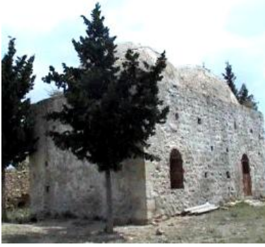
Garip Baba Türbesi