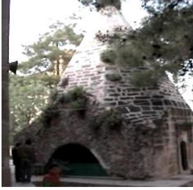
Türbeler (Doğudaki Türbe)