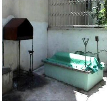
Şeyh Ahmet Migrubi