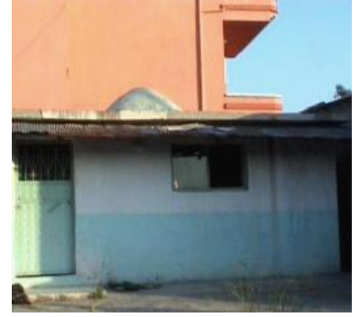
Yunus Peygamber Türbesi