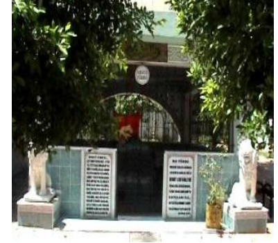
Nebi Eyüp Türbesi