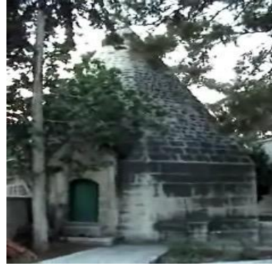
Türbeler (Güneydeki Türbe)