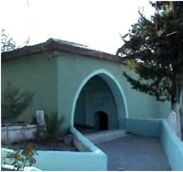
Şeyh Ali Semerkandî Türbesi