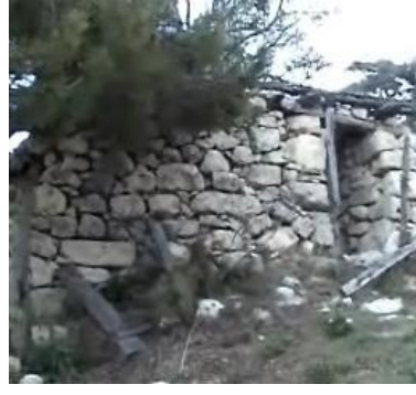
Tetiş Dede Türbesi