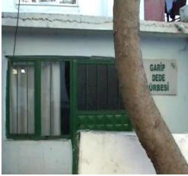
Garip Dede Türbesi