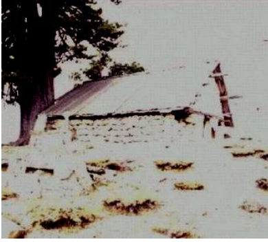
Nure Sofi Türbesi