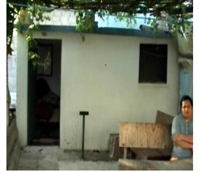
Seydil Hıdır Türbesi