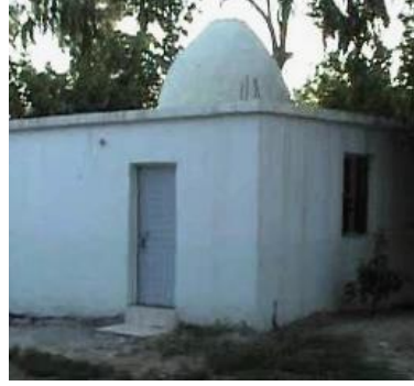
Asker Elbiseli Türbesi