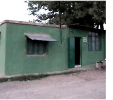
Arap Baba Türbesi