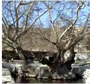
Şeyh Ali Pınarı ve Çınar Ağacı