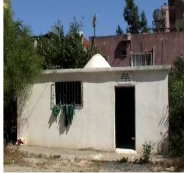
Bedril Gafir Türbesi