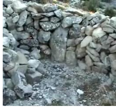
Üç Yatır (Köyün merkezindeki yatır) Şeyh Bedrettin