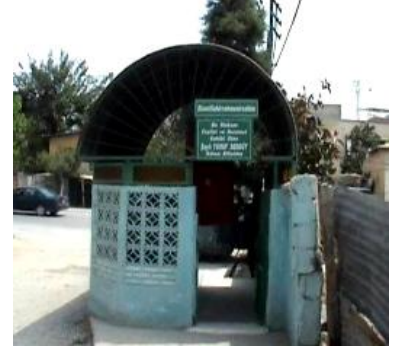
Şeyh Yüsif Şeddüt Türbesi