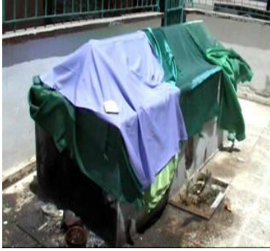
Şih Yusuf Riddat