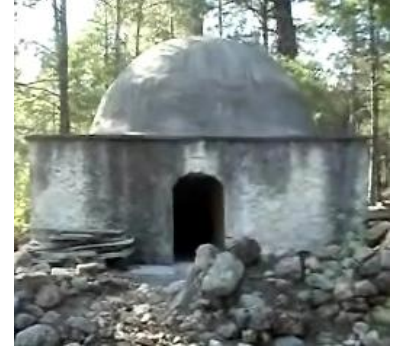
Doğrul Seydi Türbesi