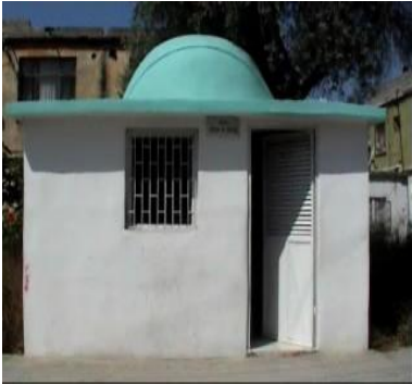
Şeyh Hasan ve Musa Türbesi