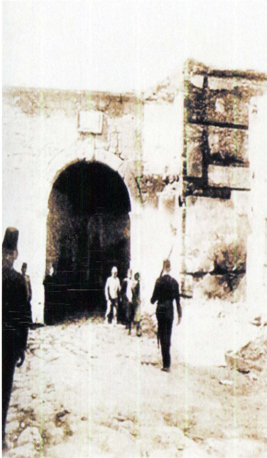
FOTOĐRAF-1: OLAYLARIN BAŐLADIĐI LİMAN KAPISI 1898