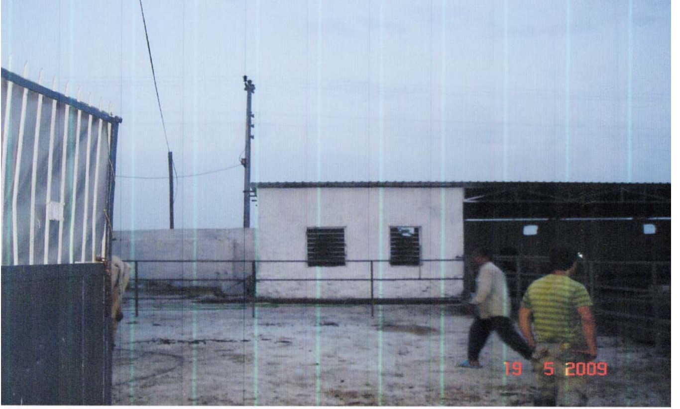
FOTOĞRAF-5: PİRİCE KÖYÜ'NDE GÖÇMENLERE VERİLEN EVLERDEN BİRİ. ŞU ANDA BİR ÇİFTLİK İÇERİSİNDE DEPO OLARAK KULLANILIYOR.