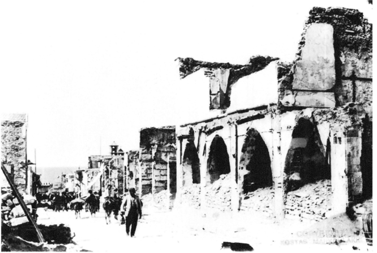
FOTOĞRAF-3: KANDİYE OLAYLARI SONRASI VEZİR ÇARŞISI CADDESİ