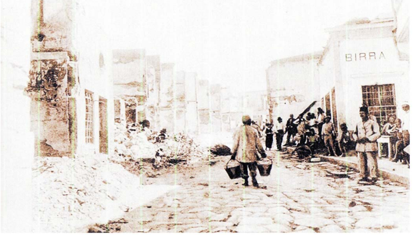
FOTOĞRAF-4: KANDİYE OLAYLARI SONRASI