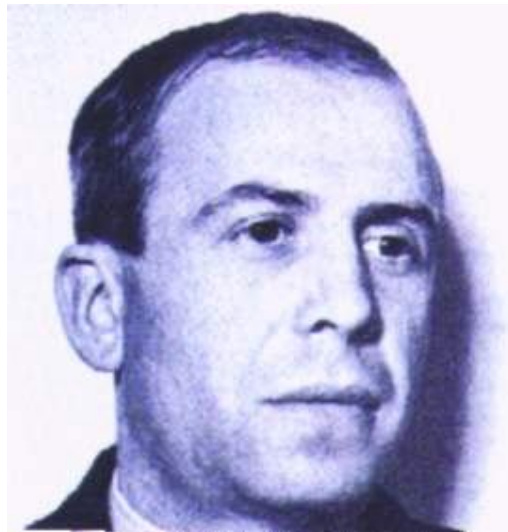
resim 4 Hasan Ferit Alnar