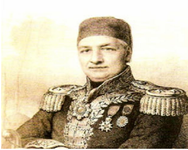
resim 1 Donizetti Pařa

Ordudaki reformlar sonucu avrupai stilde oluřturulan yeni Saray Bandosu'nun bařına İtalyan bir řefin tayin edilmesi gündeme gelmiřtir. Tavsiye sonucunda ulařılan ũnlü İtalyan opera bestecisi Gaetano Donizetti 'nin bũyũk kardeři Giuseppe Ambrogio Donizetti, Sultan II. Mahmut'un daveti ũzerine 1828 'de gelerek gŕevi kabul etmesiyle, 'Osmanlı Saltanat Muzıklarının Bař Ustakarı' unvanı ile İstanbul'daki gŕevine tayin edilmiřtir.