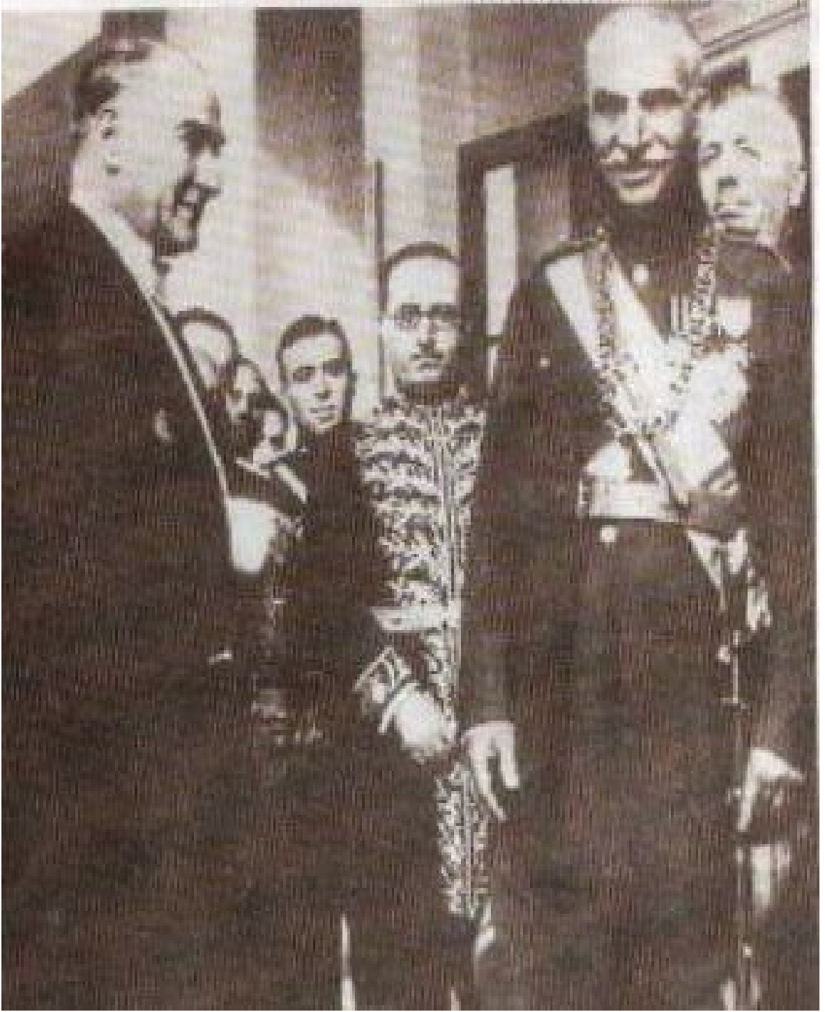
resim 9 Mustafa Kemal Atatürk ve İran Şahı Rıza Pehlevi