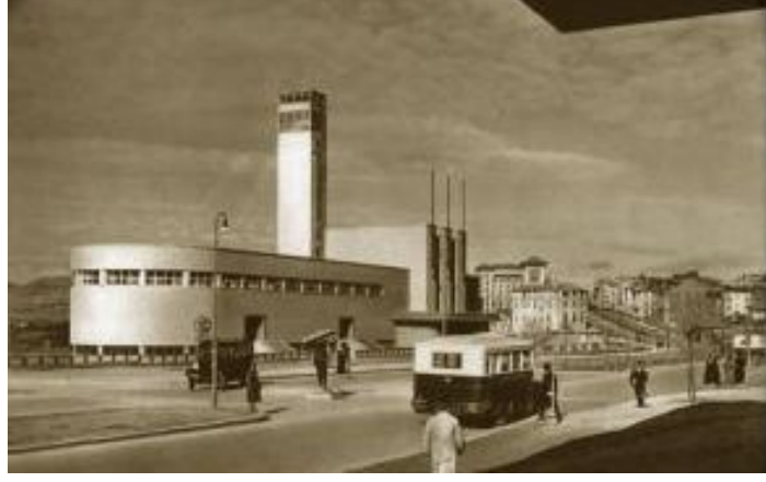
resim 29 İlk Opera Binası -Ankara

İkinci Cumhurbaşkanı İsmet İnönü, senfonik müziğin yanı sıra operaya büyük ilgi göstermiş, karşılaşılan sorunları çözmeye çalışmıştır. 1946'da Cumhurbaşkanı İsmet İnönü, dönemin Maliye Bakanı Nurullah Esat Sümer'i arayarak Ahmed Adnan Saygun, Ulvi Cemal Erkin ve Cevat Memduh Altar'ın yeni opera binası istediklerini söylemiş ve bakanın bir çözüm bulmasını rica etmiştir. Bütçe sıkıntısı içinde olan bakan çözüm olarak sergievini opera binasına dönüştürmeyi önermiştir.