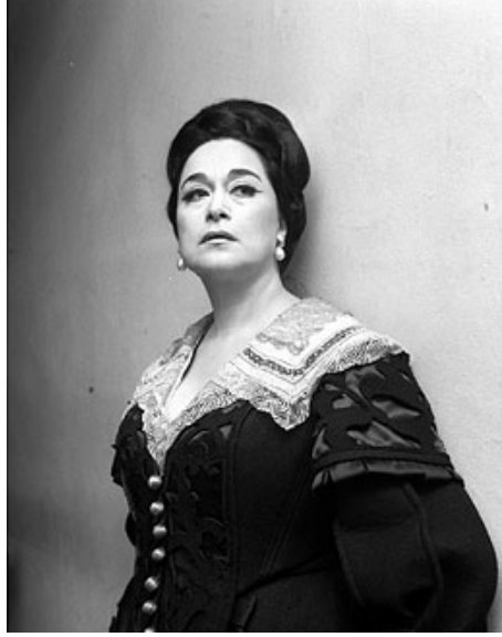
resim 23 Leyla Gencer

İstanbul'da doğmuştur. İstanbul Belediye Konservatuarı'nda başladığı şan eğitimine İtalyan soprano Giannina Arangi-Lombardi ve Apollo Granforte ile devam etmiştir. 1950 yılında Ankara Devlet Operası sahnesinde Mascagni'nin Cavalleria Rusticana eserinde Santuzza rolünü yorumlayana dek Ankara Devlet Opera ve Balesi Korosu'nda görev almıştır. Birkaç yıl içerisinde tanınan bir opera sanatçısı olan Gencer, bir çok önemli devlet etkinliğine soprano olarak davet edilmiştir.