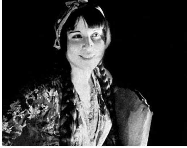
resim 22 Semiha Berksoy