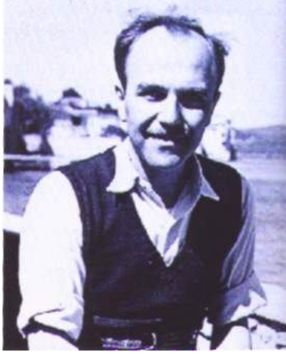
resim 3 Cemal Reşit Rey

Cemal Reşit Rey çok küçük yaşta piyano öğrenmeye başlamıştır. İlk bestesini yaptığında yedi yaşındaydı. Ertesi yıl ailesi Paris'e yerleşince, Galatasaray Lisesi'nde başladığı ortaöğrenimini Buffon Lisesi'nde sürdürmüştür. Bu arada ünlü piyanist Marguerite Long'dan ders aldı. Ailesi Cenevre'ye taşındı; Cemal Reşit de hem Saint-Antoine Koleji'nde, hem de Cenevre Konservatuvan'nda öğrenimini sürdürmüştür.