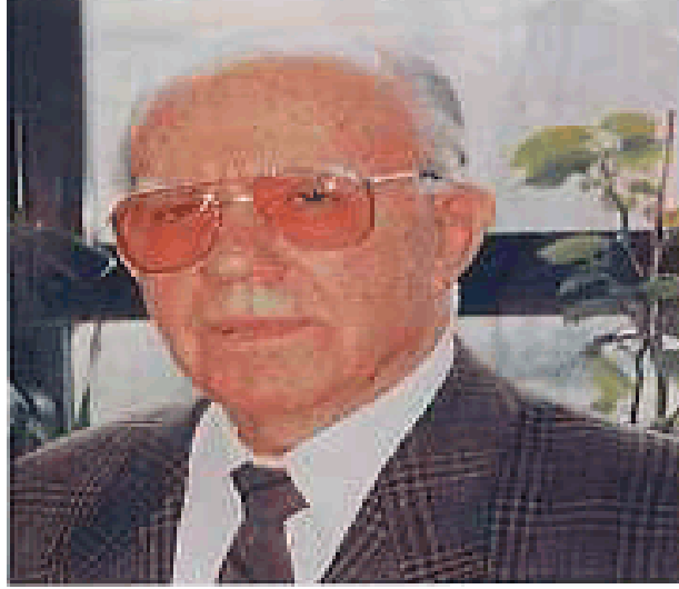
resim 20 Aydın Gün

Carl Ebert'in asistanı olan Tenor Aydın Gün Türkiye'de operanın gelişmesine çok büyük katkıları olan değerli bir kültür sanat insanıdır. Gün, operayı Ankara dışına taşımak ve İstanbul'da ikinci bir opera oluşturmak için çok çalışmıştır. Türk operasına daha başından beri damgasını vuran kişilerden biri olan Aydın Gün, yöneticiliğinin yanında birçok eserde başrolleri üstlenmiş ve eserler sahneye koymuştur. Aydın Gün bu birikimini İstanbul'a taşımış; İstanbul Belediyesi Şehir Operasını açmak için bütün hazırlıkları tamamlamıştır. 19 Mart 1960'ta Tepebaşı Tiyatrosunda "Tosca"yı seslendirmek için perde açılmıştır. Dönemin Belediye Başkanı Kemal Aygün'ün de desteğiyle sanat hayatımıza kazandırılan İstanbul Operası, bu tarihten sonra birbirinden güzel eserleri sahnelemeye başlamıştır.