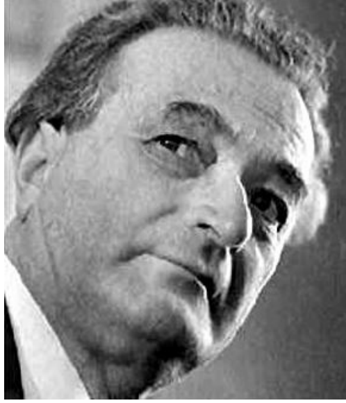
resim 6 Ahmed Adnan Saygun