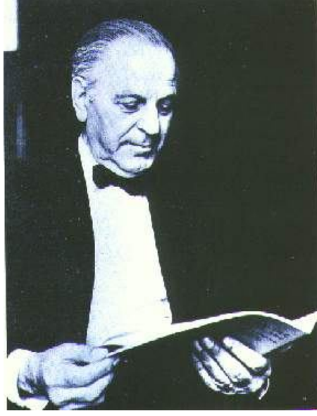
resim 5 Ulvi Cemal Erkin

Henüz çocukken piyano öğrenmeye başlayan Ulvi Cemal Erkin Galatasaray Lisesi'ni bitirdikten sonra devlet bursuyla Fransa'ya gönderilmiştir. Paris Konservatuvarı'nda ve Müzik Öğretmen Okulu'nda (École normale de musique) öğrenim görmüştür. Erkin 1930'da Türkiye'ye dönmüş ve Cumhuriyet döneminde kurulmuş ilk yüksek dereceli müzik okulu olan Ankara Musiki Muallim Mektebi'nde piyano ve armoni dersleri vermeye başlamıştır.