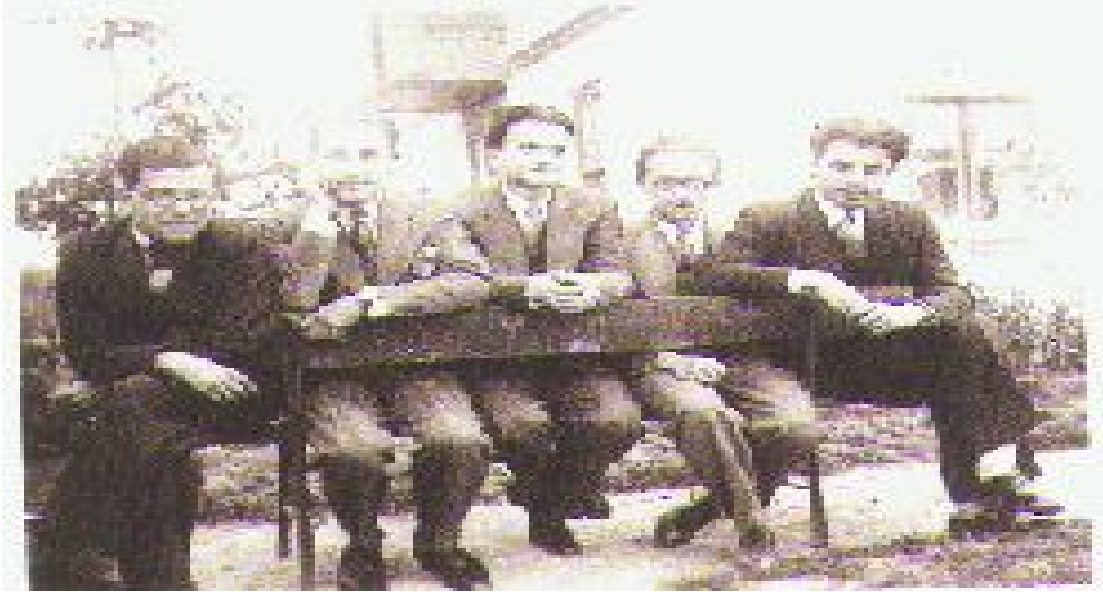
resim 2 Türk Beşleri

tutumlarıyla bir tepkiyi temsil ederken, Türk Beşleri diye adlandırılarak ortak bir çizgiye çekilmek istenen besteciler, yeni kurulan Cumhuriyet rejiminin resmi müzik politikasını gerçekleştirmeye girişmişlerdir. Beş besteci bazı ortak özellikler taşımakla birlikte, gerek kişiliklerinden, gerek müzik öğrenimi aldıkları çevrelerden kaynaklanan üslup farklılıkları da göstermişlerdir.