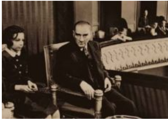
resim 11 Ankara Halkevi'nde Türk Maarif Koleji'nin çocuk opereti temsilinde

Böylece adı henüz kanunla konulmamış olmasına rağmen 1936 yılında, 1934 yılında Ankara'da faaliyete geçirilmiş bulunan Musiki Muallim Mektebi'nin öğrencileri arasından seçilen yetenekli elemanlarla yine aynı kurumun içinde devlet konservatuvarı sınıfları faaliyete geçirilmiştir. Konservatuvarında, müzik sanatının bütün dallarında olduğu gibi, tiyatro ve opera alanında da çalışmalara hızla başlanmıştır.