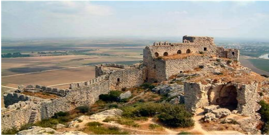
Resim 5 Yılankale (Şahmeran kalesi)