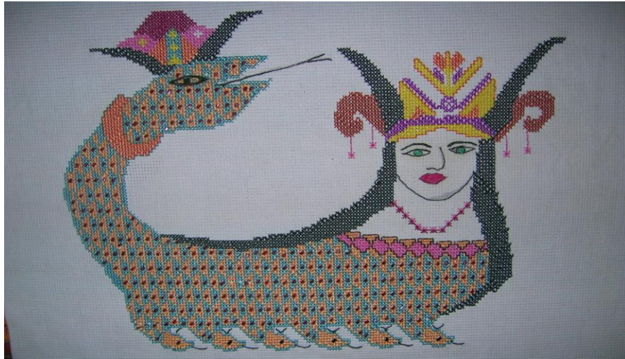
Resim 1 Şahmeran işlemesi I

edilmektedir. “Şahmeran’ın Ceyhan ile Misis arasındaki Yılan kale’de yaşadığı söylenir, efsaneye göre Şahmeran yer altı ülkesinde yılanlarıyla birlikte yaşamaktadır”(Öz, 1998: 63). Şahmeran efsanelerde başı insan, gövdesi yılan biçiminde tasvir edilmektedir. Efsanelerin bir kısmında kadın bir kısmında da erkek olarak yer almıştır. Anadolu’da Şahmeran’ın cam altı sanatında önemli yeri var. Bu resimlerde süslü tacı, değişik aksesuarları, çiçek motifleri ve ejder kuyruğuyla çok renkli çiziliyor. Bu resimler uğur getirmesi için kadınlar tarafından odalara asılıyor can veren hastaları iyileştiren doğüstü güçlere sahip bir yaratık olarak kabul görüyor. Ayrıca yörede kem gözlerden korunmak için genç kızların çeyizlerine şahmeran işlemlerinin konulması bir gelenektir. Yeni evlenen çiftler evlerine Şahmeran resmi asarlar. Bu yolla bereketin evlerine de geleceğine inanırlar.