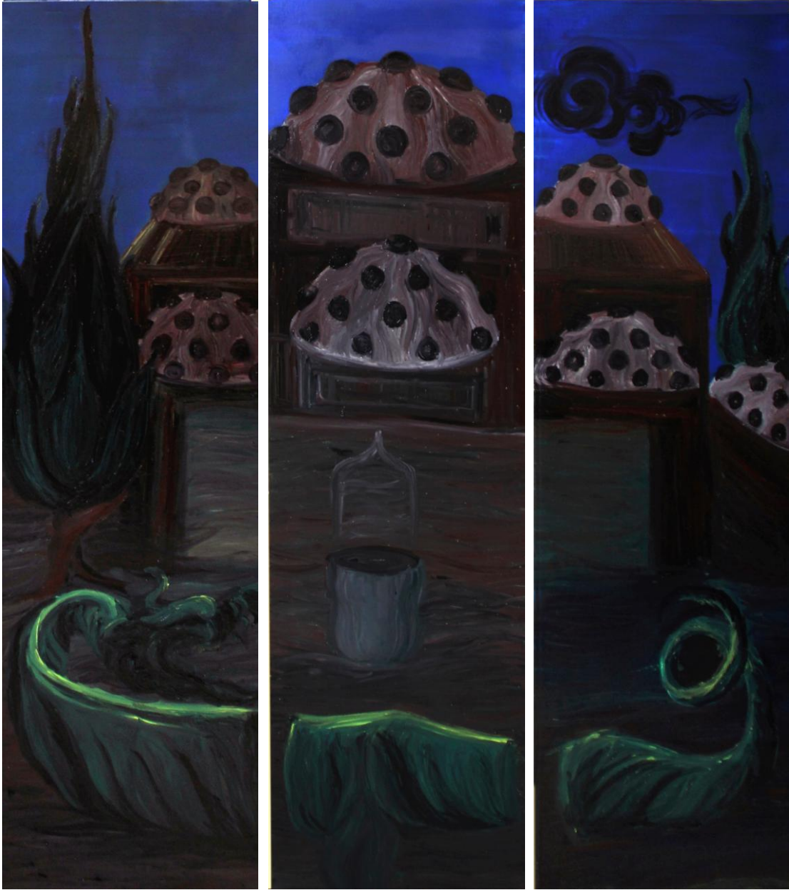
Uygulama 4 Şahmeran'ın Hamamda Öldürülmesi, 3 adet 40x130 cm, Tuval üzerine karışık teknik

Uygulama çalışması IV' te, 3 adet 40x130 cm ölçüsünde tuval üzerine karışık teknik resimlerde Şahmeran'ın hamamda öldürülmesi konu edilmiştir. Efsanede Şahmeran'ın Tarsus da Şahmeran hamamı olarak ta bilinen eski hamam da öldürüldüğü söylenir. Eski hamam "Romalılar zamanından kalma bir hamamın temelleri üzerine Ramazanoğulları zamanında kurulduğu söylenir. Çeşitli onarımlar geçiren bu hamam