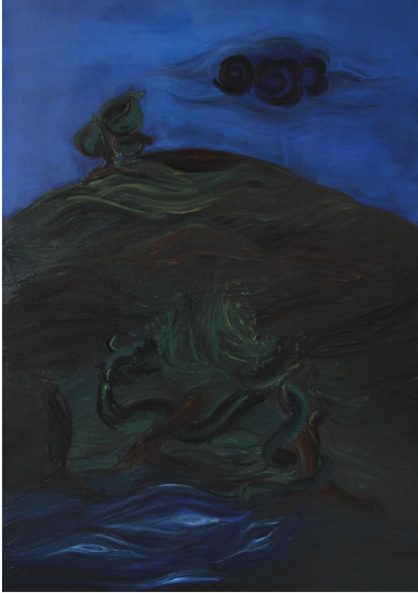
Uygulama 1 Şahmeran ve Camasb, 90x130cm. Tuval üzerine karışık teknik

Uygulama çalışması 1'de 90x130 cm tuval üzerine karışık teknik olarak yapılmıştır. Şahmeran ve Camasb varyantı resmedilmiştir. Camasb bir kuyuya düşer ya da atılır ve yeraltında Şahmeran'ın ülkesine gelir. "Kuyuya atılma olgusu Battalname'de de vardır. Seyyid Battal Gazi'yi Ketayun'un adamları yakalayıp ölmesi için Cah-ı Cehennem denilen kuyuya bırakırlar, üzerine taşlar atarlar. Bu taşlar Battal Gazi'ye zarar vermez. Onun yanına yılanlar gelir. Bu yılanları başı yeşil zümrüt gibidir. Adının Yemliya Şah-ı Maran olduğunu söyler. Uyurken yanına Ejderha gelir. Battal Gazi dua