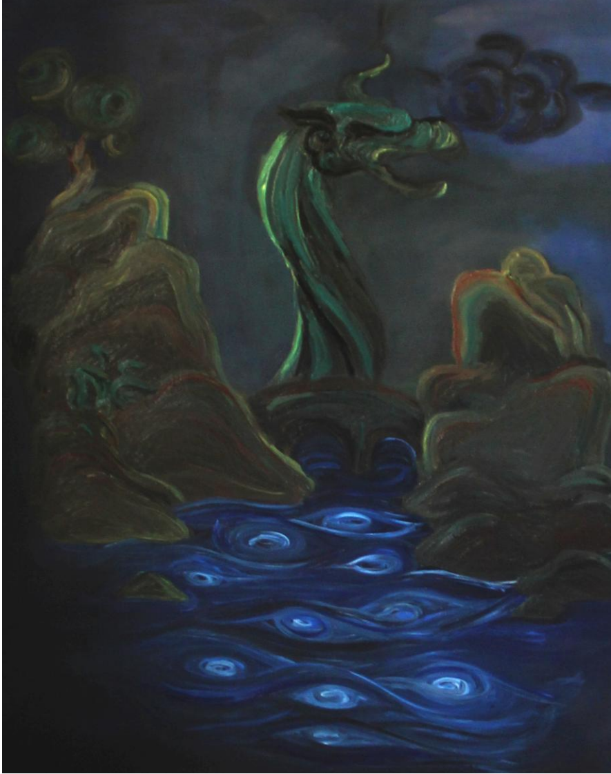
Uygulama 3 Şahmeran ve Lokman Hekim, 90x130 cm. Tuval üzerine karışık teknik

varyantındaki semboller de minyatür sanatının iki boyutlu yüzey resmi olma özelliğini ve bulut, nehir vs. çizimlerdeki kıvrımlarda geleneksel yapısını izlerini görmekteyiz. Ancak fırça sürüşündeki değişikliklerle, minyatür sanatından farklı bir etki yaratılmak istenmiştir.