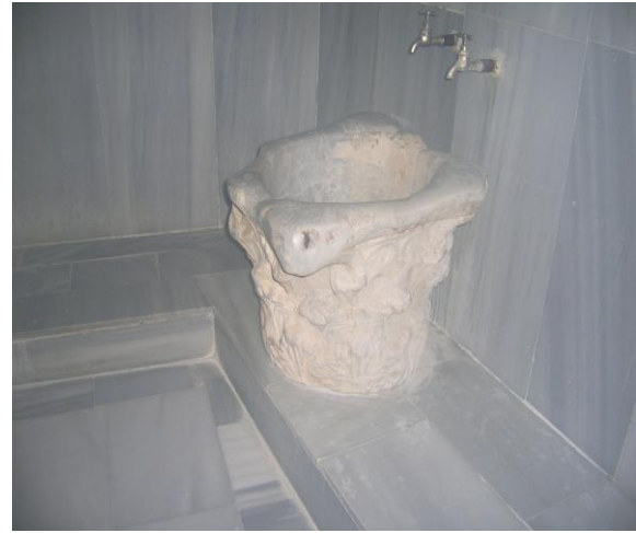
Resim 4 Eski hamam (Şahmeran hamamı)