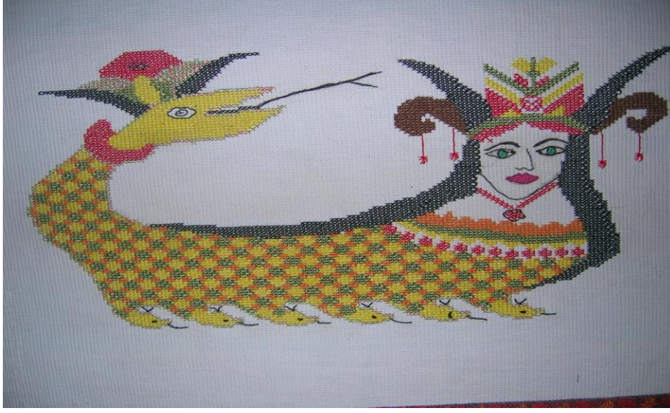
Resim 2 Şahmeran işlemesi II

Şahmeran’la bereket, doğurganlık, bilgelik, koruyuculuk sembolize edilmiş ve kabul görmüştür. Bu simgeler de efsanenin günümüzde de izlerini hatta devamlılığını göstermektedir ayrıca birçok şahmeran efsanesinin ortak yönlerinden biridir.