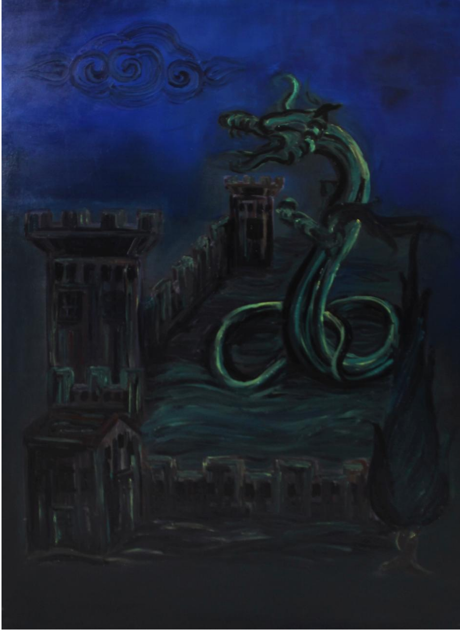
Uygulama 5 Şahmeran, 90x130 cm, Tuval üzerine yağlı boya

Çalışma V' te 90x130 cm tuval üzerine yağlı boya olarak oluşturulmuştur. Şahmeran efsanesinde Şahmeran'ın yaşadığı yer olarak belirtilen yılankale resmedilmiştir.