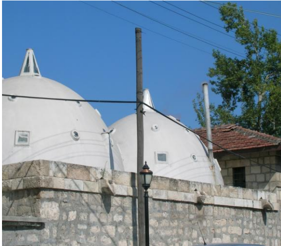
Resim 3 Eski hamam (Şahmeran hamamı)

Bu ölümün bir hükümdarın yaşam bulmasına ve hekimlik mesleğinin doğmasına yol açtığı da ortak şahmeran efsanelerindedir. Bugün Tarsus'ta tarihi Şahmeran hamamı diye bilinen bir hamam bulunmaktadır. Şahmeran'ın bu eski hamamda kesilerek öldürölüşüne ve kanının bu hamamın duvarına sıçradığına inanıldığından, Şahmeran hamamı diye anılır. Eski hamamın Romalılardan kalma bir hamam temeli üzerine Ramazanoğulları tarafından yapıldığı söylenir.