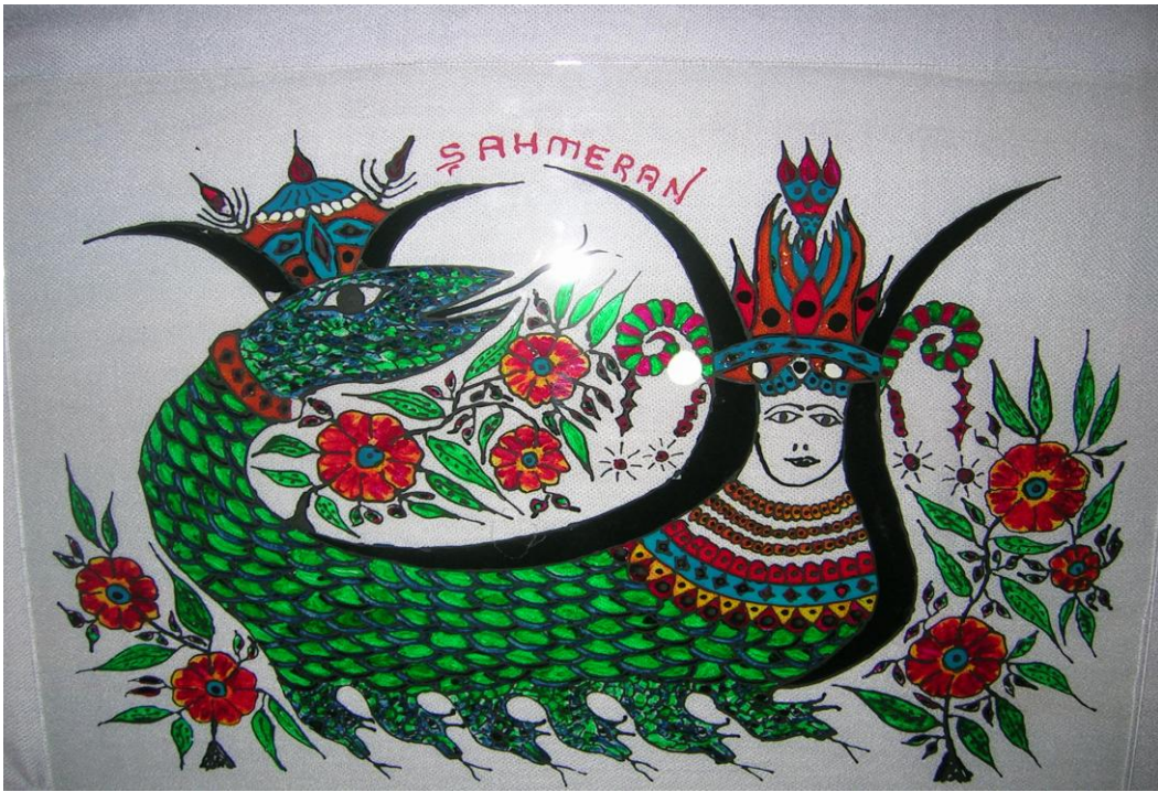
Resim 6 Camaltı Şahmeran resmi I

Motiflerdeki nesnelere anlamlarının yanı sıra renklere de anlamlar yüklenerek ejderhanın simgelediği kavramlar güçleniyor. “Şahmeranlarda gövde rengi kırmızı ve sarı benekli, kafası ise siyah üstünde sarı beneklidir, ölümsüzlük ve gücün simgesidir o. Mora çalılık bir renk üzerine sarı benek. Belli ki gizli ilimler gücünü simgelemektedir. Ancak ne denli gizli ilimler gücüne sahip olsa da boynunda “lanet halkası” ne dolaşacaktır” (Sözeri, 2000:202).