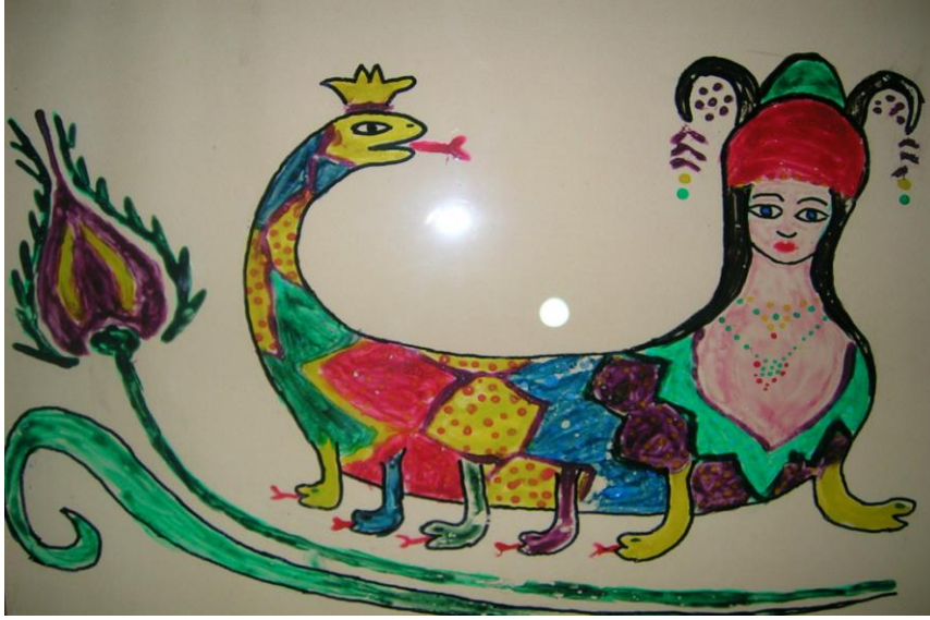
Resim 7 Camaltı Şahmeran resmi II

Anadolu’da yılan deri değiştirilmesiyle bilinir ve bu doğa olayı insan aklıyla farklı kavramlara bürünmüştür. Yılan yenilenir, bu gömlek değiştirmeler ve doğurganlık varsa o zaman ölümsüzdür gibi birbirine bağlı pek çok kavramı Şahmeran efsanelerinin iç içe geçmiş hikâyelerinde görmekteyiz. “Yılan kendini yenilediği nedeniyle ölümsüzdür ve bu nedenle de doğurgandır. Zaten doğurganlık da bir ölümsüzlük değil mi? Ölümsüzlük otu, yılan tarafından çalınmamış mıydı?” (Sözeri, 2000: 95).