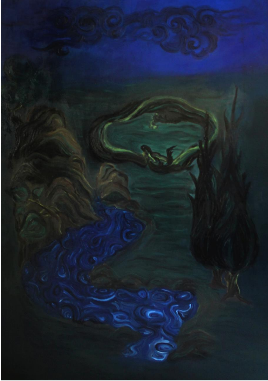
Uygulama 2 Şahmeran ve Lokman Hekim, 100x140 cm. Tuval üzerine karışık teknik

Uygulama II 100x140 cm ölçüsünde tuval üzerine yağlı boya resim çalışmasıdır.