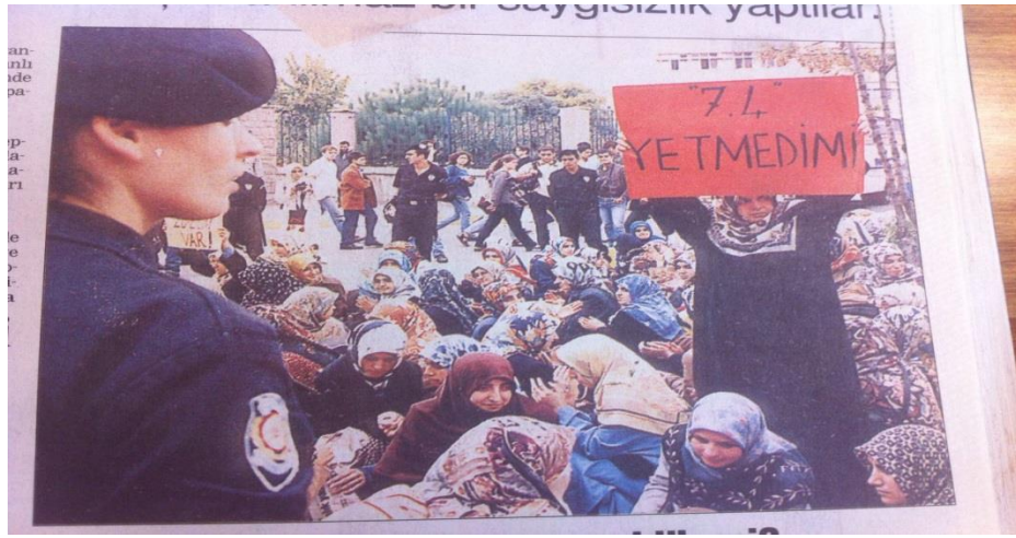
Resim 4.3. Marmara depreminin ardından 8 Ekim 1999 yılında Marmara Üniversitesi önünde yapılan türbana özgürlük eyleminde açılan ve çok tartışılan pankart. (8 Ekim 1999 Hürriyet gazetesi)

17 Ağustos 1999 Salı günü saat 03.02’de Yüce Rabbimizin celali isimleri olan Aziz, Kahhar, Cebbar, Muntakim ve Mümit gibi isimleri tecelli etti. Acaba bu isimler ne manaya geliyor? Son senelerde dinini yaşayan Müslümanlara karşı herkesin bildiği çok ağır baskılar uygulandı. Allah’ın kesin emri olduğu için örtünen öğrencilerin okullarıyla ilişkileri kesildi, memurların görevlerine son verildi. Namaz kıldığı, eşinin başı kapalı olduğu için askeriye den birçok kimse atıldı. Çocukların Allah’ı, İslamiyet’i tanımaları engellenmek için beş yıllık temel eğitim sekiz yıla çıkarıldı. Kur’an kursları belli yaşta kimselerin dışındakilere yasaklandı. (Mutlu,1999;16/21)