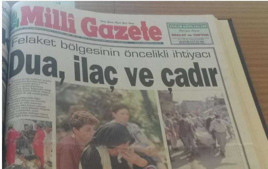
Resim 4.5. Afet bölgesinde insanların öncelikli ihtiyaçlarından birisinin de dua olduğuna dair atılmış bir manşet. (21 Ağustos 1999 Milli Gazete)