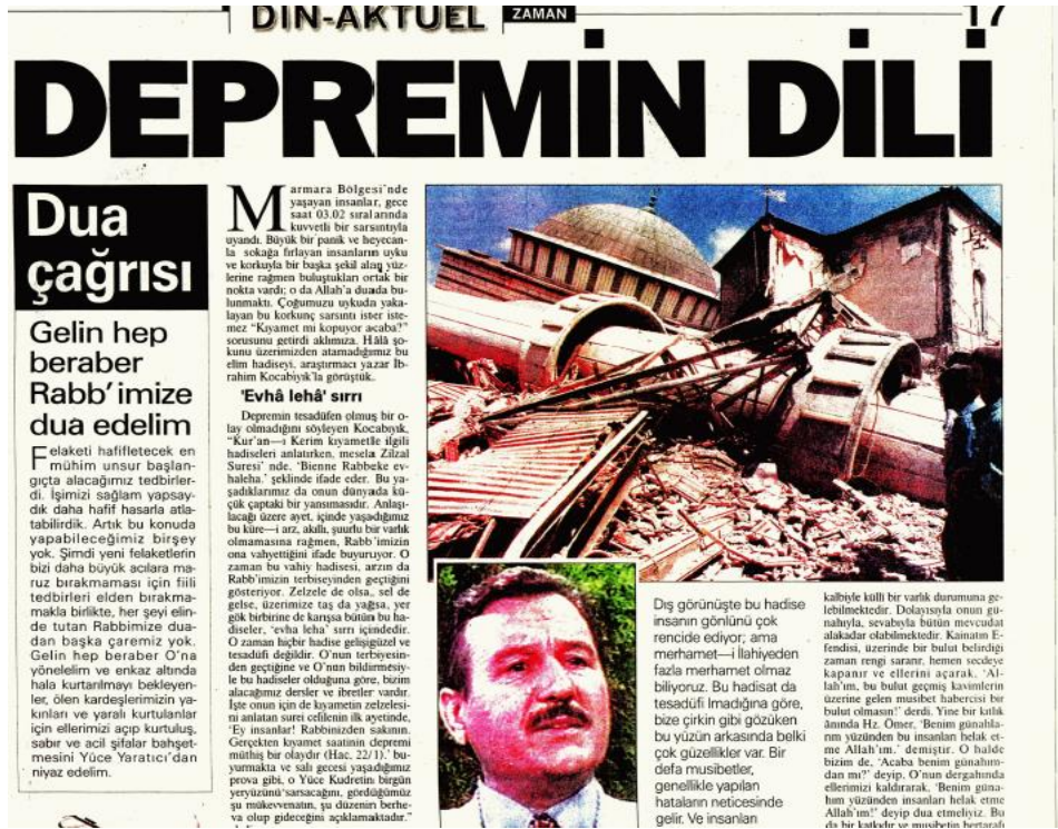
Resim 4.6. Duaya çağrıda bulunan farklı bir gazete haberi. (20 Ağustos 1999 Zaman gazetesi)