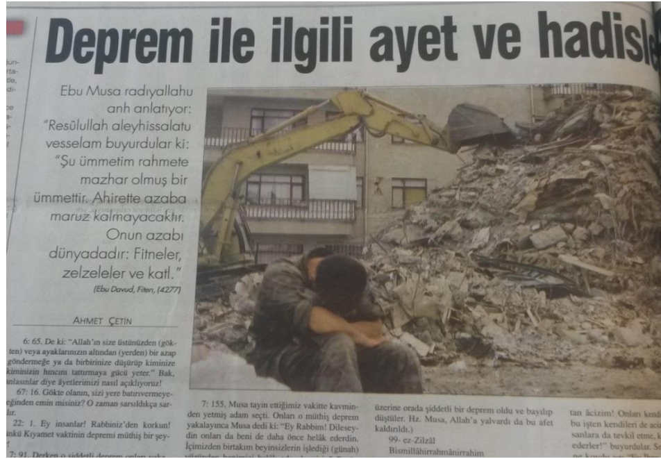
Resim 4.1. Hadis ve ayetleri referans göstererek depremin Allah'ın bir gazabı olduğuna dikkat çeken bir gazete haberi (26 Ağustos 199 Milli Gazete)

Depremin, kıyametin küçük bir provası olarak algılanması yazarların ortak görüşüdür. Bu yazarlar Kur'an'dan sureler ve hadisler göstererek söylemlerini desteklemektedirler. Onlara göre, yaşananlar aslında Kuran'da tasvir edilmiş gerçekliklerdir. Aşağıda deprem ve kıyameti ilişkilendiren birkaç örnek sunacağız: