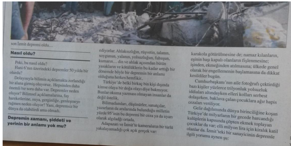
Resim 4.4. Depremin, kötülüklerin bu kadar arttığı bir döneme denk gelmesinin nedenini toplumun din ve ahlak açısından bozulmuş olmasına bağlayan bir gazete haberi. (Milli Gazete 23 Ağustos 1999)