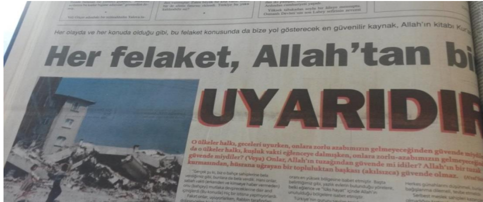
Resim 4.2. Marmara depreminin Allah'ın bir uyarısı olduğuna dair bir gazete haberi (Milli Gazete 22 Ağustos 1999)

Bu uyarılar kimi zaman kavimlerin helak edilmesi gibi ciddi sonuçlara yol açabilmektedir. Kavimlerin deprem gibi felaketlerle cezalandırılıp helak edilmesi Kuran'da yer alan bir surede şöyle geçmektedir: