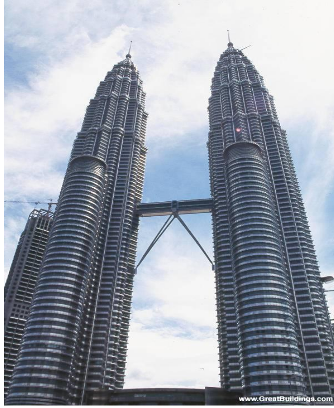
Resim. 9 – “Petronas Towers” Binasından Görünüş / Mimar Cesar Pelli

ürünün temelde bulunduğu yer bağlamında etkili bir dönüştürme aracı gibi davranabildiğini de göstermektedir. Müze, bölgenin sadece önceden varolan karakterini değil geçmiş ve gelecek arasındaki gerilimin ve değişim isteğinin uyarlanması olarak da betimlenebilir. Yani, bir yandan yerel olana asimile olmuş, bir yandan da onu değişime zorlaya bir mimari tavır söz konusudur. (Resim 7,8).