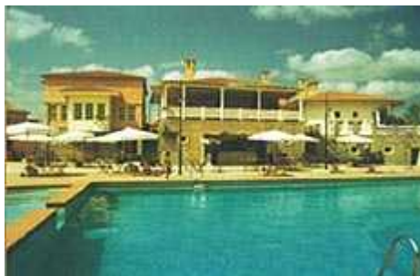
Resim. 30-31 / Kemer Country – Sosyal Alanlardan Görünüş