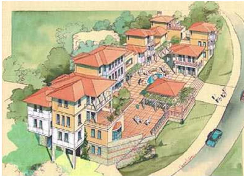
Resim. 36-37 / Kemer Country – Çarşı' dan Görünüş