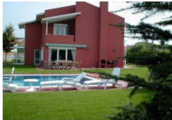
S 2 Tipi

Resim.13-14-15-16 / Alkent 2000 İstanbul' dan Konut Tipleri