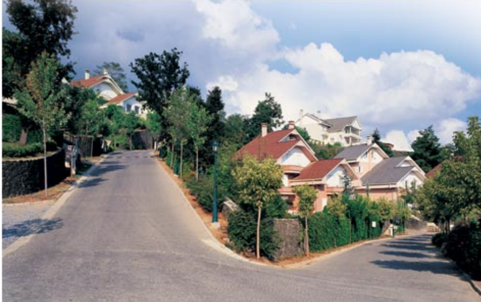
Resim. 47-48-49 / Beykoz Konaklarından Görünüş