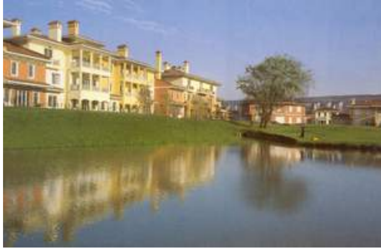
Resim.24 / Kemer Country ' den Görünüş

İstanbul'da 1980 sonlarında inşa edilmeye başlanan ve özellikle üst-orta ve üst gelir gruplarını hedef alan yerleşimlerden biri olan Kemer Country'nin tanıtım kitabı, bu tasarlanan mekanın ortaya çıkış noktasını ve bu süreci şöyle özetliyor. “Yola çıkanların ortak vizyonu şuydu: Bir zamanlar her İstanbullu'nun sahip olduğu sonradan yitirdiği bir yaşama biçimini geri kazanmak...Mahalleyi, mahallelik kimliğini yeniden yaratmak ve yaşatmak. Kaçmak değil, buraya varmaktı hedef...” Uluslar arası platformda geleneksel şehirciliğe dönüş akımının önde gelen iki temsilcisi Andres Duany ve Elizabeth Plater-Zyberk ile temas kuruldu ve Kemer Country “kasabası” için “masterplan” yapılmasının yanı sıra bu fazın planlanması için onlarla görüş birliğine varıldı...Kemer Country' nin bu yoğun toplantılarında, planlama ve mimari bütünsellik ilkelerinin rehberliğinde, geleneksel tasarımın en yüksek standartlarına uyularak, bir mahalle duygusu yaratılmasına girişilmişti. Burada, yitirilen eski mahalleyi, bu mahallenin verdiği “aidiyet” hissini yakalamak için uğraş veriliyordu.