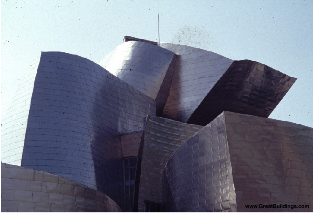
Resim. 7,8 – Bilbao Guggenheim Müzesi Binasından Görünüş / Mimar Frank Gherry

Ünlü mimarların başka ülkelerde yaptıkları yapılar kentlerin tanıtımında önemli bir yer edinmektedir. Hatta çoğu zaman turistik bir imaja da dönüşebilmektedir. Örneğin Bilbao’da Frank Gehry’nin tasarladığı Guggenheim Müzesi İspanya’nın sorunlu bir bölgesinin imajının değişimine neden olmuştur. Guggenheim, mimari