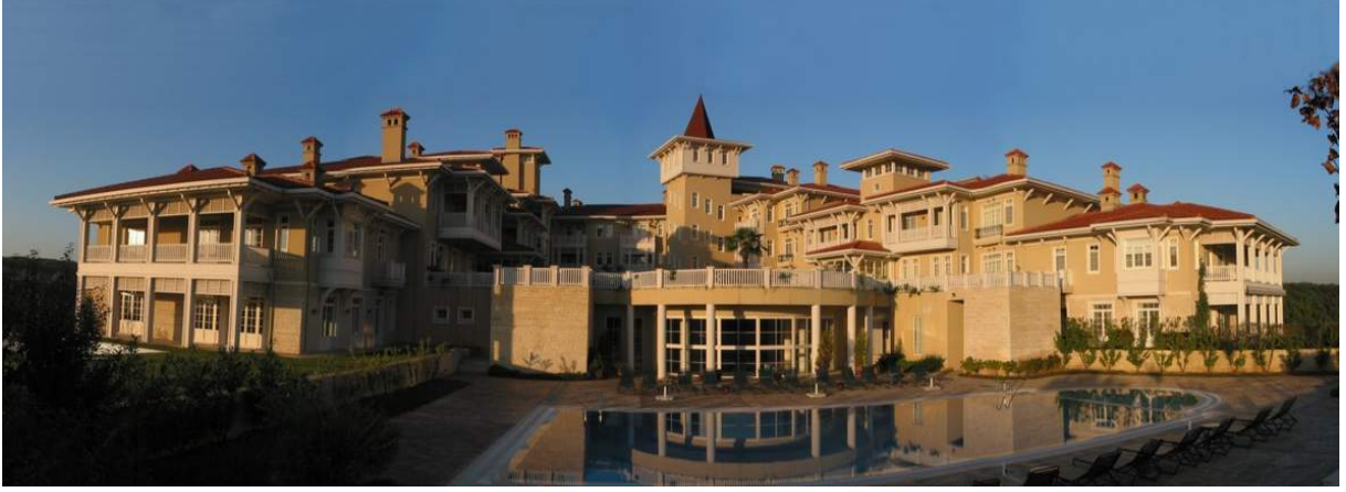
Resim. 28 / Kemer Country – Lale Konak' larından Görünüş