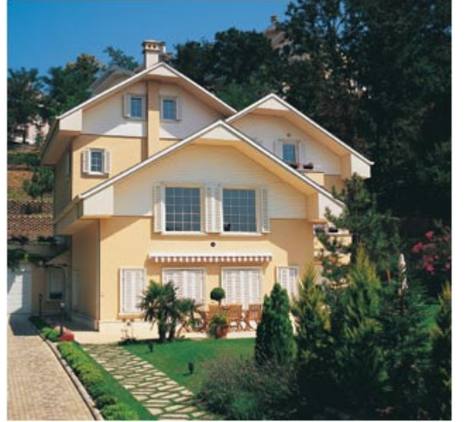
Resim. 41-42-43 / Beykoz Konaklarından GörünüŐ