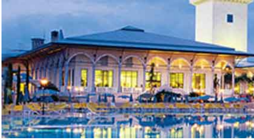
Resim.4,5 – Antalya Kemer’ de Wow Topkapı PalaceTatil köyü “Topkapı Sarayının yorumu.”

Mimarlığın zaten somut işlevselliğinden kaynaklanan bir popülerliği söz konusudur. Mimarlık, düşünsel bir etkinliğe dönüşmeye, başka bir ifadeyle kendi üzerine kapanmaya başladığı noktadan itibaren, toplumsal bağlarını, işlevselliği saklı tutarak, adım adım koparmaktadır. Mimarlığın praksi ile kuramsal bilgisi, o denli ayrılmıştır ki, gündelik hayatta adeta aynı binanın iki farklı görüntüsüyle yüz yüze olunmak durumundadır. İroniktir, fakat mimarlık belki de yalnızca doğrudan doğruya kullanıcı tarafından biçimlendirildiği durumlarda bahsedilen anlamda bir iletişimsellik kazanabilir.