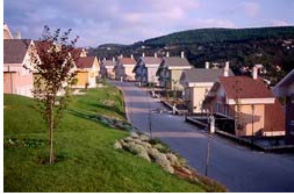
Resim. 50-51 / Beykoz Konaklarından Görünüş