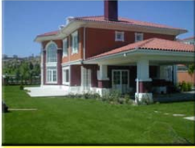
Resim. 23 / Alkent 2000 İstanbul' dan Görünüş

Kalitenin ve konforunun en önde gelen aranır nitelikler olduğu bir ortamda sitelerdeki sinema salonları da bundan etkilendi. Alkent Etiler'deki Parliament Cinema Club'ün salonlarında sunulan konforlar arasında "Fransa'dan ithal edilmiş özel bardaklık bölümleri ile konforlu koltuklar, italyan projeksiyon makinesi, Digital Sound System DTS and Dolby Digital System, özel klima sistemi, bilgisayar ile ekrandan yer seçimi ve rezervasyonun yanı sıra "valet parking" ve vestiyer servisi yer aldı. Bu sinema kulübüne gitme ayrıcalığına sahip olan Alkent' li sakinler sıradan fânilerden oluşan halkın gösterime girmesini sabır ve tevekkülle beklediği filmleri onlardan daha önce nezih bir ortamda ve de bunu sitenin müteahhit şirketi Alarko'nun ortağı kamuoyunun ve iş âleminin güzide simalarından "sosyal demokrat" işadamı Ishak Alaton'la birlikte seyretme ayrıcalığına sahip oldular. (Alarko Bizim Dünyamız Derg. Haziran -1998).