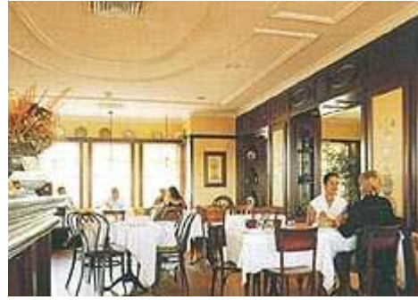
Resim. 32-33 / Kemer Country – Sosyal Alanlardan Görünüş

Bu yeni sitelerin alıcılarına tanıtımında uygulanan yöntemler de tabî ki Amerikanvari oldu ve ana hedef kitleyi teşkil eden genç ailelere hitap etti. Tanıtım sırasında özellikle küçük yaşta çocuklara sahip genç çiftler hedeflendi ve tanıtım alev yutan sihirbazlar, tahta bacaklı palyaçolar, falcılar ve muhtelif eğlencelerin yer aldığı bir piknik/panayır havası içinde yapıldı.