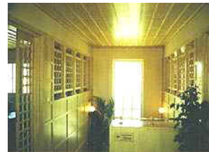
Resim. 38-39-40 / Kemer Country – Golf Kulübü' nden Görünüş