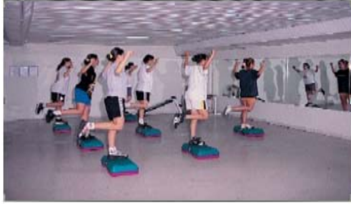
Resim.19-20-21-22 / Alkent 2000 İstanbul' dan Çeşitli Aktivite Mekanları