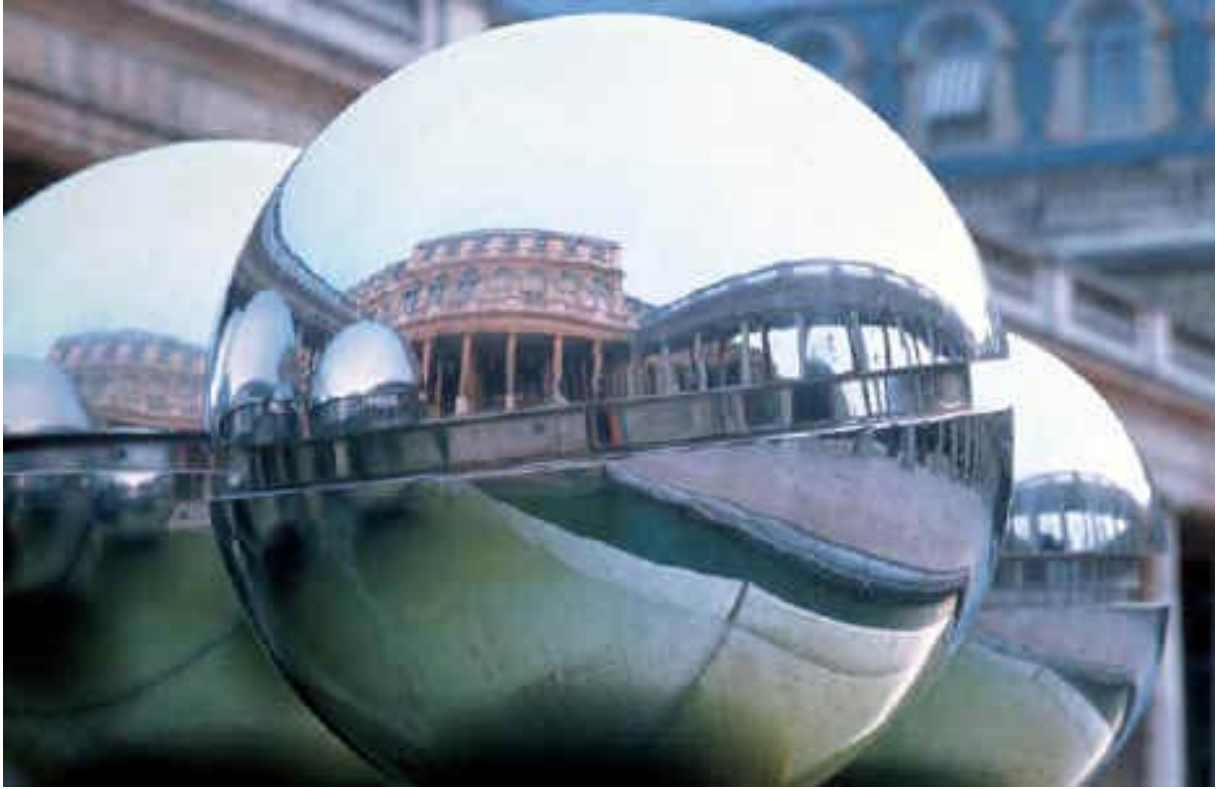
Resim. 6 – Küreselleşen Mimarlığı anlatan bir grafik.

bir yapısı ve tek bir merkezi (ya da hiyerarşik olarak merkezler bütünü ) yoktur. Çünkü gridal ağ içinde yer alan her bir grid-alan bir merkez gibi davranır ve kendini çevreden mutlak surette soyutlar. Dış ile ilişki belirleyen öğeler önemini yitirir ve her bir birim kendi içini yaratır. Bu durum küreselleşen sermayeden yana kapitalist bir ülke olan Türkiye’de mekansal değişim ve dönüşümlerde izlenebilir. Konut alanları ayrımı yerine günümüzde konutlar farklı işlevlerin üst üste yığıldığı tek bir yapı içinde yer almaktadır. Bir yapıda konut-büro-işyeri-sağlık merkezi üst üste gelebilmekte, sermaye daha da büyüdükçe bunlara yeni işlevler oyun-eğlence merkezi eklenebilmektedir. Bununla beraber konut başlangıçta belirtilen sembolik sermayenin akıtıldığı alandır. Yeni dünya düzeninin de yeni hayat prestiji konut üzerinden edinilmektedir. Bu da tasarıma konutun hem teknolojik olanaklar ile donatılması hem de ithal malzeme ve ithal proje talebi olarak yansımaktadır.