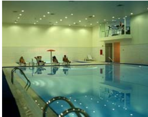
Resim. 52-53 / Beykoz Konakları Aktivite Alanlarından Görünüş