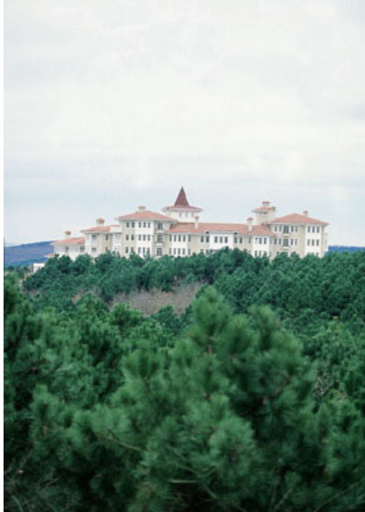
Resim. 27 / Kemer Country – Lale Konak' larından Görünüş

Ancak bu eski "mahalleli yaşam" tarzı arayışı sitelerde bulunan konutların Lale Kasrı, Yalı konaklar, Sarı Konaklar, Şehnaz Konak, Segah Konak, Nihavent Konak gibi Osmanlı İmparatorluğu' nun soyluluğunu ve yükseliş dönemini simgeleyen adlar taşımalarına rağmen sitede yaşanması tasarlanan ve neticede bilfiil yaşanan hayat site sakinlerinin birçoğunun gençlik ve yüksek öğrenim yıllarını geçirmiş oldukları Amerika kıtasının banliyölerinde rastlanan gündelik hayatın birer soluk kopyası oldu. Bu nedenle bir görüntü bankasından satın alınıp Kemer Country'yi tanıtır kitaba konulan fotoğrafta, 1970'li yılların Life dergilerinden alınmış ve Amerika'nın ünlü Snoopy ve Dennis the Menace çizgi romanlarından fırlamışçasına, koltuğunun altına beyzbol sopası sıkıştırmış sekiz, on yaşlarındaki üç afacan Amerikalı çocuğun yer alması pek de şaşırtıcı olmadı. (Sabah, 23 Aralık 1998).