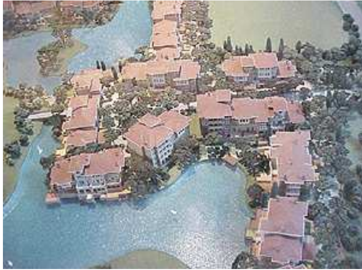
Resim. 25-26 / Kemer Country ' den Görünüş