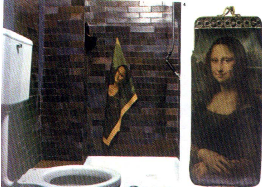
Resim.2 – Da Vinci’ nin ünlü tablosu “Mona Lisa” nın popüler kültürde bir yorumu . (Arredamento Mimarlık Dergisi / 2003-05).

Chartier; “Halkın Okuma Alışkanlıkları” başlıklı makalesinde popüler kültürün “düşünsel bir kategori” olduğunu daha ilk cümlede söyler ve hemen arkasından şunu ekler: “Aydın kültürü dışında gelişen üretim ve davranışları sınırlandıran tanımlamaya çalışan bilimsel bir kategori olan halk kültürü (popüler kültür), aslında çelişkili pek çok yorumuyla, Batılı aydınların “egzotik” dünyalarda karşılaştıkları kültürlerden daha zor algıladıkları bir kültürel başkalığı ifade eder.” Dolayısıyla popüler kültür, kendisini o kültüre ait hissetmeyenlerin icat etmiş olduğu, yani kendilerini “halktan” görmeyenlerin kullandığı bir tanım. Kendileri var, bir de “ötekiler”, “aşağıdakiler”. Ancak, açık ki, bir kültürü “popüler” olarak tanımlayan kişileri onlarla aynı toplum içinde, onlara “dokunarak” yaşamaktalar. Dolayısıyla, “popüler” adlandırmasının, içinde ağır bir iktidar işleyişi barındırdığı açık.