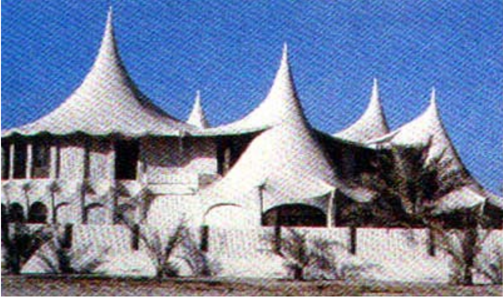
Resim.1 – Kuveyt’ de “çadır taklidi” bir evden görünüş.(Arredamento Mim.s:2003-05)

Tarihsel sürekliliğin sağlanmasında mimarlığın özel bir yeri vardır; mimarlıkta sürekliliği doğuran kavram ise mekandır. Özer'e göre geçmişin gerçek anlamda devamı, ancak mekan duygusundaki sürekliliğin devamı ile sağlanır. (Özer, 1982, s.60).