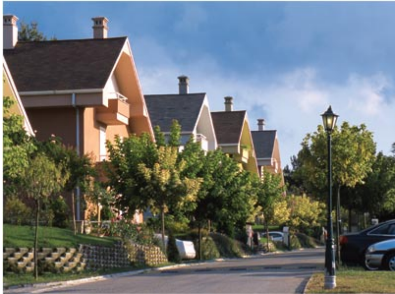
Resim. 44-45-46 / Beykoz Konaklarından Görünüş