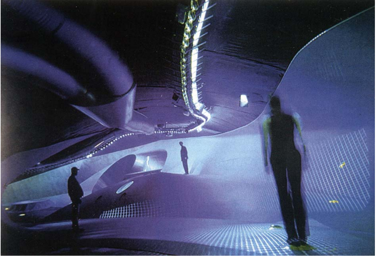
Resim. 12 – Geleceğin Yeni Mekanı “ Siber Uzay” / MVRDV

Bugün kentler, genelde azalan nüfus artışı hızlarına karşın, gösterişli, görkemli merkezler çevresinde mekana yayılıyor. Kapital yoğun sanayiler kent dışına çıkarken, emek yoğun sanayiler (emek depolarından ayrılmamak için) bir süre direniyor. Yükselen yeni servis türleri, kent içinde İstanbul-Levent finans merkezi, Güneşli basın merkezi, Ankara-Balgat siyasal merkezleşmesi gibi yeni ve gösterişli odaklar yaratıyor. Yeniden yapılanan emek pazarının yeni işlevlere referans ile yeni yaşam biçimleri geliştiren/ithal eden sosyal kesimler, yeni tüketim biçimlerini vurgulayarak farklılaşıyor. Sosyal gruplar arasında sosyal mekanda artan mesafeler kentsel mekana yansıyor, emek pazarında zayıflayan ilişkiler ve kesinleşen ayrımlar kentsel mekanda da yerini aramaya başlıyor.