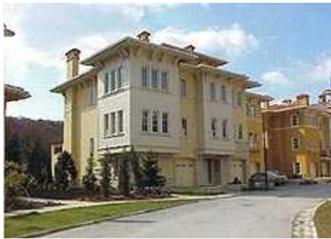
Resim. 34-35 / Kemer Country – Genel Görünüş