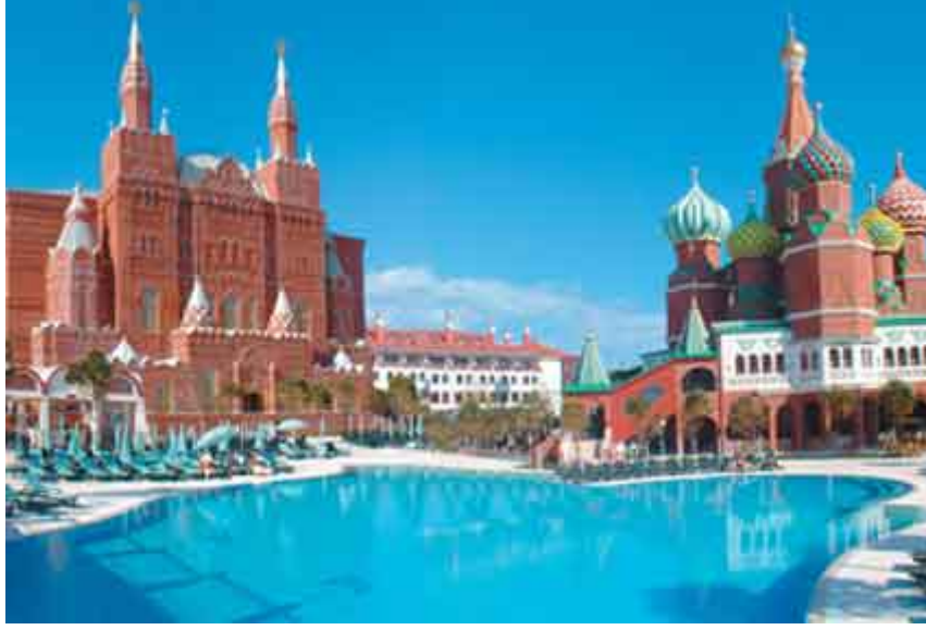
Resim.3 – Antalya Kemer’ de Wow Kremlin PalaceTatil köyü “Kremlin Sarayının yorumu.” (www.tatilrehberi.com)

Mimarlığın popüler kültür nesnesi olma aşamasındaki açmazı, sanat alanında görülenden farklı olarak, kendi meşruiyet alanını bahsi geçen türden serbest çağrışıma olanak vermeyecek biçimde toplumsal bağlarından yalıtılmış oluşuyla bağlantılıdır. Bu nedenle de mimarlığın, hem yeniden üretilen nesnenin -bir barınma aracı olarak- kendisi, yani gösterileni (gösterenin işaret ettiği anlamı), hem de göstergesi olmak gibi ikili bir yapıyı aynı bünyede var etmesi gerekiyor. Mimarlığın bir göstergeler sistemi olarak içselleştirilememesinden kaynaklanan, öncelikle fiziksel olarak gereksinim duyulan bir etkinlik oluşu, mimarlığın popüler kültürle kurduğu bağı kendi ontolojik koşullarıyla bağlantılı olarak, farklı bir düzleme taşımaktadır. Sanatın, örneğin resmin, varoluş sebebinin tersine mimarlık öncelikle somut işlevsel gerekçelerle biçimlendirilir. Bu nedenle de mimar, mimarlığın bir disiplin olarak kendisinin gereksinim duymadığı türden bir meşruiyet hesaplaşmasına daha da çok gereksinim duymaktadır.