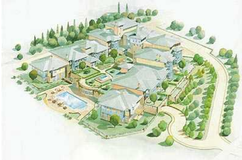
Resim. 29 / Kemer Country – Lale Konak' larından Görünüş

Dahası Amerikan banliyölerinde yaşanan hayat tarzının ve Amerikan popüler kültürünün olmazsa olmaz bir parçası ve Amerikan çizgi romanlarının klasik temalarından biri olup sekiz, on yaşlarındaki çocuklara çekirdekten yetişerek para kazanma ve müteşebbis olma ruhunu aşılamaı amaçlayan "limonata ve kurabiye satış günü" nün bir benzerinin Kemer Country'de düzenlenmesi de bu hayat tarzına aşına kişiler için pek de olağan dışı bir etkinlik olmadı. ( www.kemercountry.com )