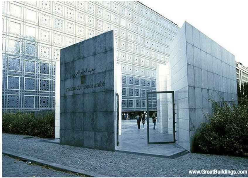
Resim.10 –Arap Enstitüsü Binasından Görünüş, Paris - Fransa / Mimar Jean Nouvel

Nouvel, söz konusu binanın tasarımında farklı olguların yorumunu yapmıştır. Bunların arasında (eserin kültürel bağlamına atıfta bulunan) 'Arap' ve 'Batılı' ,eserin kentsel bağlamına atıfta bulunan 'geleneksel' ve 'modern' bulunmaktadır.Nouvel eserin sembolizminin ve modernitesinin bu iki medeniyet tarihinin bugünkü yorumunda anlam kazandığını söylemektedir. Burada temel unsur yerel öğelerin içlerini boşaltarak bir ek gibi kullanmanın yerine daha anlamlı çözümler üretmek gerekliliğidir. Nouvel, bu yapıda, sadece farklılığı yalın bir kimliğe indirgemek veya ötekini üretmenin dışında programını da ön plana çıkartmaktadır. (Resim 10,11).