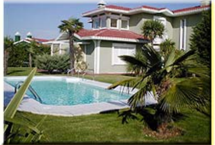
Resim.17-18 / Alkent 2000 İstanbul' dan Görünüş