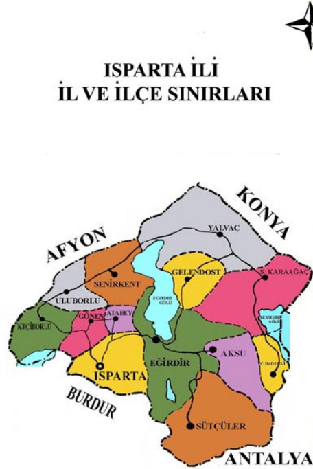
Harita:1.1 Isparta İli, İl ve İlçe Sınırları

Eskiden Nis adı ile anılan Yeşil Ada, Eğirdir'in mahallerinden biri olup Eğirdir Gölü'nde, ilçenin Kaleburnu mahallesinin karşısında Can Ada'dan sonra yer alır. Yeşil Ada, bugün doğal sit alanı olan ve iskan edilmemiş olan Can Ada ile birlikte, son yıllarda göl suyunun çekilmesi sonucu inşa edilen yolla ilçeye bağlanmıştır. Yeşil ada yeni yapıların inşa edildiği, bir bütün olarak eski doku karakterinin büyük bir bölümü zarar görmüş bir mahalledir.