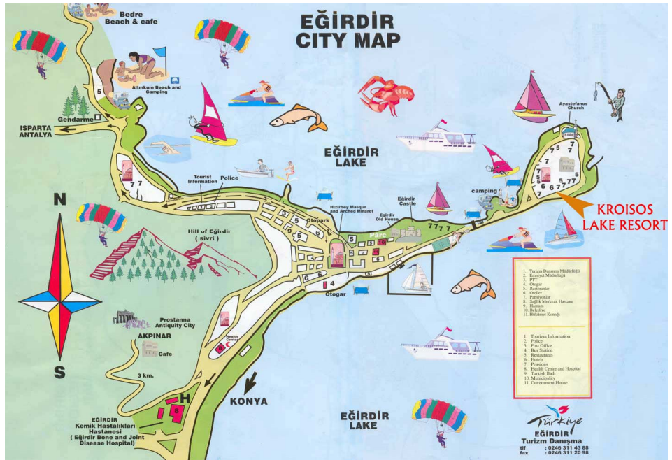
Harita:1.3 Eğirdir İlçesi Turizm Haritası