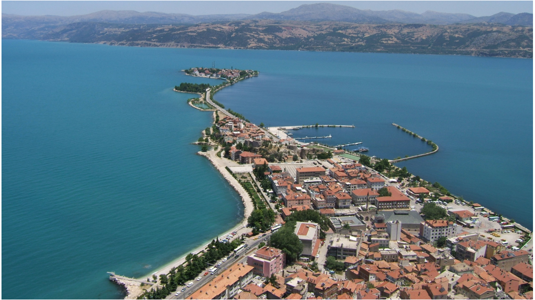
Resim:1.2 Yeşil (Nis) Ada, Can Ada , Kaleburnu'nun günümüzdeki durumu