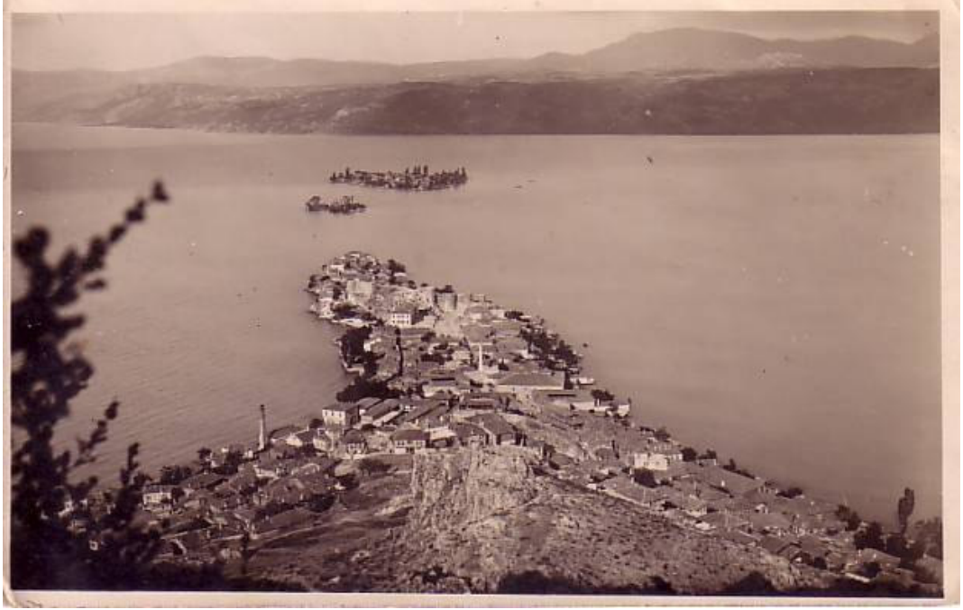
Resim:1.1 Yeşil (Nis) Ada, Can Ada , Kaleburnu'nun bağlantı yolu yapılmadan önceki durumu