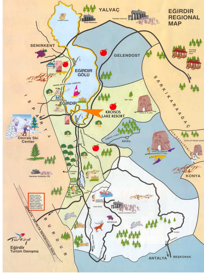
Harita:1.2 Eğirdir İlçesi Çevresi Turizm Haritası