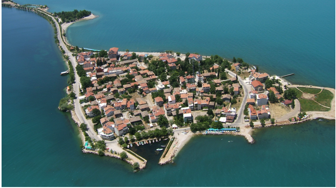
Resim.3.99.Adadan Günümüzden Bir görünüm

Adanın belediye haritasıyla, mevcut durum arasında tutarsızlıklar bulunmaktaydı. Haritada yapı olarak görünüyor, fakat mevcudunda yapılar yakılmış olduğundan veyahut başka nedenlerden dolayı yerlerinde bulunmamaktaydı.Tarihi olarak gösterilen binaların yarısı yıkılıp arkasına betonarme ekler yapılmış, sınırlar karışmış durumdaydı. Mümkün olduğu kadarıyla mevcut durumu vaziyet planına işleyerek düzeltmeye çalıştık.