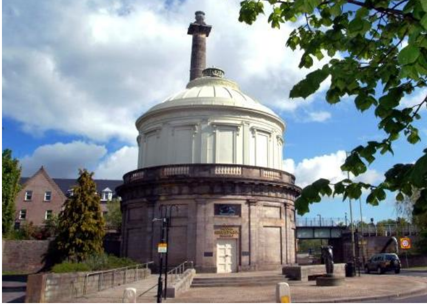
Şekil 10 - Ferguson Gallery, Perth

En büyük zorluk “yavaş” kelimesinin teknolojiyi ve gelişimi reddetmek ve geçmişe özlem duymak olmadığını anlatmakta yaşanmaktadır. Ayrıca Cittaslow’un yalnızca Yavaş Yemek’le ilgili olmadığını anlatmakta zorluk çekilmektedir. Bu mesaj yayılmaya başlamış olmakla beraber Cittaslow’un farklı bir kavram olduğunu açıklamak yaklaşık iki yıl sürmüştür.