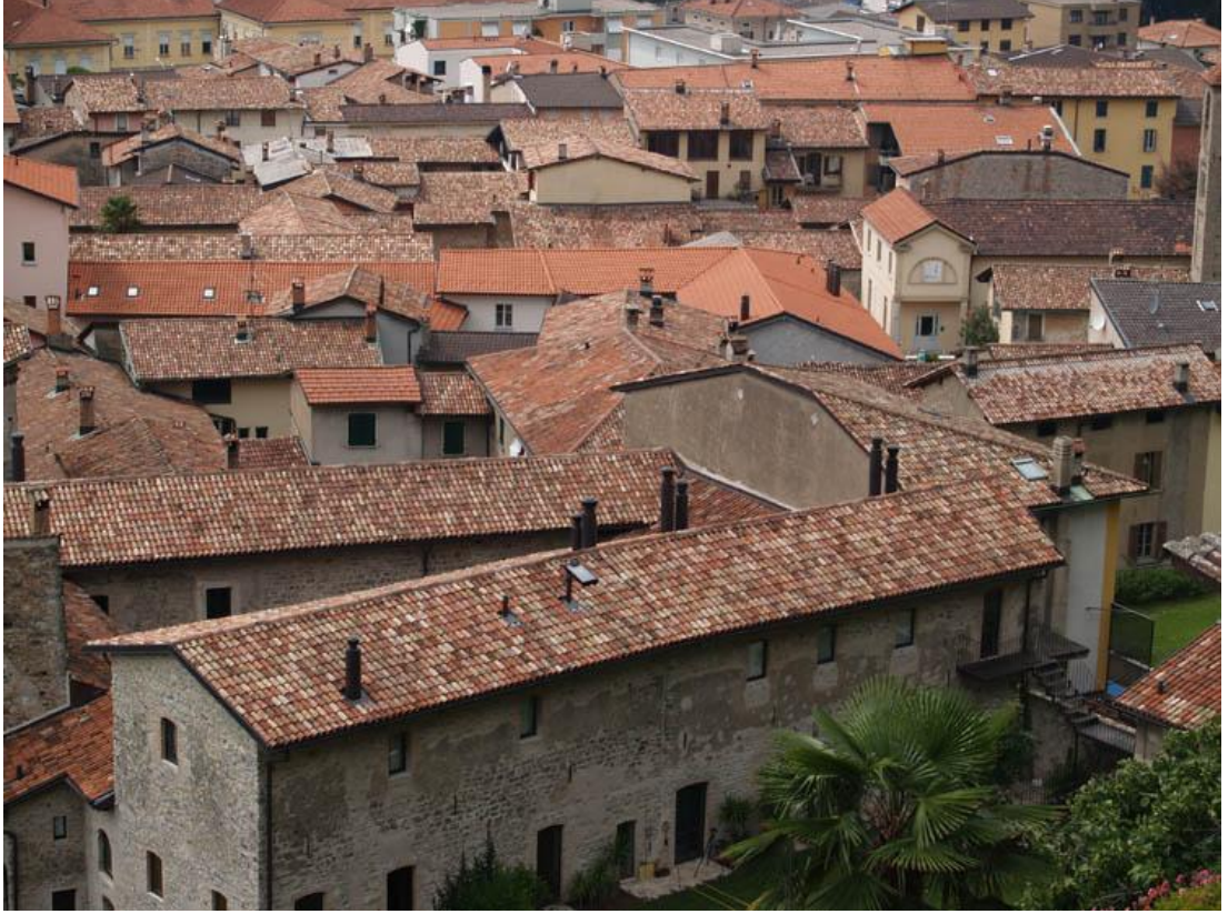
Şekil 5 - Mendrisio

Cittaslow kapsamında geliştirilen yaşam kalitesini artırmaya yönelik projeler her şekilde kentin yararına olmaktadır. Trafik, kirlilik, ulaşımdaki sorunlar, sağlanacak her çeşit hizmet, gelişimi sağlayacak her tür girişim kalitenin ve seçme hakkının iyileştirilmesi için kente katılacak bir değerdir.