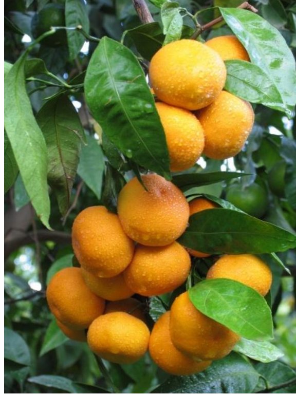
Şekil 25 - Seferihisar Mandalinası

İlki 2009'da düzenlenen şenlik her yıl "Mandalina Festivali" olarak kasım, aralık aylarında düzenlenecek, yöreye özgü bir ürün olan Seferihisar mandalinasının üretim ve tüketimi teşvik edilecektir