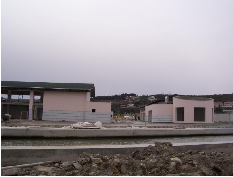
Şekil 36 – Sığacık Yat Limanı inşaatından görüntü