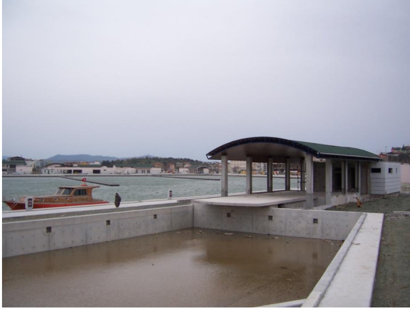
Şekil 35 – Sığacık Yat Limanı inşaatından görüntü