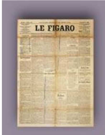
Şekil 2 - Fütürist Manifesto'nun yayınlandığı Le Figaro Gazetesi

Fransa'da Le Figaro'nun ilk sayfasında yayınlanan, İtalyan şair Tomasso Marinetti'nin 1909 Fütürist Manifestosu, teknoloji ve gelecek konularına vurgu yapan modernist bir sanat hareketi olarak ortaya çıkmıştır. İlk fütüristler, sadece sanat ve edebiyata başkaldırmıyor, araba, uçak gibi araçların ve endüstriyel gelişmelerin insanoğlunun doğaya karşı zaferi olduğunu belirterek, modern yaşamın getirilerine dikkat çekiyorlardı. Teknolojiye, demir raylara, sanayi devriminin gelişmelerine hayranlığı yansıtıyor; hızı, dinamizmi, makineleşmeyi, savaşçılığı, sanayi girişimlerini, tersane ve makineleri övüyorlardı. İlk Manifesto; tehlike tutkusunu, enerji ve ataklığı, korkusuzluğu, gözü pekliği, başkaldırıcı yansıtıyor, bu akımı besleyen düşünce saldırganlığını yüceltiyor, açıkça insanları savaşa ve rekabete çağırıyordu.