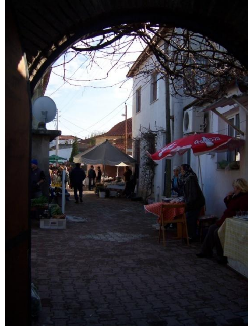
Şekil 26 - Sığacık Pazarı'ndan görüntü

Sığacık'ta Kaleiçi'nde Aralık 2009'dan itibaren yerel pazar kurulmaya başlamıştır. Her pazar günü kurulan pazarda yerel halk kendi üretimleri olan malları burada satabilmektedir. Gerek gıda maddeleri olsun gerekse el sanatları ürünleri olsun ziyaretçiler tarafından oldukça ilgi görmektedir.