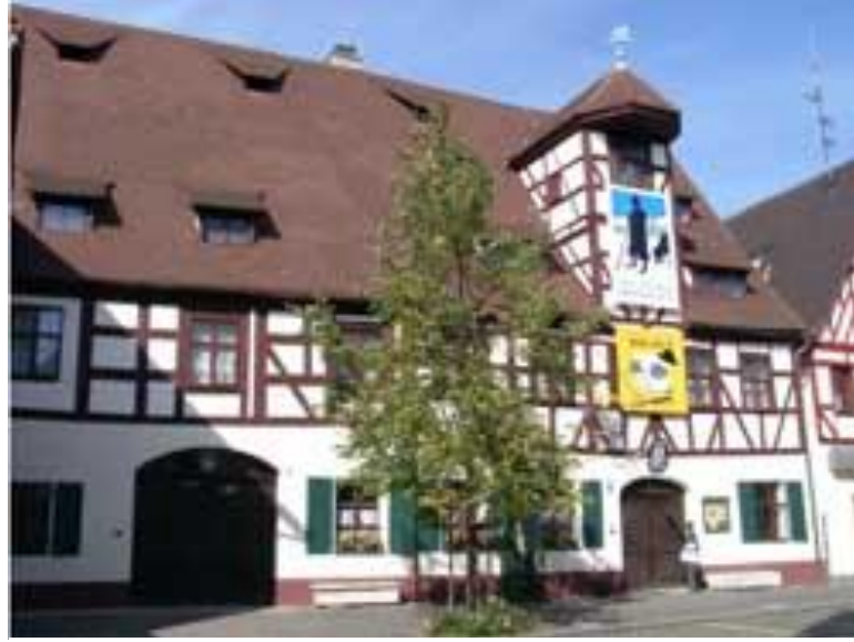
Şekil 11 - Hersbruck Hirtenmuseum

Bir diğer proje de yerel üretimin doğrudan bölgedeki restoranlarda servise sunulması, üreticinin adının da tanıtılması, böylece yerelliğin daha çok teşvik edilmesine yöneliktir.