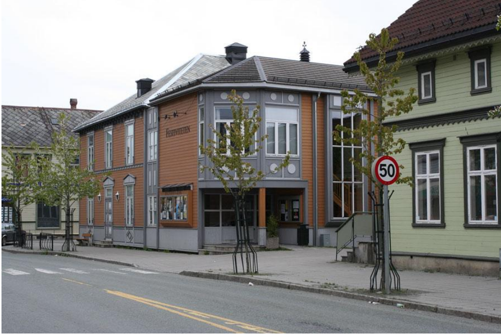
Şekil 8 - Levanger

Kimi sakinler üye olmaktan memnun olsa da başlangıçta yeterince tanıtılıp halk dâhil edilmediği için şu anda hayli sorun yaşanmaktadır.