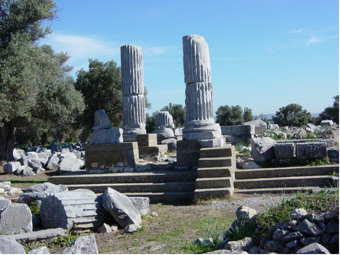
Şekil 24 - Teos Dyonisos Tapınağı

Teos'ta kamulaştırma çabaları nedeniyle belediye toprak sahipleriyle mahkemelik durumdadır. Bu sorun çözüldüğü zaman buraya turizme kazandırmak için gerekli çalışmalara başlanacaktır. Ayrıca mevcut kazı başkanının yoğunluğu nedeniyle bölgeye yeterince ilgi gösterilmemesi sebebiyle yeni bir kazı başkanı için istekte bulunulmuştur.