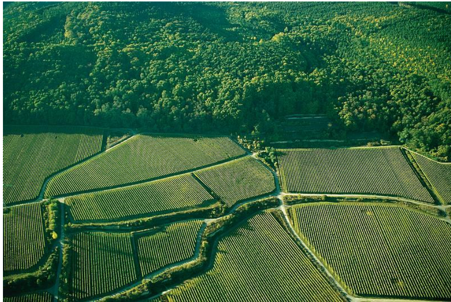
Şekil 6 - Deidesheim üzüm bağları

Üyelikle beraber kenti geliştirmek için uzun vadeli bir plan oluşturulmuştur. Diğer uluslar arası Cittaslow bağlantılarıyla da farklı fikirlere ve ilham kaynaklarına sahip olunmuştur. Örneğin İtalya'nın Roero Bölgesi, Piemont ile yeni bir turistik ortaklık kurulmuş, 2009 yılında buradan gelen 500 ziyaretçi ağırlanmıştır. Deidesheim'in şarapları da İtalya'da sunulmuştur. İki kent arasında farklı ilgi gruplarından güçlü bağlantılar kurulmuştur. Cittaslow diğer ortaklardan farklı şeyler öğrenmek için büyük bir fırsattır.