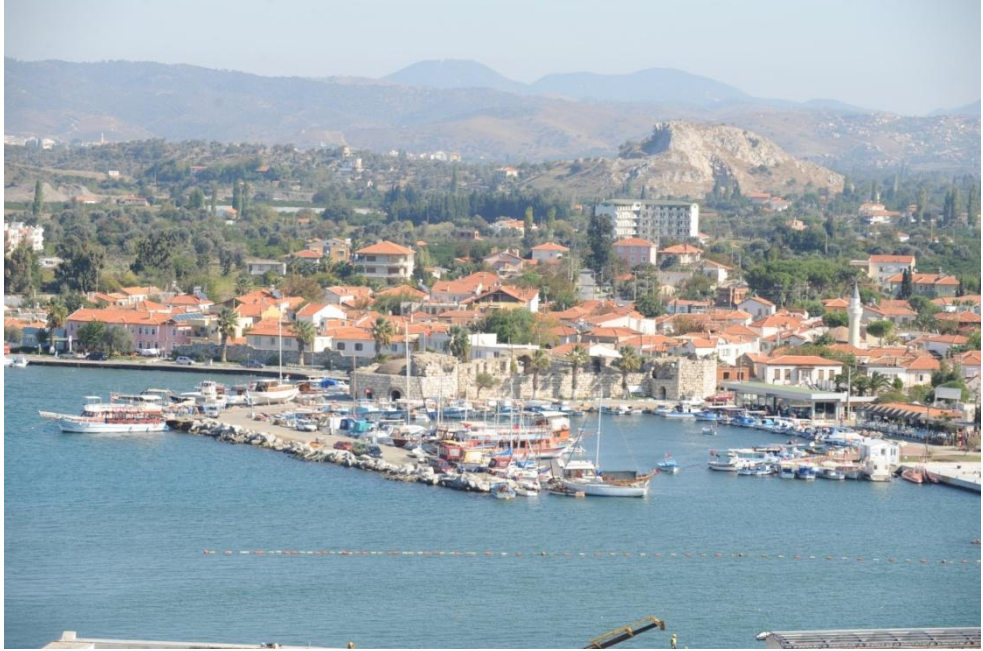
Şekil 20 - Sığacık'ın hava fotoğrafı

Sığacık ilçe sınırları içinde korunacak mimari dokuya sahip en özellikli bölgedir. Bu yüzden Anıtlar Kurulu'ndan surları ve belirli korunması gereken yapıları koruma amaçlı restorasyon planı istenmiştir. Bu çalışmalar da yakında başlayacaktır. Bölge sit alanı ilan edilmeden önce hayli yıkım gerçekleşmiş, karar sonrasında korunmaya başlamıştır. Kale etrafı da kent mobilyaları, yeşil alan, aydınlatma gibi çeşitli peyzaj çalışmalarısıyla düzenlenecektir.