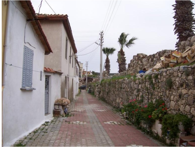
Şekil 30 – Sığacık Kaleiçi'nden bir sokak