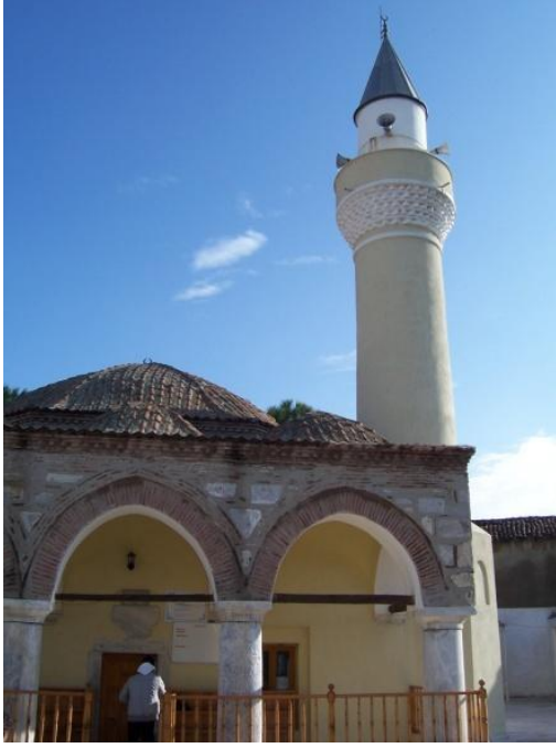
Şekil 28 – Sığacık Camisi