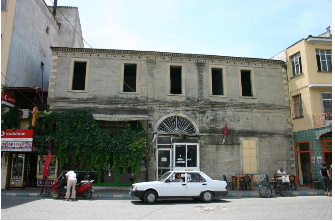
Şekil 15 - Atatürk Caddesi'nden bir yerel mimari örneği

Seferihisar'a ana karakterini veren merkez alandaki çarpık yapılaşma ve özgün mimari mirasın yitirilmiş olması, “Yavaş Şehir” unvanına sahip olmada yer kimliği kurma üzerinde önemli bir engel oluşturmaktadır. “Yavaş Şehir” yaklaşımı kendi ölçütleri çerçevesinde bazı genel yaklaşımlar önerse de ana çerçeveye bağlı kalarak yere özgü modellerin geliştirilmesini önermektedir. Örneğin; Hersbruck ve Waldkirch kasabaları yer kimliği felsefelerini tarihi miraslarını koruma ve geliştirme üzerine kurarken İtalya'daki San Vincenzo kasabası, kentsel hizmetlerdeki kaliteyi artırma ölçütü üzerine yoğunlaşarak geliştirmiştir. Kültür mirası olmayan ya da mimari mirasını önemli ölçüde yitirmiş Seferihisar gibi yerleşimler için eldeki tarihi mirasın korunması, yeni yapılaşma ya da var olan kentsel dokunun iyileştirilmesinde ise sanal kimlik oluşturan taklitçi yaklaşımlar yerine kentsel kalitenin artırılması ilkesinin benimsenmesi en tutarlı yaklaşım olarak görünmektedir. 37