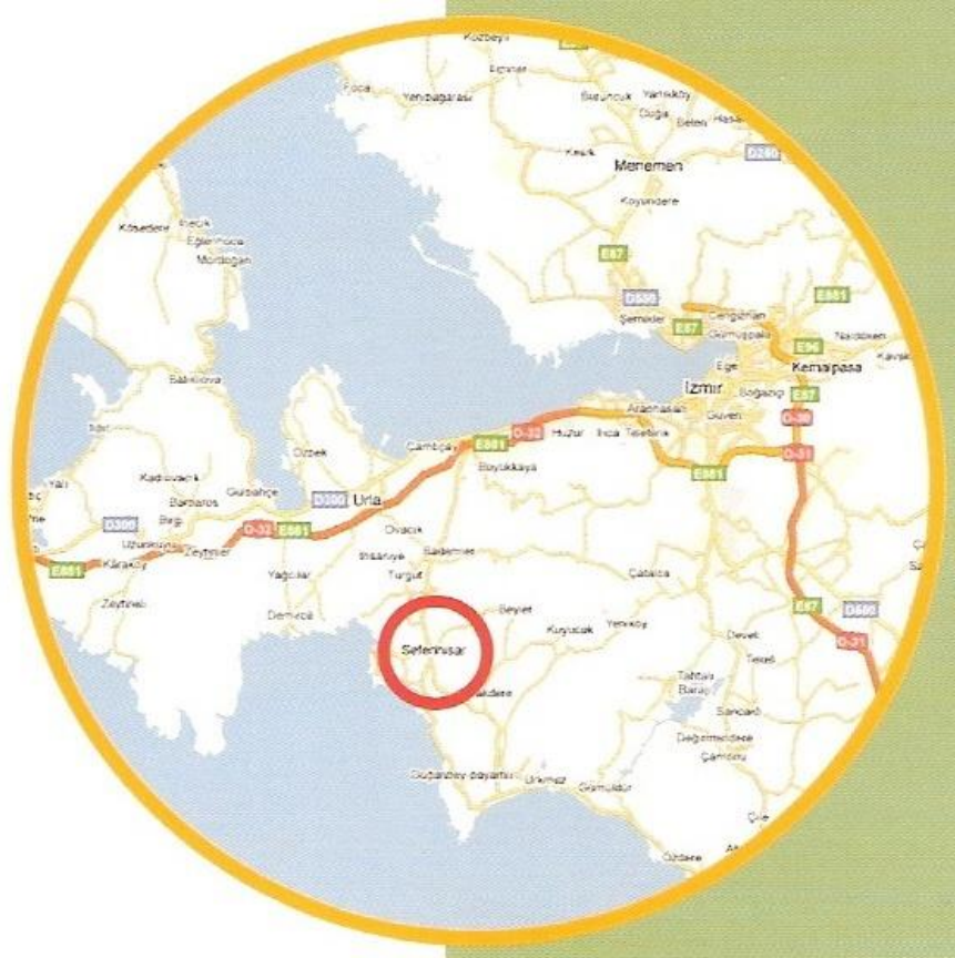
Şekil 13 - Seferihisar ve çevresi

2009 verilerine göre toplam nüfusu 25.308 olan ilçenin temel geçim kaynakları arasında tarım, hayvancılık ve kıyı turizmi yer almaktadır. Ürkmez ve Doğanbey - Payamlı olmak üzere iki belde ve dokuz köyden oluşur.