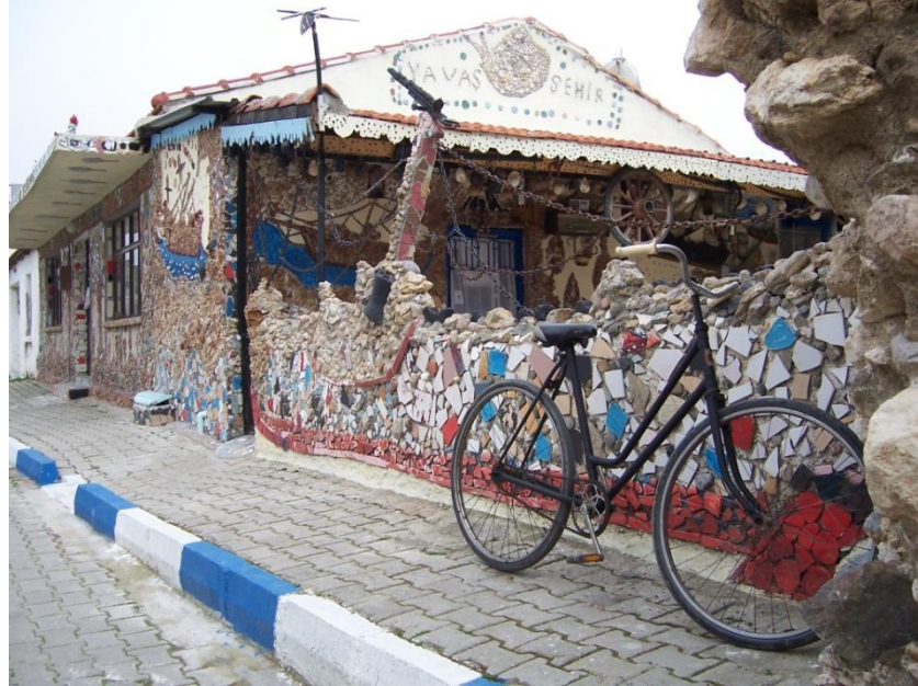
Şekil 27 - Sığacık'ta bir konut

Çeşitli konularda komisyonlar kurulmuştur. Gönüllülerin sayısı 100 kişiye ulaşmış durumdadır. Bu konular şu an için turizm, çevre, tarım, yiyecek – içecek, halkla ilişkiler ve eğitimidir.