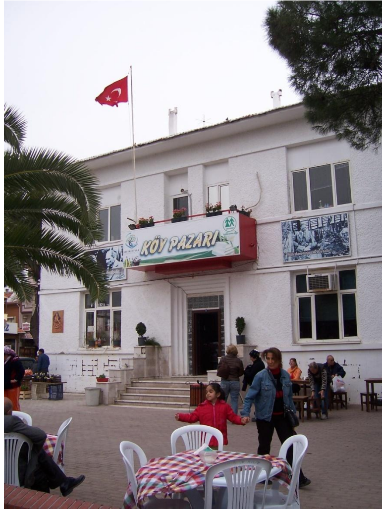
Şekil 14 - Seferihisar Köy Pazarı

Yavaş Şehir olma yolunda atılan ilk adım eski belediye binasının Köy Pazarı'na dönüştürülerek köylülerin ücret ödemediği tezgâh açıp ürünlerini satabilmeleri için bir pazar yeri olarak düzenlenmesidir. Bina içindeki her oda kendi yerel ürünlerini satmaları için bir köye verilmiş, bazı odalarda da örgü, resim, seramik gibi alanlarda kurslar düzenlenmeye başlamıştır. Bina önündeki açık alan da pazar yeri olarak hizmet vermektedir. Bu uygulama sonucunda köylülerin ürün satışları ve buna bağlı olarak da üretimleri artmıştır. Böylelikle yerel üreticinin aracısız halkla buluşabildiği, yerleşimin ekonomik anlamda sürdürülebilirliğini destekleyen bir ortam yaratılmıştır.