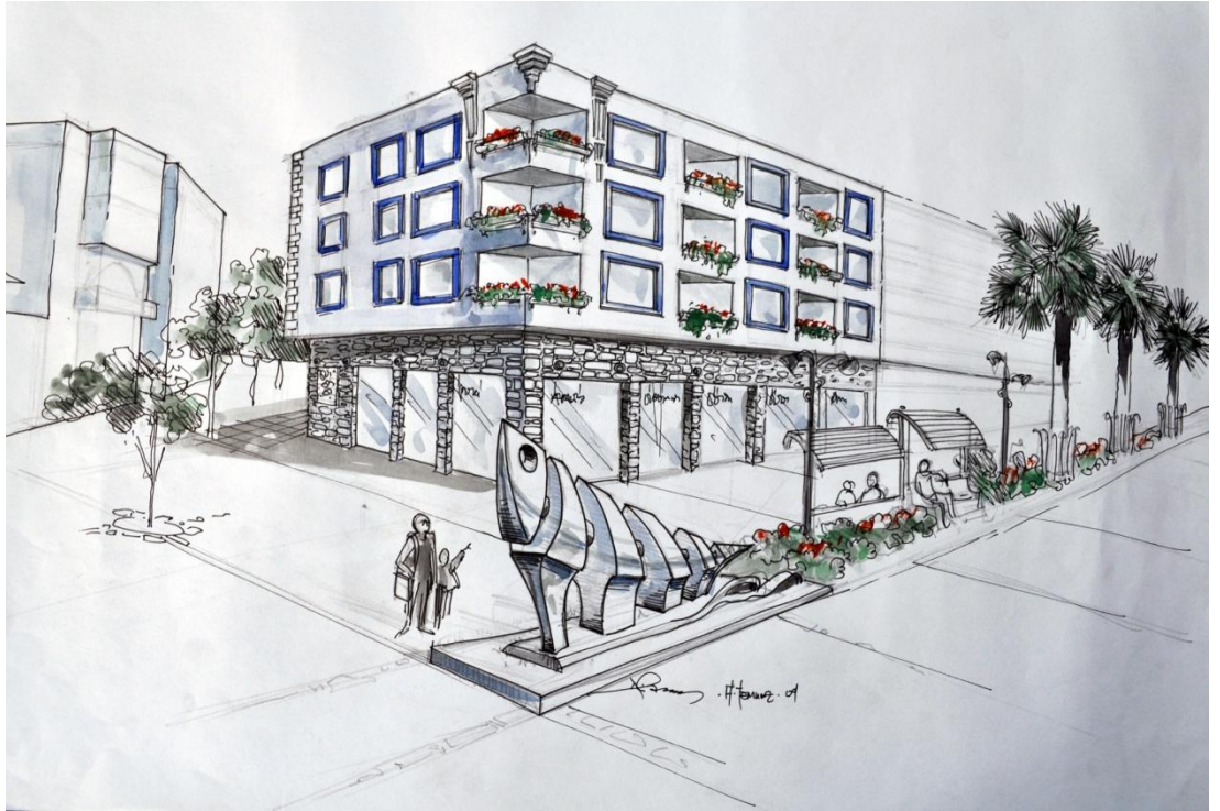
Şekil 16 - 17 - Atatürk Caddesi'nden bir yapı ve onun için yapılmış eskiz çalışması

Ege ve Yaşar Üniversiteleri'yle görüşmeler yapılmış olup rölöve ve restorasyon çalışmalarına destek olmaları istenmiştir. Öğrenciler staj veya ödev kapsamında cephe rölöveleri çıkarmaya başlamıştır.