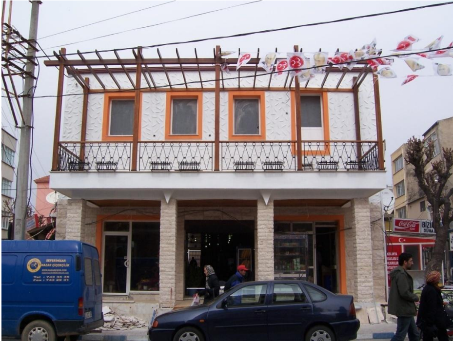
Şekil 19 - Eski Belediye Pasajı yenileme sonrası