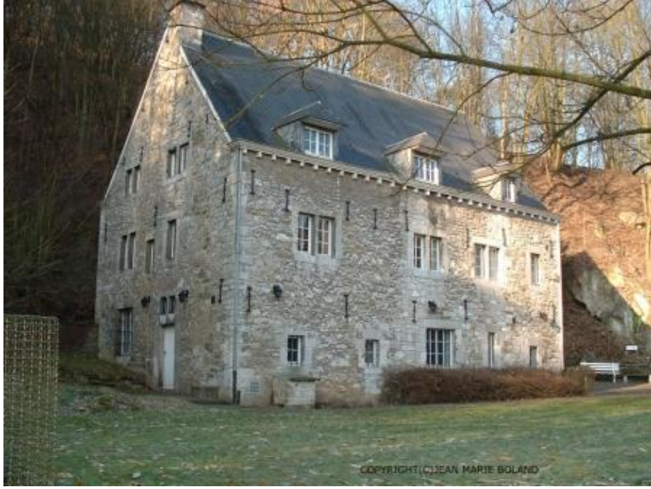
Şekil 4 - Chaudfontaine

oldukları sosyal çevre ve kentsel gelişim gibi her türlü konuda yaşamsal kaliteyi göz önünde bulundurur” şeklinde açıklamaktadırlar: Her kentin siyasi kararlılıkla bir Cittaslow olabileceğini ancak gerekli düzenlemeler için finansal durumunun uygun olması gerektiğini belirtmiştir. Çabalarının ve gayretlerinin süreceğini özellikle yavaş yemek konusunda daha çok çalışmaların gerektiği söylenmiştir. 22