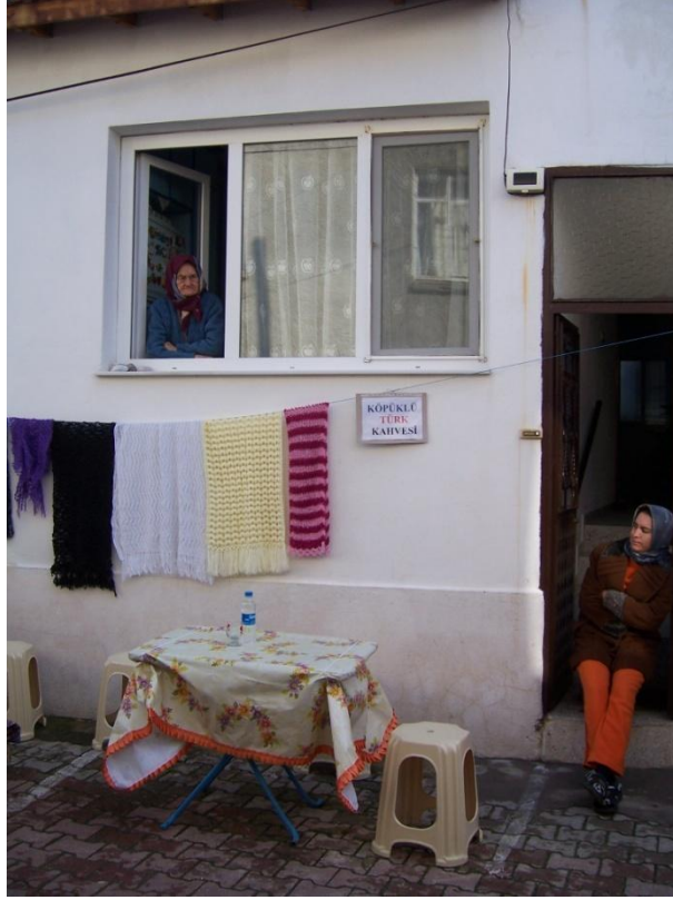
Şekil 31 – Sığacık'ta bir konut, sakinlerin konukseverliğine örnek