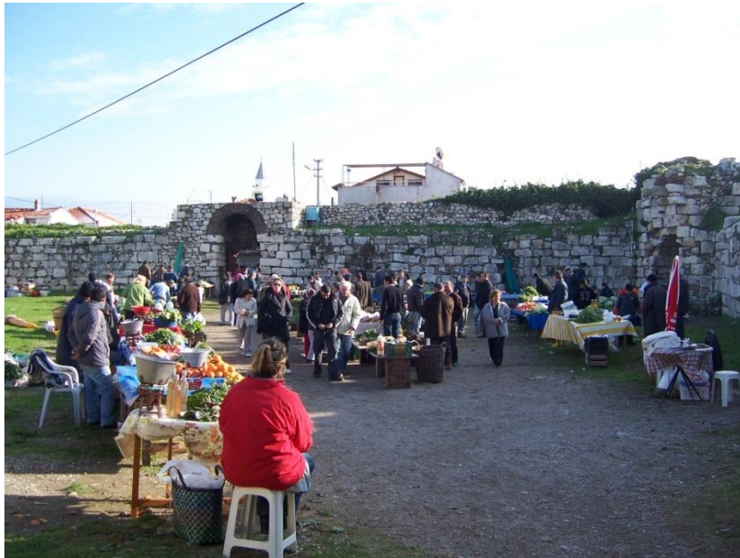
Şekil 32 – Sığacık Kaleiçi'nde pazar