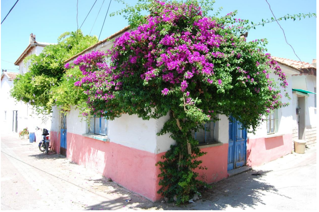
Şekil 21 - Sığacık sokaklarından bir görüntü

Alanda korunacak yapılar dışında, boş ve boşalacak parsellerde yapılaşacak binaların taban alanı büyüklükleri mevcut kullanım fonksiyonlarına göre farklılaştırılmıştır. Buna göre sit alanı genelinde taks değerleri hesaplanarak oluşturulan yapı adalarının “ada ortalama taks (A.O.T) değerleri” konut kullanımının yoğun olduğu bölgede 0,50, ticari kullanımın yoğun olduğu bölgede 1,00 olarak belirlenmiştir. Zaman içinde bölgede koruma amaçlı imar planı hazırlanmadan yeni yapılaşmaya imkân tanınmamasının sonuçları olarak parsellerin ana binalarına yapılan ek bina, müştemilat, 2. bina hatta 3. bina şeklinde gözlenen ilaveler, parsellerin özgün yapı yoğunluklarını geleneksel doku kimliğinden uzaklaşılmasına neden teşkil edecek ölçüde arttırdığından, A.O.T değeri hesaplanırken göz ardı edilmiştir. Buna göre yeni yapılaşmaya gidilecek parsellerin 1/1000 Koruma Amaçlı İmar Planı Plan Notlarında belirtilen yapılaşma koşullarına göre inşa edileceklerdir.