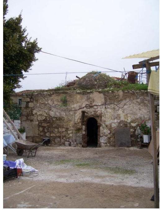
Şekil 29 – Sığacık Hamamı