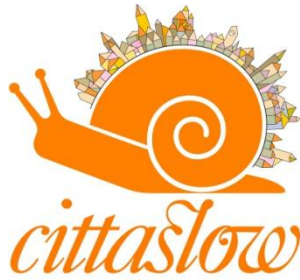
Şekil 1 – Cittaslow logosu

"Yavaşlık" felsefesi ulusal sınırları oldukça hızlı geçmiştir. Yaşam kalitesine erişme ve keşfetme, daha sakin tempoyla yaşama dileği Cittaslow'u tüm Avrupa'ya tanıtmıştır. Böylece somut adımlarla iyi yemek, kaliteli ağırlama, hizmet ve kentsel alanda birlikte tecrübe kazanmak için bir araya gelen uluslararası bir ağ olarak doğan Cittaslow ağı şu anda 19 ülkede mevcuttur: Avustralya, Avusturya, Belçika, Danimarka, Almanya, Hollanda, İtalya, Yeni Zelanda, Norveç, Portekiz, Polonya, Güney Kore, İspanya, İsveç, İsviçre, Birleşik Krallık (İngiltere, İskoçya, Galler), Türkiye, A.B.D, Kanada