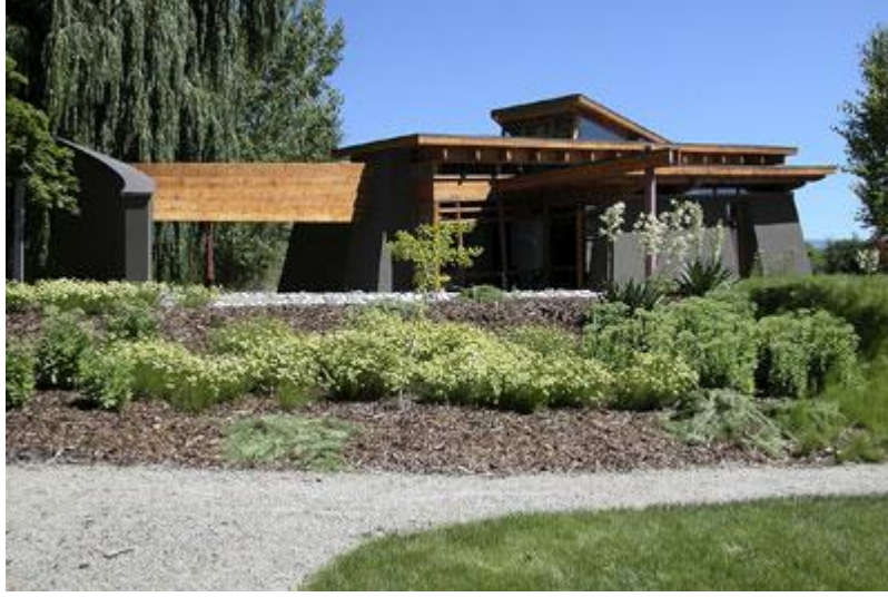
Şekil 7 - Chalmers Şapeli, Naramata

Cittaslow organizasyonu kendini dünya çapında daha iyi tanımalıdır. Farklı isimler altında benzer girişimler bulunmaktadır. Daha birleşmiş bir yol izlenmelidir.