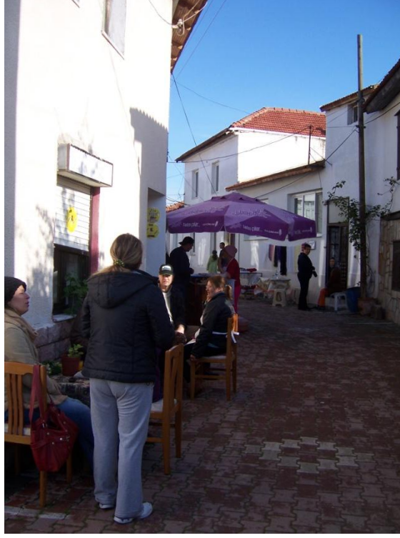
Şekil 33 – Sığacık Pazarı'ndan bir görüntü