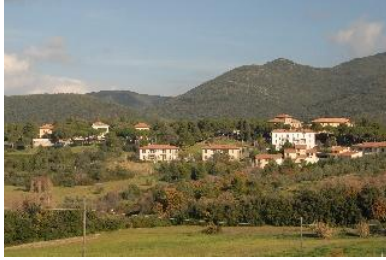
Şekil 9 - San Vincenzo

Cittaslow formölü genişletilebilir ancak her kentin büyük sorumluluk alması gereklidir. 27