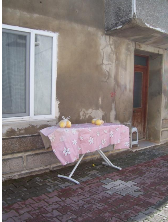
Şekil 34 – Sığacık Pazarı'ndan bir görüntü