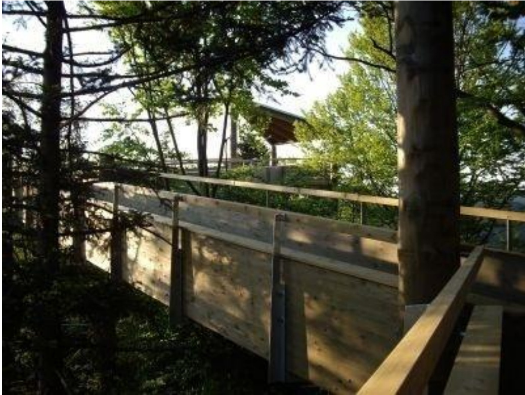
Şekil 12 - Waldkirch Orman Parkı

Ayrıca kent meydanında haftada iki gün yerel ürün pazarı kurulmaktadır. Araç trafiğine kapalı olan bu alanda mekâna ait olma hissini güçlendirerek sosyal sürdürülebilirliği 30 sağlamaktadır.