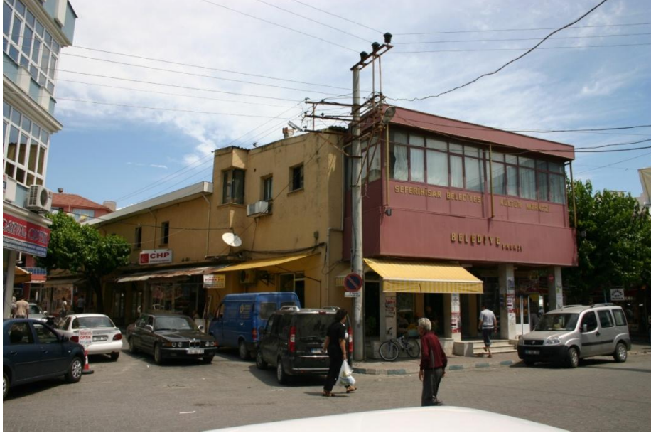
Şekil 18 - Eski Belediye Pasajı yenileme öncesi

İlk olarak halkı da teşvik edebilme amacıyla eski belediye pasajı prototip olarak cephe yenileme çalışmalarıyla düzenlenmiştir. Söveli pencereler, ferforje parmaklıklar ve çiçeklikler koyulmuş, çubuk desenli tenteler eklenmiştir. Bina kültür merkezi olarak düzenlenmiştir. Cadde üzerindeki diğer bina cepheleri de benzer şekilde belediye tarafından bedelsiz olarak yenilenecektir.