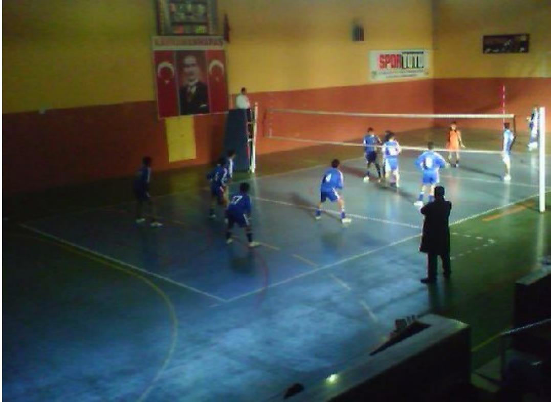
Resim 2. Batıpark Kapalı Spor Salonu, Spor Alanı.