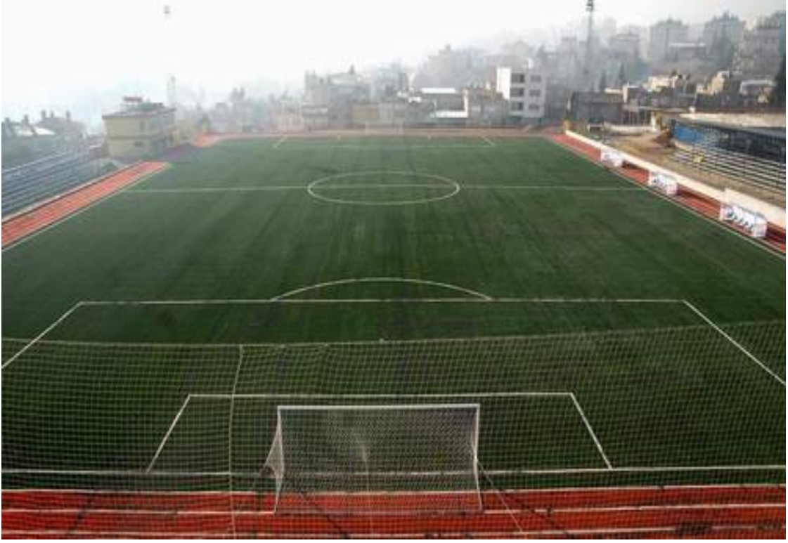
Resim 11. Çevre Düzenlemesi Yapılan ve Suni Çim Çalışmaları Biten Batıpark Futbol Sahası