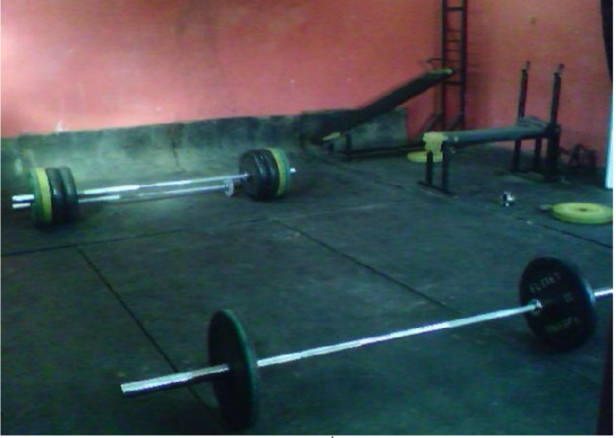
Resim 5. Batıpark Kapalı Spor Salonu İçinde Yer Alan Halter Salonu.