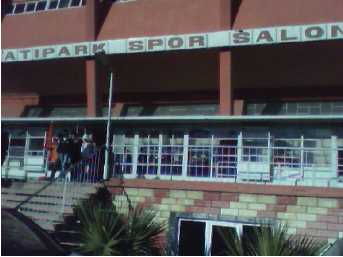
Resim 1. Batıpark Kapalı Spor Salonu Dış Görünüm