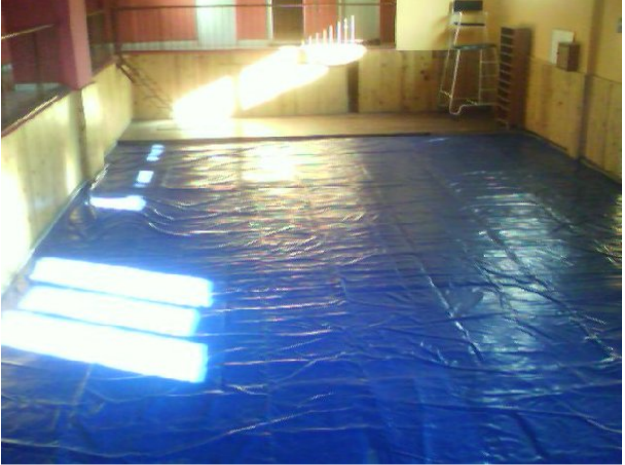
Resim 13. Batıpark Kapalı Spor Salonu İçinde Olan Dikdörtgen Formlu Judo Alanı.