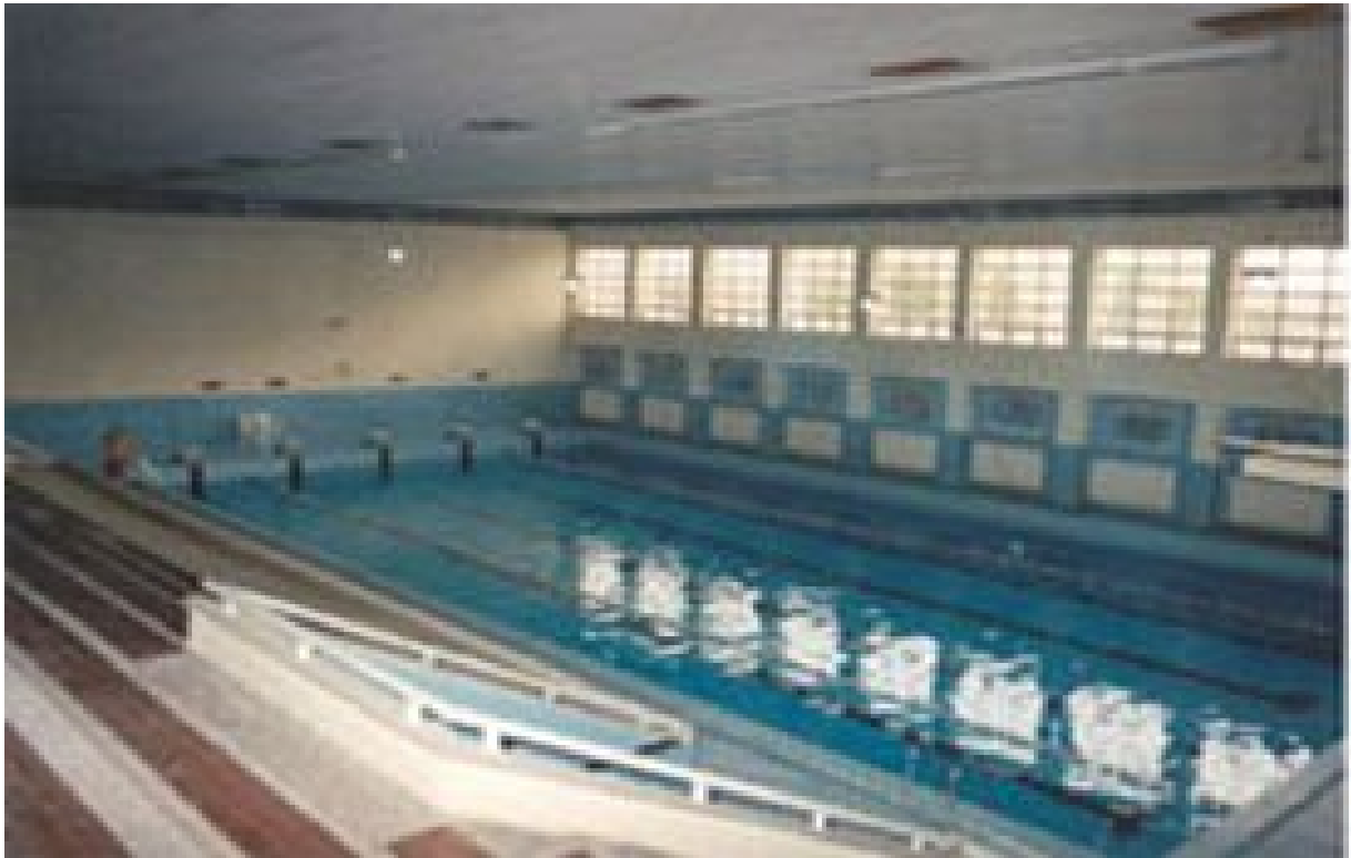
Resim 20. Kapalı Yüzme Havuzu.