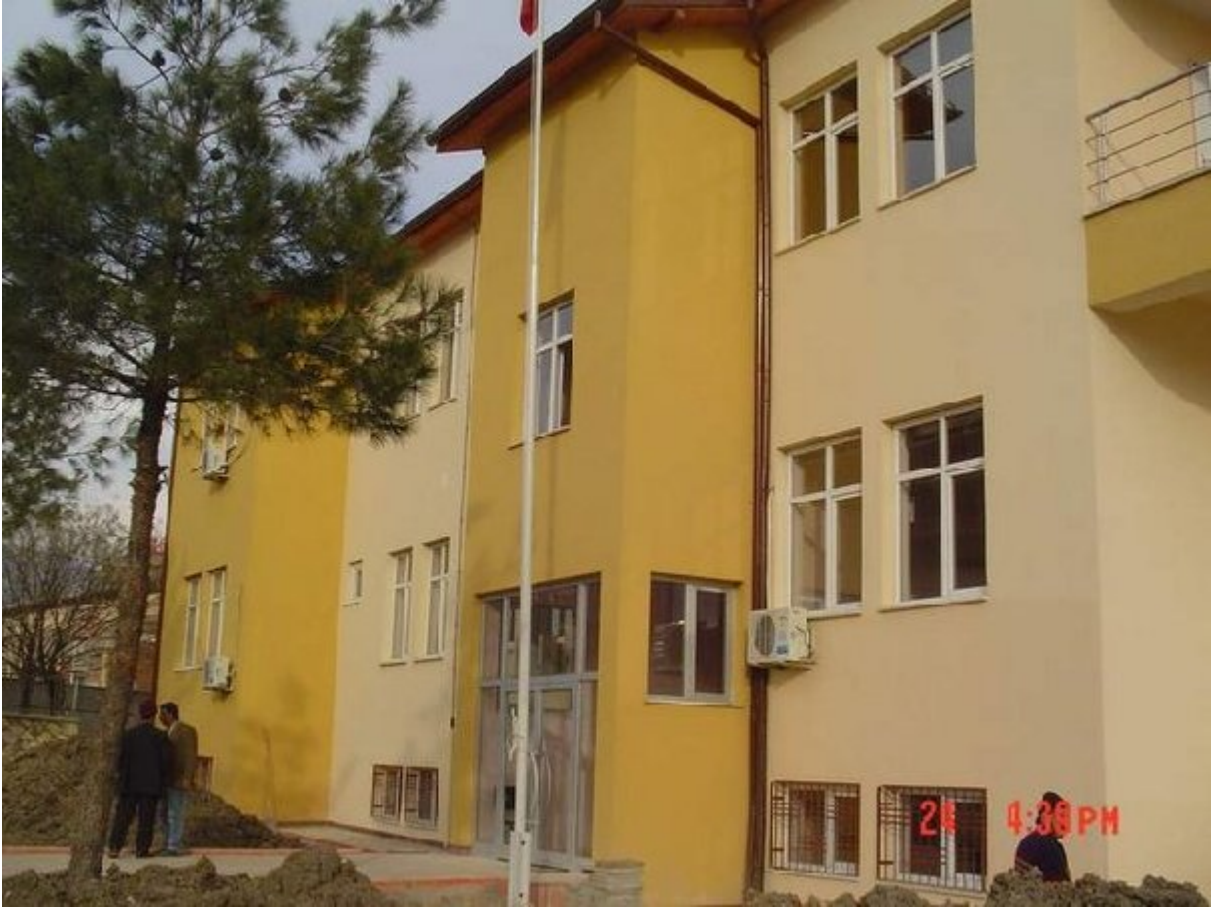
Resim 21. Gençlik Merkezi ve İdari Bina.