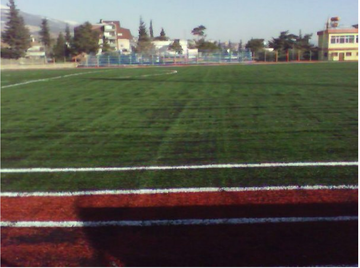
Resim 9. Batıpark Futbol Sahası.