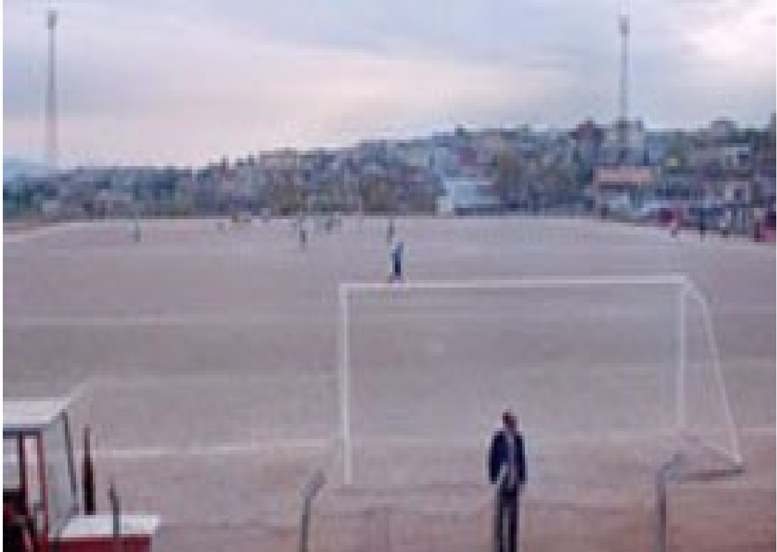
Resim 12. Batıpark Futbol Sahasının Eski Görünümü.