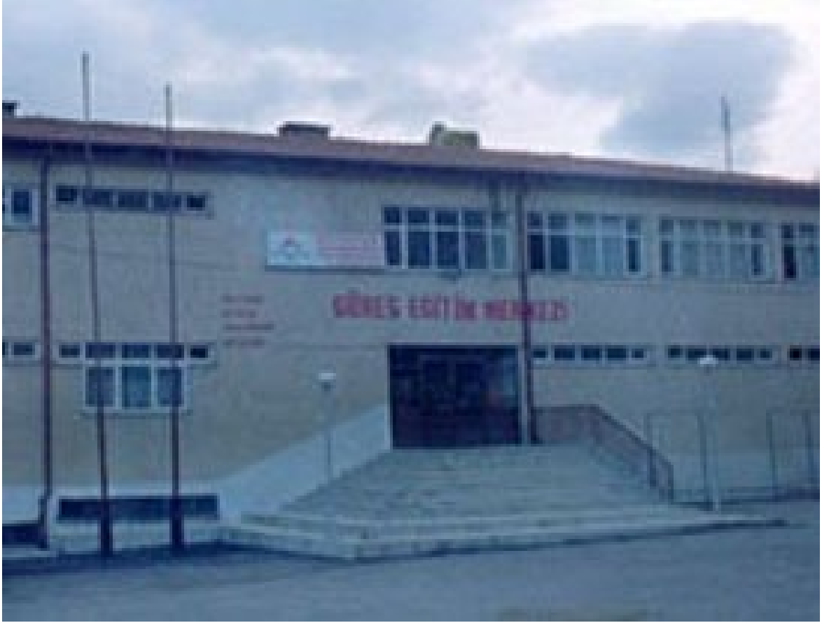
Resim 17. Güreş Eğitim Merkezi.