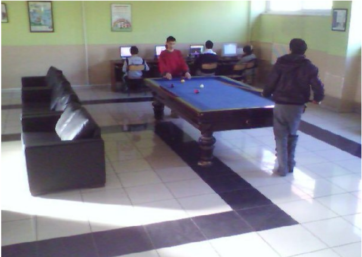
Resim 18. Güreş Eğitim Merkezi Sosyal Aktivite Alanı.