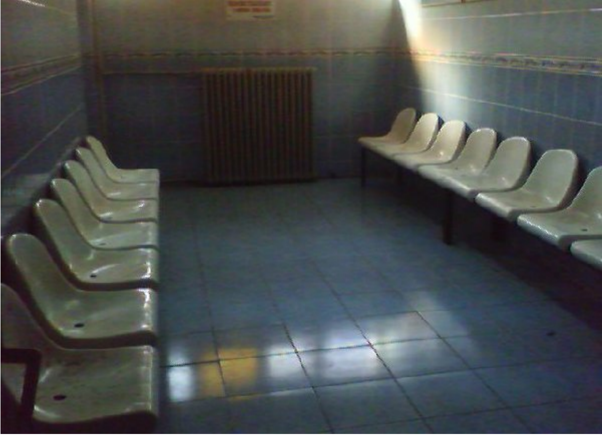
Resim 4. Batıpark Kapalı Spor Salonu Soyunma Odası.