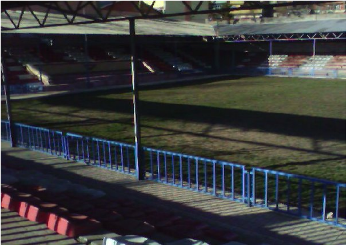
Resim 16. Karakucak Güreş Çim Sahası.