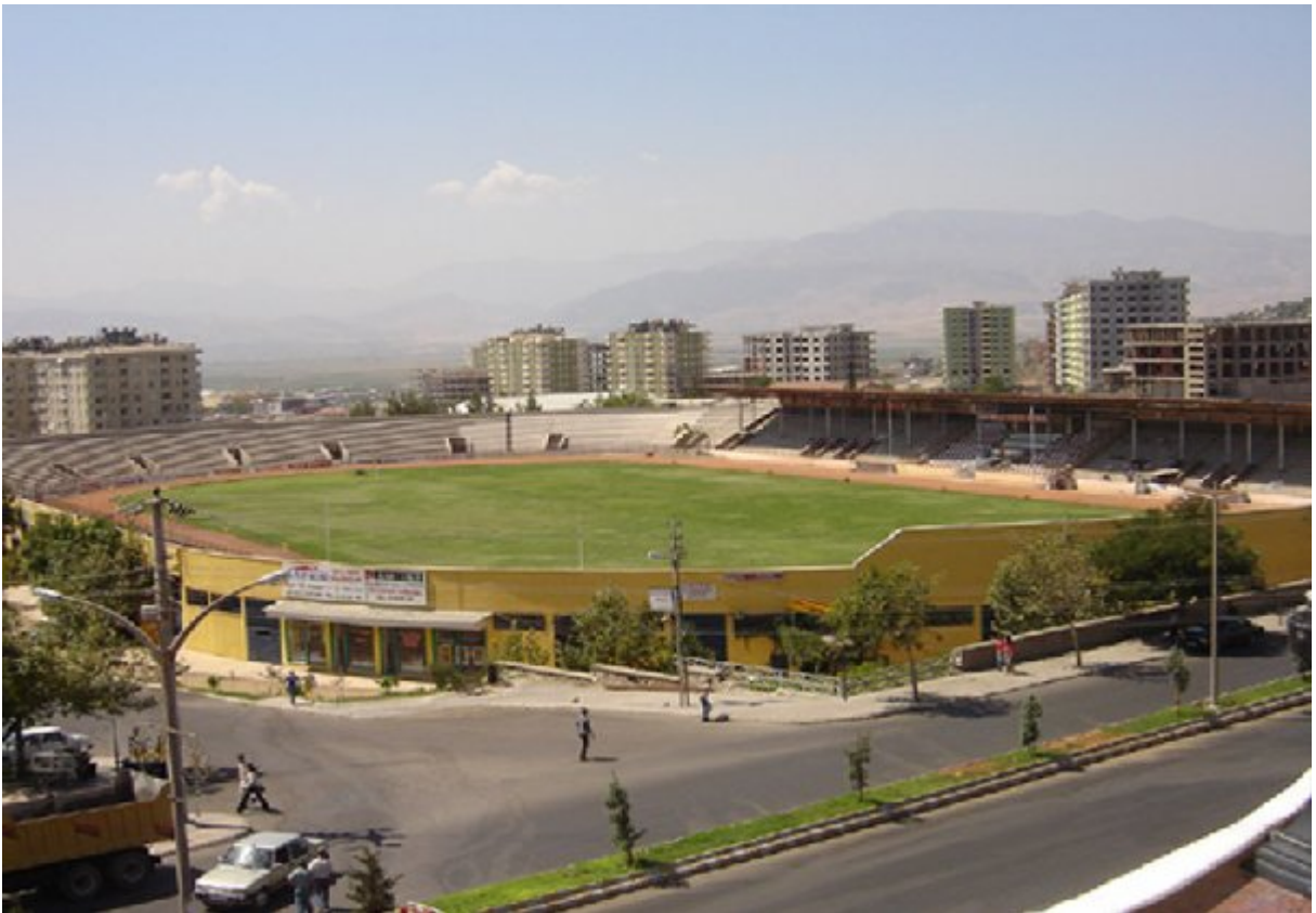
Resim 22. 12 Şubat Stadyumu.