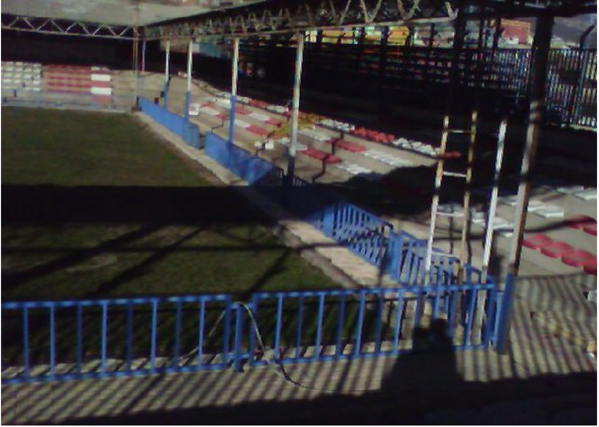
Resim 15. Karakucak Güreş Çim Sahası.