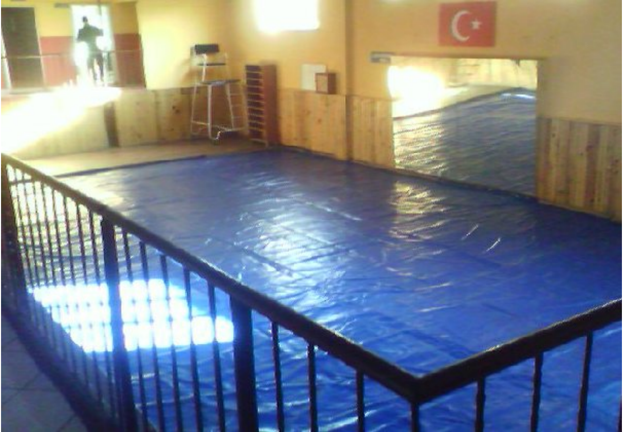
Resim 14. Batıpark Kapalı Spor Salonu İçinde Olan Dikdörtgen Formlu Judo Alanı.