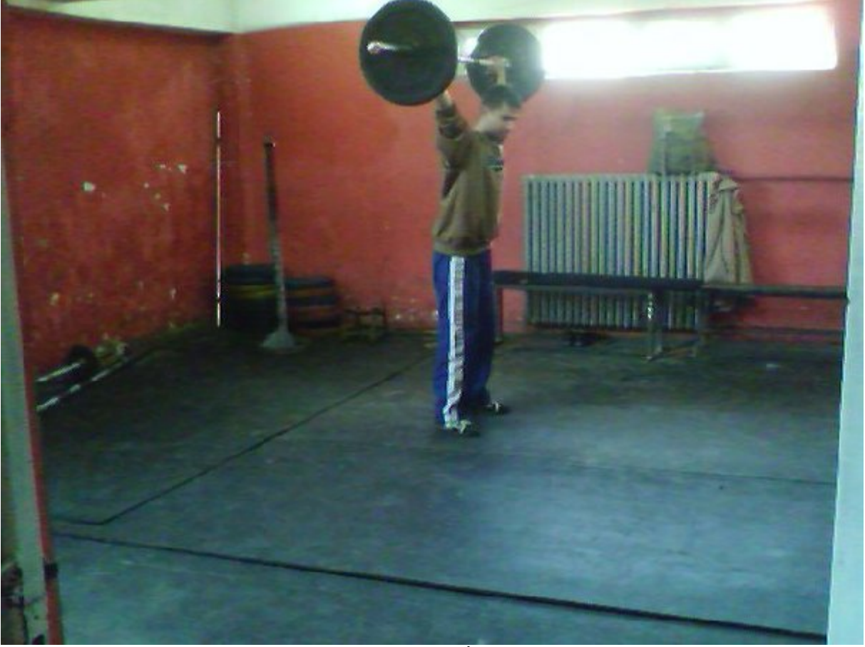
Resim 7. Batıpark Kapalı Spor Salonu İçinde Yer Alan Halter Salonu.