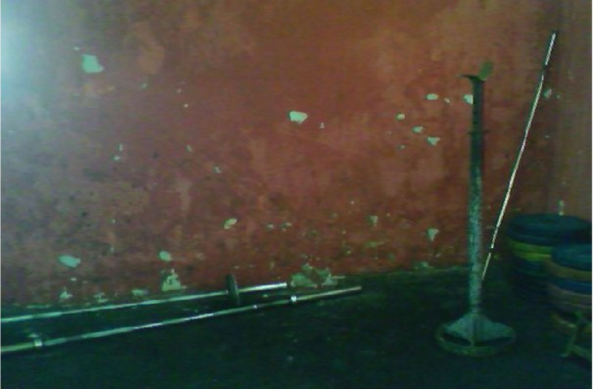
Resim 8. Batıpark Kapalı Spor Salonu İçinde Yer Alan Halter Salonu.