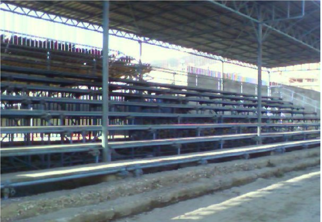
Resim 10. Batıpark Futbol Sahası Kapalı Tribünü.