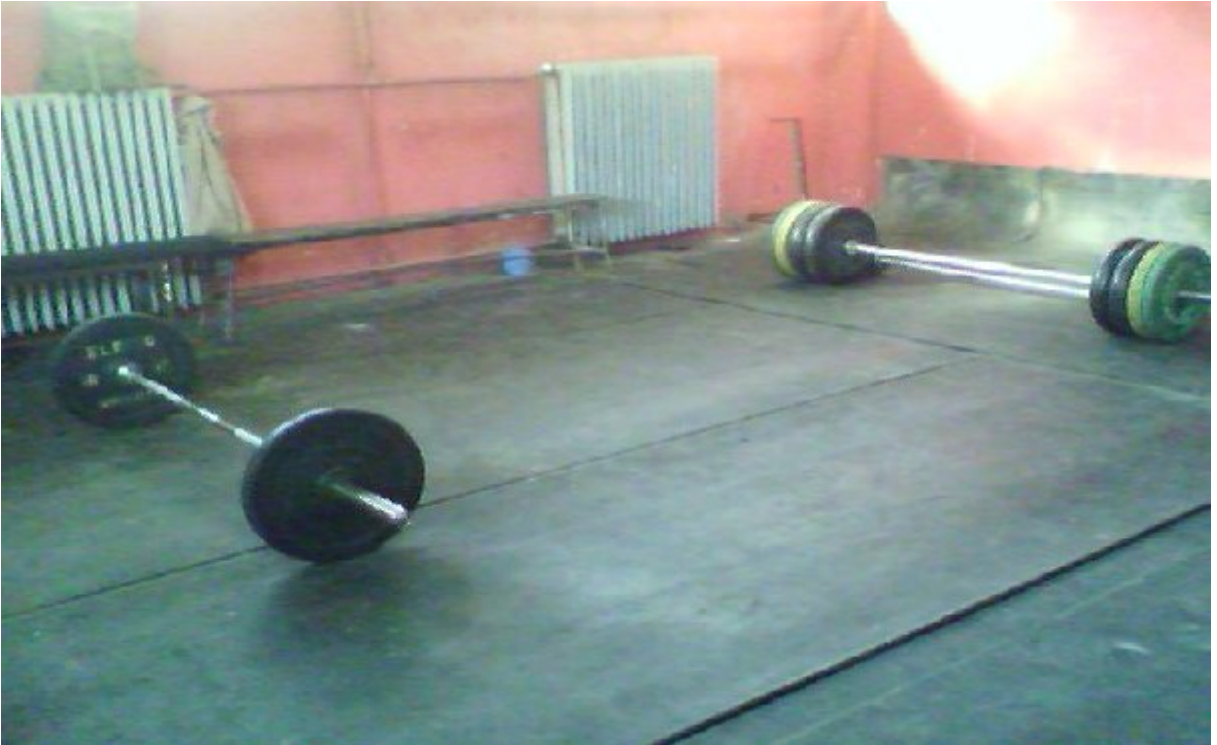
Resim 6. Batıpark Kapalı Spor Salonu İçinde Yer Alan Halter Salonu.