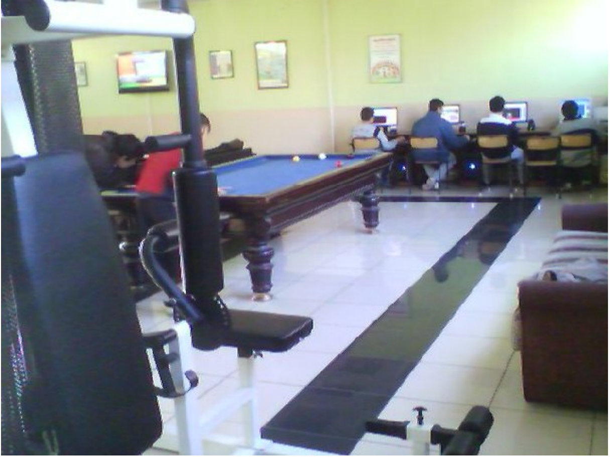
Resim 19. Güreş Eğitim Merkezi Sosyal Aktivite Alanı.