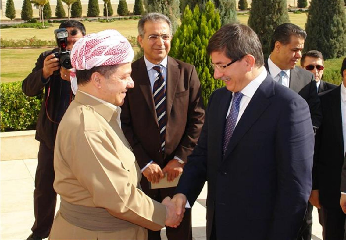
2010- Erbil, Barzani, Ahmet Davutoğlu. 24.1.2015