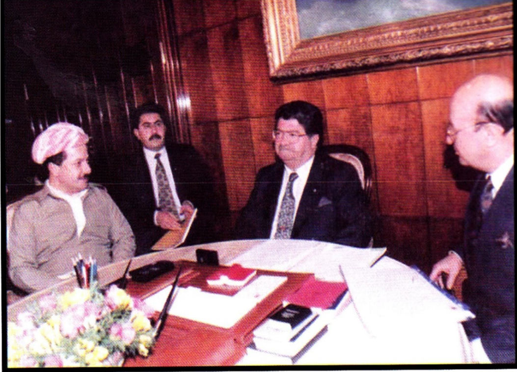
1992 -Türkiye, Soldan Sağa: Mesut Barzani, Hoşyar Zebari, Torgüt Özal, Kaya Topry (Dizai, 2013, III:499)