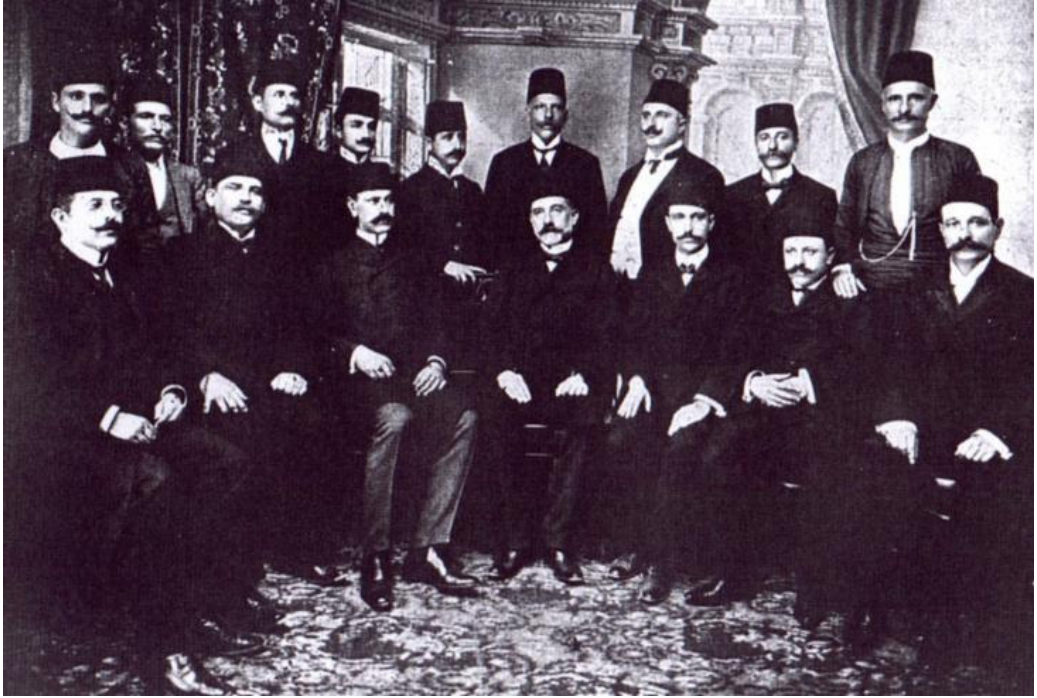
GİRİT MECLİSİ MÜSLÜMAN AZALARI