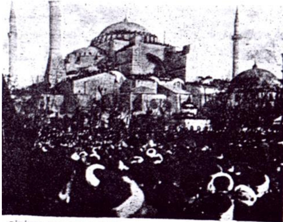
GİRİT'in Yunanistan'a ilhakını protesto etmek için Sultan Ahmed Meydanı'nda düzenlenen mitingden bir görünüş