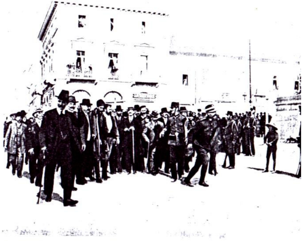
LE • CASUS BELLI • GRECO-TURC. Les députés crétois se rendant à la Chambre hellénique le jour de l'ouverture du Parlement, à Athènes.

GİRİT MİLLİ MECLİSİ RUM AZALARI YUNANİSTAN MECLİSİNE KATILMAYA GİDERKEN (14 EKİM 1912)