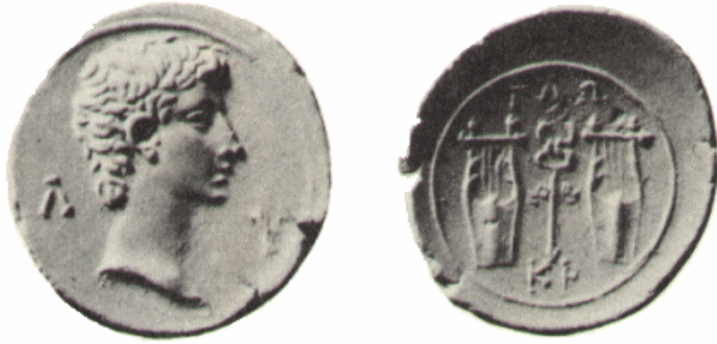
Sikke I: Augustus Dönemi Lykia Sikkesi

Ön yüz: Augustus'un portresi, sağında Λ ve solunda Υ harfleri (ΛΥ(KION))