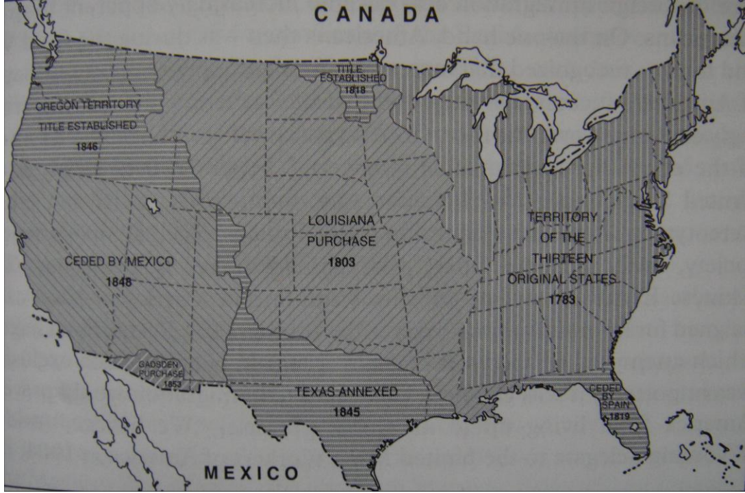
Harita 1: ABD'nin XIX. yy da kıta içi genişlemesi. 68

ABD 1844-1860 yılları arasında, çevresindeki diğer ülkelerin bağımsızlığını göz ardı ederek hızla yayılmıştır. 69 1836 yılında Meksika'ya karşı bağımsızlık savaşını kazanan Teksas, 1845 yılında ABD tarafından ilhak edilen ilk bağımsız devlet olmuştur. İngiltere ve ABD'nin hak iddia ettiği, bugünkü ABD'nin kuzeybatı köşesini oluşturan, Oregon bölgesi İngiltere ile yapılan diplomatik mücadele sonrasında 1846 yılında ABD'ye katılmıştır. 1848 yılında ABD'nin kazandığı Meksika-ABD savaşı sonrası bu günkü Kaliforniya, Utah, Nevada, Arizona, Colorado, Yeni Meksika ve Wyoming eyaletlerinin olduğu bölge Meksika'dan alınmıştır. 70 Bu kadar geniş toprakların kendine katılması ABD yayılmasını tatmin etmemiş, hükümet çevrelerinde Meksika'nın tamamen ilhak edilmesi tartışılmıştır. 71