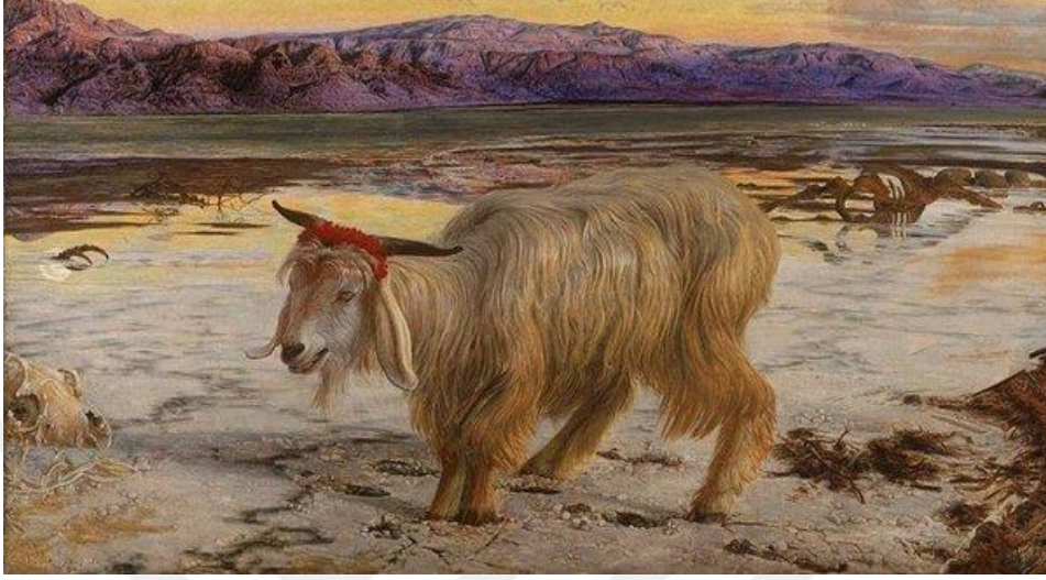
Resim 1.1: Günah Keçisi