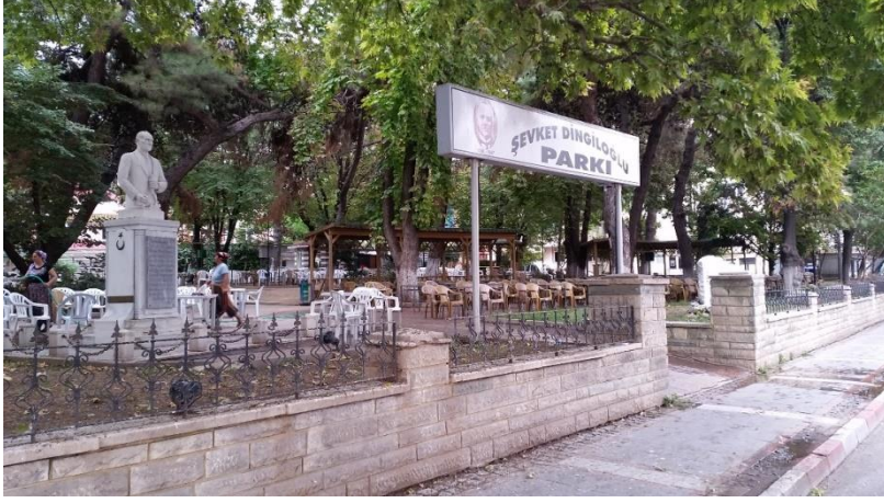
Resim 73: Şevket Dingilođlu Parkı (Kocahıdır Mahallesi)