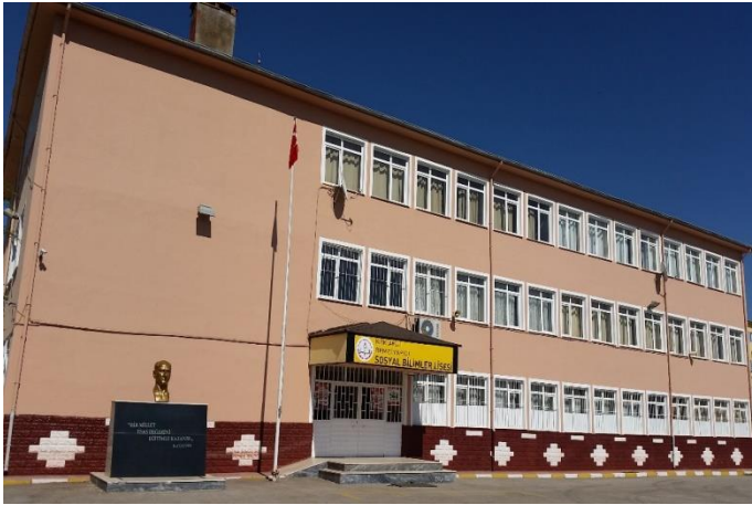
Resim 33: Remzi Yapıcı Sosyal Bilimler Lisesi, Anadolu Öğretmen Lisesi (Bademlik Mahallesi)