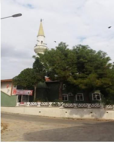
Resim 89: Karahıdır Mahallesi Cami (Karahıdır Mahallesi)