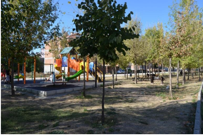
Resim 68: Nasrettin Hoca Park / Çocuk Oyun Alanı (Bademlik Mahallesi)