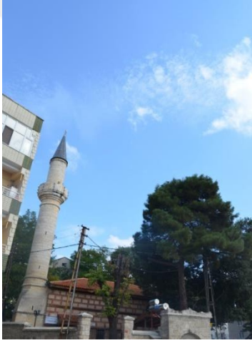
Resim 95: Sultan Beyazıd Cami (Kocahıdır Mahallesi)