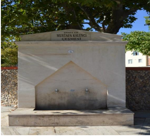
Resim 112: Şehit Er Mustafa Kalenci Çeşmesi (Bademlik Mahallesi)