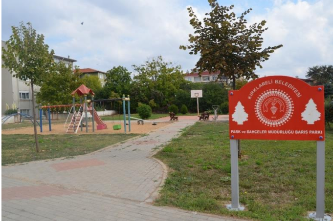
Resim 49: Barış Parkı / Çocuk Oyun Alanı / Spor Aletleri (Karacaibrahim Mahallesi)