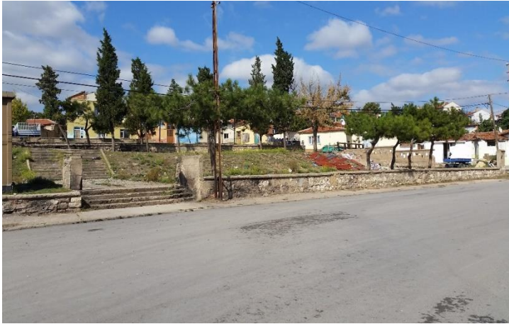
Resim 75: Vahit Lütfü Salcı Parkı (Kocahıdır Mahallesi)