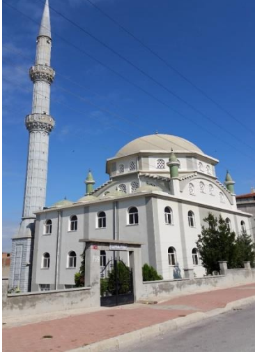
Resim 91: Kemal Canlı Cami (Akalar Mahallesi)