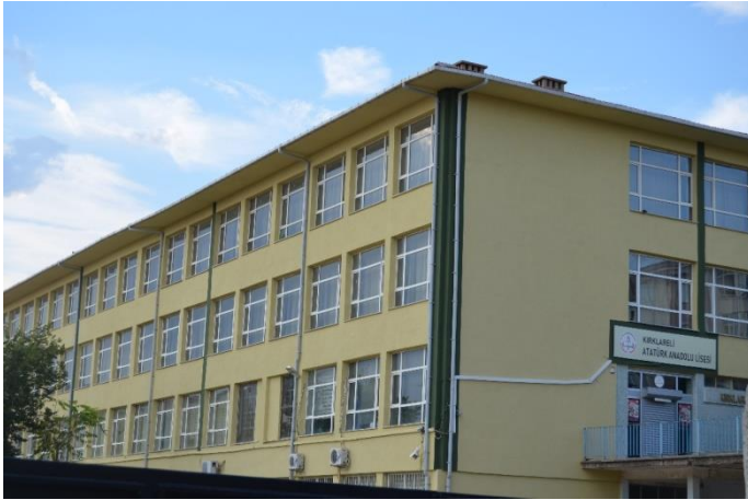
Resim 21: Kırklareli Atatürk Anadolu Lisesi (Demirtaş Mahallesi)