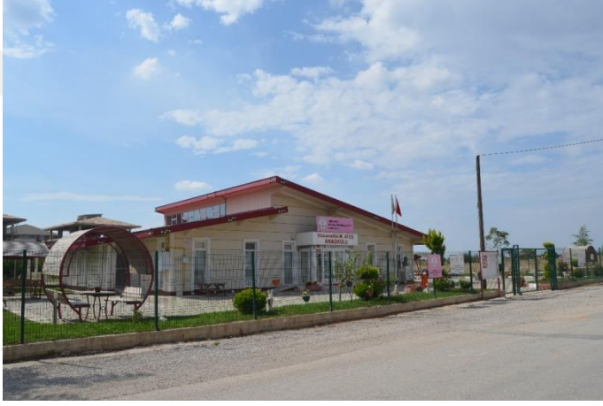
Resim 14: Hüsamettin Mehmet Ateş Anaokulu (İstasyon Mahallesi)