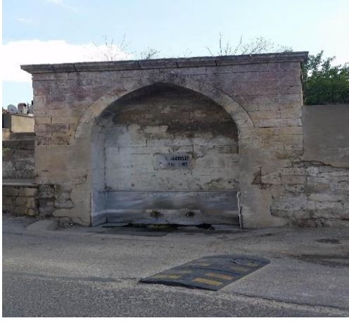
Resim 103: Gerdanlı Çeşme (Doğu Mahallesi)