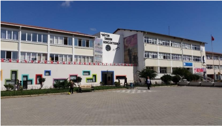
Resim 3: Atatürk İlkokulu / Ortaokulu (Karacaibrahim Mahallesi)