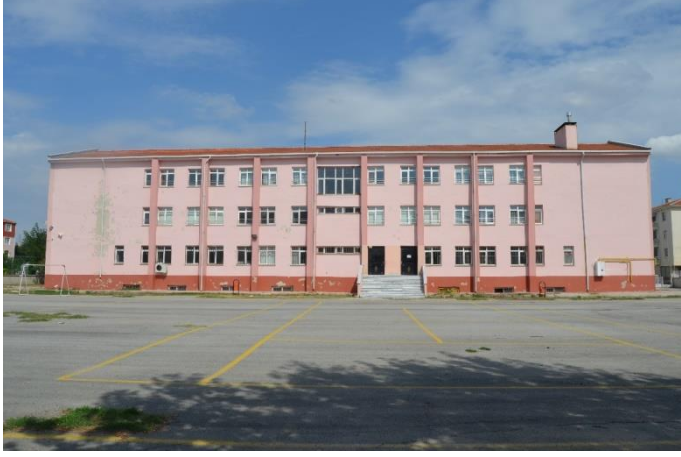
Resim 10: Gazi Mustafa Kemal İlkokul (İstasyon Mahallesi )