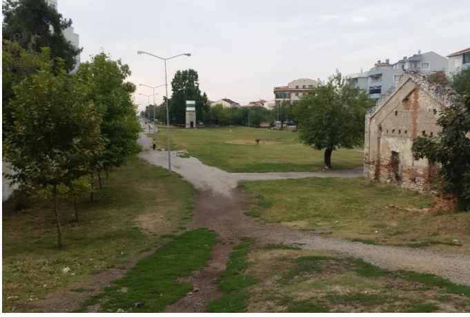
Resim 59: Festival Yeşil Alan (İstasyon Mahallesi)