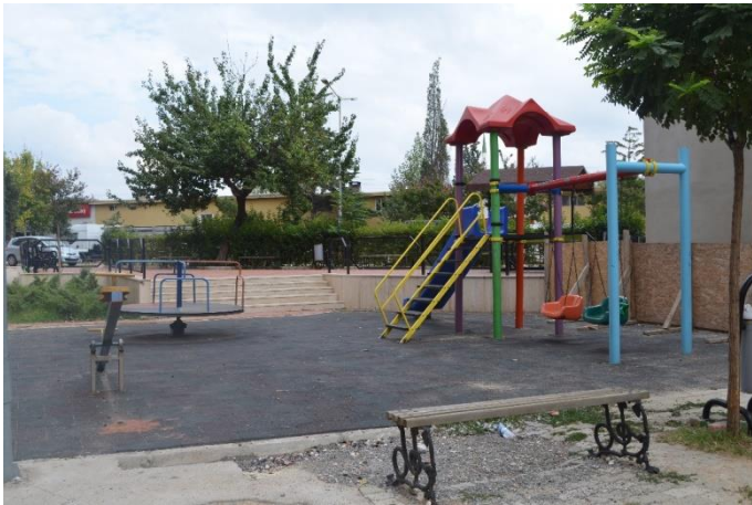
Resim 72: Siteler Parkı / Çocuk Oyun Alanı / Spor Aletleri (Karacaibrahim Mahallesi)