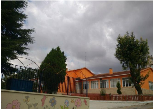
Resim 39: Ziya Gökalp İlkokulu (Demirtaş Mahallesi)