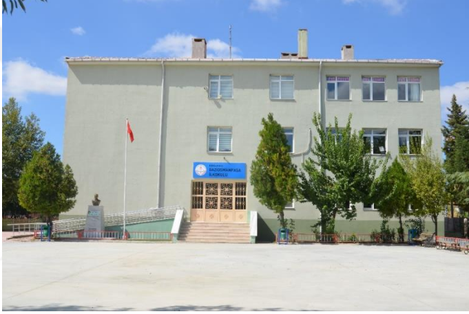
Resim 11: Gazi Osmanpaşa İlkokul (Bademlik Mahallesi)