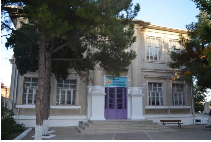
Resim 34: Tevfik Fikret Yatılı Bölge Ortaokulu (Yayla Mahallesi)