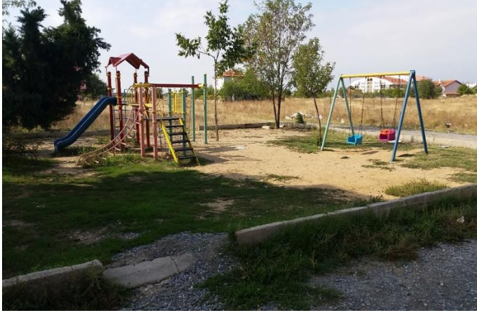
Resim 70: Poyraz Çocuk Oyun Alanı (Karakaş Mahallesi)