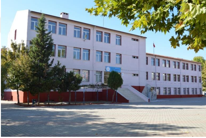
Resim 8: Fahri Kasapoğlu Ortaokul (Bademlik Mahallesi)