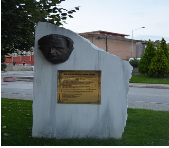
Resim 121: Mazhar Osman Anıtı (Demirtaş Mahallesi)