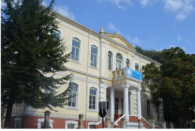
Resim 28: Kocahıdır İlkokulu (Kocahıdır Mahallesi)