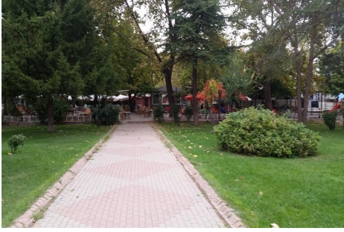
Resim 46: Atatürk Parkı (Karakaş Mahallesi)