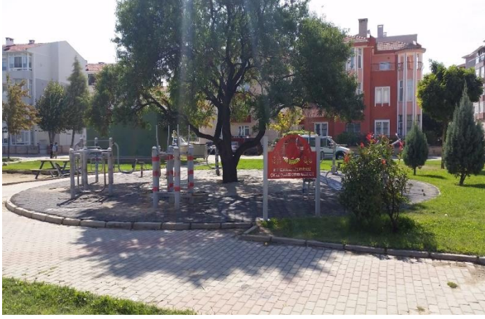
Resim 55: Çilek Parkı / Çocuk Oyun Alanı / Spor Aletleri (Karacaibrahim Mahallesi)