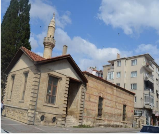
Resim 87: Karaca İbrahimbey Cami (Kocahıdır Mahallesi)