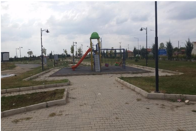
Resim 57: Dört Bacak Anıt Parkı / Çocuk Oyun Alanı (Karahıdır Mahallesi)