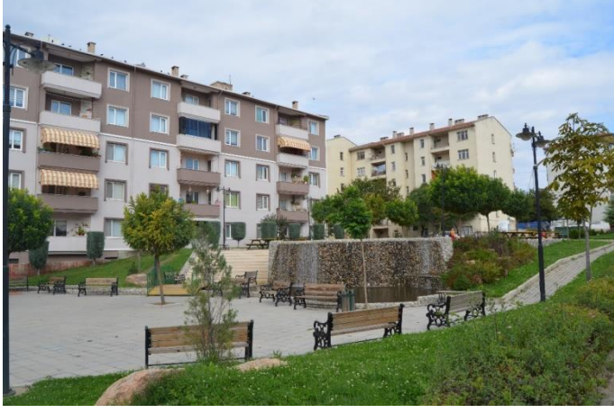
Resim 52: Cumhuriyet Parkı / Çocuk Oyun Alanı (Cumhuriyet Mahallesi)