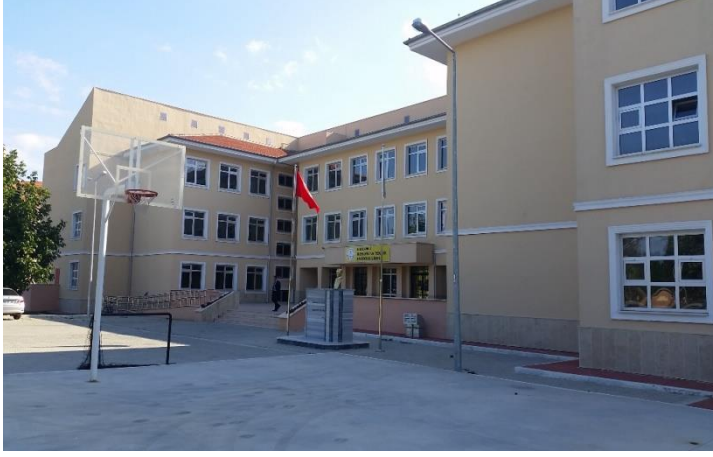
Resim 25: Kırklareli Mesleki ve Teknik Anadolu Lisesi (Pınar Mahallesi)