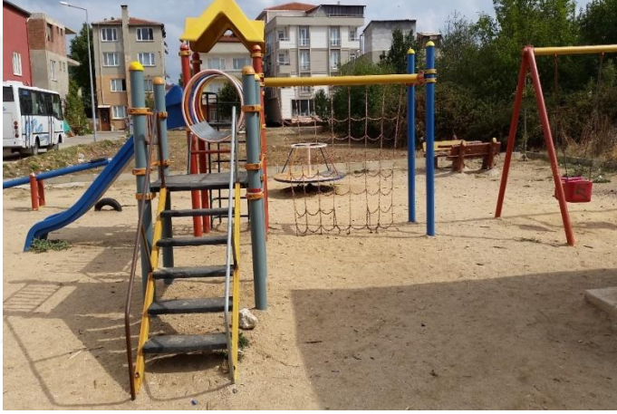
Resim 50: Barış Manço Çocuk Oyun Alanı (Karakaş Mahallesi)