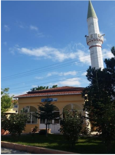
Resim 93: Köy Hizmetleri Cami (Pınar Mahallesi)