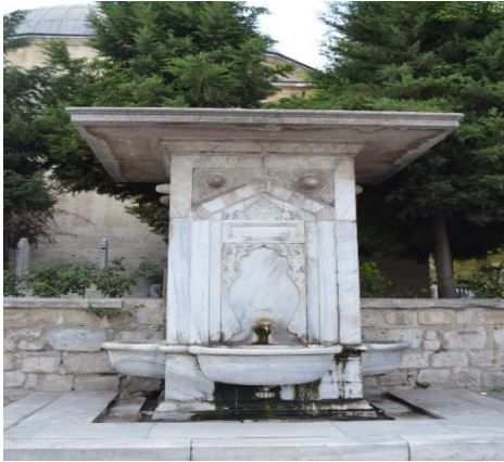
Resim 102: Büyük Cami (Alman) eşmesi (Demirtaş Mahallesi)