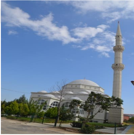
Resim 101: Yeni Sanayi Cami (Cumhuriyet Mahallesi)