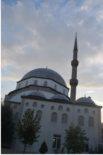
Resim 98: Timurtaşpaşa Cami (Demirtaş Mahallesi)