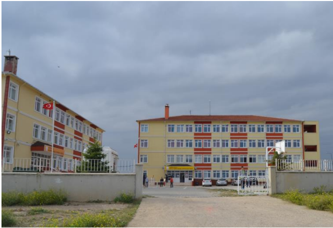
Resim 18: Kırklareli Spor Lisesi (Kocahıdır Mahallesi)