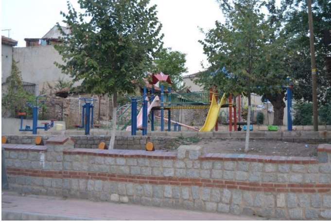
Resim 74: Taş Parkı / Çocuk Oyun Alanı / Spor Aletleri (Demirtaş Mahallesi)