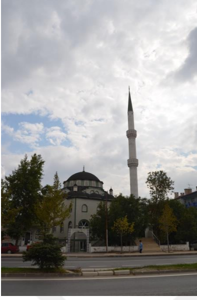
Resim 82: Bahriye Sultan Cami(Pınar Mahallesi)