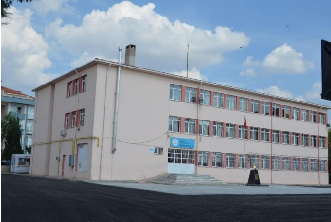
Resim 15: İstiklal Ortaokul (İstasyon Mahallesi)