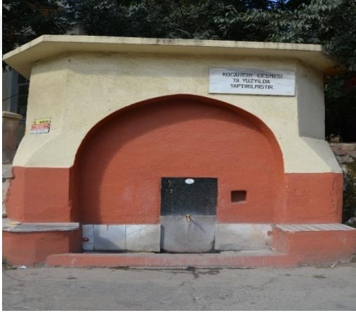
Resim 110: Kocahıdır Çeşmesi (Kocahıdır Mahallesi)