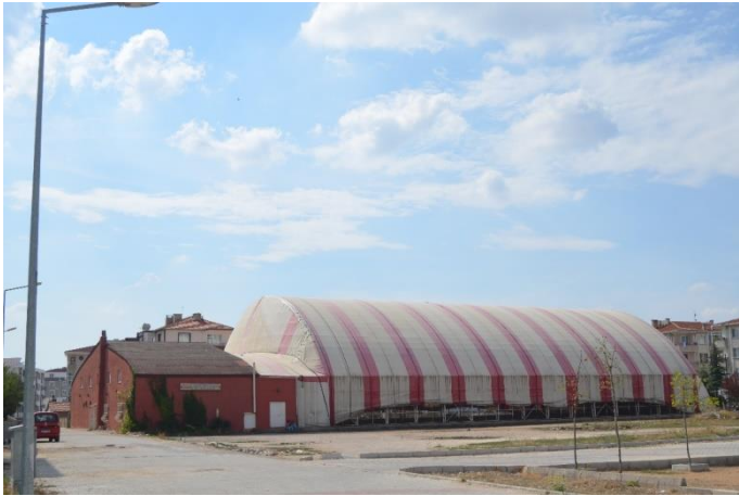
Resim 69: Özer Kapalı Spor Tesisleri (İstasyon Mahallesi)