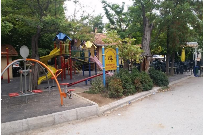
Resim 41: 150. Yıl Demiryolu Çocuk Oyun Alanı (İstasyon Mahallesi)