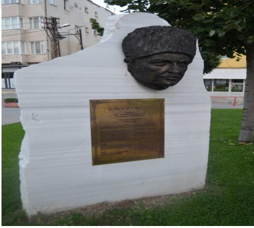
Resim 119: Fuat Umay Anıtı (Demirtaş Mahallesi)