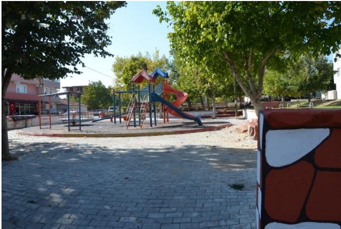
Resim 48: Bademlik Merkez Park / Çocuk Oyun alanı (Bademlik Mahallesi)