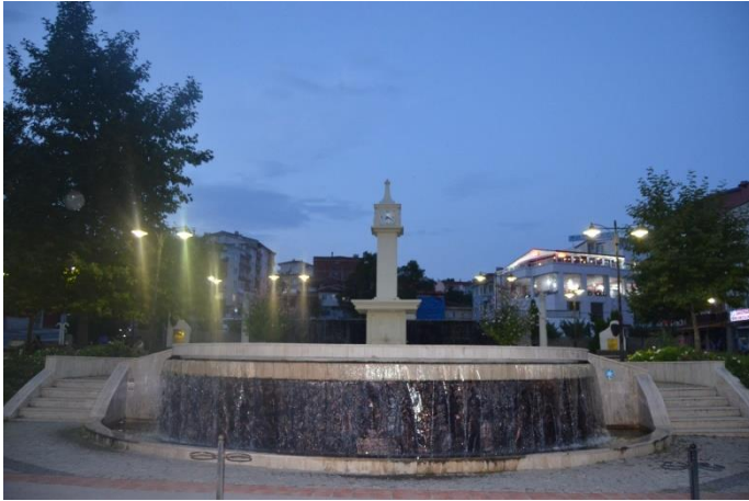
Resim 45: Anıt Parkı (Demirtaş Mahallesi)