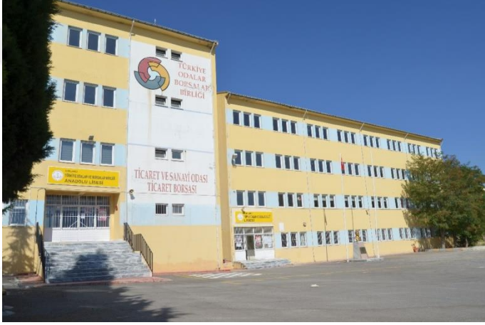
Resim 35: Türkiye Odalar ve Borsalar Birliği Anadolu Lisesi (Bademlik Mahallesi)