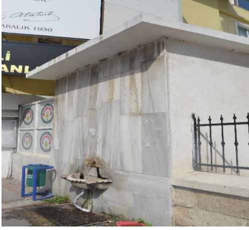
Resim 106: Kapan Çeşme (Karakaş Mahallesi)