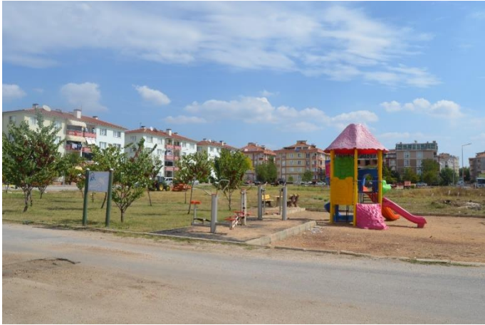
Resim 51: Bey Parkı / Çocuk Oyun Alanı / Spor Aletleri (İstasyon Mahallesi)