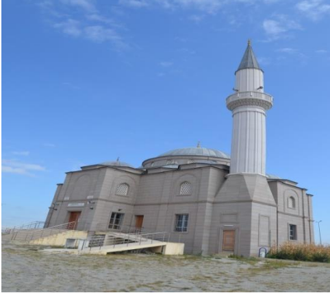
Resim 99: TOKİ Cami (Yayla Mahallesi)