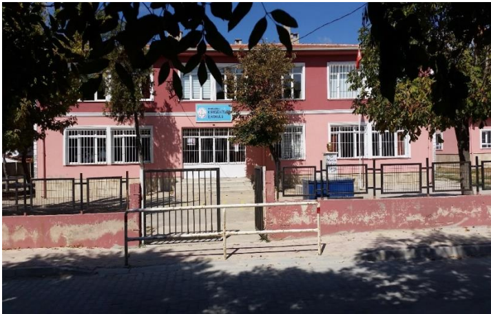
Resim 27: Kırkşehitler İlkokulu (Doğu Mahallesi)