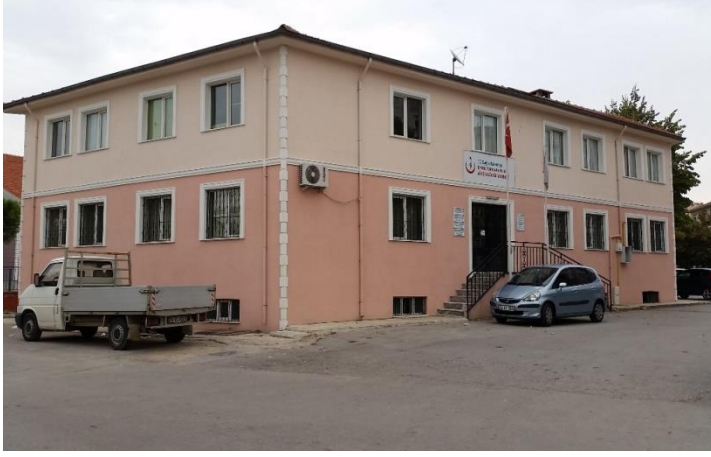
Resim 79: Emine Tuncan Merkez Sağlık Ocağı (Karakaş Mahallesi)