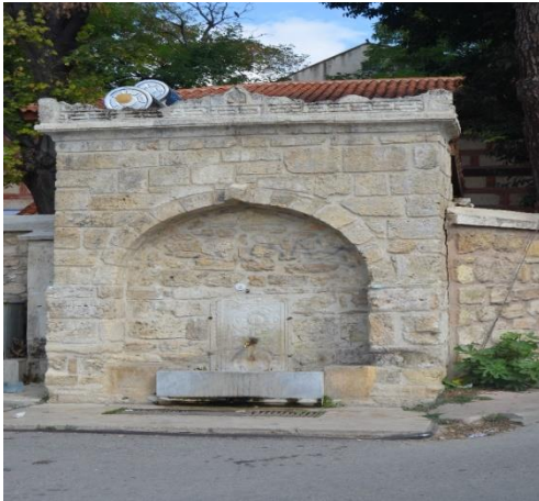
Resim 111: Paşa Çeşme (Kocahıdır Mahallesi)