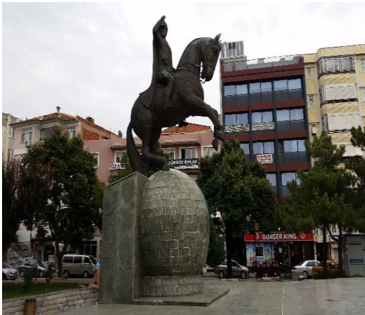
Resim 114: Atatürk Heykeli (Karakaş Mahallesi)