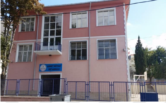
Resim 1: Ahmet Mithat Ortaokulu (Doğu Mahallesi)