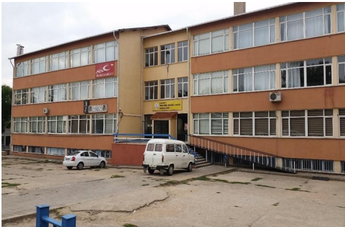
Resim 30: Mimar Sinan Mesleki ve Teknik Anadolu Lisesi (Karakaş Mahallesi)