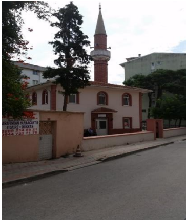
Resim 90: Karakaş Bey Cami (Karakaş Mahallesi)