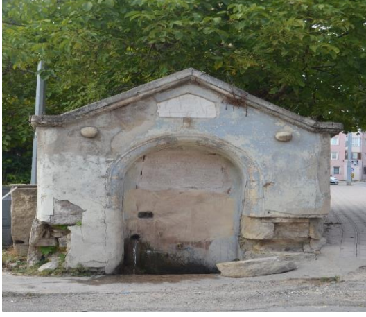
Resim 109 Kayyumoğlu Çeşme (Karacaibrahim Mahallesi)