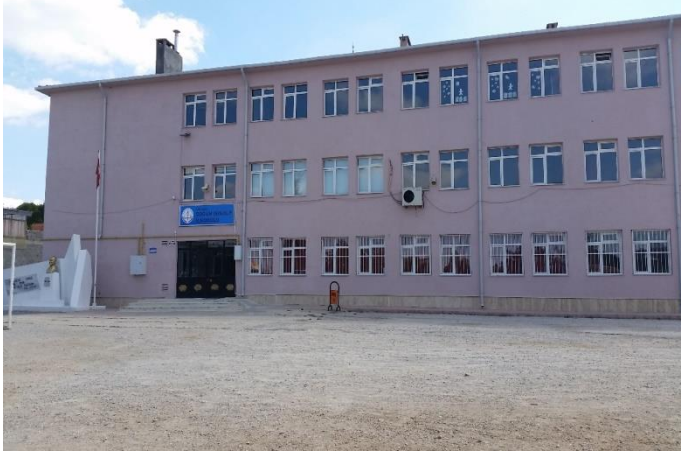
Resim 7: Doğan Işıkalp İlkokulu (Doğu Mahallesi)