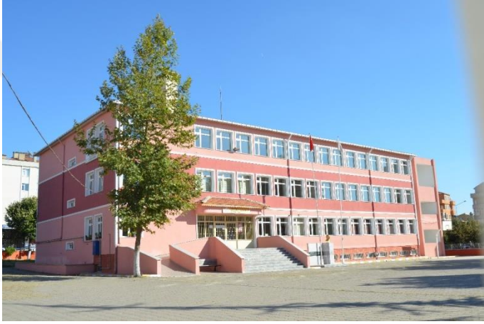
Resim 17: Kırklar Mesleki ve Teknik Anadolu Lisesi (Bademlik Mahallesi)