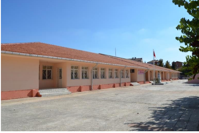
Resim 40: Zübeyde Hanım Anaokulu (Bademlik Mahallesi)