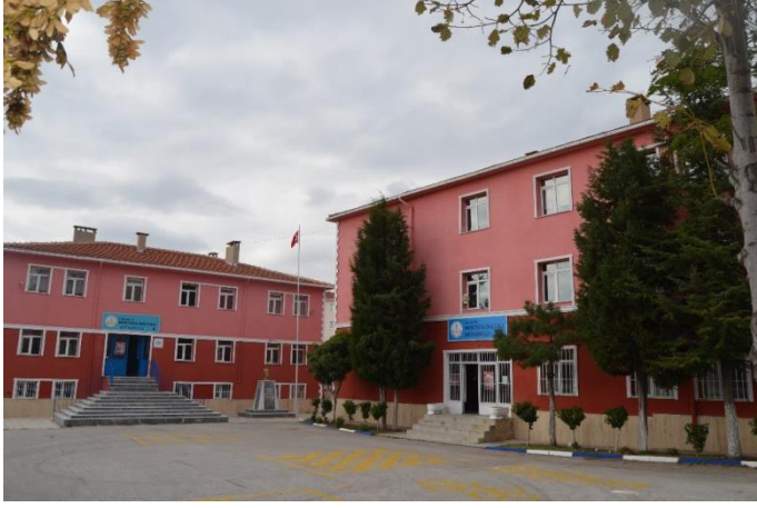
Resim 31: Mustafa Dalcı İlkokulu, Ortaokulu (Cumhuriyet Mahallesi)