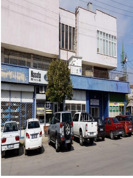
Resim 94: Sanayi Mescidi (Karacaibrahim Mahallesi)