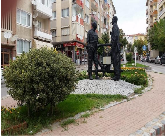
Resim 115: İsmet İnönü – Atatürk Heykeli (Karakaş Mahallesi)