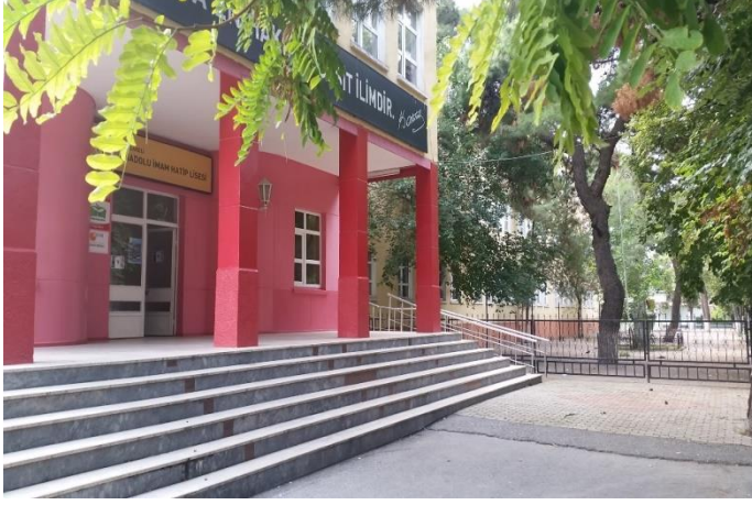
Resim 19: Kırklareli Anadolu İmam Hatip Lisesi (Karakaş Mahallesi)