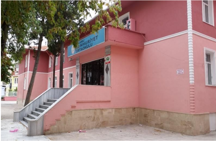
Resim 6: Cumhuriyet Ortaokul (Karakaş Mahallesi)