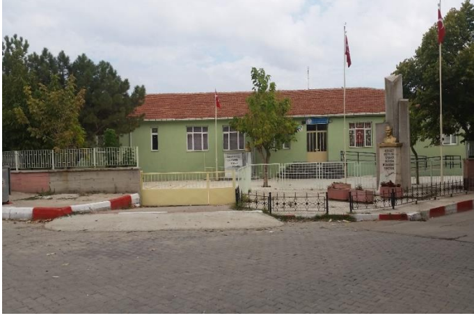
Resim 16: Karahıdır İlkokulu / Ortaokulu (Karahıdır Mahallesi)