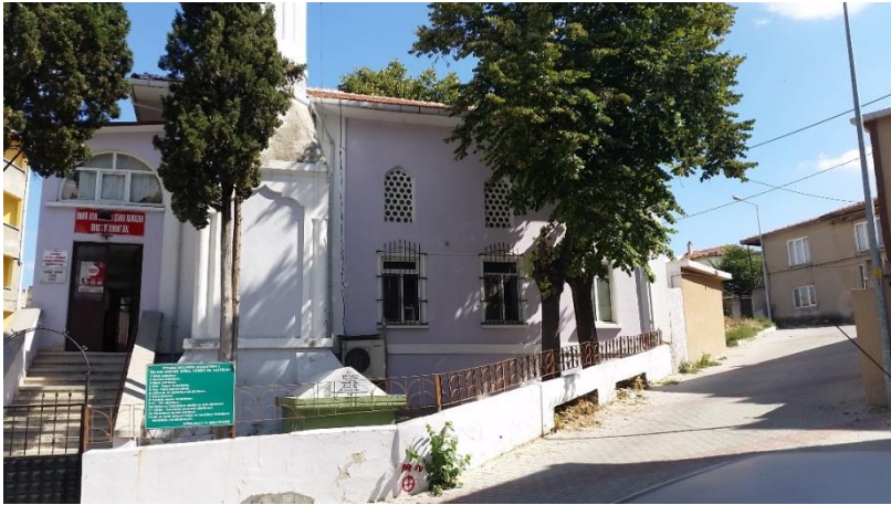
Resim 84: Hamzababa Cami / Yatırı (Akalar Mahallesi)