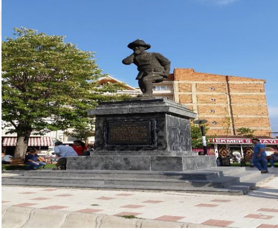
Resim 116: Karagöz Heykeli (Karacaibrahim Mahallesi)