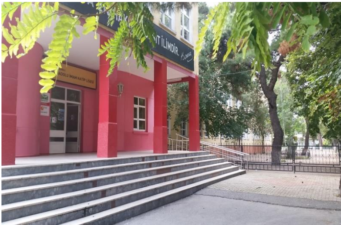
Resim 63: İmam Hatip Lisesi Bahçesi (Karakaş Mahallesi)