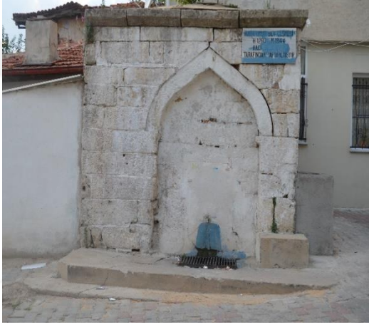
Resim 107: Karaumbey Çeşmesi (Demirtaş Mahallesi)