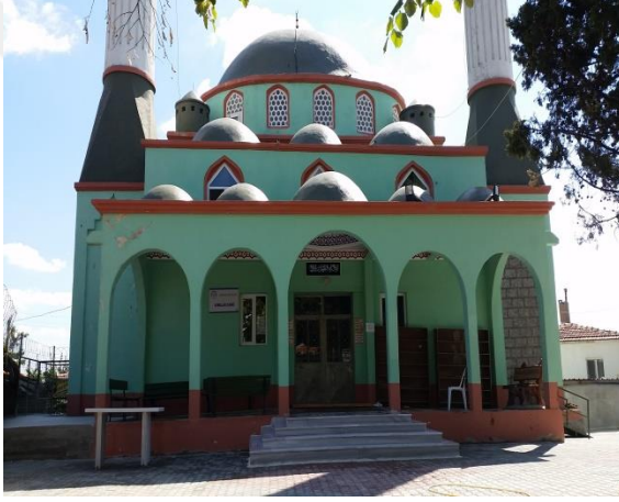
Resim 92: Kırklar Cami (Kocahıdır Mahallesi)