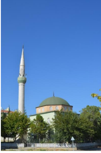
Resim 97: Sungurbey Cami (Karakas Mahallesi)