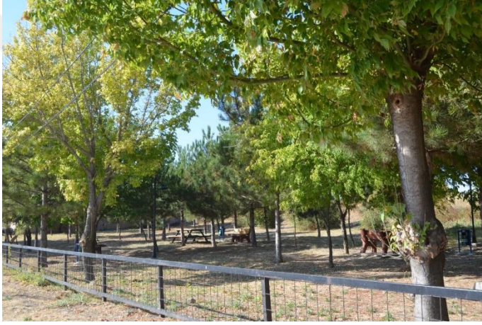
Resim 53: Çam Park / Çocuk Oyun alanı (Bademlik Mahallesi)