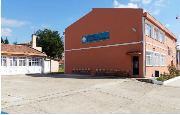
Resim 26: Kırklareli Özel Eğitim İş Uygulama Merkezi Okulu (Karacaibrahim Mahallesi)