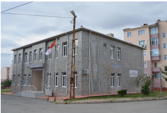
Resim 78: Atiye - Mehmet Genç Aile Sağlığı Merkezi (Cumhuriyet Mahallesi)