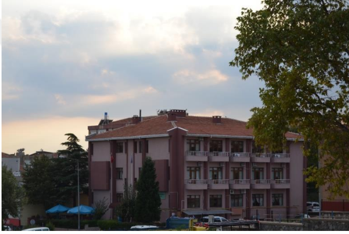
Resim 32: Öğretmenevi ve Akşam Sanat Okulu (Demirtaş Mahallesi)