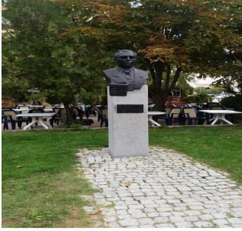
Resim 122: Sebahattin Ali Büstü (Karakaş Mahallesi)