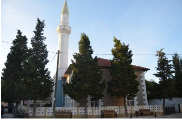
Resim 100: Yayla Cami (Yayla Mahallesi)