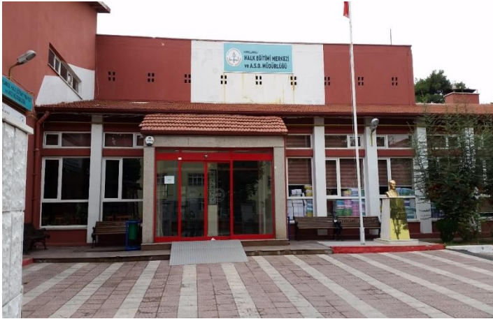
Resim 12: Halk Eğitim Merkezi Ve Akşam Sanat Okulu (Karakaş Mahallesi)