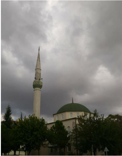
Resim 81: Bademlik Cami (Bademlik Mahallesi)