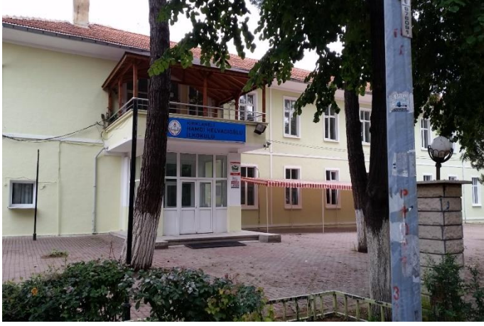
Resim 13: Hamdi Helvaciođlu İlkokul (Karakas Mahallesi)