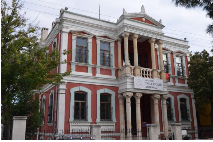
Resim 38: Yayla Ayçiçeği Anaokulu (Yayla Mahallesi)