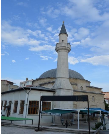
Resim 85: Hızırbey Cami (Demirtaş Mahallesi)