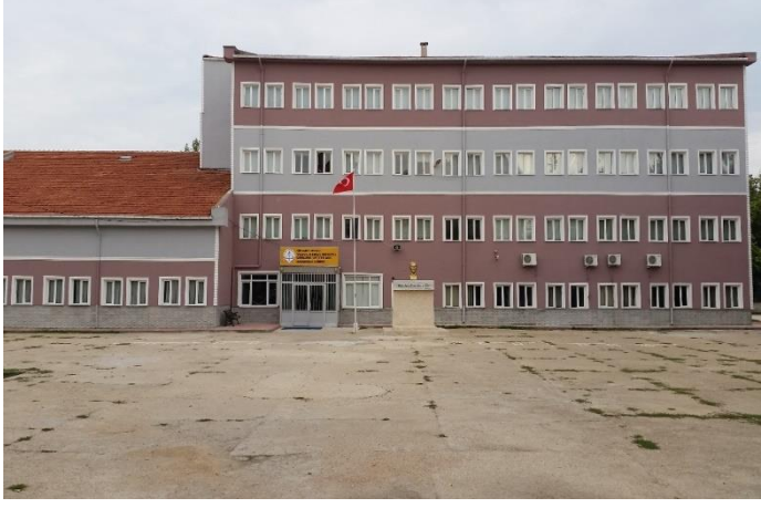
Resim 37: Yahya Kemal Beyatlı Mesleki ve Teknik Anadolu Lisesi (Karakaş Mahallesi)