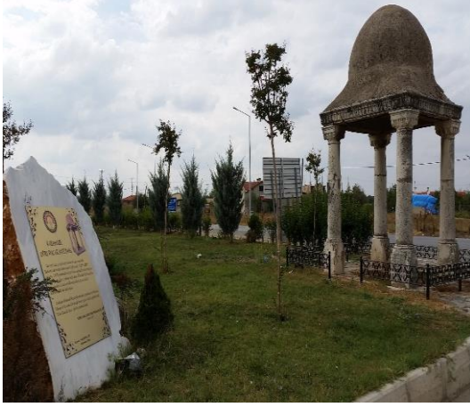
Resim 118: Dört Bacak Anıtı (Karahıdır Mahallesi)