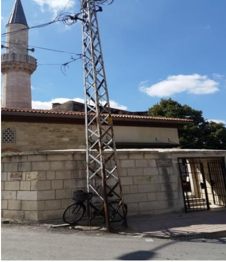
Resim 86: Kadı Emin Ali Çelebi Cami (Kocahıdır Mahallesi)