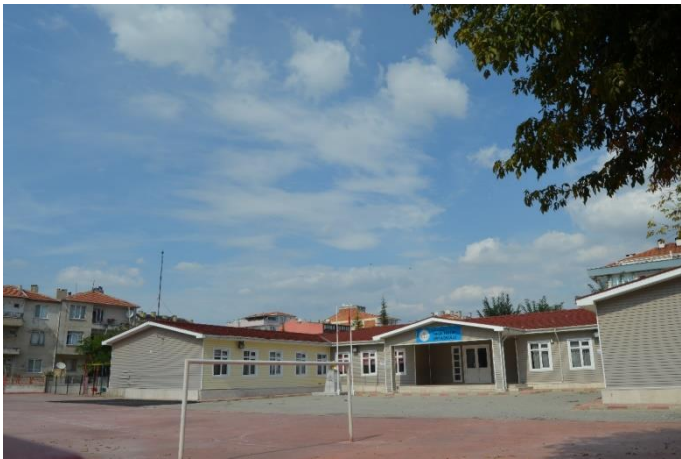
Resim 24: Kırklareli İmam Hatip Ortaokulu (İstasyon Mahallesi)