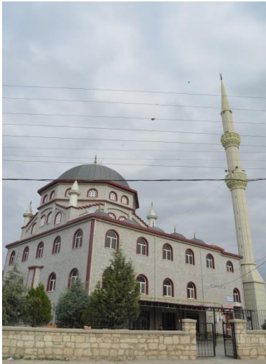
Resim 96: Sultan Reyhani Cami (Yayla Mahallesi)