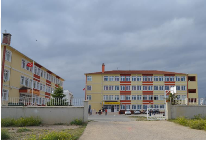
Resim 5: Bilal Yapıcı Güzel Sanatlar Lisesi(Kocahıdır Mahallesi)