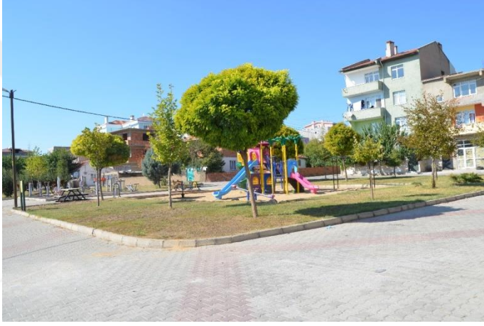
Resim 47: Badem Park / Çocuk Oyun Alanı / Spor Aletleri (Bademlik Mahallesi)