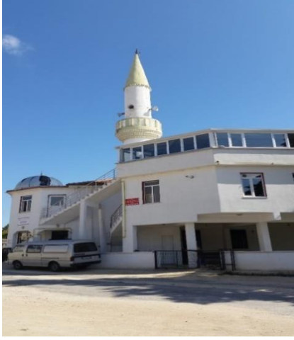
Resim 88: Karacaibrahim Mahallesi Cami (Karacaibrahim Mahallesi)