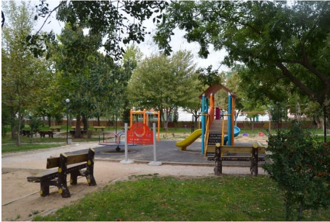
Resim 60: Gökkuşığı Çocuk Oyun Alanı (Cumhuriyet Mahallesi)