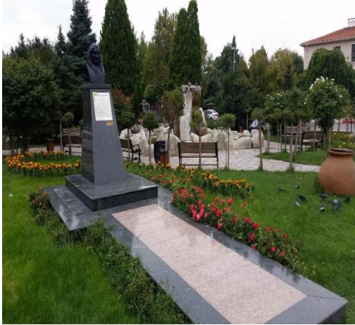
Resim 123: Zübeyde Hanım Büstü (Karakaş Mahallesi)