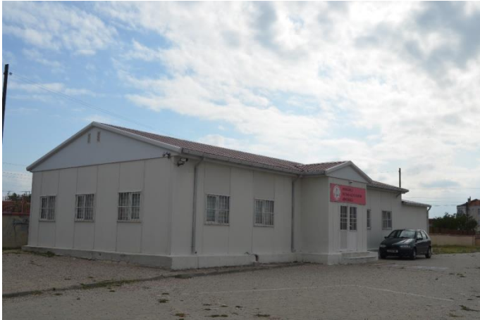
Resim 9: Fatma Aliye Hanım Ana Okulu (Yayla Mahallesi)