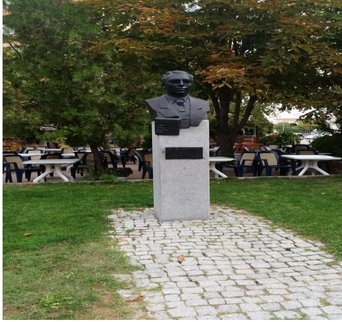
Resim 71: Sebahattin Ali Parkı (Karakaş Mahallesi)