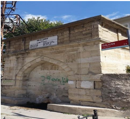
Resim 105: Kadı Ali Çeşmesi (Kocahıdır Mahallesi)