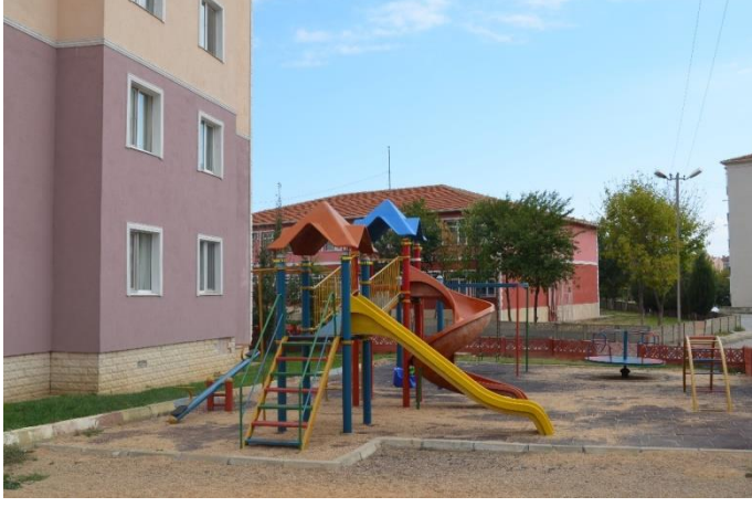
Resim 67: Mimoza Çocuk Oyun Alanı (Cumhuriyet Mahallesi)