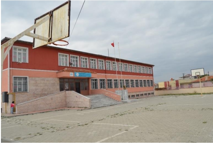
Resim 36: Vali Faik Üstün İlkokulu (Yayla Mahallesi)