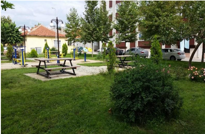
Resim 54: Çınar Parkı / Spor Aletleri (Karakaş Mahallesi)