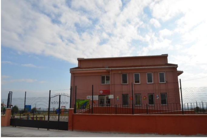
Resim 4: Bilal Yapıcı Anaokul(Kocahıdır Mahallesi )