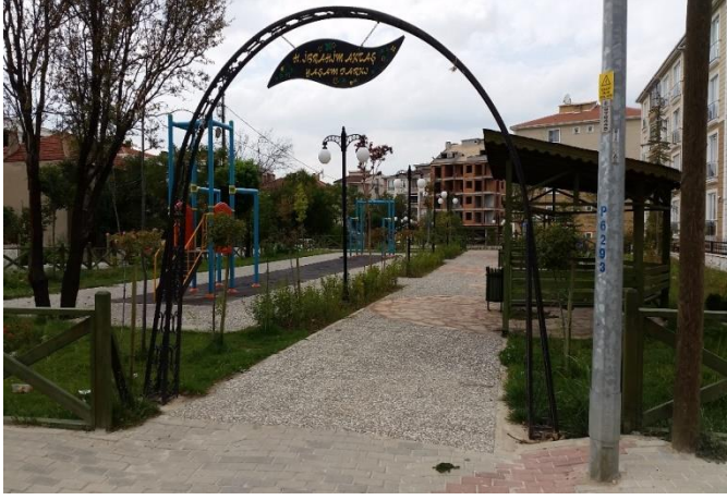
Resim 61: Halil İbrahim Aktaş Yaşam Parkı (Karakaş Mahallesi)