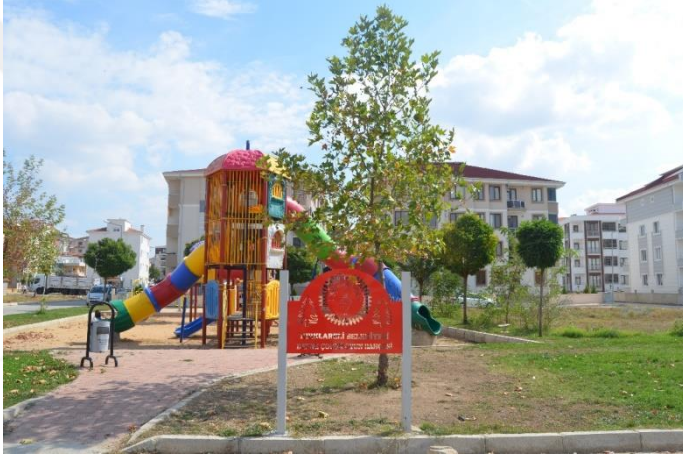
Resim 56: Defne Parkı / Çocuk Oyun Alanı (İstasyon Mahallesi)