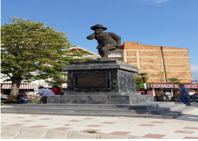
Resim 64: Karagöz Parkı / Çocuk Oyun Alanı (Karacaibrahim Mahallesi)