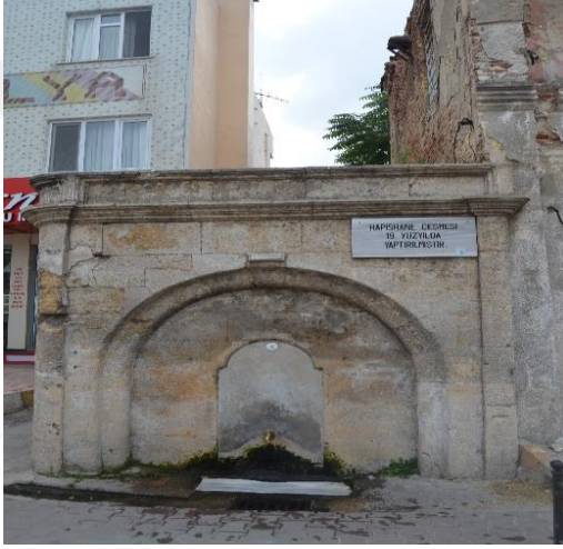
Resim 104: Hapishane Çeşmesi (Karakaş Mahallesi)