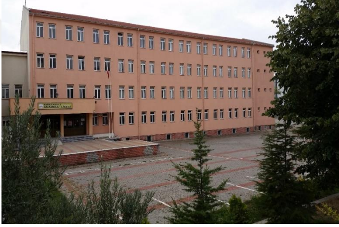
Resim 20: Kırklareli Anadolu Lisesi (Karakaş Mahallesi)