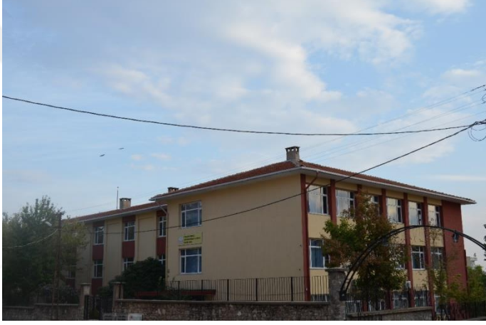
Resim 29: Kocahıdır Mesleki ve Teknik Anadolu Lisesi (Demirtaş Mahallesi)