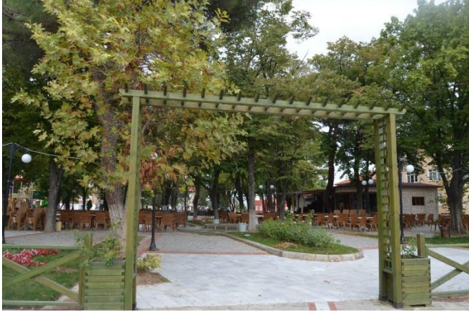
Resim 76: Yayla Parkı (Yayla Mahallesi)