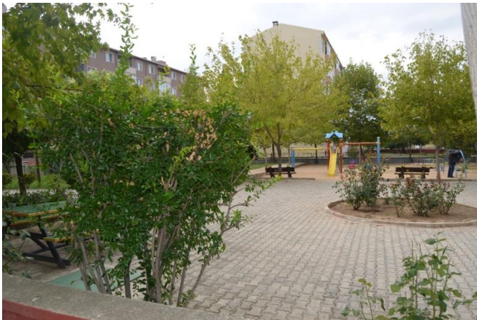
Resim 42: Adile Naşit Parkı / Çocuk Oyun Alanı (Cumhuriyet Mahallesi)