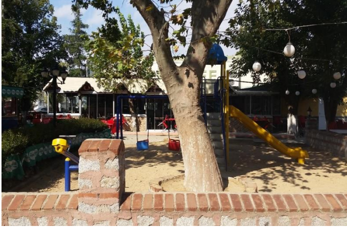
Resim 43: Ahmet Cevdet Paşa Parkı / Çocuk Oyun Alanı (Karakaş Mahallesi)