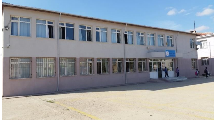
Resim 2: Ahmet Yener Ortaokulu (Pınar Mahallesi)