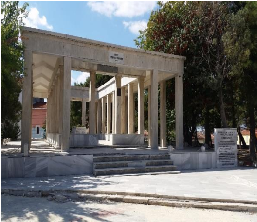
Resim 120: Kırk Şehitler Anıtı (Doğu Mahallesi)