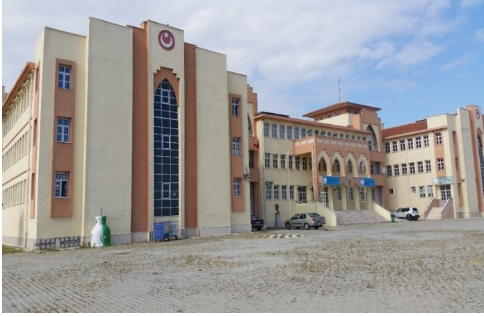
Resim 22: Kırklareli Ahmet Cevdet Paşa İlkokulu / Ortaokulu / Bilim ve Sanat Merkezi (Yayla Mahallesi)