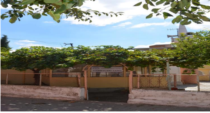
Resim 83: Gazievleri Cami (Bademlik Mahallesi)