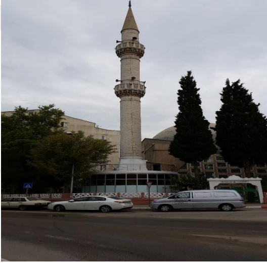
Resim 80: Ahmet Cevdet Paşa Cami (Karakaş Mahallesi)