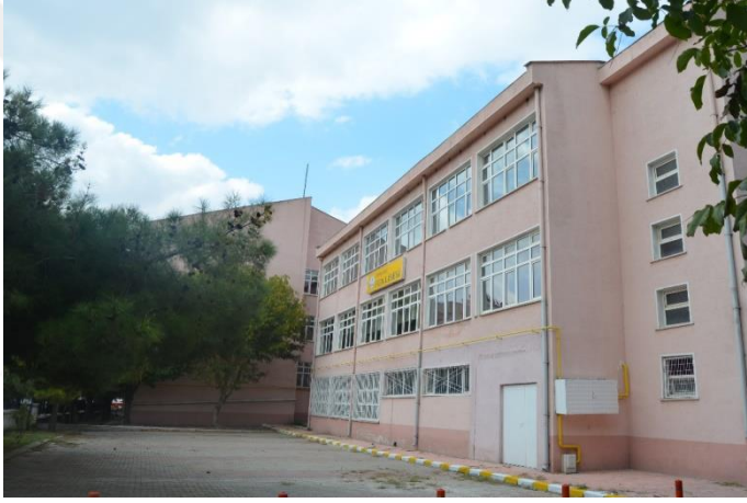
Resim 23: Kırklareli Fen Lisesi (Karakaş Mahallesi)