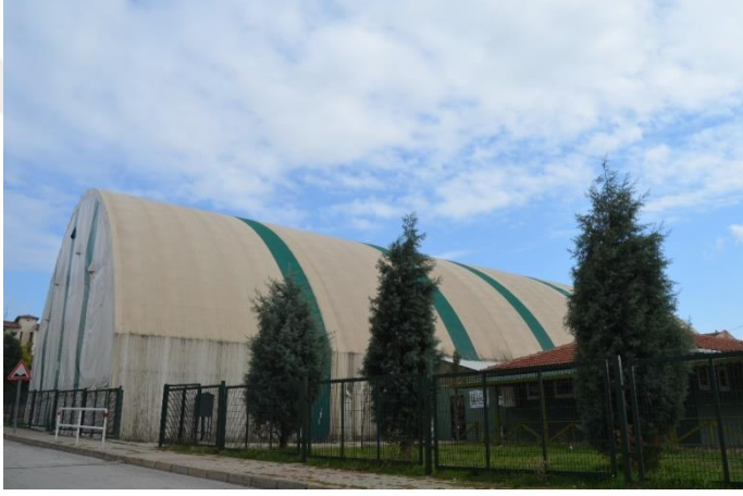
Resim 44: Ali Nazmi Üstündağ Spor Tesisleri (Cumhuriyet Mahallesi)