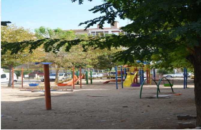
Resim 77: Yeşil Elma Çocuk Oyun Alanı (Karakaş Mahallesi)