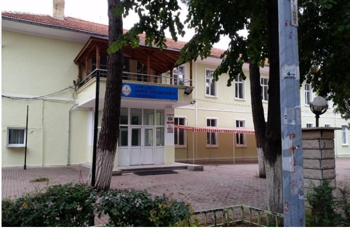
Resim 62: Hamdi Helvacı İlköğretim Okulu Bahçesi (Karakaş Mahallesi)