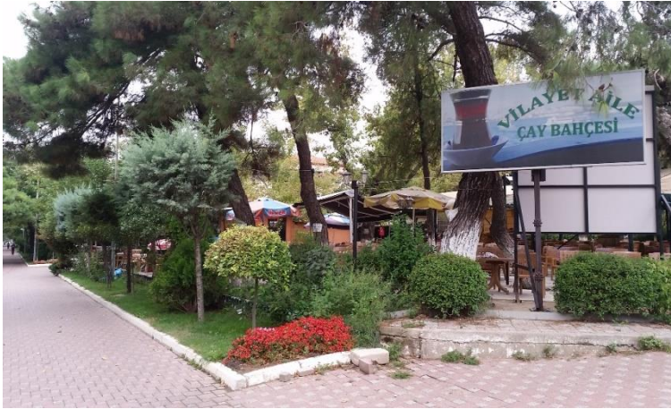
Resim 66: Kırklareli Valiliği Bahçesi (Karakaş Mahallesi)