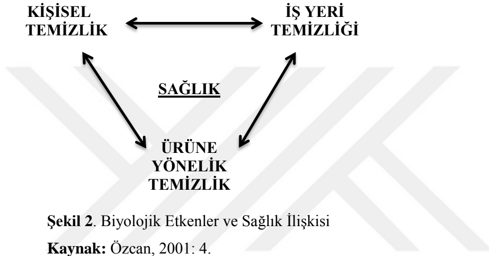
Şekil 2. Biyolojik Etkenler ve Sađlık İlişkisi

ve özellikle sađlık tesislerinin temizlik konusu, kişisel temizlik, iş yeri temizliđi ve ürüne yönelik temizlik olarak iç içe düşünölmelidir (Şekil 2). İnsan yaşamında mutluluđun sađlanması için sađlıklı olmak çok önemlidir. Temizlik, temel olarak hastalık yapan mikroplar olmak üzere istenmeyen biyolojik faktörlerin gelişimini engelleyen beraberinde hastalıklardan korunmayı ve sađlığı devam ettirmenin vazgeçilmez bir olgusudur (Özcan, 2001: 4).