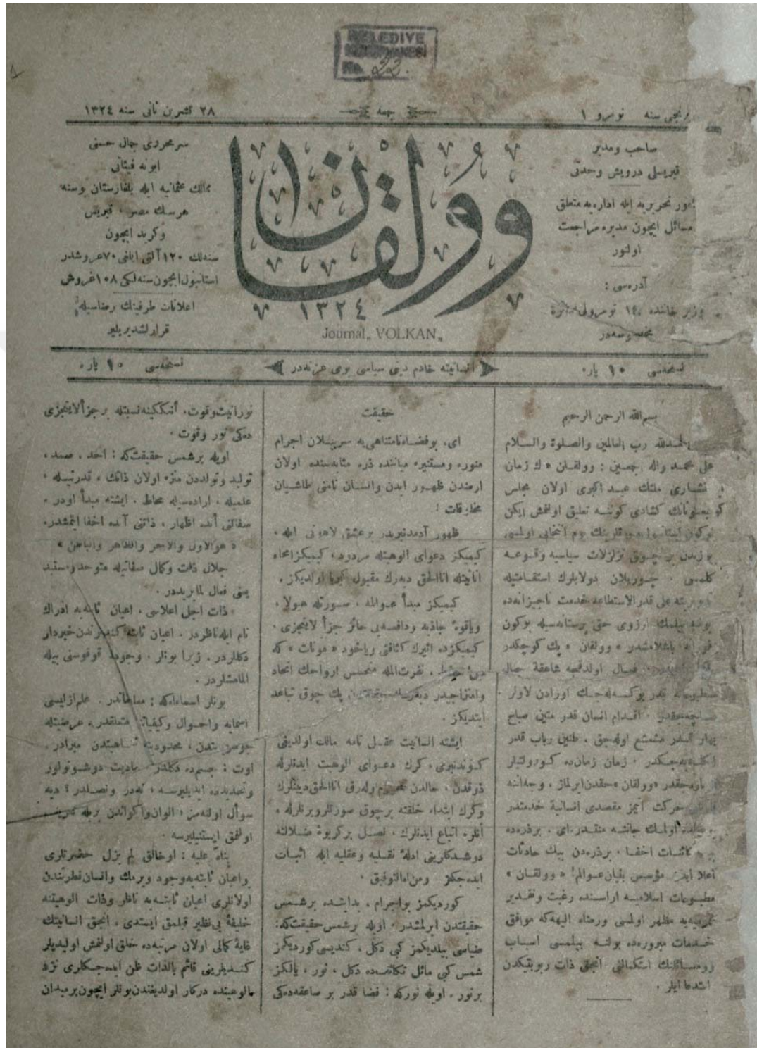
11 Aralık 1908, Numara:1 Birinci Sayfa

“Volkan haktan ayrılmaz; maksadı insaniyete hizmettir; bu yolda ölmek canına minnettir.”