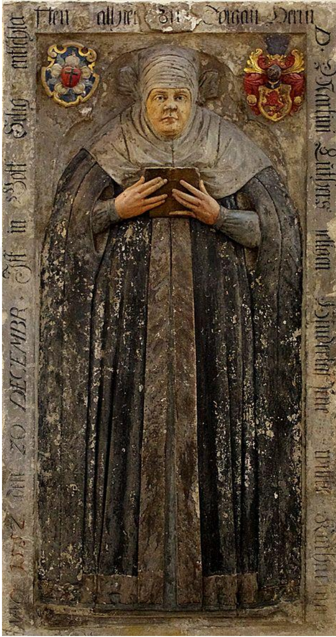
Ek 5: Katharina von Bora'nın mezarının bulunduğu Almanya'nın Torgau kasabesindeki Saint Mary Şehir Kilisesinin dış duvarına kabartma şeklinde yapılan resmi. (Erişim tarihi: 10.08.2017)

https://s-media-cache-ak0.pinning.com/564x/9c/1b/3e/9c1b3ec62c8e5ec955e57610f297b15e.jpg