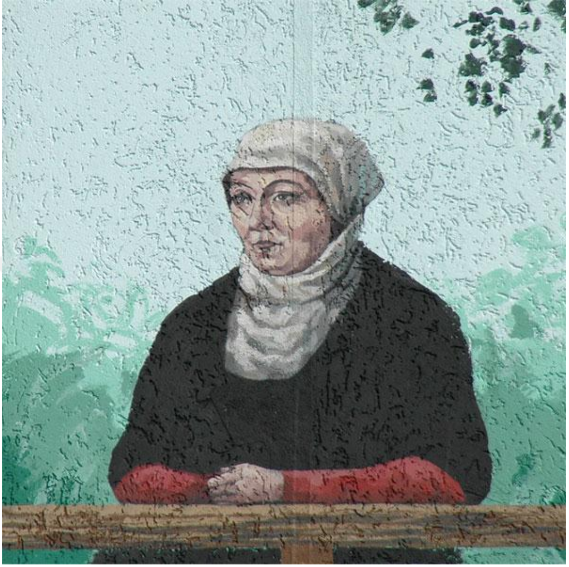
Ek 9: Katharina Schütz Zell (Erişim tarihi: 10.08.2017)

http://www.followingphoebe.com/content/images/2016/10/Katharina_Zell.jpg