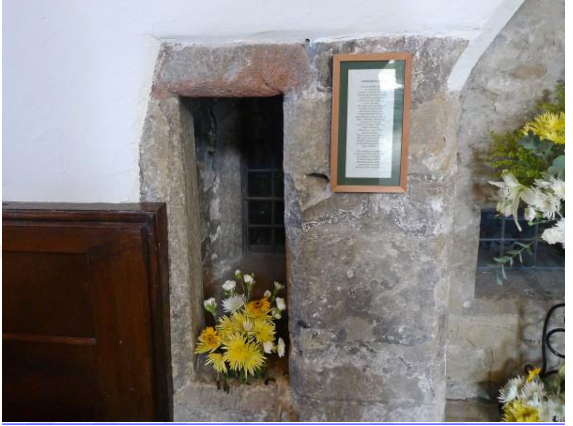
Ek 2: Münzevinin kaldığı yerin ibadetlere katılabilmesi için kiliseye bakan penceresi. (Erişim tarihi: 10.08.2017)

https://citydesert.files.wordpress.com/2014/01/anchorite-8.jpg?w=600&h=450