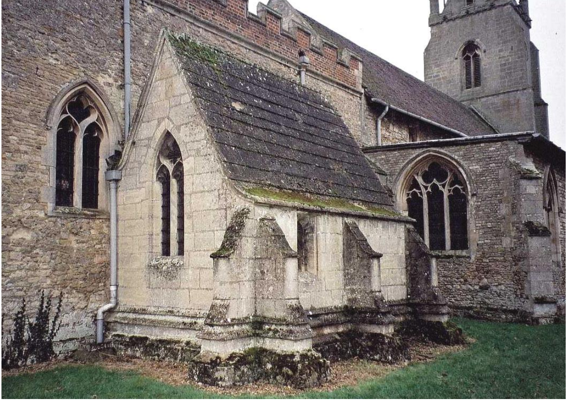
Ek 1: Münzevi kadınların yaşadıkları kiliseye yapışık biçimde inşa edilen yapılar. (Erişim tarihi: 10.08.2017)

http://www.oldwillingham.com/History/SMAS/Lander/image001.jpg