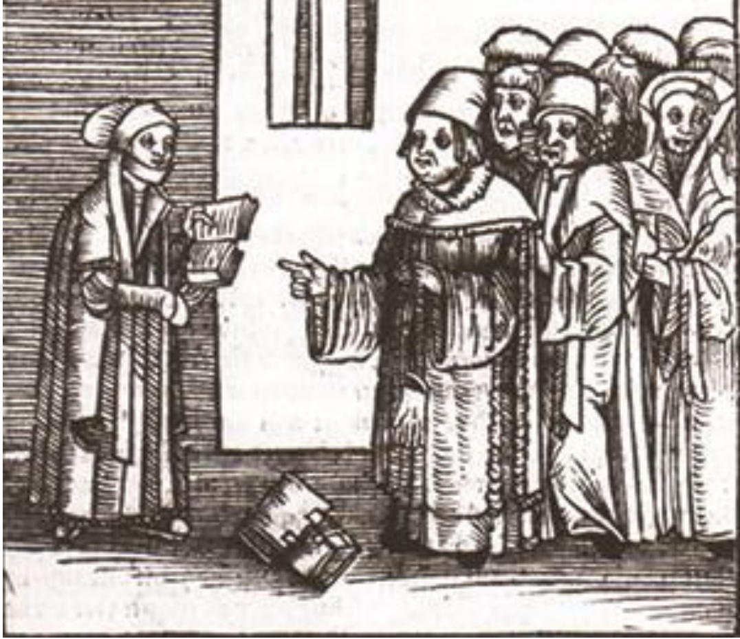
Ek 6: Argula von Grumbach'ın Arsacius Seehoffer'ı müdafaasını resmeden bir illüstrasyon. (Erişim tarihi: 10.08.2017)

https://livinglutheran.blob.core.windows.net/cdn/wp-content/uploads/2015/09/15October16.jpg