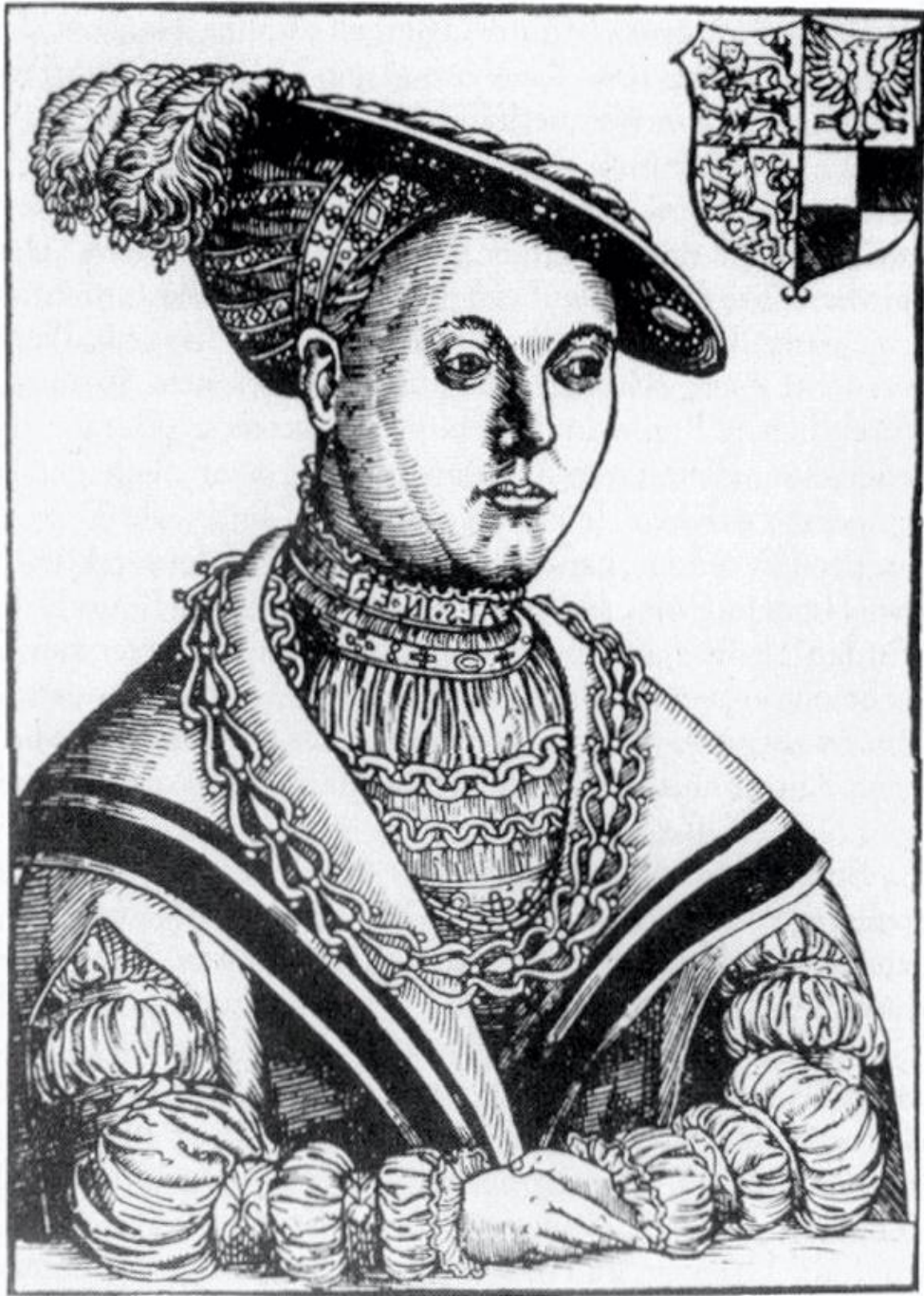
Ek 8: Elisabeth von Braunschweig (Eriřim tarihi: 10.08.2017)

http://regiowiki.hna.de/images/thumb/7/73/Wiki449.jpg/678px-Wiki449.jpg