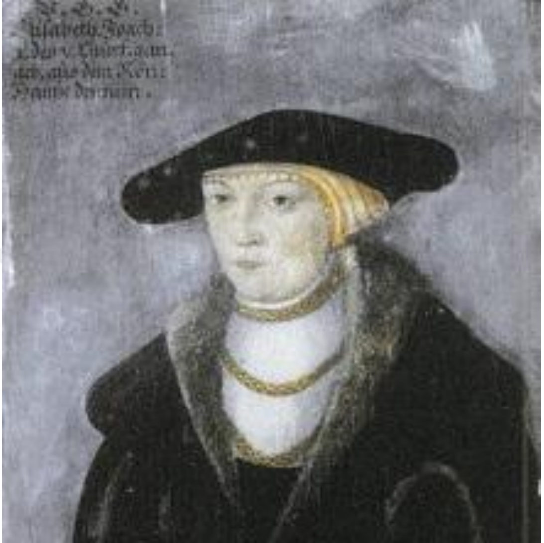
Ek 7: Elisabeth von Brandenburg (Eriřim tarihi: 10.08.2017)

http://efid.adminkerygma.de/upload/3f34471c7d27edabd212d05316aa87b0.jpg