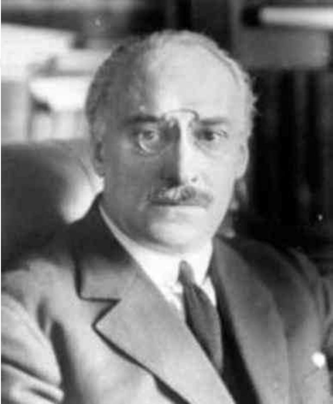
EK 3: Ion Gh. Duca – Romanya Dışışleri Bakanı (1922-1926), Başbakan (1933)