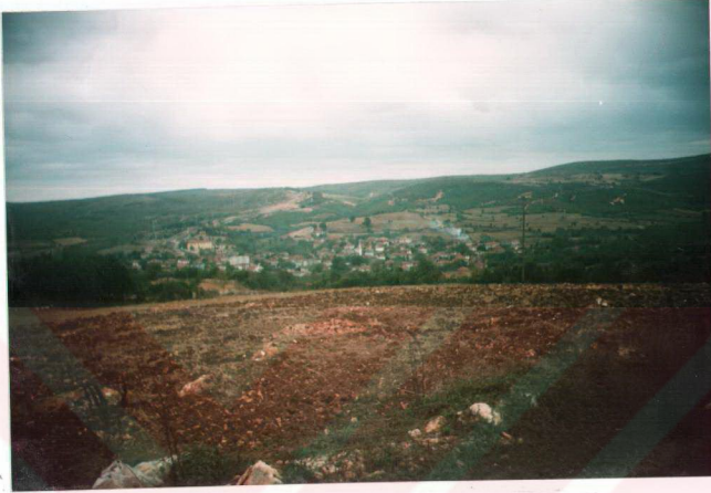
Resim 3: Orman İçi Köy (Kömürköy)'ün Görünüşü.

936, köylerde 247 TL, orman köylerinde ise 46 TL olduğu görülmüştür. II. plan döneminde ise bu rakamlar ancak 80 TL'ye çıkarılabilmektedir (ÇELİK, 1993, S. 230).