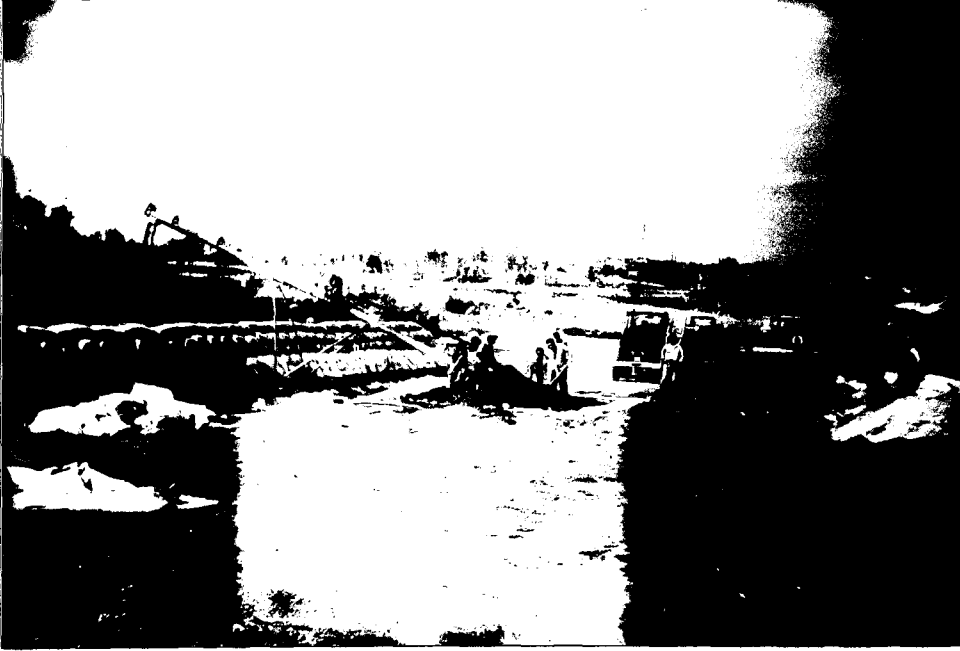
Resim 2: Ayçiçeği Üreticilerinin Ürün Teslimi

İlçe yüzölçümünün içerisinde 76.636 ha. 'ın ormanlık saha olması nedeniyle ormancılık sektörü, tarım ve hayvancılık sektörülerinden sonra en önemli sektör durumundadır. İlçe Merkezinde kurulmuş olan Orman İşletme Müdürlüğü ve bağlı 5 Orman İşletme Şefliği'nin gerçekleştiği orman ürünleri üretimi ile Bölge Müdürlüğü bünyesinde en yüksek üretim yapan işletmelerden birisi durumundadır. Özellikle yakacak odun üretimi en yüksek düzeyde olan işletmedir. 4125 m 3 yapacak ve 249329 ster yakacak odun üretiminin gerçekleştirildiği 1992 yılında, orman köylüsüne işçilik ücreti olarak 3.431.560.000 ₺ ödenmiş ve ayrıca kanuni haklardan dolayı orman köylüsüne, 44.898.093.00 ₺ yarar sağlanmıştır.