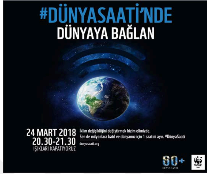
Şekil 3.3: WWF-Türkiye Örnek Görsel

Şekil 3.3, WWF-Türkiye'nin Facebook hesabında yaptığı bir paylaşımda kullandığı bir görseldir. Görselde Dünya Saati kampanyası için imza kampanyasına katılma çağrısı yapıldığı görülmektedir.