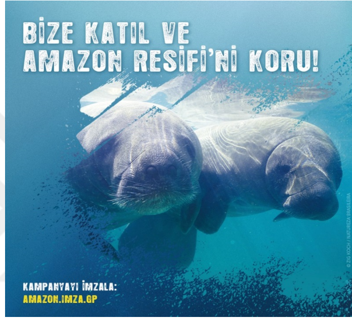
Şekil 3.2: Greenpeace Türkiye Örnek Görsel

düşünölmektedir, çünkü dijital mecralarda yüz yüze bir iletişim olmadığı için sadece yazı ile desteklenen açıklamalar yerine görsellerin güçlü ve özenli seçilmesinin bazen yazıya bile gerek bırakmadan pek çok şeyi anlatabildiğı düşünölmektedir. Bu kapsamda aşağıda Greenpeace Türkiye ve WWF-Türkiye'nin Facebook hesaplarında paylaştıkları birer fotoğraf gönderisi, örnek olarak gösterilmiştir.