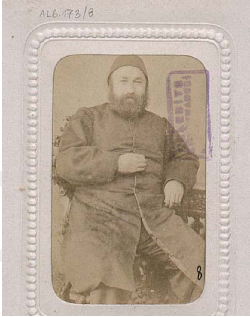
EK 4 “Şirvanlı Rüştü Paşa” / Abdullah Frères, İBB ATATÜRK KİTAPLIĞI.