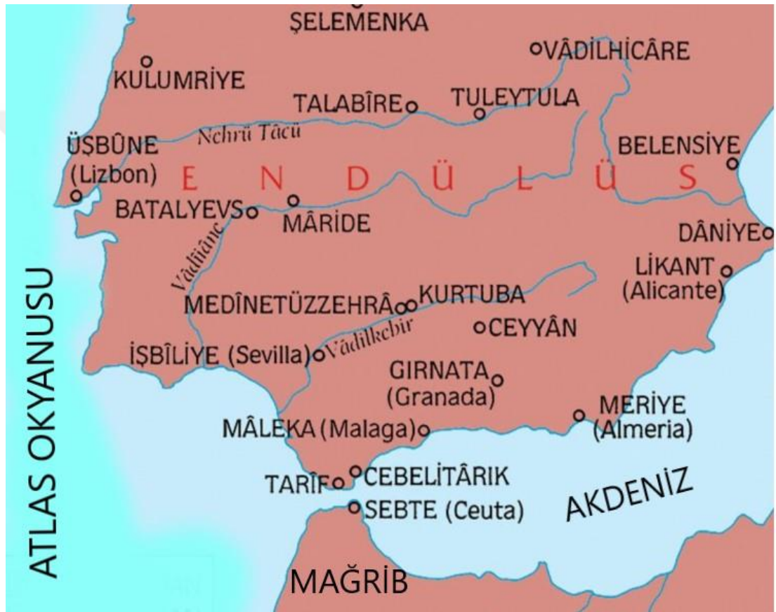
Harita 2: Endülüs Bölgesi ve Sebte Şehri

merkezlerinden kabul edilmiştir. 13 Zaten Sebte'yi niteleyen en bariz vasıflardan biri de “dâru'l-ilm/ilim diyarı” olmasıdır. 14 Kādî 'Iyâz'ın, doğu İslâm dünyasına ilmî seyahat yapmaması sebebiyle ortaya çıkması muhtemel eksiklikleri, Sebte'nin bu ayrıcalıklı konumundan tam manasıyla istifade ederek bertaraf ettiği belirtilmiştir. 15 Aşağıdaki harita, Kādî 'Iyâz'ın yaşadığı coğrafyanın tanınmasına yardımcı olacaktır. 16