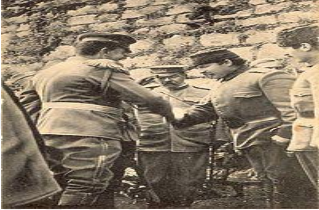
Resim 4: Essad Paşa İşkodra'dan Çıkarken Karadağlı Subaylarla Selamlaşır