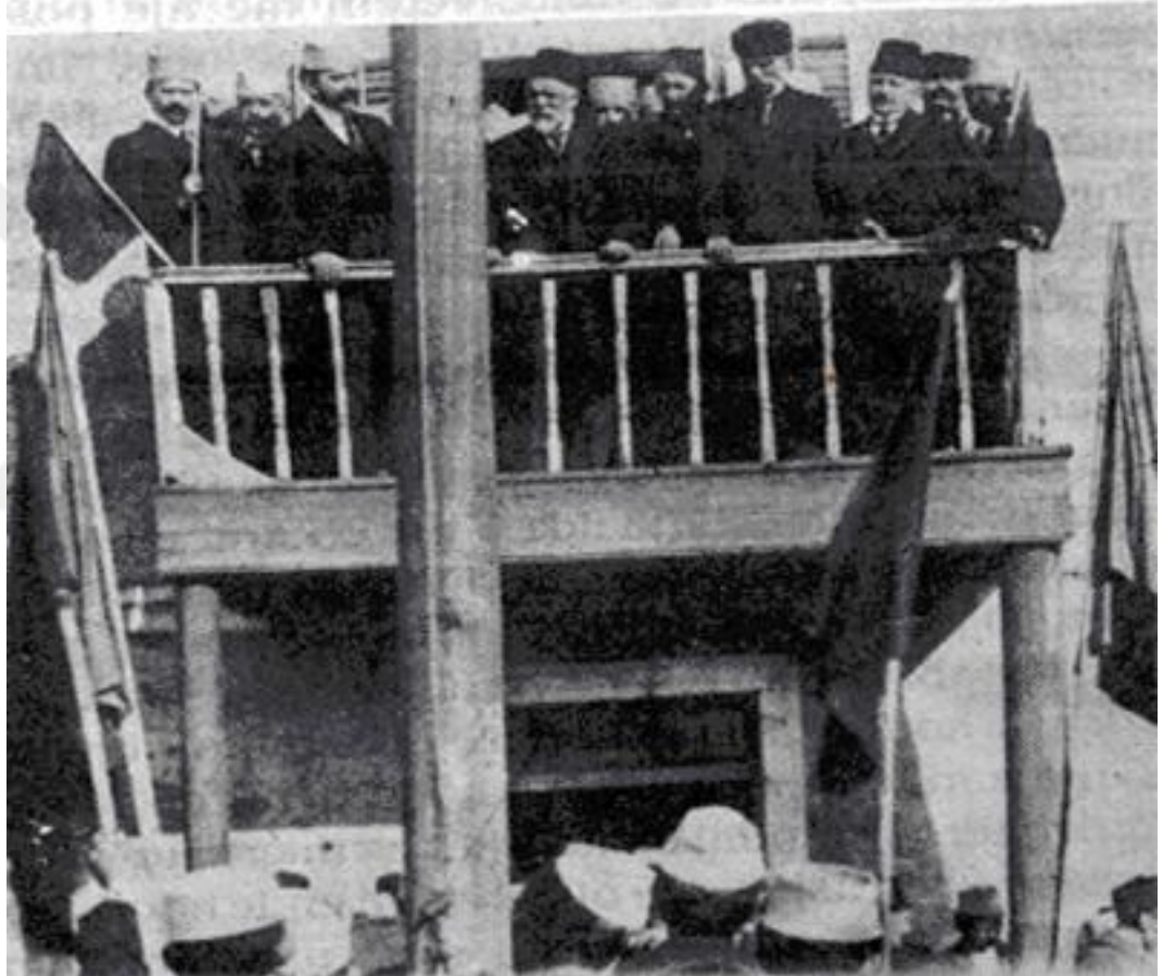
Resim 1: Milli Bayrağın Yükseltmesi

atanması teklif etti. Bu teklifler alkışlarla kabul edildi. İsmail Kemali'nin konuşmasından sonra, Meclis oybirliğiyle; Geçici bir hükümet altında Arnavutluk'un özgür ve bağımsız olması için karar verdi. 22