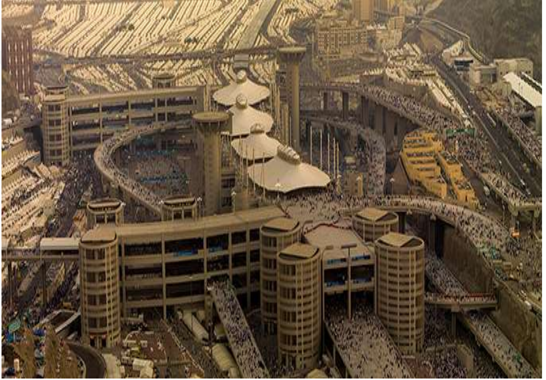
Resim-3 Yeni Cemerât Köprüsü (2006)

yapamayacak olanlar, birisine vekâlet vermek sureti ile taşlarını attırır. Taşlama süresince mazereti sona erenlerin ise, vekâlet vermeyip bizzat yapmaları gerekmektedir. Ayrıca taşlamanın geçerli olması için vekilin önce kendi taşını atması şartı da aranmaktadır. 180