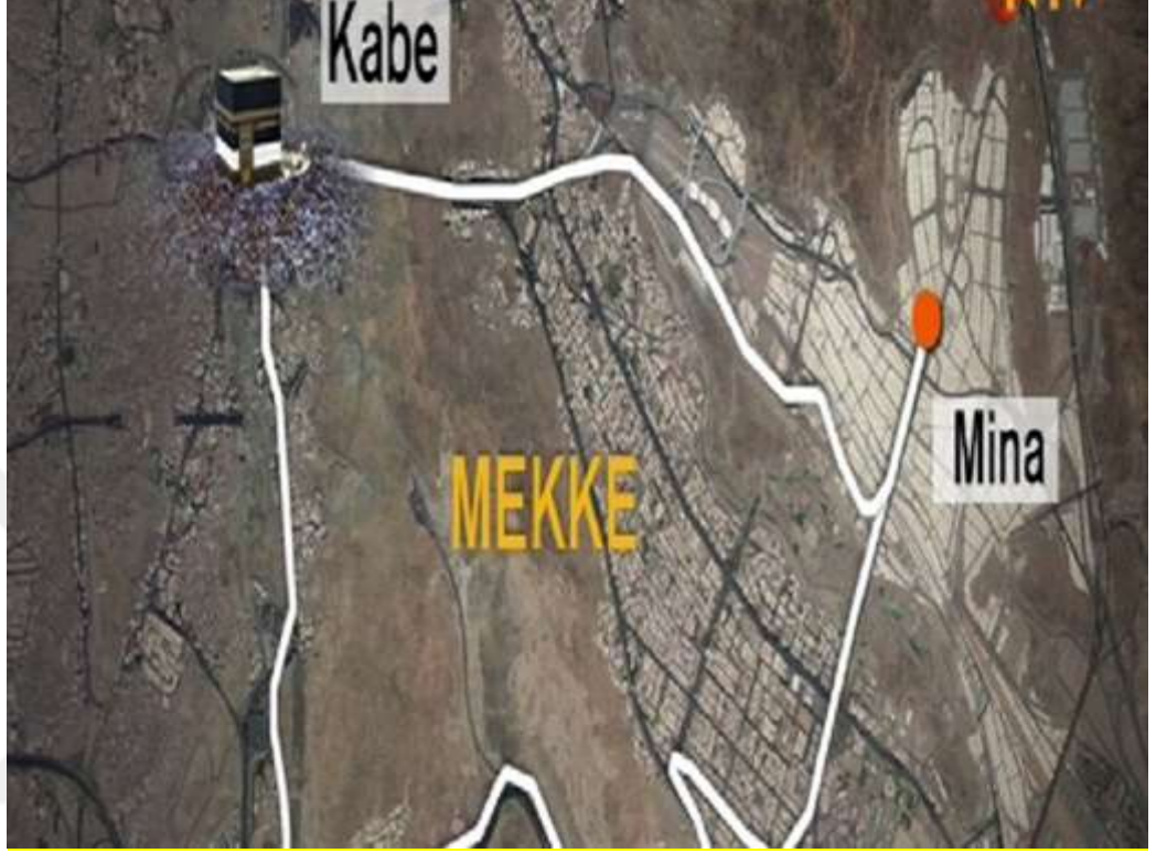
Resim-1 Mekke'ye Göre Mina'nın Konumu

yasaklanması da, önceki uygulamalardan yanlış olan veya aslından bozulan şeylerin kaldırıldığını göstermektedir.