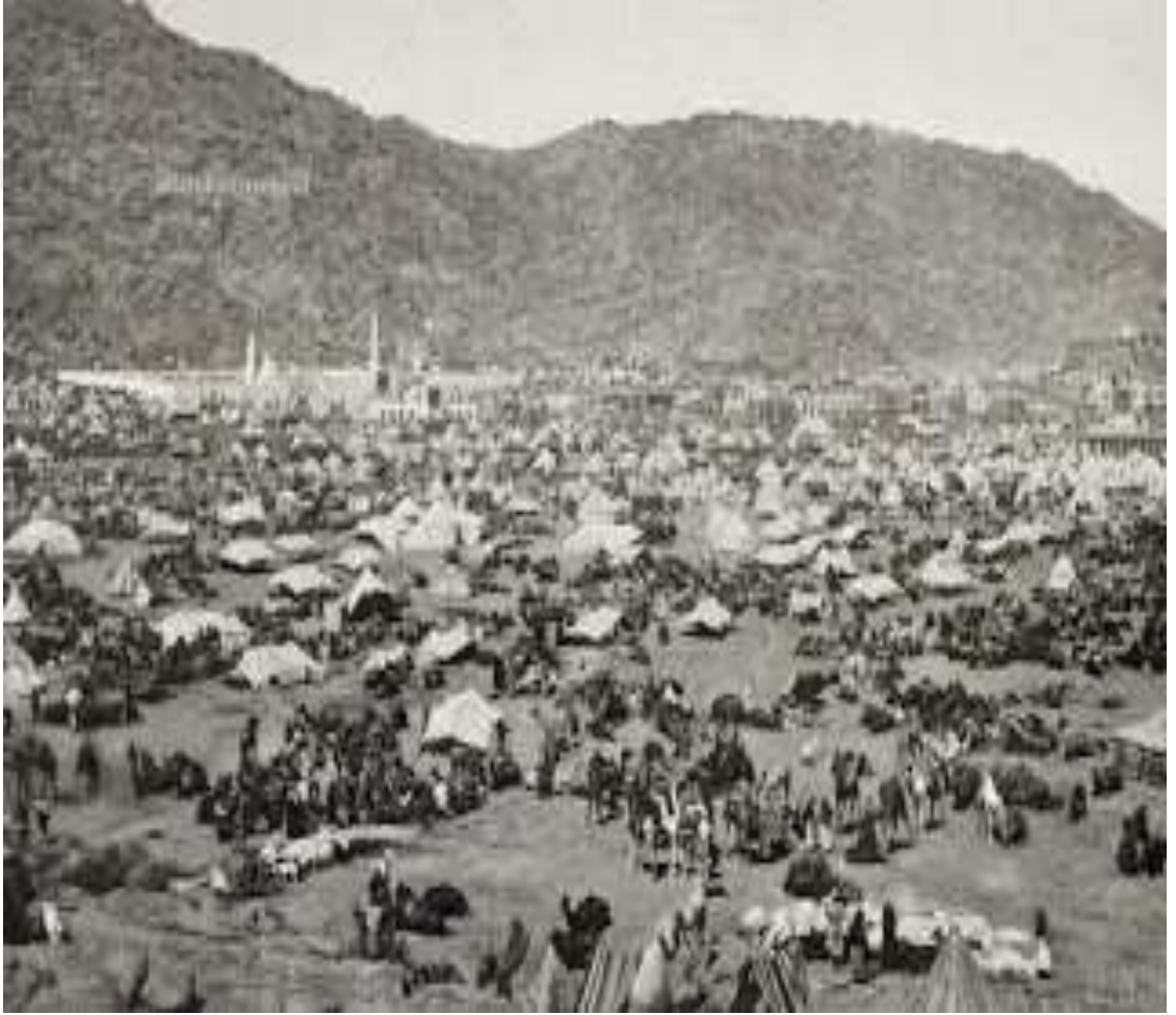
Resim-2 Tarihten Bir Kesit (Mina)

önlerinde kesim yapılmasının engellendiğini kaydetmiştir. 167 Çevreye verilen zarar azaltılmakla gerek hacılar gerekse Mekke halkı hem hastalıklardan hem de kötü kokulardan kurtulmuşlardır. 168