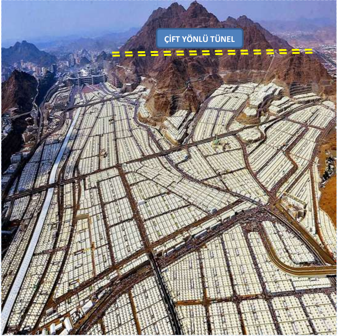
Resim-4 Mina Çadırları