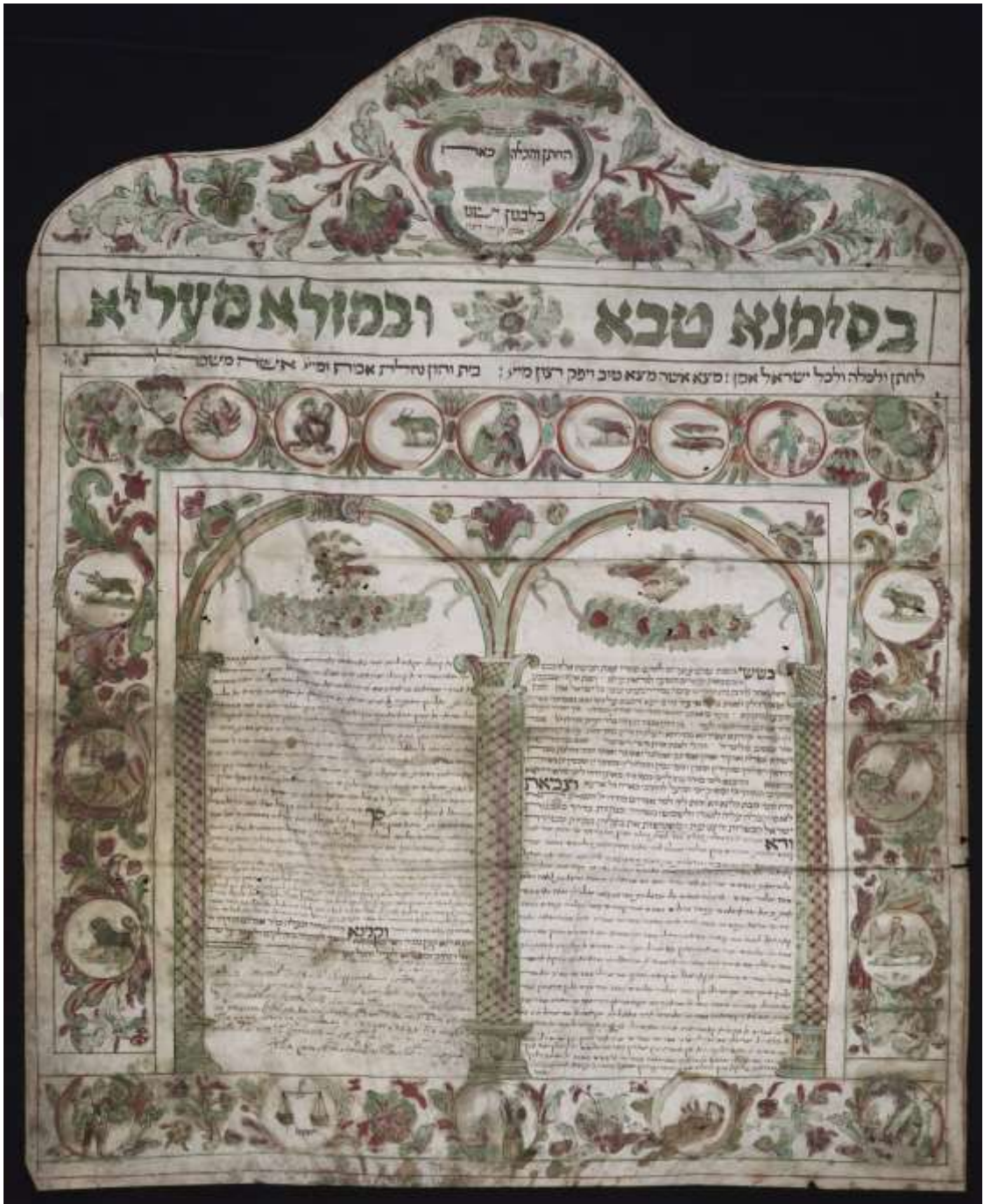
Yunanistan'dan bir ketuba, 1768.