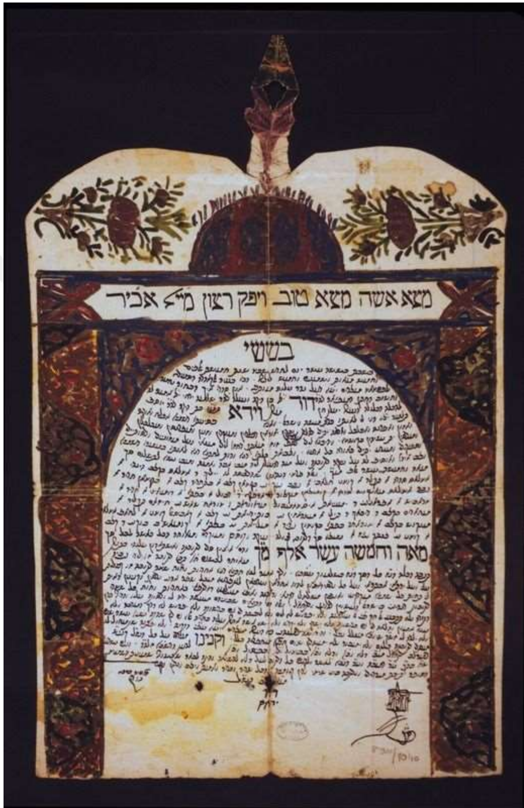
Kahire'den bir ketuba, 1825