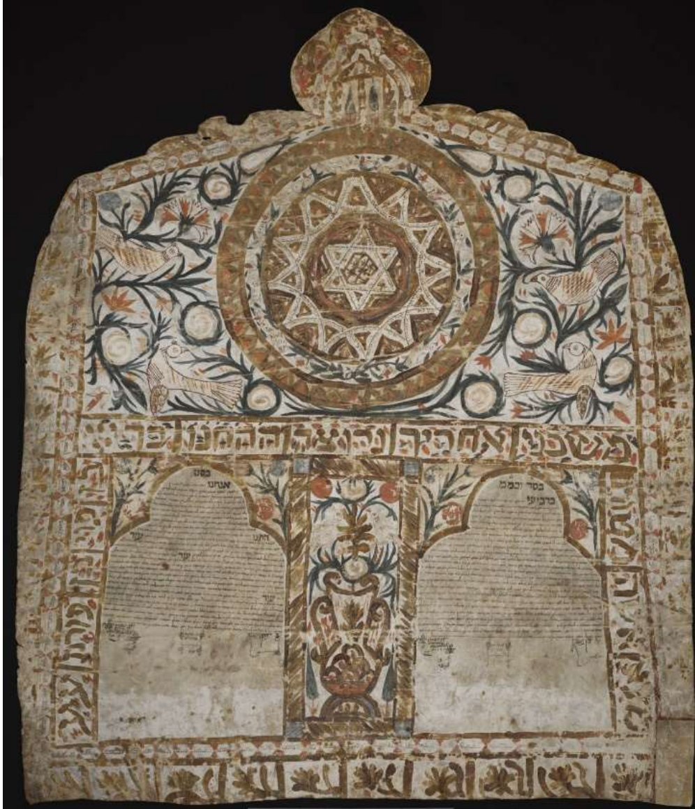
Tarihsel bir ketuba