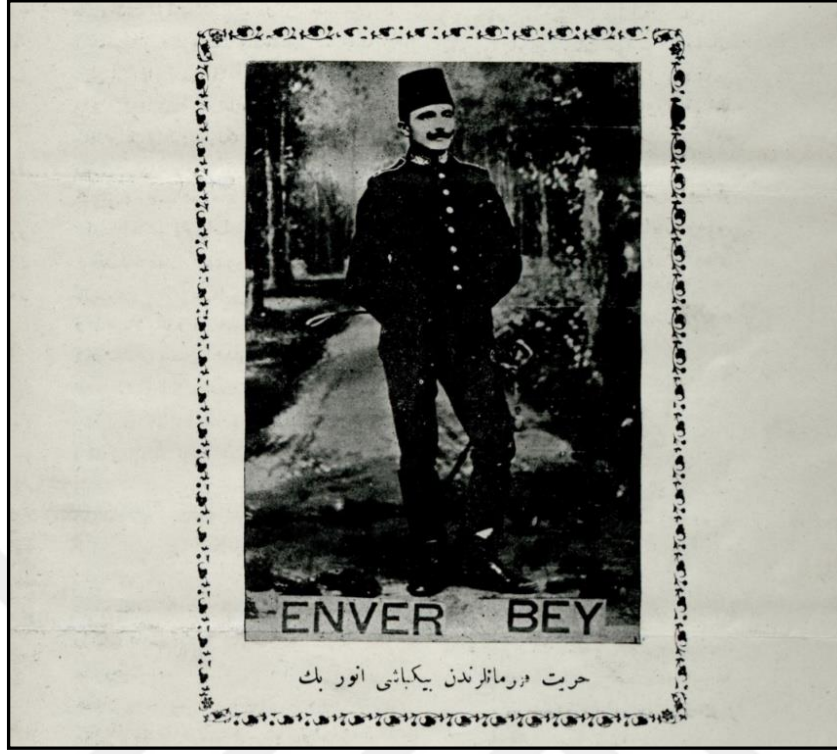
Görsel 2: Enver Paşa (Altyazı: Hürriyet Kahramanlarından Binbaşı Enver Bey)