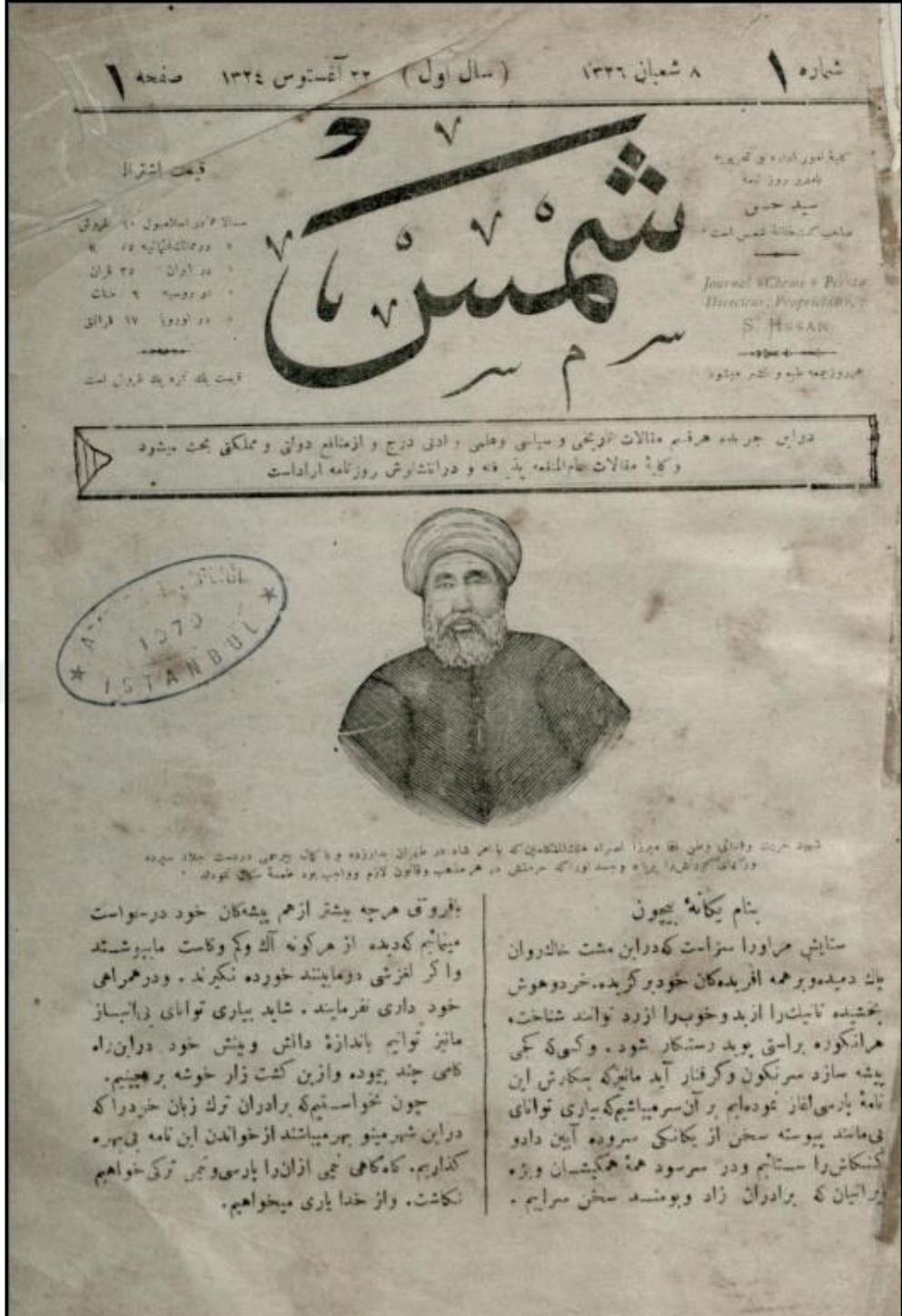
Görsel 1: Şems Gazetesinin 4 Eylül 1908'de Yayımlanan İlk Sayısının İlk Sayfası