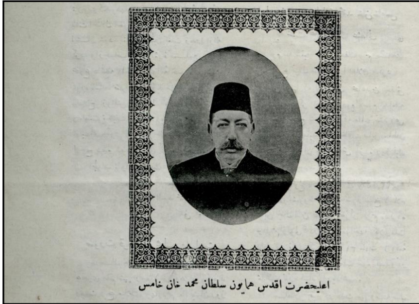
Görsel 3: Sultan V. Mehmed Reşad (Altyazı: Sultan V. Mehmed Han Hazretleri)