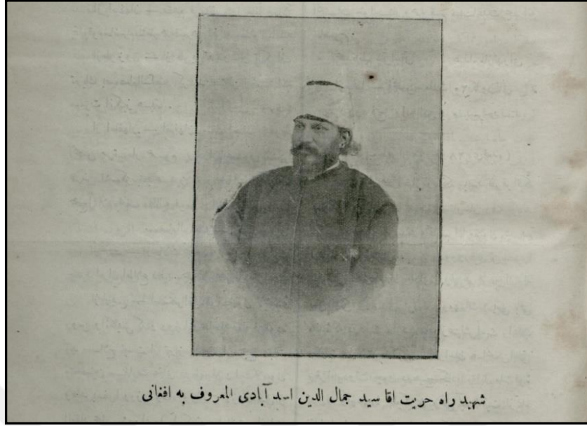
Görsel 4: Cemâleddin Afgânî (Altyazı: Hürriyet Yolu Şehitlerinden Seyyid Cemâleddin Esedâbâdî, Bilinen Adıyla Afgânî)