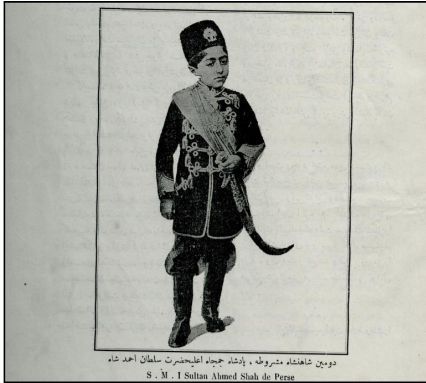
Görsel 7: Ahmed Şah Kaçar (Altyazı: Meşrutiyetin İkinci Şahensehi, Sultan Ahmed Şah Hazretleri)