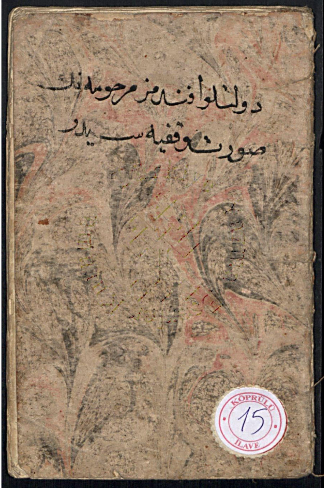
Ek 2: Köprülü Ayşe Hanım'ın Köprülü Kütüphanesinde bulunan vakfiyesi