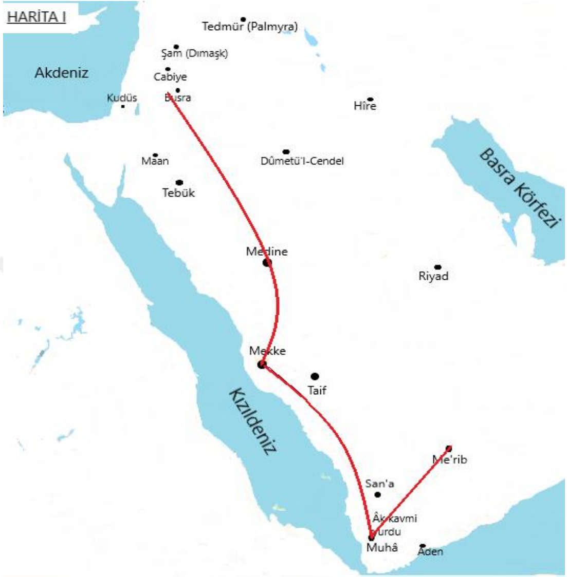
Gassânîler'in göç güzergâhı