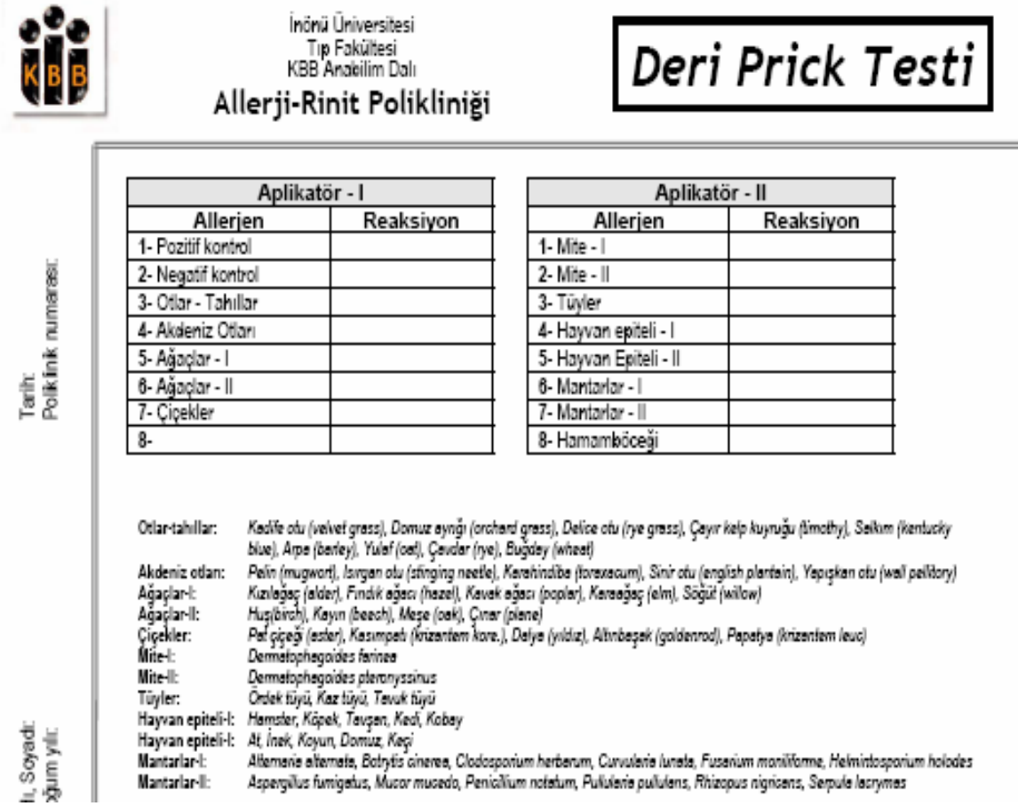
Şekil-3: İÜTF KBB Anabilim Dalı prick testi formu