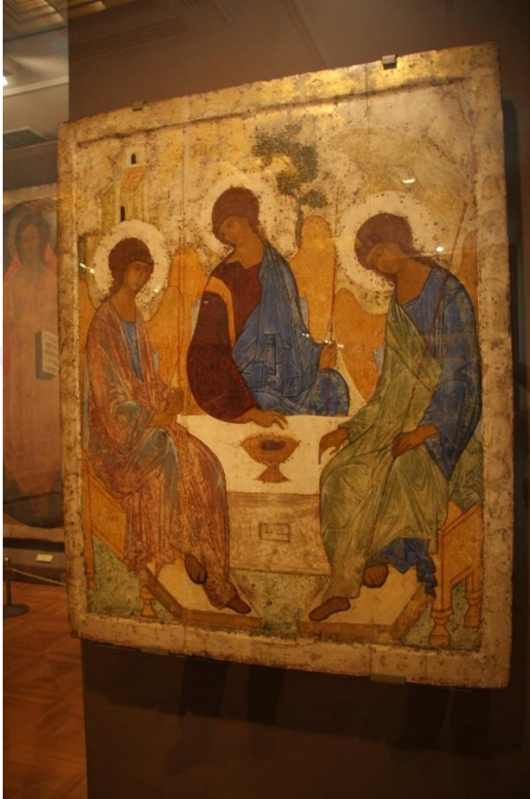
2.14.Teslis İkonası (Eriřim tarihi: 26.01.2019)

https://stevethings.wordpress.com/2012/06/17/day-28-moscow/