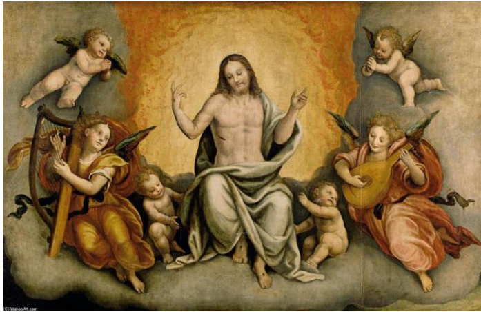
2.20.Keruvlar (Erişim tarihi : 27.07.2018)

https://www.imagenesmy.com/imagenes/greek-icon-corner-68.html