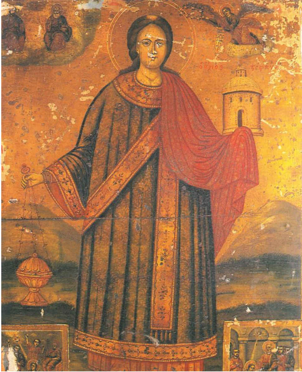
2.11. Aziz Stefanos, (Nilay Yılmaz, Ayasofya Müzesindeki İkonalar Katalođu, Kültür Bakanlıđı Yayınları, 1993, c.1., s.217.)