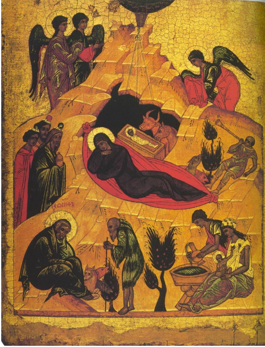
2.15.Doğum İkonası (Erişim tarihi: 26.01.2019)

https://vitajesu.wordpress.com/2009/11/05/9/