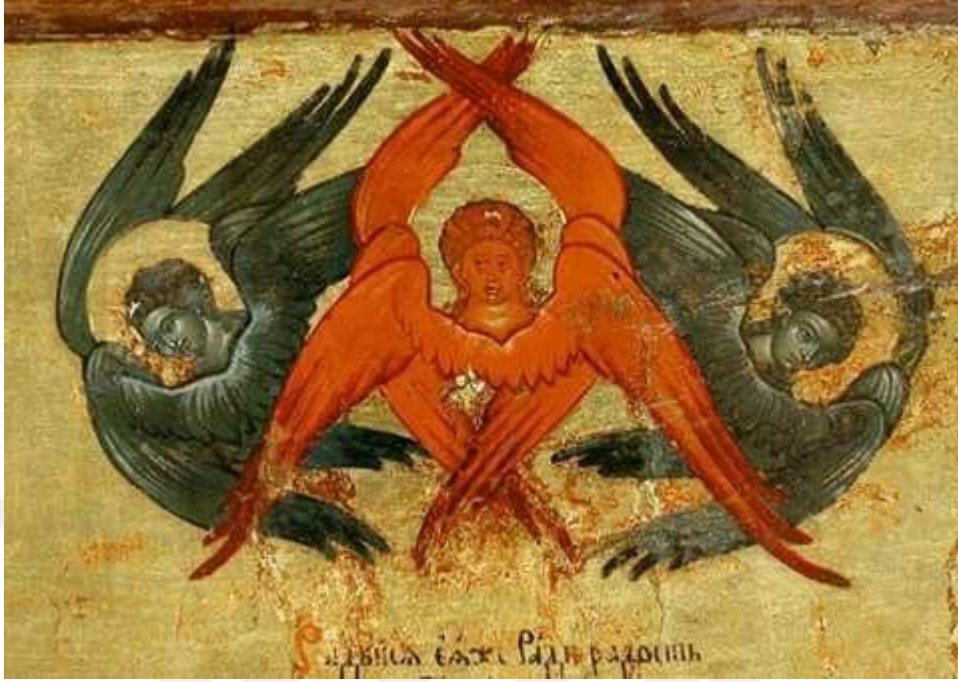
2.21.Seraphim (Eriřim tarihi : 27.07.2018)

https://i.pinimg.com/736x/63/88/7a/63887aa204f279426b22fe05905a86f1--religious-icons-seraphim.jpg