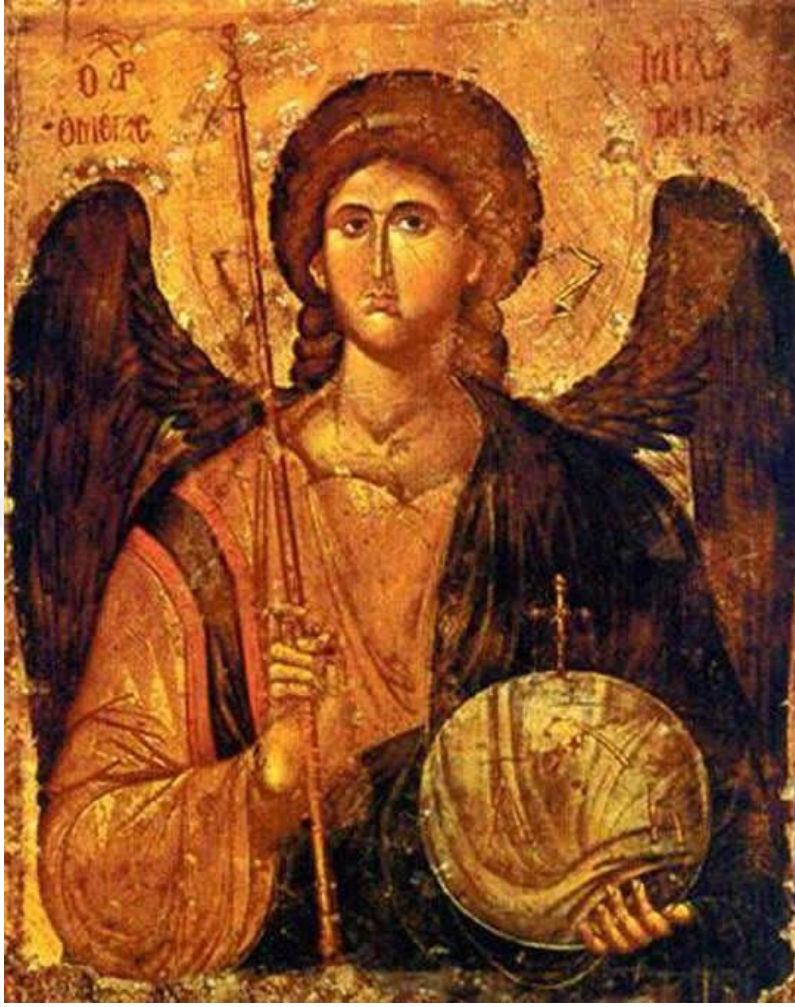
2.13.Başmelek Mikail İkonası (Erişim tarihi: 26.01.2019)

https://tr.pinterest.com/pin/1477812358679856/