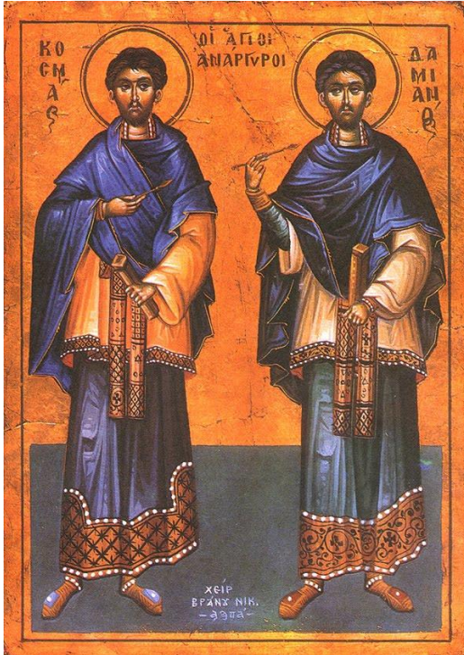
2.4. Hekim Azizler Kosmas ve Damianos İkonası (Erişim tarihi: 24.01.2019)

Virtualni Vodic Stari Grad The Old Ortodox Church- Sarajevo