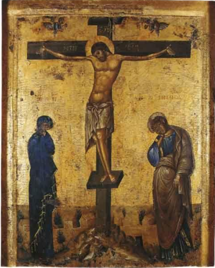
2.16.Çarmıhta İsa İkonası

https://tr.pinterest.com/pin/450782243929645567/ (erişim tarihi: 26.01.2019)