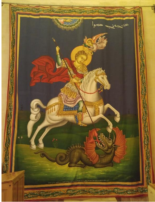
2.10. Canavarı Öldüren Aziz Georgias (23 Şubat 2018)