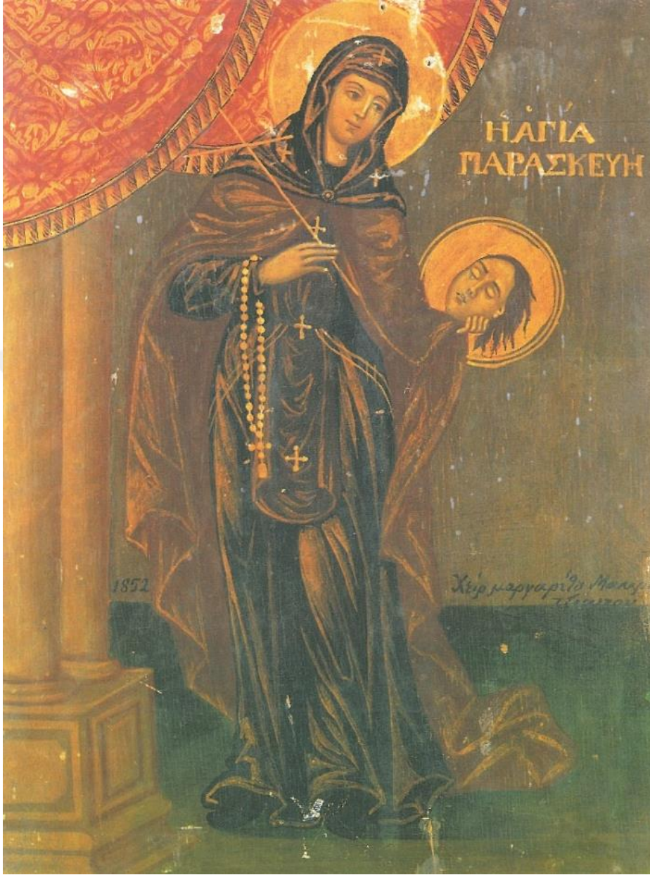
2.12. Aziz Paraskevi İkonası, (Nilay Yılmaz, Ayasofya Müzesindeki İkonalar Katalođu, Kùltür Bakanlıđı Yayınları, 1993, c. 1, s.197.)