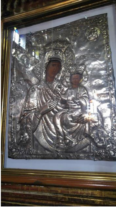
2.2. Gümüş kaplı Meryem ikonası Fener Rum Patrikhanesi (16 Mart 2018)