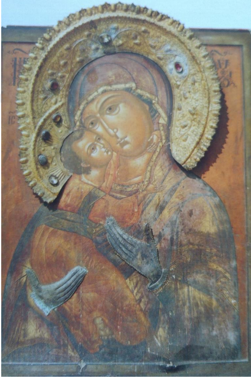
2.7. Hodigitria İkonası, (Őinasi Baőeđmez, İkonalar, Yapı Kredi Yayınları, 1989, s.27.)

https://www.the-saleroom.com/en-gb/auction-catalogues/chelsea-auction/catalogue-id-srchel10001/lot-c166047f-2f3d-4025-b4df-a44901455c8d