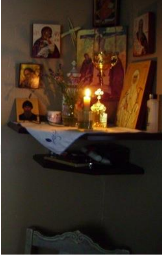
2.19.Ortodoks evi- Güzel Köşe (Erişim tarihi: 24.01.2019)

https://www.imagenesmy.com/imagenes/greek-icon-corner-68.html