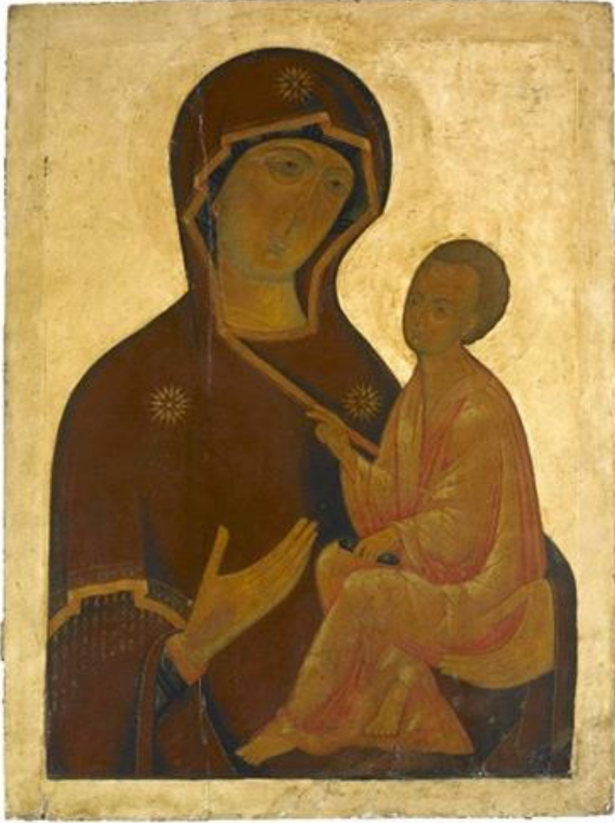
2.8. Tıçvin Meryemi İkonası (Eriřim tarihi: 24.01.2019)

https://www.britishmuseum.org/research/publications/online_research_catalogues/russian_icons/catalogue_of_russian_icons.aspx