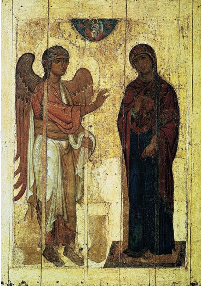
2.17.Meryem'e Haber İkonası (Eriřim tarihi: 26.01.2019)

https://www.alamy.com/stock-photo-the-annunciation-of-ustyug-icon-12th-century-state-tretyakov-gallery-22849614.html