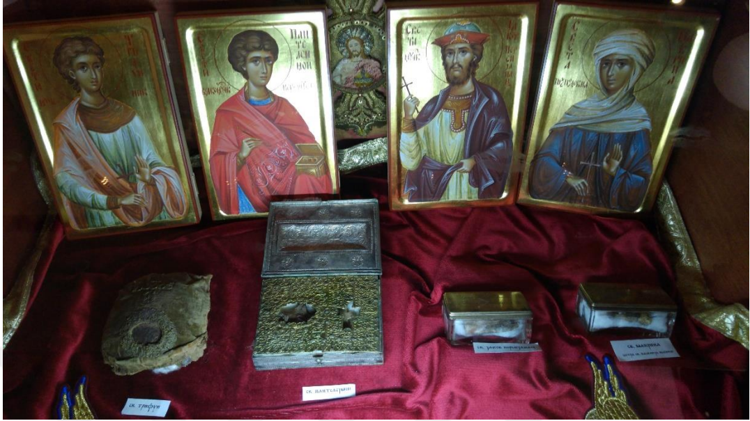
2.3. İkonalar ve rölikler (19 Temmuz 2016)

Virtualni Vodic Stari Grad The Old Ortodox Church- Sarajevo