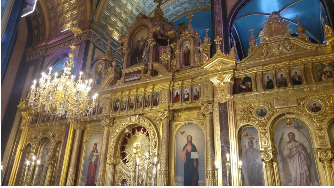
2.1. İkonastasis örneđi Sveti Stefan Bulgar Kilisesi (16 Mart 2018)