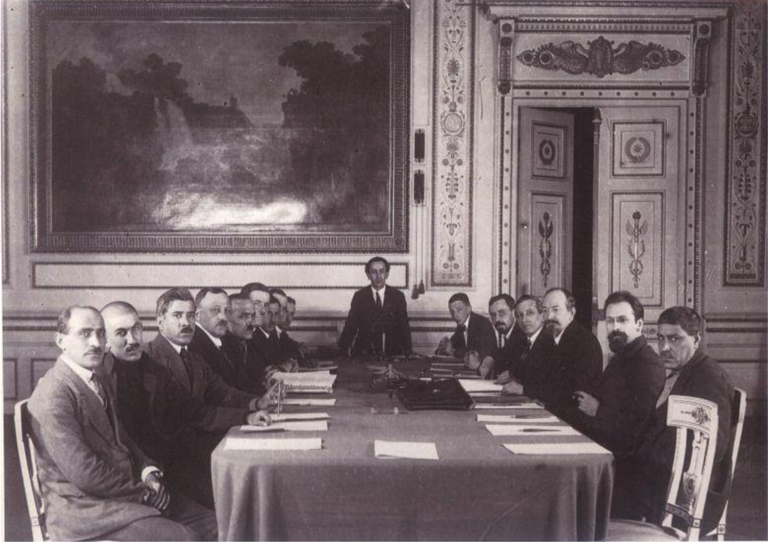
Dr. Rıza Nur Bey, Yusuf Kemal Bey, Ali Fuat Paşa, Georgi Çiçerin ve Celalettin Asildaroğlu Korkmazov, Moskova Müzakereleri Sırasında