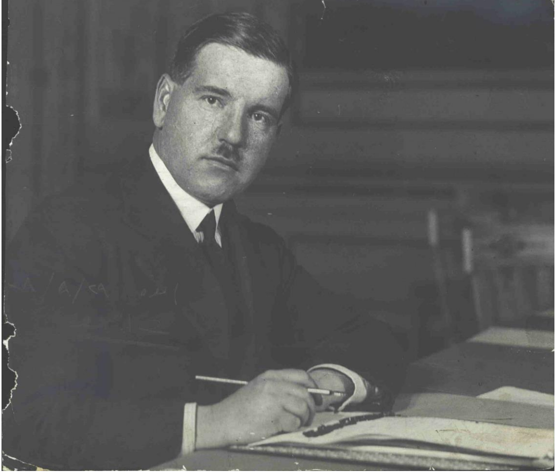
Moskova Sefiri Ali Fuat Paşa