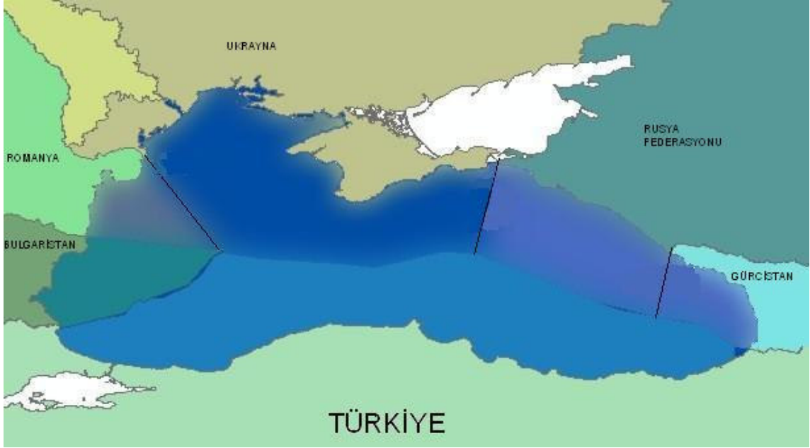
Şekil 2. Karadeniz deniz sınırları.

Karadeniz; Rusya hariç, Bulgaristan, Romanya, Ukrayna, Moldova ve Gürcistan'ın denizlere açılmasını sağlayan tek deniz yolu olması bakımından büyük ekonomik öneme sahiptir