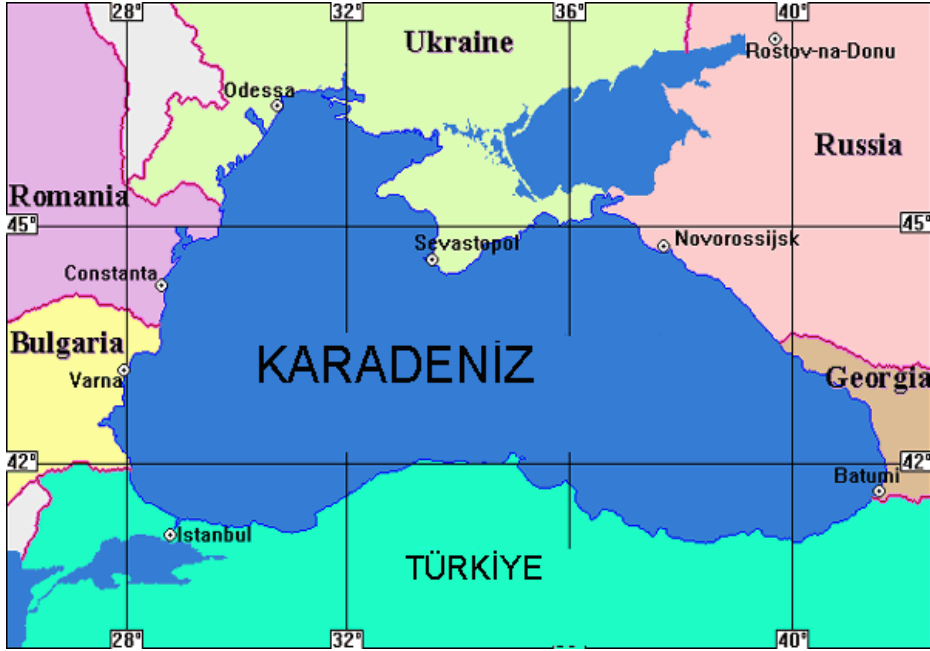
Şekil 1. Karadeniz ve Bölgesinin haritası

Karadeniz, Türk Boğazları ve Marmara Denizi ile Ege Denizi ve de Akdeniz'e, Kerç Boğazı ile Azak Denizi'ne, Ren-Tuna Kanalı ile Kuzey Denizi'ne, Main-Tuna