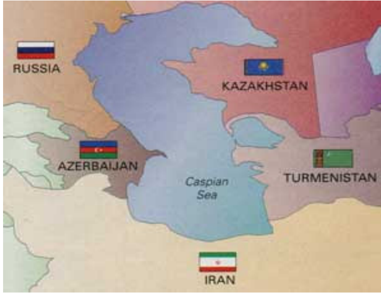
Şekil 7. Hazar Denizi Kıyıdaş Ülkeleri (www.yapiworld.com).

Hazar Denizi'nin Sovyetler Birliğine ait kısmı, İran'ın Azerbaycan ve Türkmenistan ile olan sınırlarının Hazar Denizi'nde kesiştiği noktaları arasında çizilen hattın kuzeyinde kalan alandır. Bu hattın güneyinde kalan saha ise İran'ın siyasi etkisi altındadır. Hazar Denizinin kıyıdaş ülkeleri şekil 6.'da gösterilmiştir.