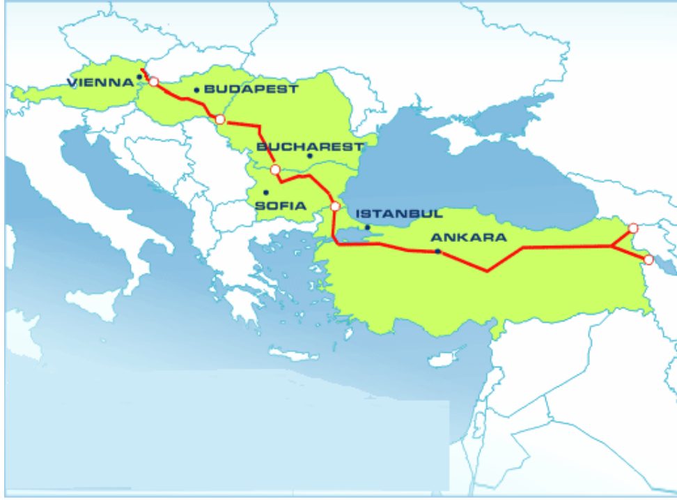
Şekil 5. Nabucco Projesi (www.nabucco.org)