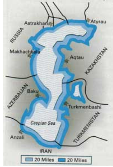
Şekil 9. Deniz Bölüşümü