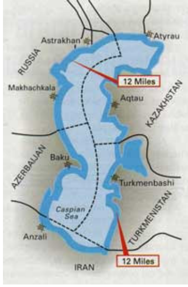
Şekil 8 Göl Bölüşümü.