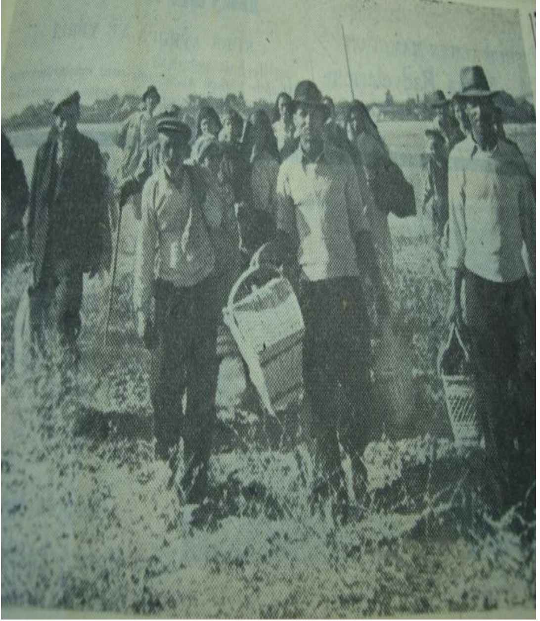
Ulus, Sayı:10602 (31 Aralık 1950), s. 1