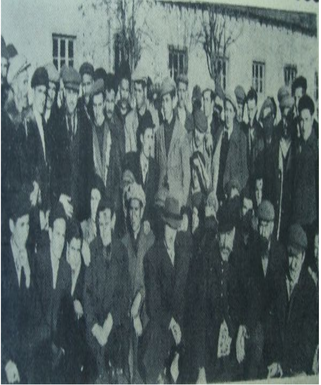
Ulus, Sayı:10441 (8 Őubat 1951), s. 1.