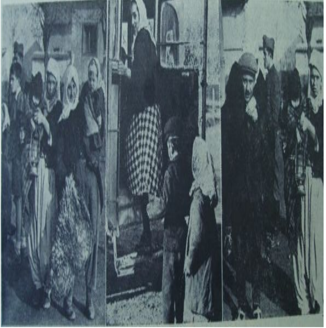
Ulus, Sayı:10409 (7 Ocak 1951), s. 1.