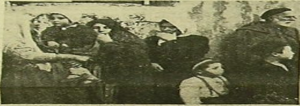
Misafirhanedeki göçmenlerden bir grup