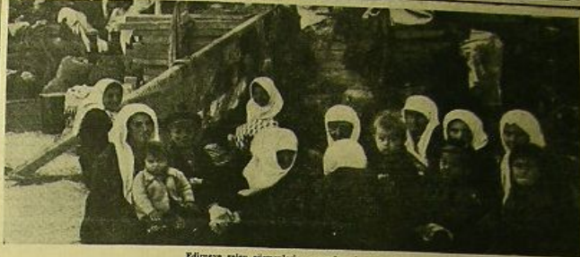
Edirneye gelen göçmenlerin yaşayışlarından bir sahne

çiler tarafından karpınması ve bu işlerden en 22 bin kişi Cumhuriyet Bakanlarını elini oynadı tır. Bundan sonra Uzunmehmet tevelerini ayı- rarak edem mişlerdir, buradaki kuru meşalede İngiliz firması temsilcilerinden teahat almışlar- dır. Cumhuriyet Başkanı, Kömürün arzularını da yurdun göçmenleri için nebrü oğrancı ve bir ka- vehanda etrafında geçiren benlerce Kömürle de kasa bir hashahide bulmuşlardır. Buradan — Arkân Sa. 7. Sü. 2 de-