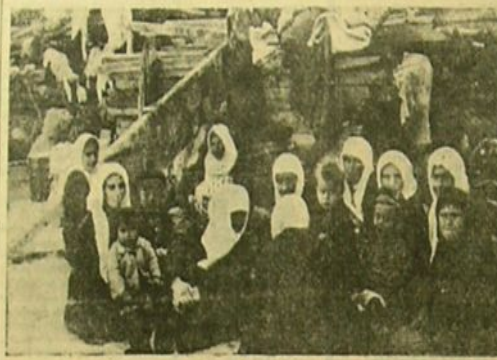
Bulgaristan'dan gelen bir muhacir kabileci Edirne misafirhanesinin avlusunda