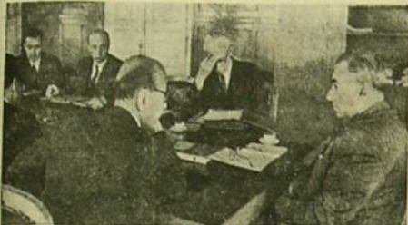
Göçmenlere Yardım Türkiye Millî Komitesi dünkü toplantısında

Bulgarlar bizim göçmenleri iskânda müşkülata uğra- madığımızı görünce planlarını değiştirdiler, şimdi muhaçereti menetmeyi düşünüyorlar