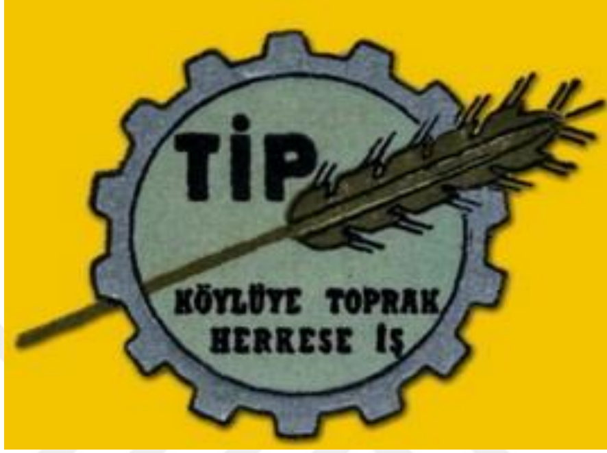
Partinin İlk Amblemi