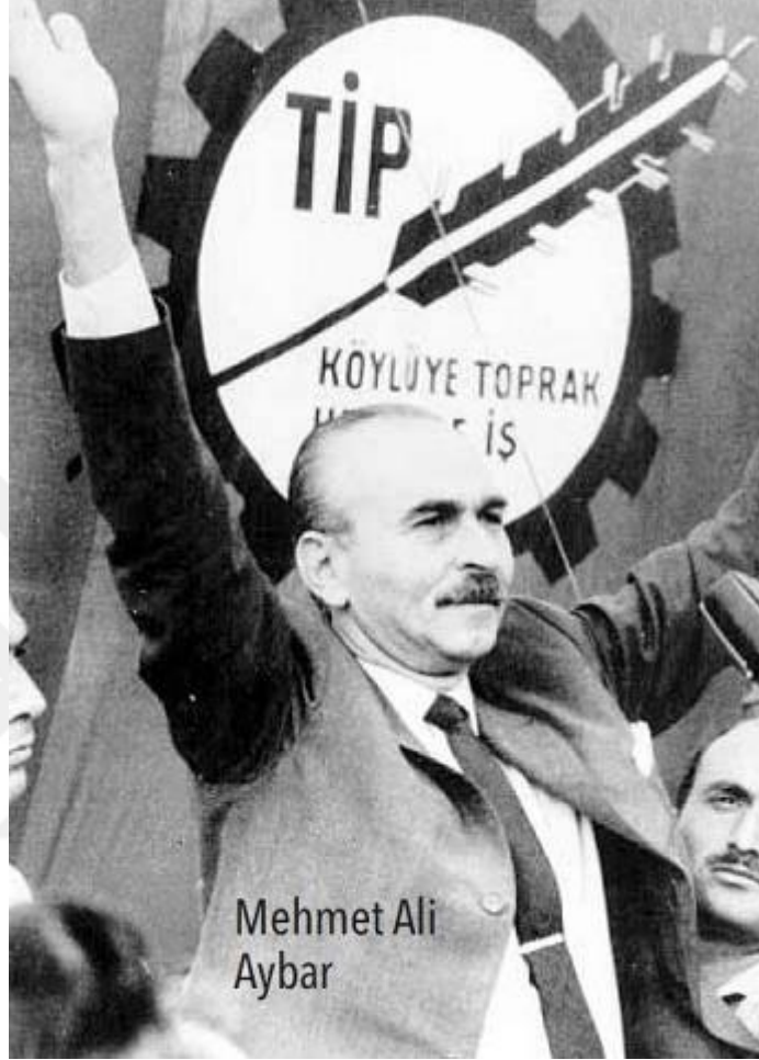
Mehmet Ali Aybar