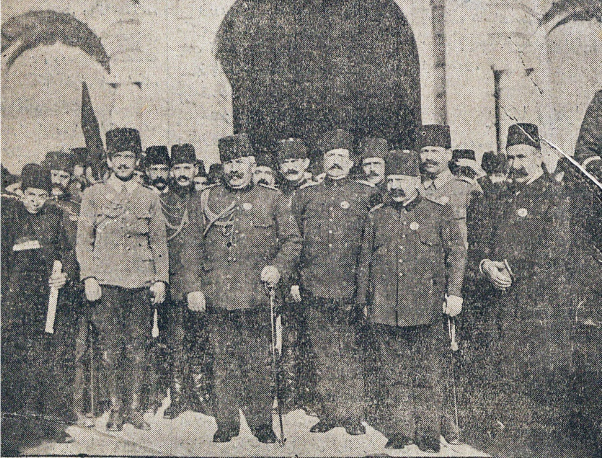
EK- 8. Darülfünun Öğrencilerine Harbiye Nezareti Önünde, İzzet Paşa Konuşma Yaparken, İkdam , 31 Kânun-ı evvel 1914, s. 1.