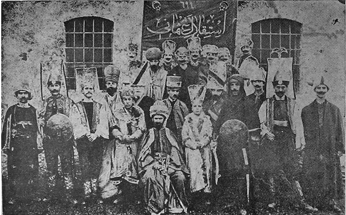
EK- 16. İstiklâl-i Osmânî yıl Dönümünü Kutlamak İçin Eskişehir’de Millî Kıyafetlerle 1333 Senesindeki Tezâhürât, Genç Osmanlı Dernekleri, 1 Kânun-ı sâni 1336, Sene: 2, S. 20, s. 1.