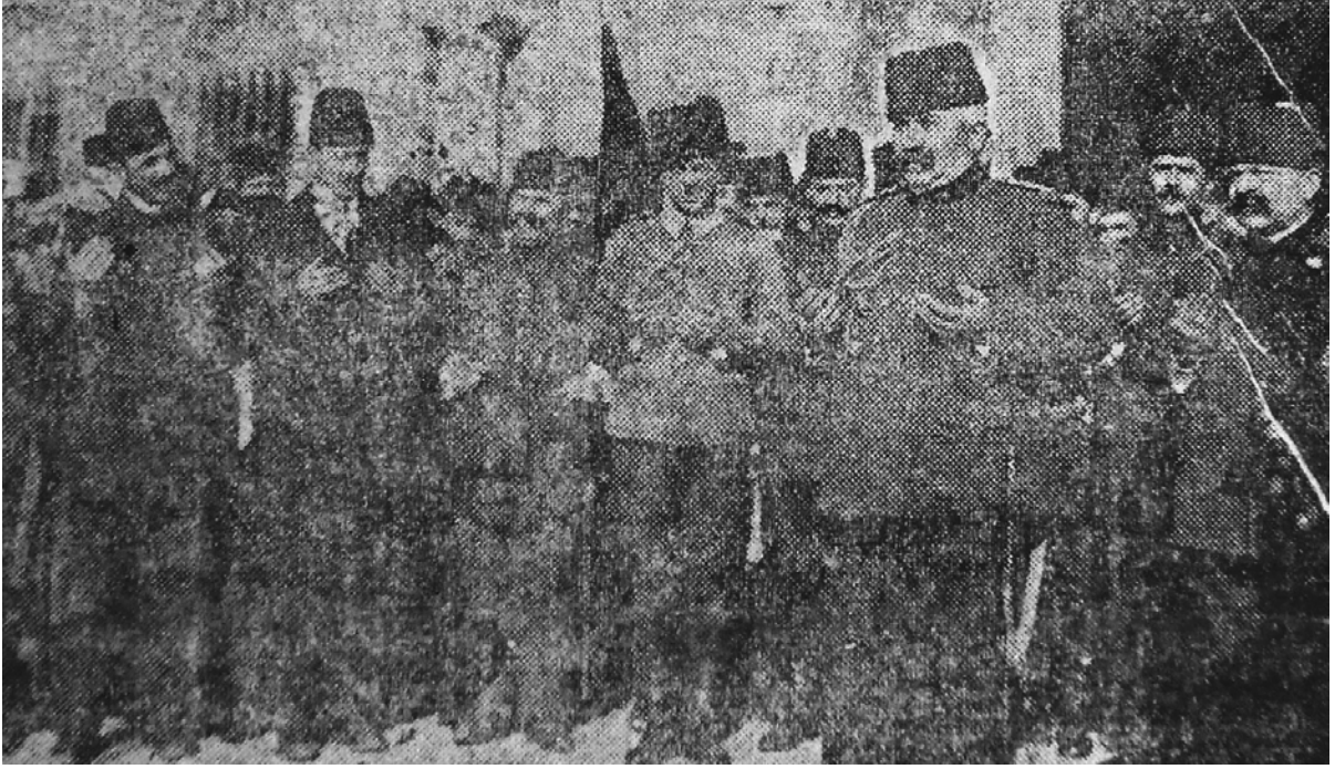
EK-4. Harbiye Nazırını İzzet Paşa, İstiklâl-i Osmânî Bayramı Tertip Heyeti ile birlikte Harbiye Nezareti Önünde Dua Ederlerken, Tasvir-i Efkâr , 31 Kânun-ı evvel 1913, s. 1.