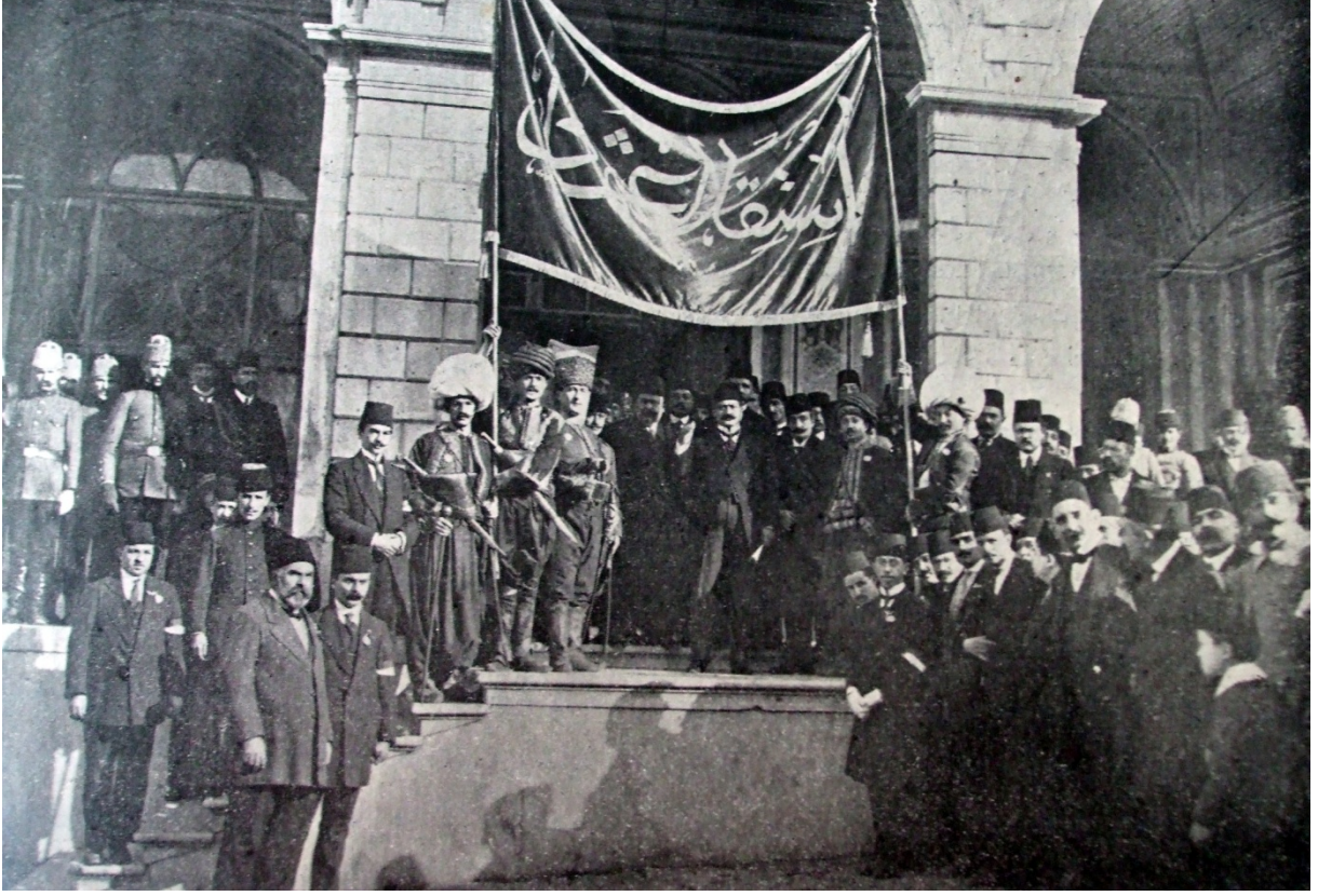
EK-1. Talat Paşa, Bâb-ı Âlî’de İstiklâl-i Osmânî Bayramı dolayısıyla konuşma yaparken, Servet-i Fünun , Kânun-ı evvel 1913, s. 196.