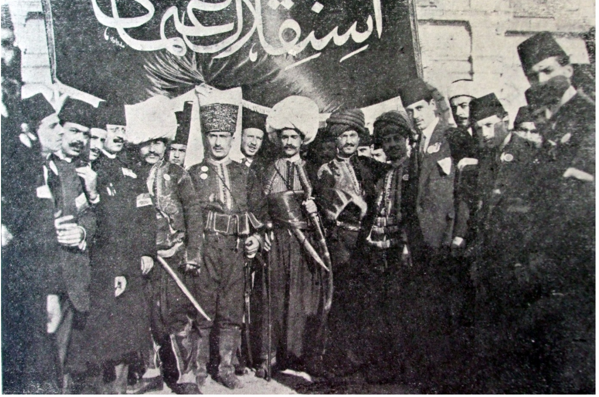
EK- 2. “ İstiklâl-i Osmânî Merasimi- Darülfünun Talebesi Eski Kıyafetlerle, Harbiye Nezareti Önünde, Servet-i Fünun 26 Kânun-ı evvel 1913, s. 197.