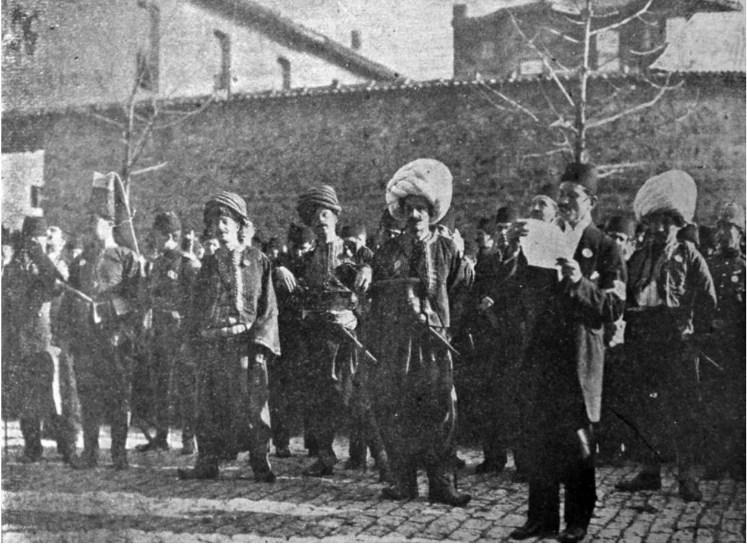
EK- 3. “ İstiklâl-i Osmânî Merasimi- Darülfünun Talebesi Eski Kıyafetlerle, Şehremaneti Önünde, Servet-i Fünun , 26 Kânun-ı evvel 1913, s. 197.