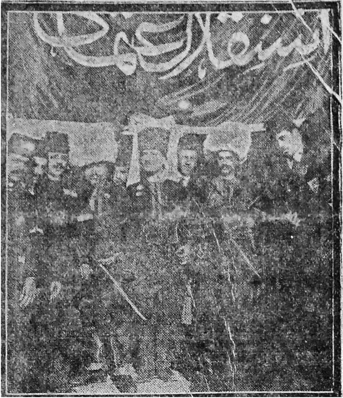
EK- 6. Bayram Heyeti'nin Bayraklarıyla Alınan Resimleri, Tasvir-i Efkar , 31 Kânun-ı evvel 1913, s. 1.