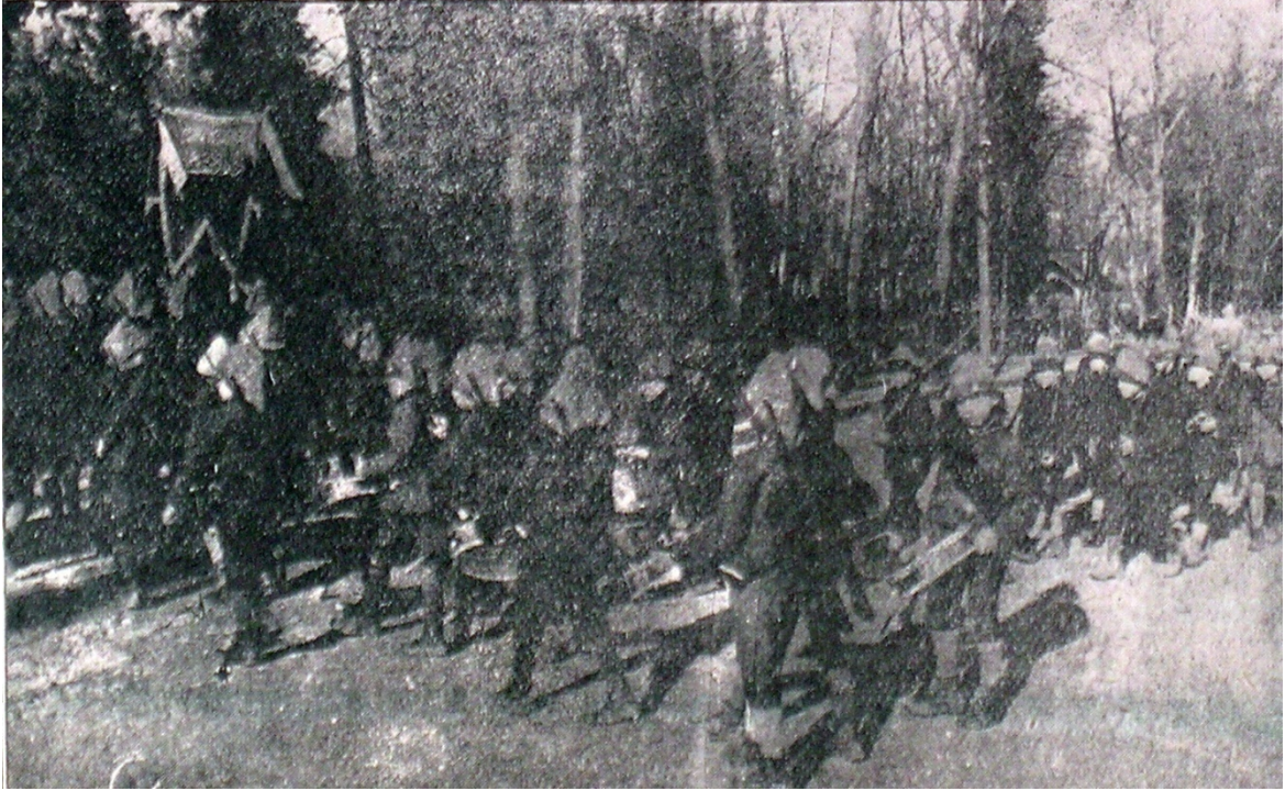
EK- 14. Donanma Mecmuası, 29 Kânun-ı evvel 1915, s. 1200