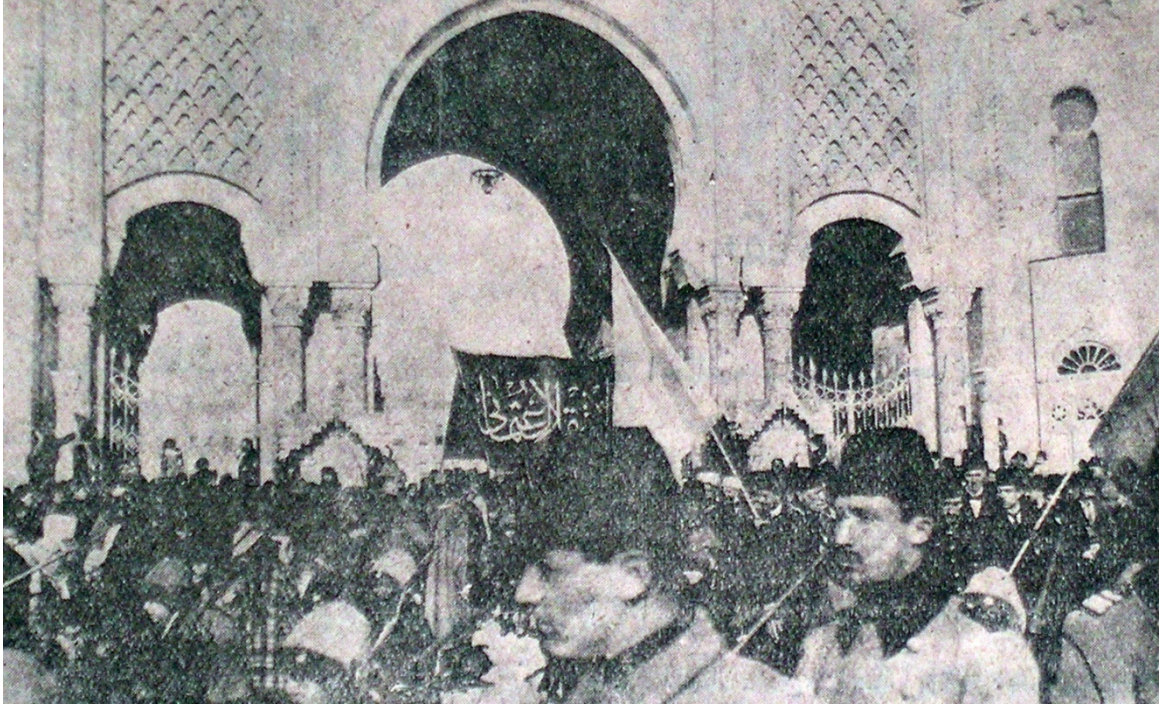
EK- 13. Donanma Mecmuası, 29 Kânun-ı evvel 1915, s. 1201.