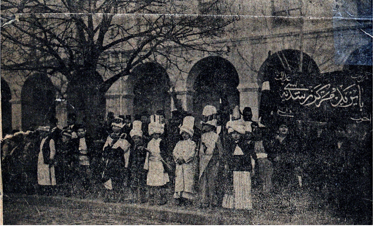
EK- 9. İstiklâl-i Osmânî Bayramı'nda Bayezit Merkez Rüşdiyesi Öğrencileri, Darülfünunluları selamlarken, İkdam , 31 Kânun-ı evvel 1914, s. 1.