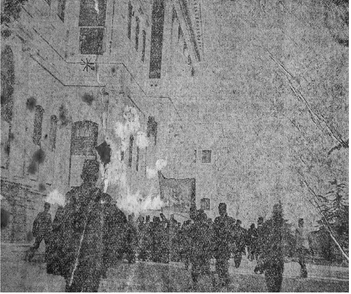
EK- 7. Bayram Heyeti Saray-ı Hümayun'da Bayram Tebrikâtında Bulunurken, Tasvir-i Efkâr , 1 Kânun-ı sâni 1913, s. 1.