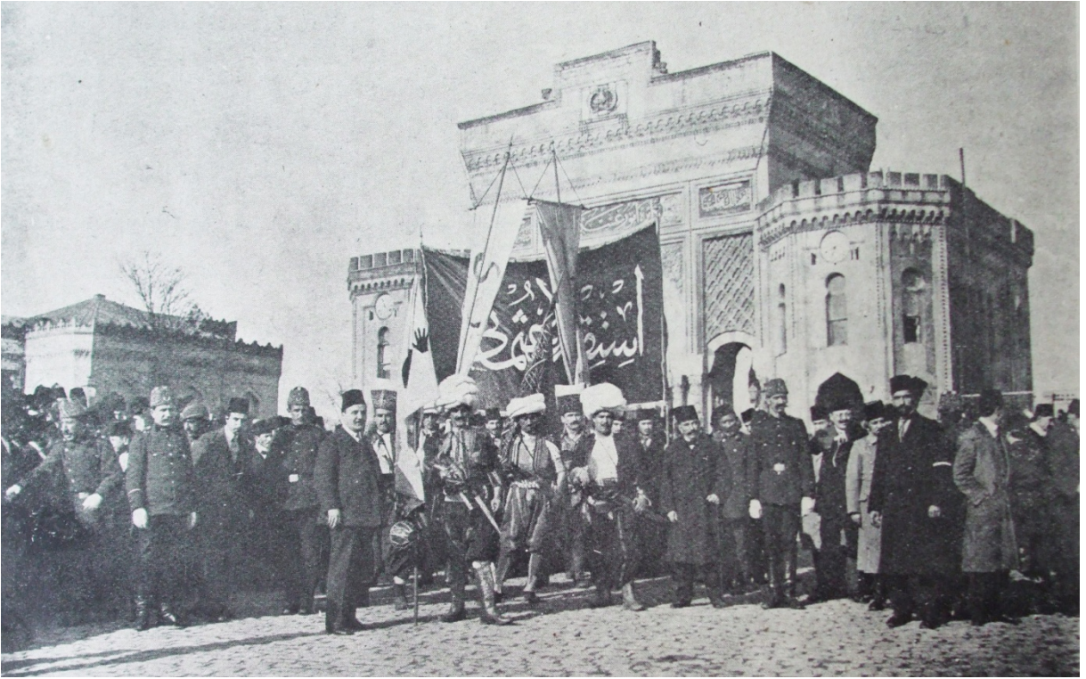
EK- 10. İstiklâl-i Osmânî Dolayısıyla Hazırlanan Bayram Kutlamaları Sırasında Bayram Alayının Harbiye Nezareti'nden Çıkışı, Servet-i Fünun , 28 Kânun-ı evvel 1330, s. 1.