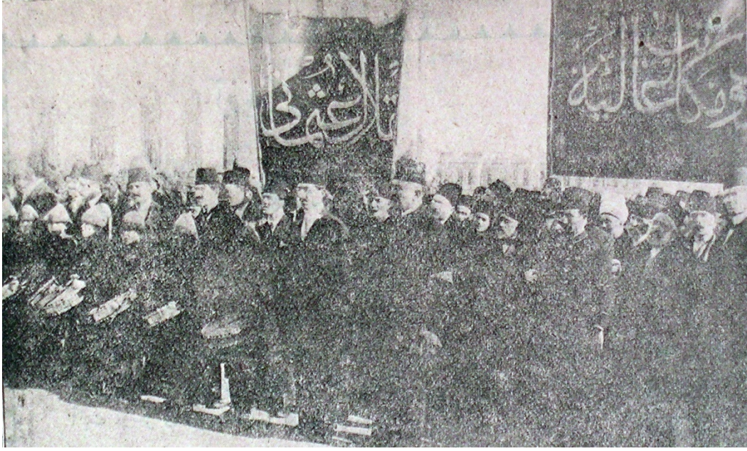
EK-11. Donanma Mecmuası, 29 Kânun-ı evvel 1915, s. 1200.