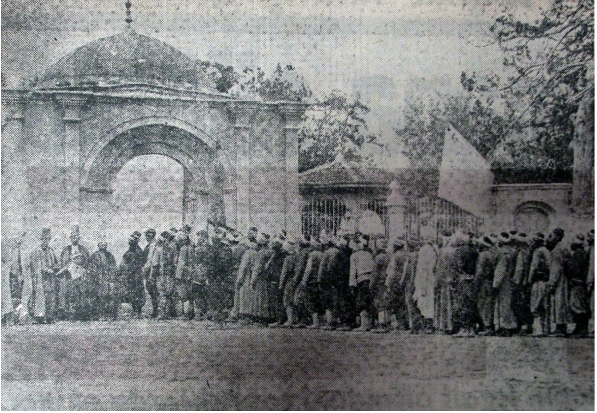
EK- 17. Osmanlı Millî İstiklâl Bayramı'nı Eskişehir'de Büyük Törenlerle Kutlayan Kara Keçeli Aşireti Mensupları, Bundan Önceki Yıllarda Söğüt'te Sultan Osman'ın Babası Ertuğrul Gazi'nin Türbesi'ni Ziyaret Ederken, İstiklâl Harbi Gazetesi , 31 Kânun-ı evvel 1919, s. 2.