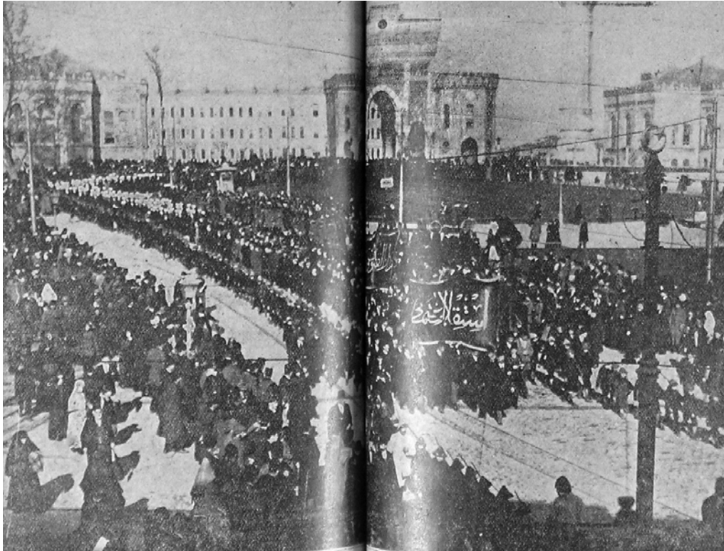
EK- 12. Donanma Mecmuası, 29 Kânun-ı evvel 1915, s. 1200-1201.