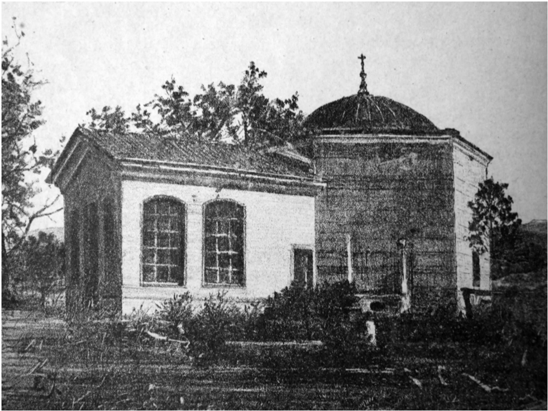
EK- 5. Ertuğrul Gazi'nin Söğüt Kasabası Civarındaki Türbesi, Servet-i Fünun 26 Kânun-ı evvel 1913, s. 209.