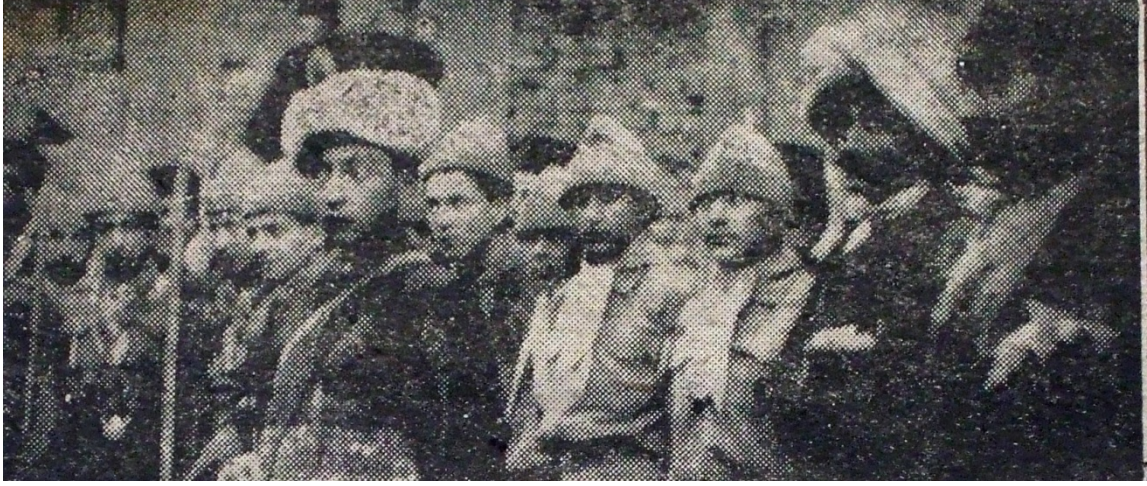
EK- 19. Mahmut Şevket Paşa Merhum Numune Mektebi'nde Yapılan Bayram İntibaatından Galatasaray İzcileriyle Yeniçeri Kıyafetindeki Gençler, Tevhid-i Efkâr , 31 Kânun-ı evvel 1921, s. 1.