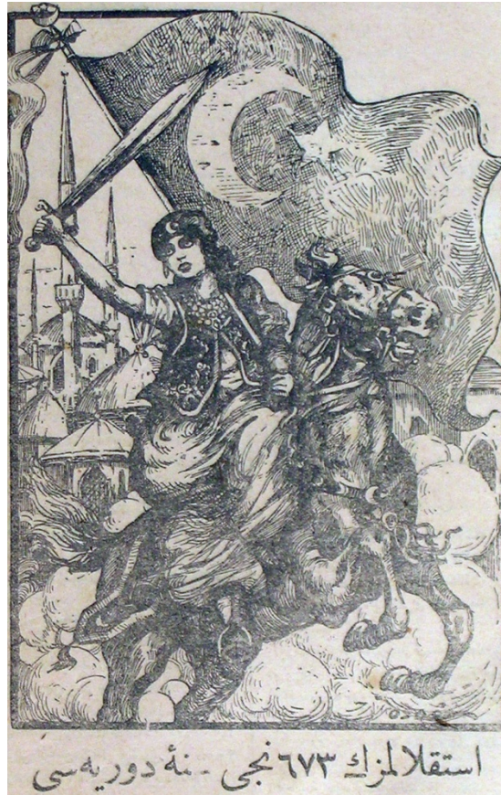
EK- 20. “ İstiklâlimizin 673. Sene-i Devriyesi ”, Akşam , 30 Kânun-ı evvel 1921, s. 1.