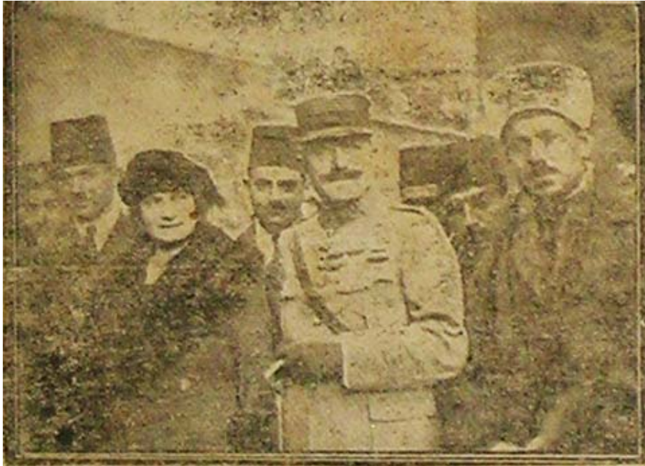
EK- 18. Bayrama Katılanlardan Fransız Bir Zabıt İle Gençlerden Bir Grup, İleri , 31 Kânun-ı evvel 1921, s. 1.