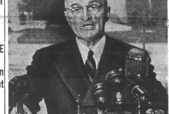
President Truman addressing Congress yesterday