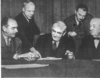
Left to right—Seated: Acting Secretary of State Dean Acheson, Senator Arthur Vandenberg and Senator Tom Connally. Standing: Secretary of War Robert Patterson and Secretary of the Navy James Forrestal. The conference was held in the Capitol yesterday.

STUDY PROPOSAL FOR AID TO GREECE AND TURKEY