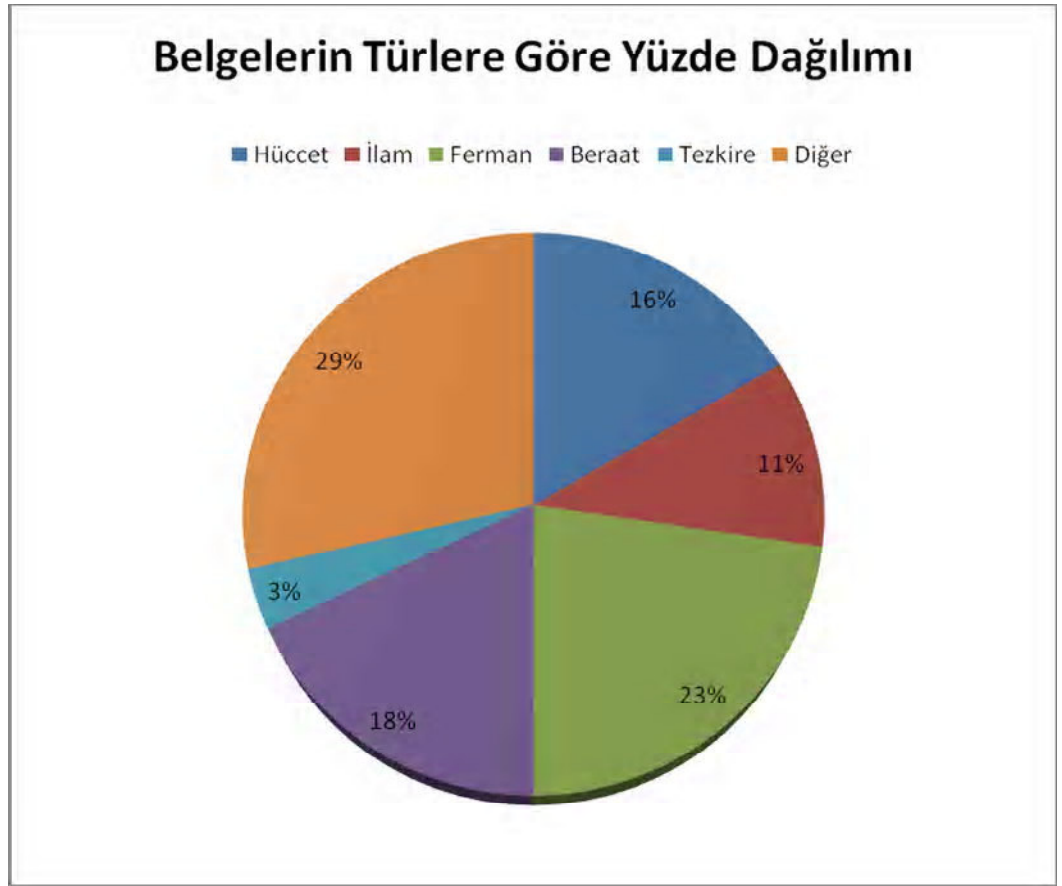
Şekil: 1.2. Tez İçinde Yer Alan Belgelerin Türlerine Göre Dağılımı ve Yüzdesi