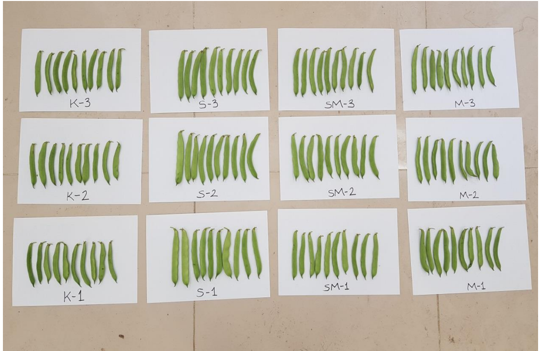
Şekil 3.4 Fasulye numunelerine ait görsel

Baklalar ikiye ayrılarak tohumlar çıkartılmış ve adetleri belirlenmiştir.