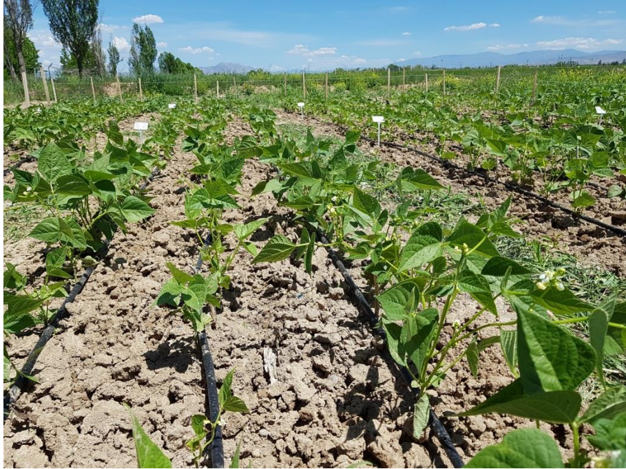
Şekil 3.1 Fasulye parseline ait görsel

Fasulyede, yetiştiricilik sezonu boyunca toplam 7 defa hasat yapılmıştır. İlk hasat, 05.06.2018 tarihinde son hasat ise 25.07.2018 tarihinde yapılmıştır. Soğanda ise hasat tek seferde ve 07.06.2018 tarihinde yapılmıştır. Yetiştiricilik dönemi boyunca kültürel işlemler gerektiği sürede ve şekilde yapılmıştır.