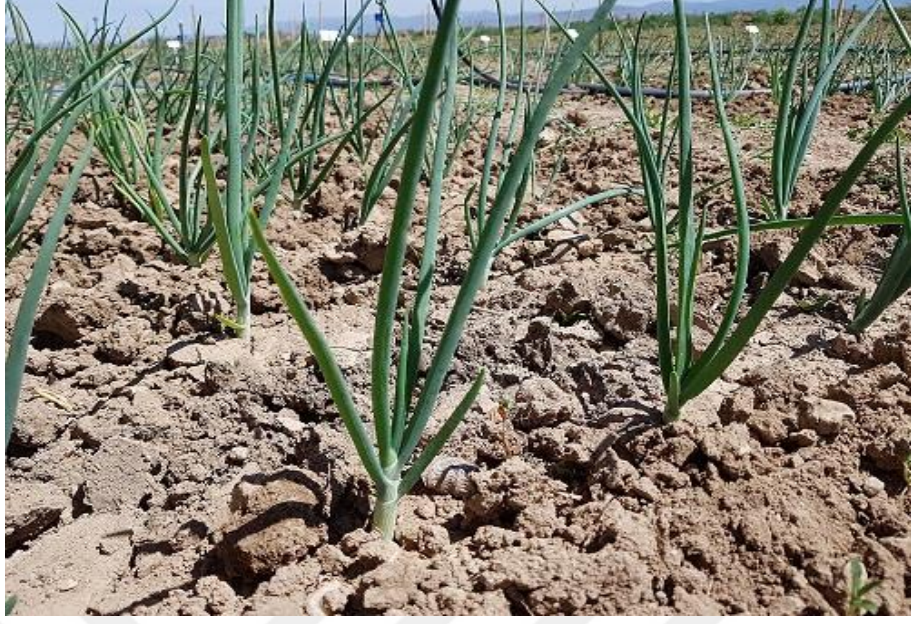
Şekil 3.2 Soğan parseline ait görsel