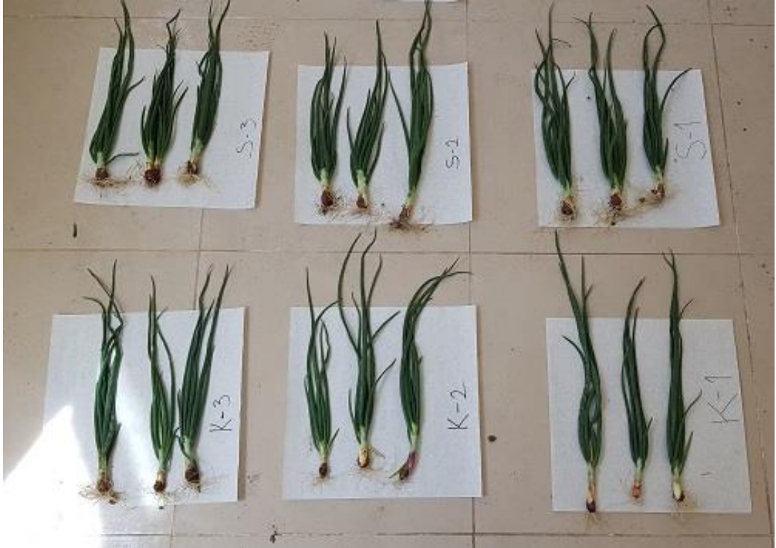
Şekil 3.3 Soğan numunelerine ait görsel

Araziden sökülen bitkilerin, kök kısımları kesilerek bir şerit metre yardımı ile uzunlukları belirlenmiştir.